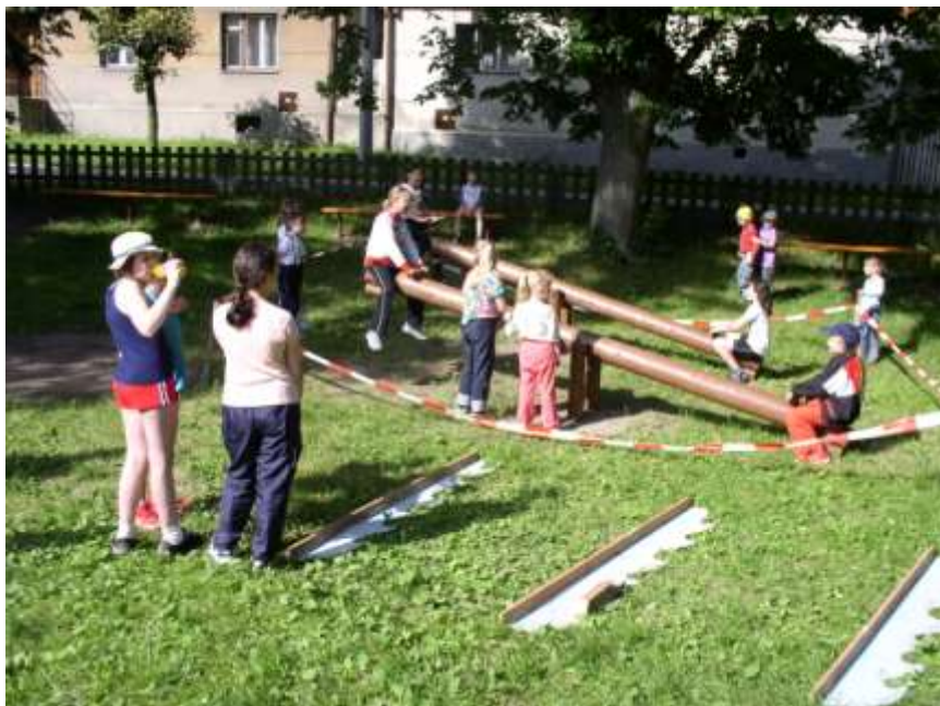
49. Dětské houpačky Pod Hrázkou