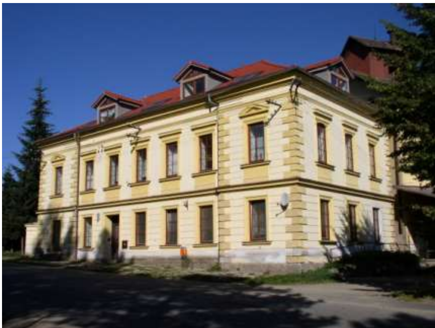
27. Dům čp. 105