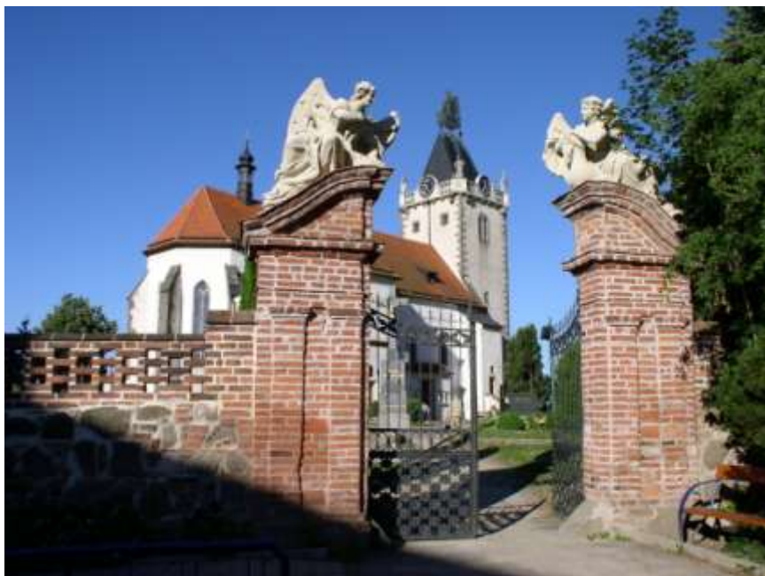
12. Brána na hřbitov