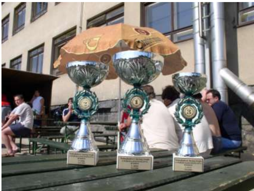
22. Poháry obecního zastupitelstva