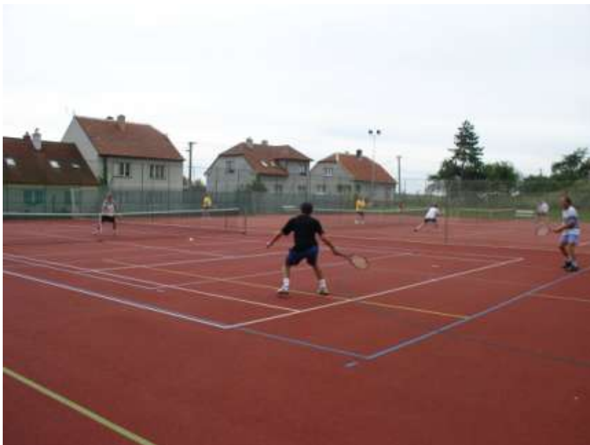
23. Turnaj v tenisu