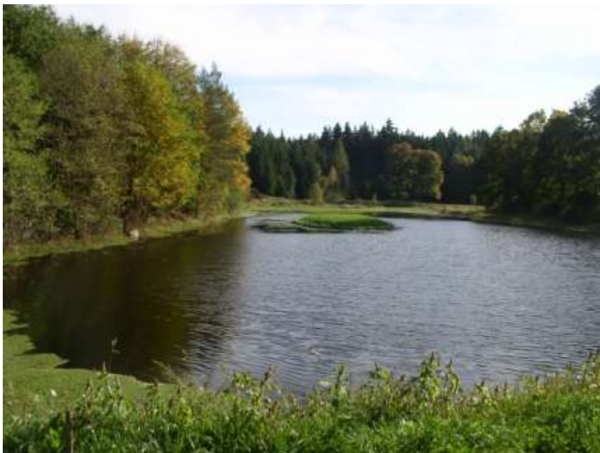
7. Rybník Motous