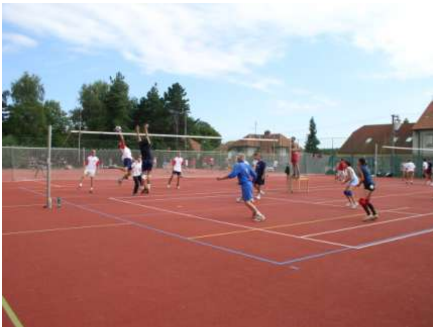
24. Turnaj ve voleybalu