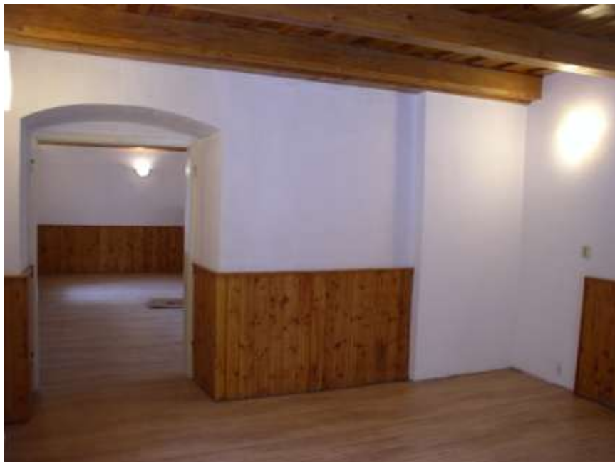
29. Budoucí golfový klub