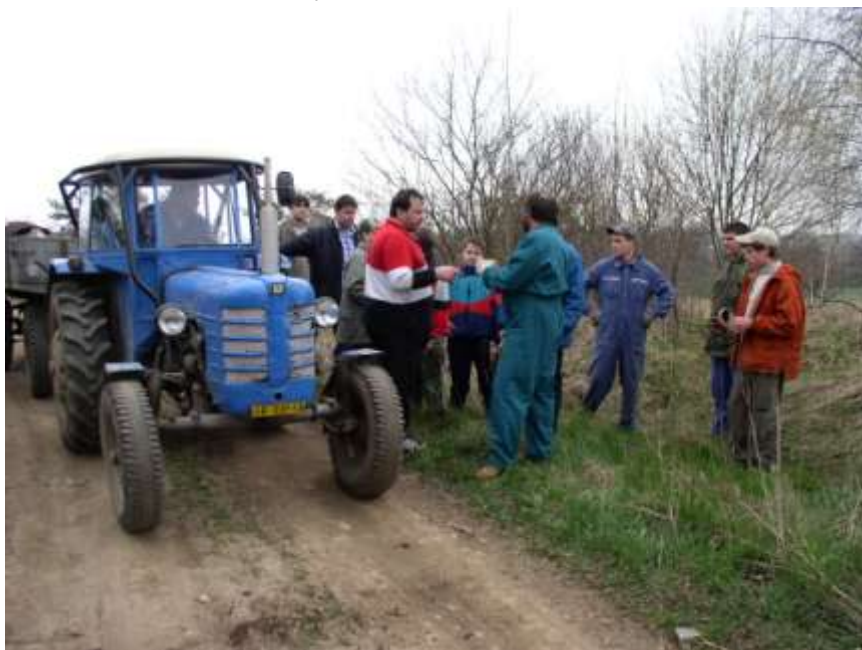
54. Skautská brigáda na úklidu okolí obce