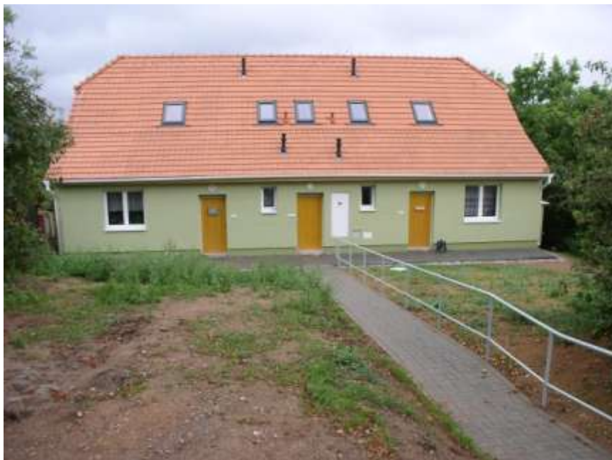
26. Přestavba obecního domu – pohled ze severu