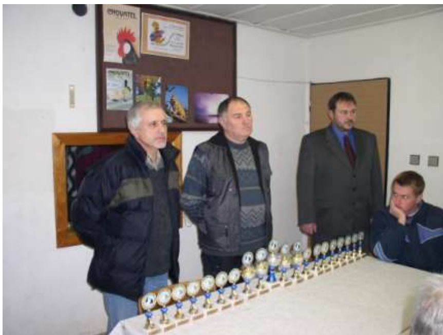
53. Výstava chovatelů v Budišově