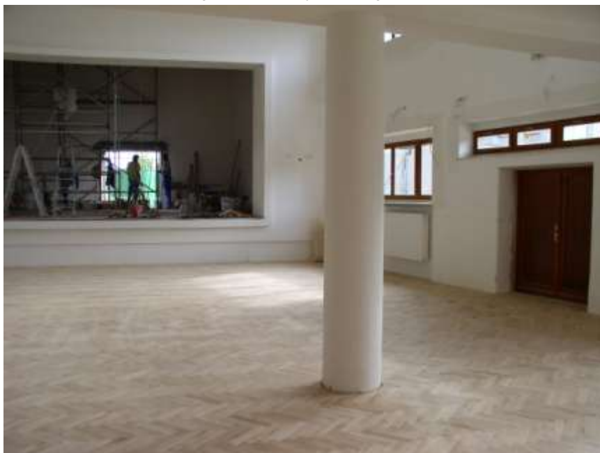
38. Kulturní sál v základní škole