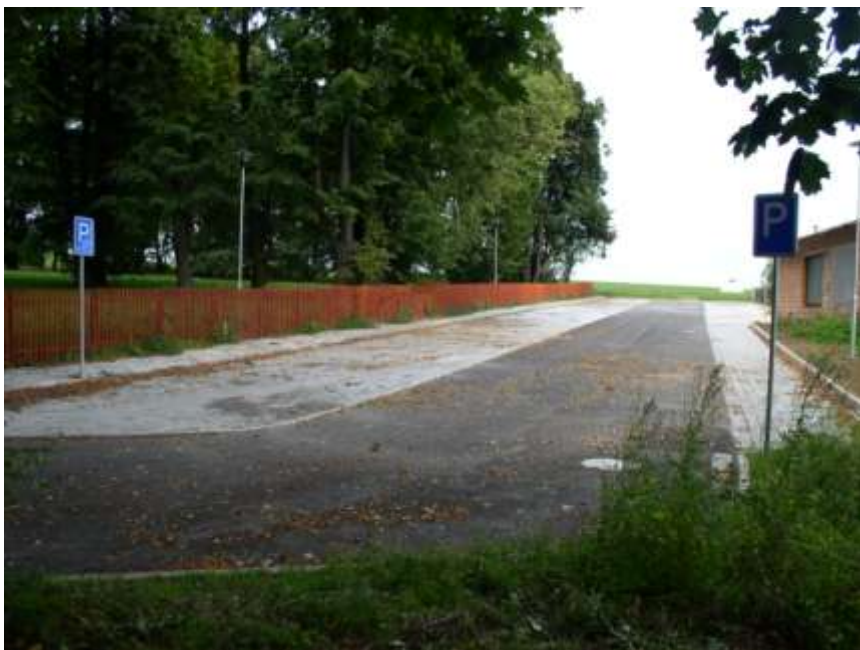
6. Parkoviště u zámku