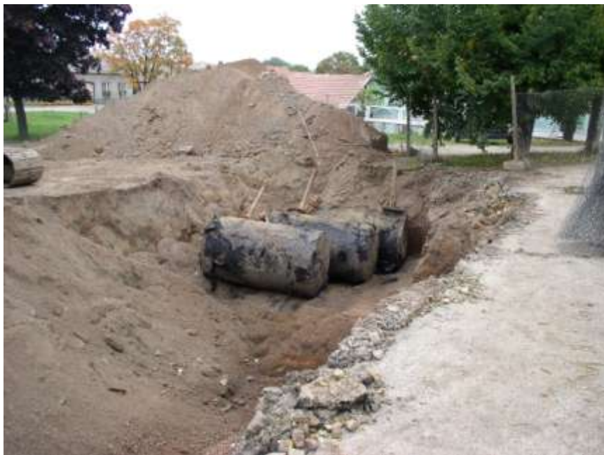
33. Vyzvednutí nádrží pohonných hmot