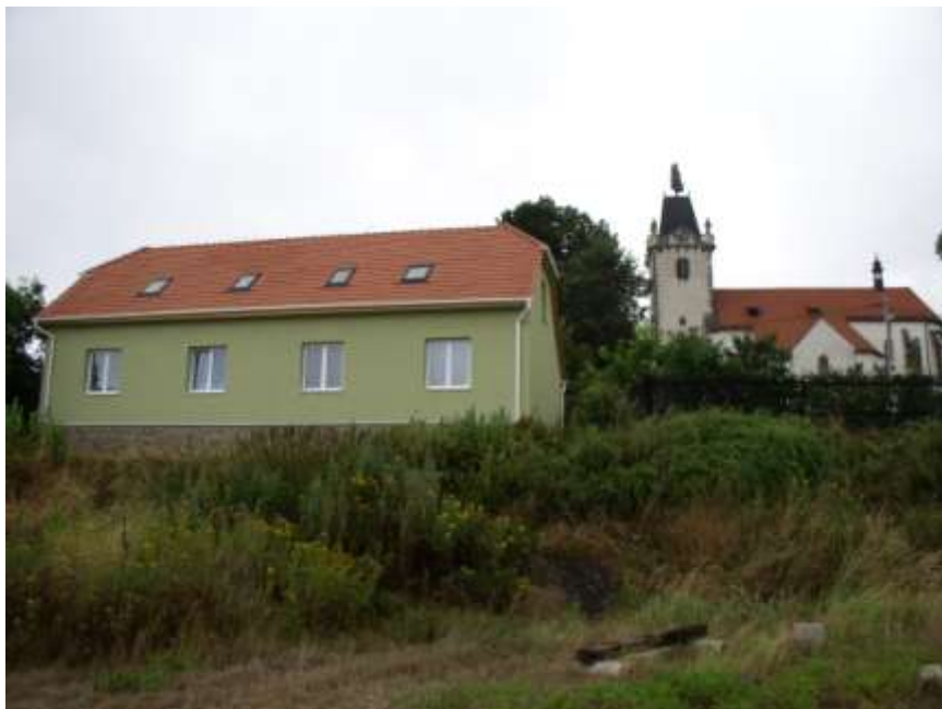
25. Přestavba obecního domu – pohled z jihu