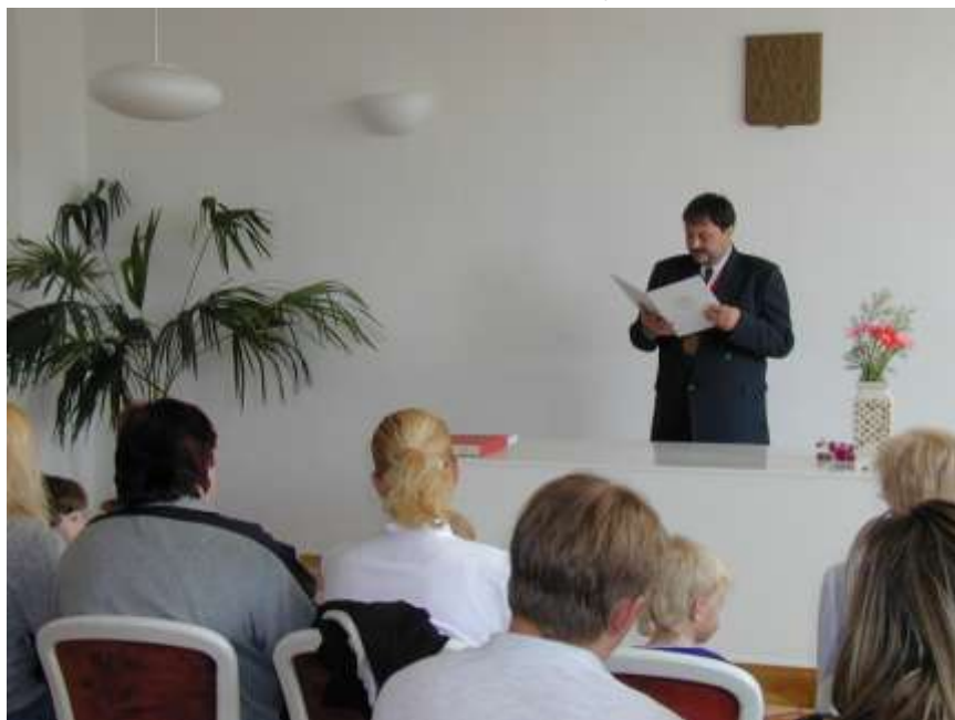
46. Obnovení tradice vítání občánků