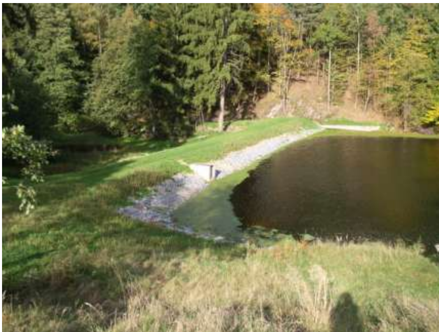
8. Hráz rybníka Motous