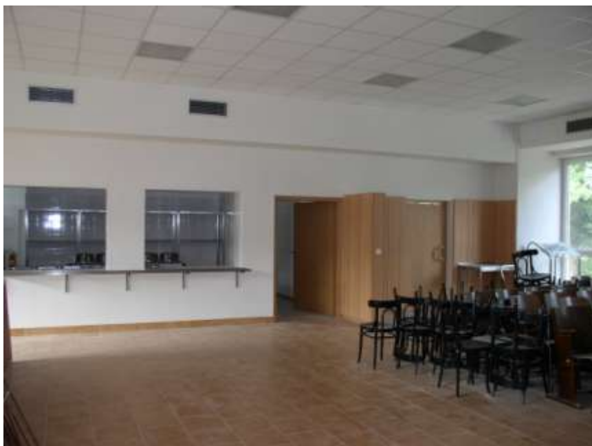
19. Školní jídelna