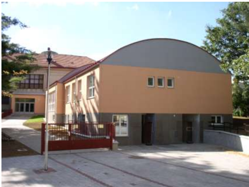
17. Přístavba školní kuchyně