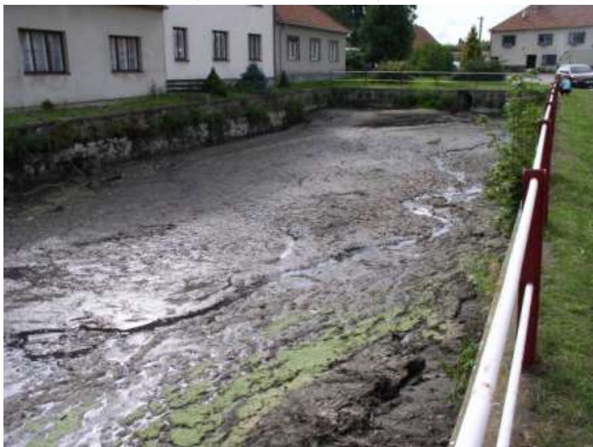
34. Vypuštěný Pekařák