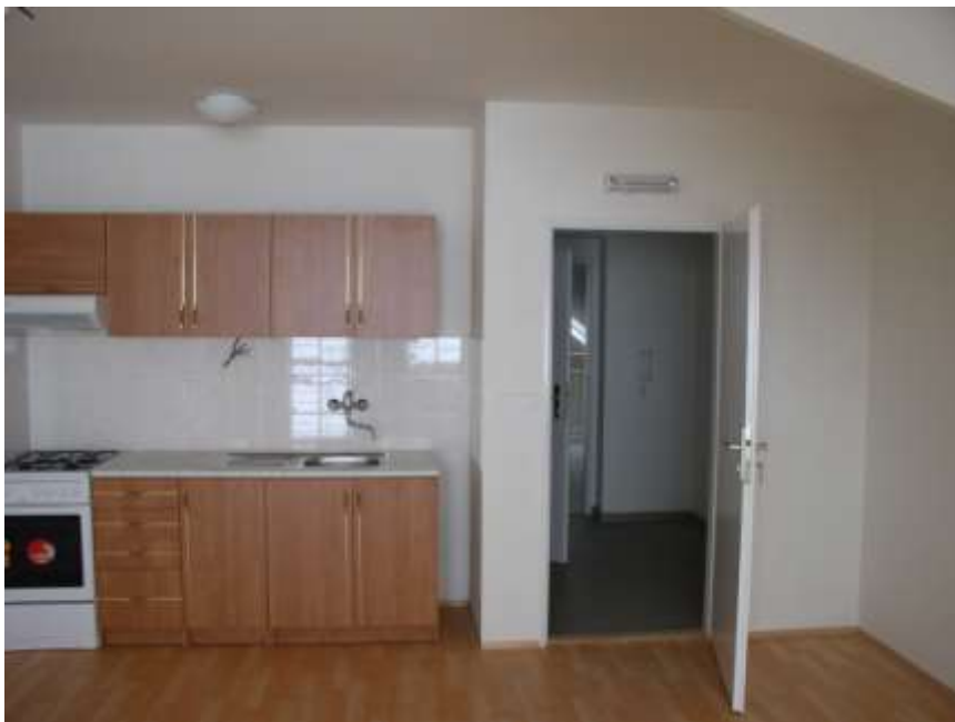
16. Interiér domu s pečovatelskou službou