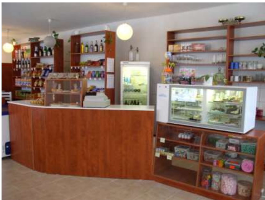
1. Cukrárna Budišov