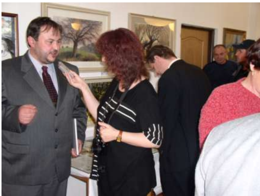
41. Výstava Otakara Štembery