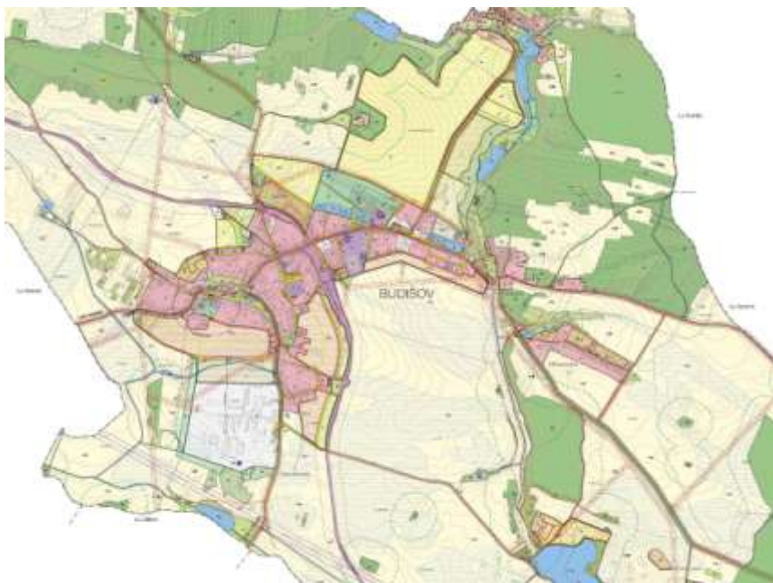
5. Ukázka konceptu územního plánu obce Budišov