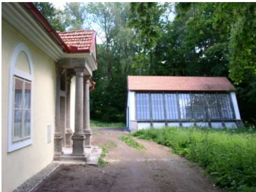
30. Budoucí občerstvení