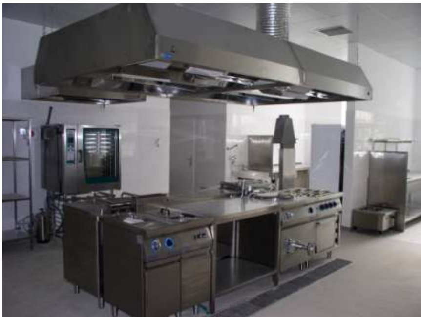
18. Školní kuchyň