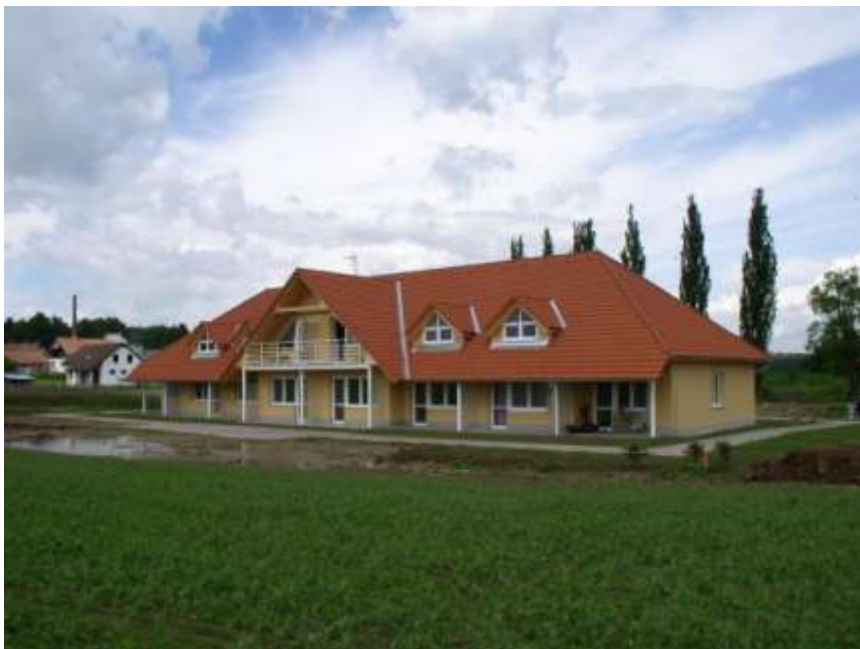
15. Dům s pečovatelskou službou