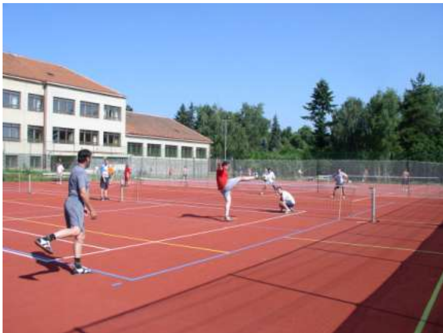
21. Turnaj v nohejbale