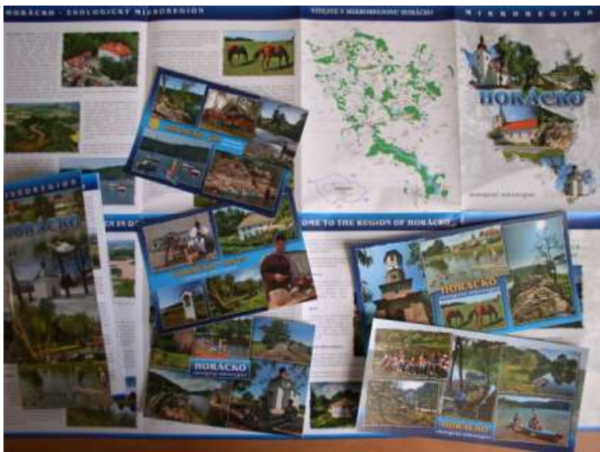
37. Propagační materiály mikroregionu Horácko