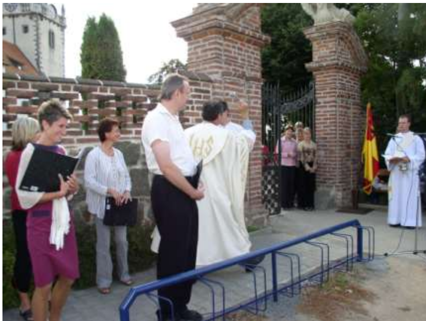
13. Žehnání hřbitovní zdi s bránou