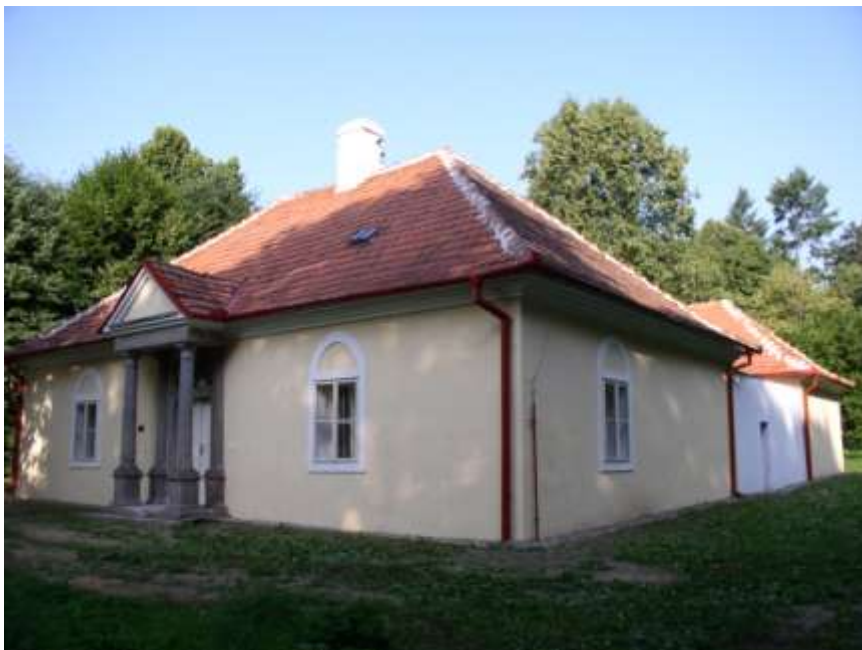
28. Informační centrum mikroregionu Horácko