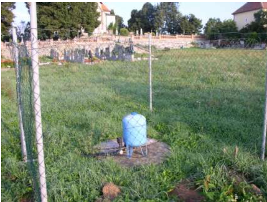
32. Posílení studny na novém hřbitově