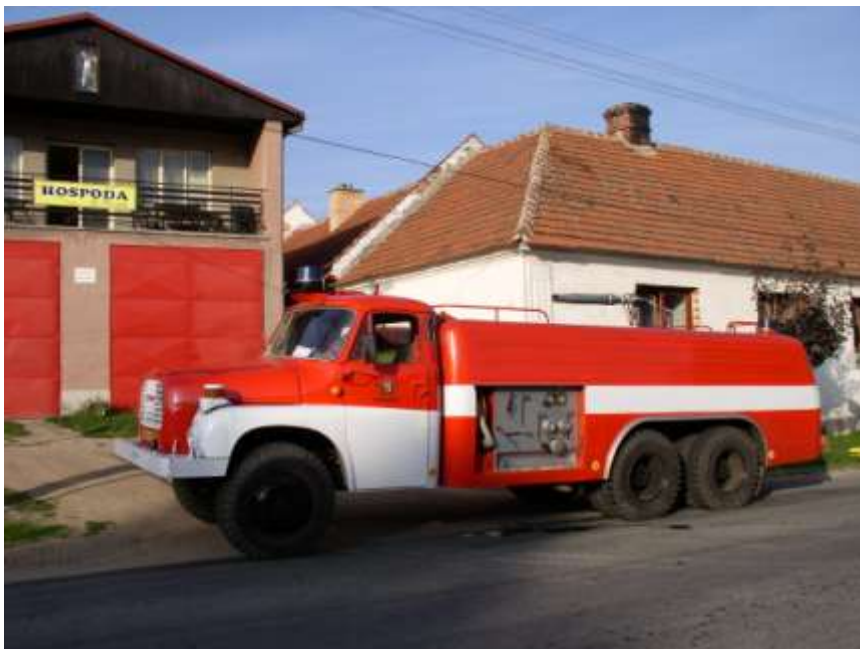
52. Tatra 148 budišovských hasičů