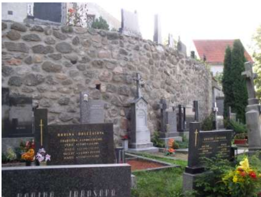
11. Vnitřní hřbitovní zeď