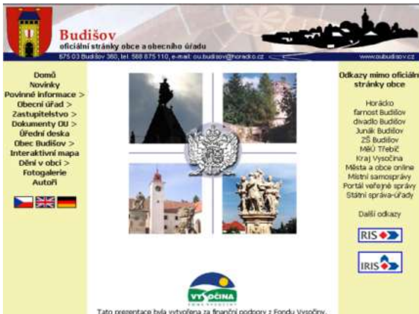
36. Internetové stránky obce