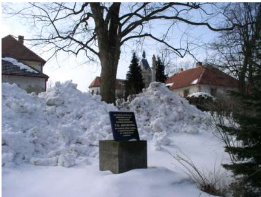
45. Plaketa T. G. Masaryka