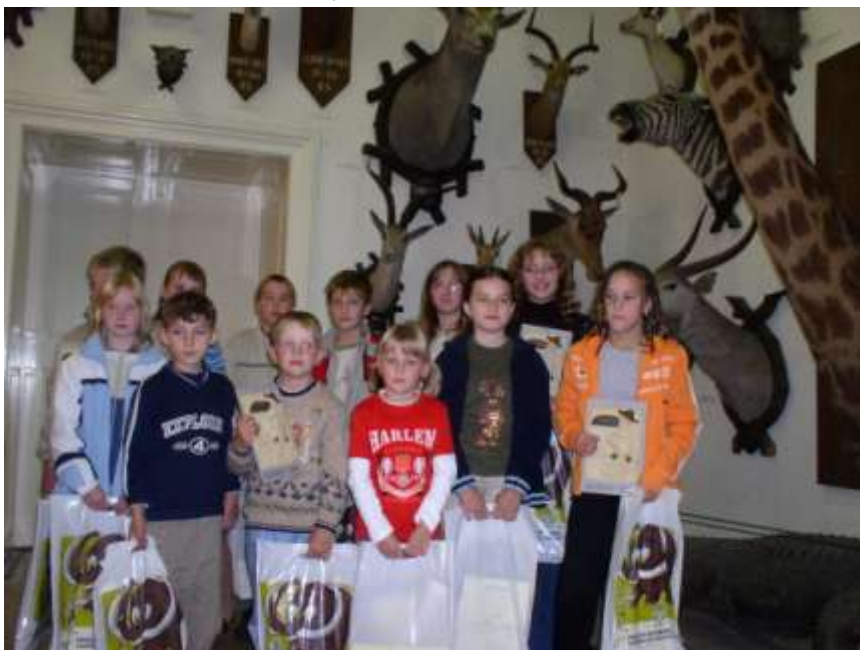
44. Budišovský tukan