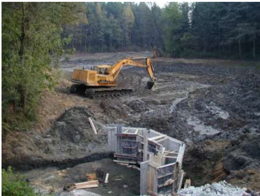
9. Rekonstrukce Kundelovského rybníka