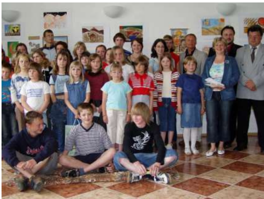
43. Výstava o arabském světě