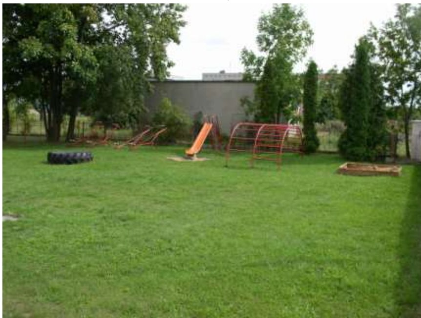
50. Dětské hřiště u cukrárny