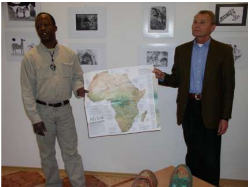
42. Výstava o Africe