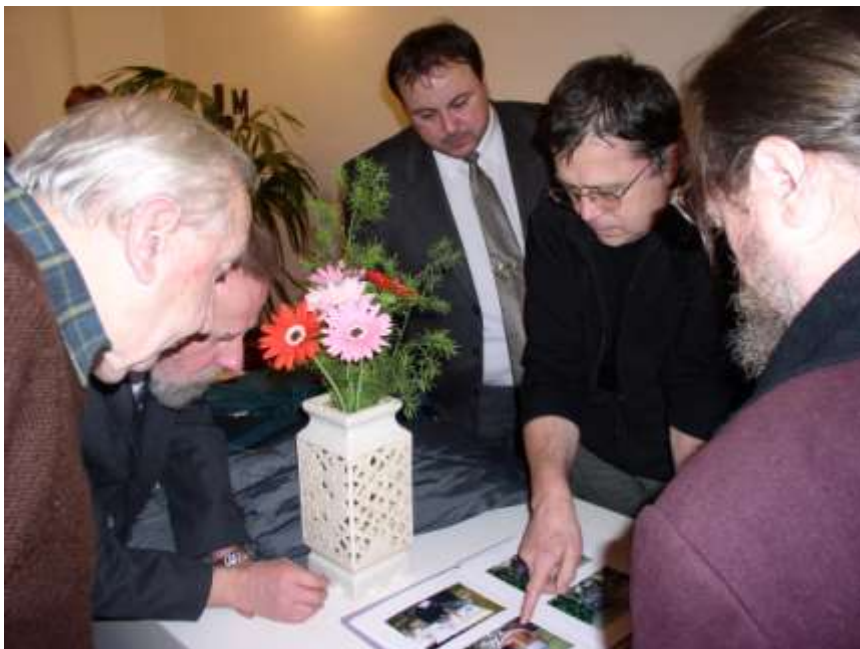
40. Výstava Václava Dosbaby