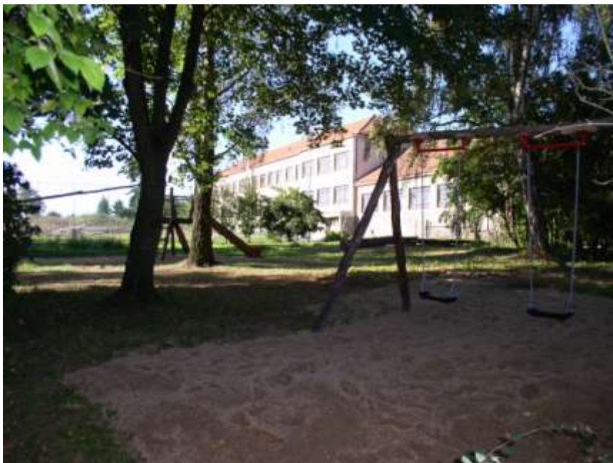
51. Dětské hřiště u základní školy