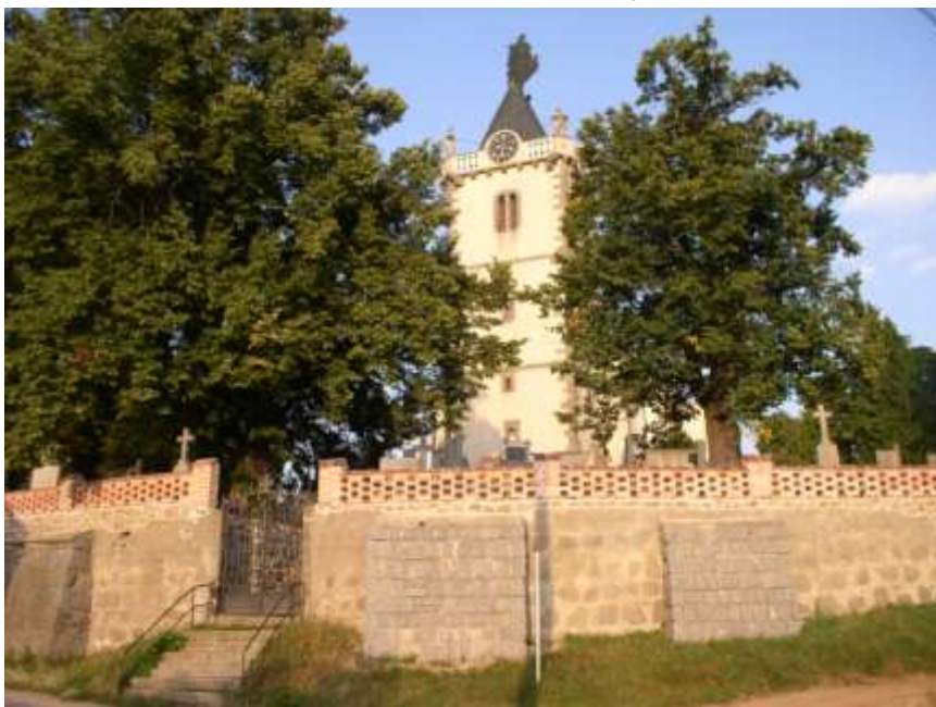
10. Vnější hřbitovní zeď