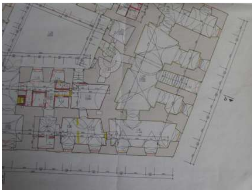
2. Bono Publico – ukázka tisku projektu