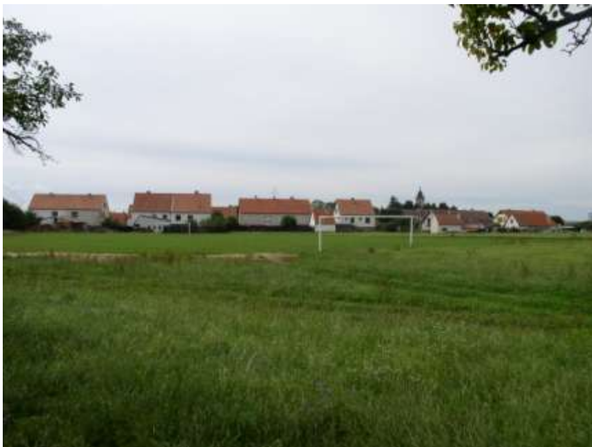
47. Tréninkové hřiště Sokola Budišov