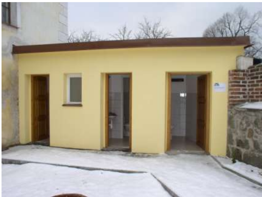
14. Veřejné záchody u hřbitova