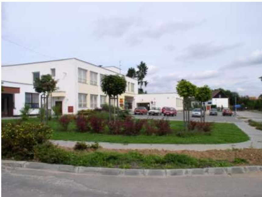
31. Nové centrum obce u obecního úřadu