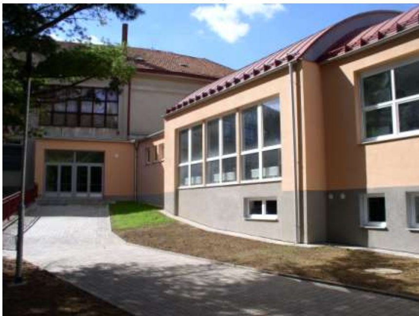
20. Přístavba školní kuchyně