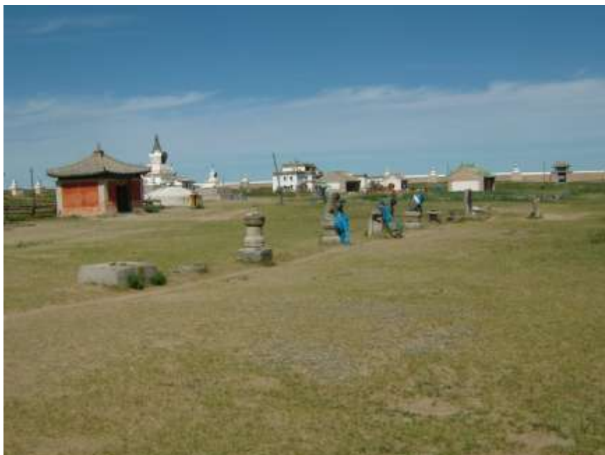
Charchorin – dávná metropole Mongolské říše Karakorum založené Čingischánem