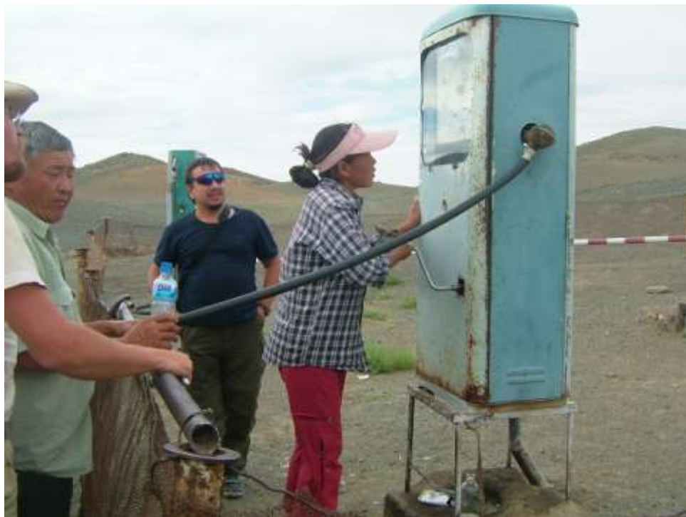
Benzínová pumpa v mongolské vesnici

Ráno jsme se vydali na další cestu pouští. První naše zastávka byla v oáze na místě rozbořeného kláštera. Několik kilometrů od oázy byly na skalách k vidění úžasné malby z doby kamenné. Cestou jsme přijali pozvání od místních pastevců do jejich geru (jurt). Drsné přírodní podmínky, nízký počet obyvatel a vzdálenost mezi jednotlivými jurtami formovaly po dlouhá staletí mentalitu mongolských kočovníků. Každý poutník je srdečně vítán a bohatě pohoštěn. Nabídli nám to nejlepší co měli – kozí škvarky, sušený jogurt a tvaroh. Pečivo prakticky neznají. Vyjma soli nebývá v Mongolsku používáno žádné koření, přesto se jedná o jídlo chutné a výživné. Na oběd jsme zkusili další mongolskou specialitu, chošur. Jedná se o smaženou placku plněnou mletým skopovým masem.