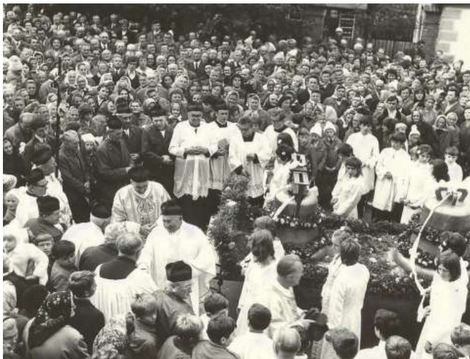
Před budišovskou farou 24. 9. 1972