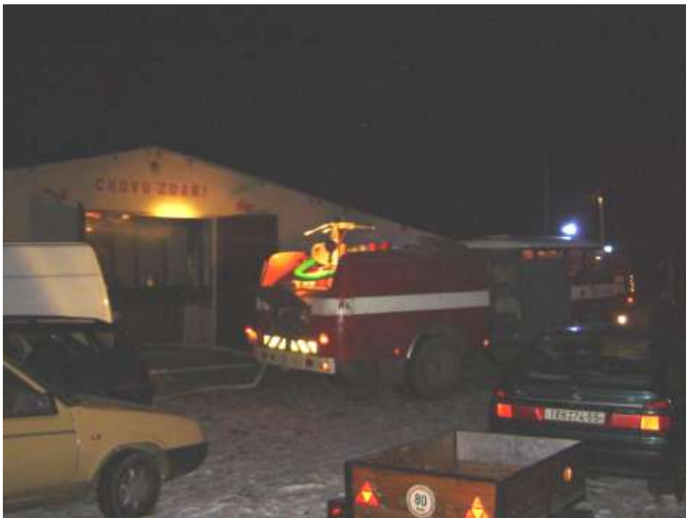
Zásah třebečských hasičů v předvečer výstavy

Vše nové bývá provázeno nedůvěrou. Bude dost přihlášených zvířat? Přes počáteční obavy bylo přihlášeno 158 holandských králíků, tedy stejný počet, s jakým jsme se setkávali po několik posledních let v Kolíně. S obavami sledujeme předpověď počasí. Sněhová kalamita by mohla ohrozit zdárný průběh akce.