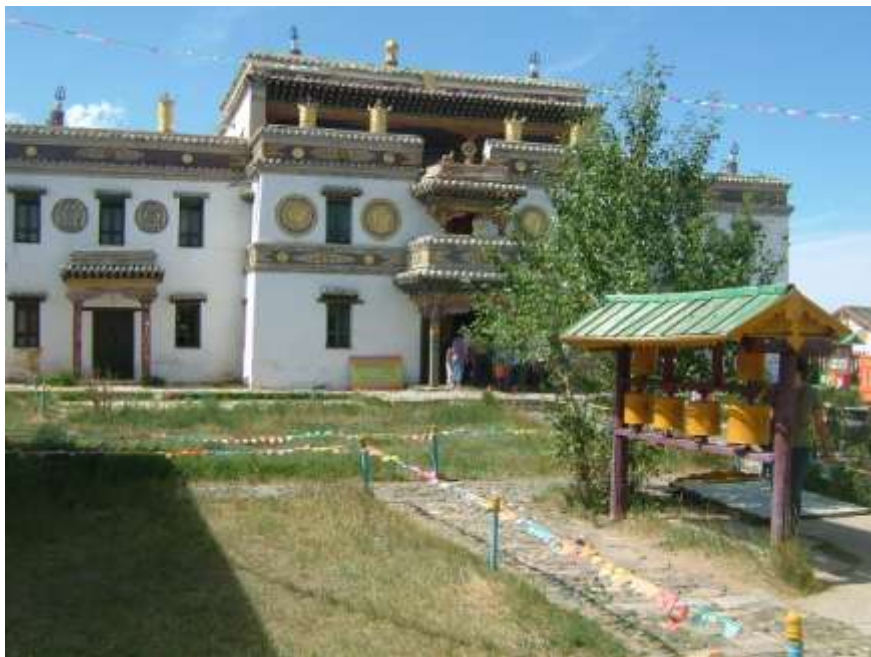
Nejposvátnější chrám Mongolska – Erbene Džú Chíd