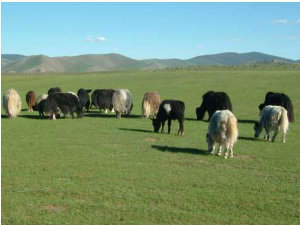
Jaci ve stepi

První naše zastávka byla u zničeného kláštera Manžšin. V okolí tohoto kláštera jsme viděli kamenné báby z doby Hunů. Ve 30. letech minulého století bylo v Mongolsku přes 4 000 lámaistických klášterů. Po zásahu komunistů zůstaly stát pouze tři. V současné době se lámaistická tradice v Mongolsku začíná pomalu obnovovat. Na mnoha místech rozbořených klášterů se staví kláštery nové. Spousta chlapců si nechává oholit hlavy a chtějí zde strávit alespoň několik let, aby se něčemu naučili.