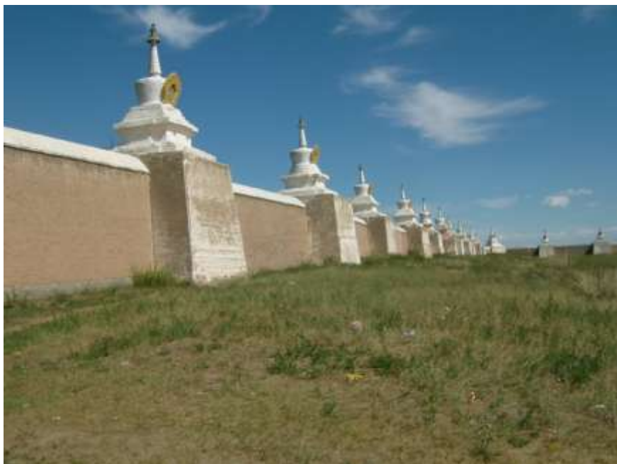
Zed' okolo Erbene Džú Chíd