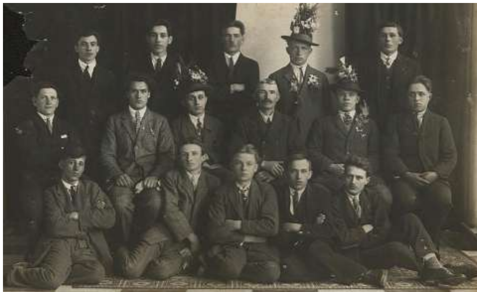
Vojenské odvody (Na nejstarší fotografii neznáme letopočet, ani většinu z odvedenců)