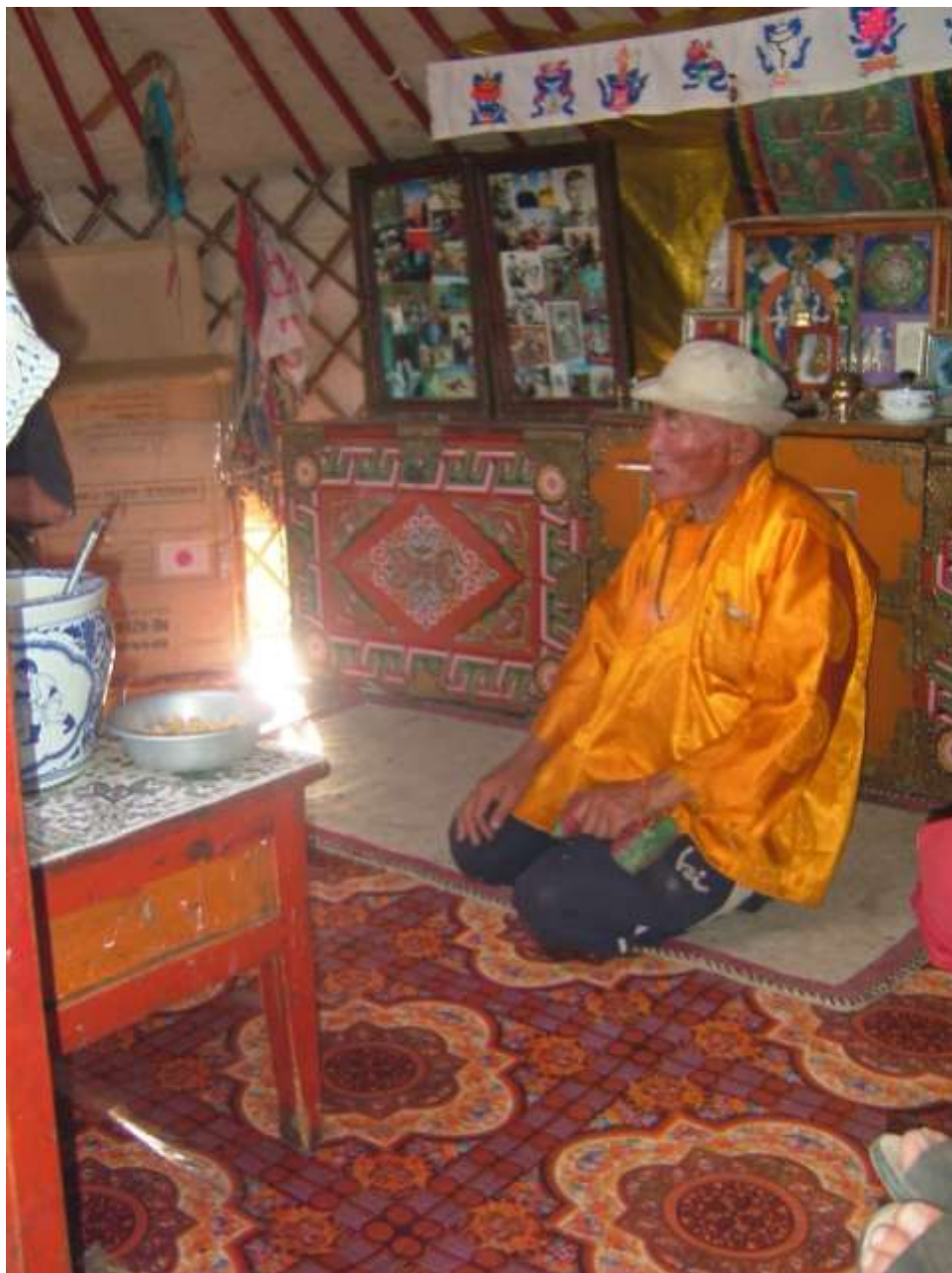
Vnitřek geru – typický mongolský obyvatel

listeny a jsou vyživovány spodní vodou. Vzhledem k tomu, že půda obsahuje hodně soli, jsou listeny slané a velice rádi je požirají velbloudi. Nám moc nechutnaly.