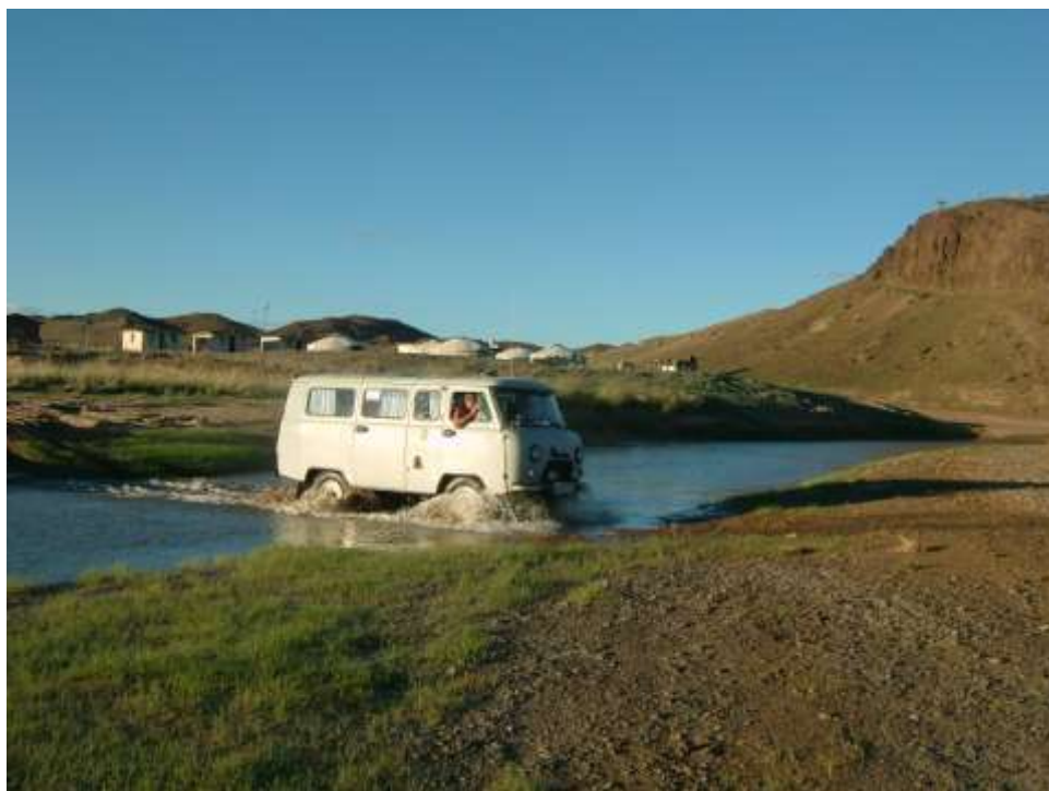
Brod přes řeku v poušti Gobi

Následující ráno jsme zašli na místní tržnici. Bylo třeba doplnit zásoby jídla a vody, protože nás čekal devítidenní okruh stepí a pouště Gobi. Odpoledne jsme v terénních autech UAZ vyrazili na cestu dlouhou přes 2 200 km.