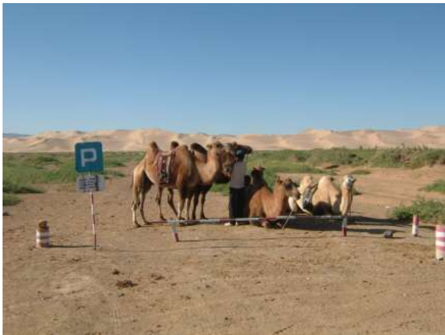
Parkoviště korábů pouště