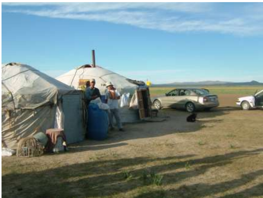
Ger neboli jurta – tradiční obydlí mongolských pastevců