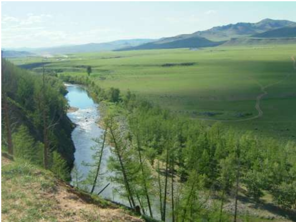
Národní park Ogolson v pohoří Changaj

a široké 1 km. Těsně kolem dun jsou bažiny a pastviny, kde se popásají obrovská stáda koňů a krav. Tohle všechno jsme si mohli prohlédnout pěkně zblízka, protože hned následující den jsme do těchto míst podnikli dvouhodinovou vyjížďku na velbloudech, což byl samozřejmě neopakovatelný zážitek.