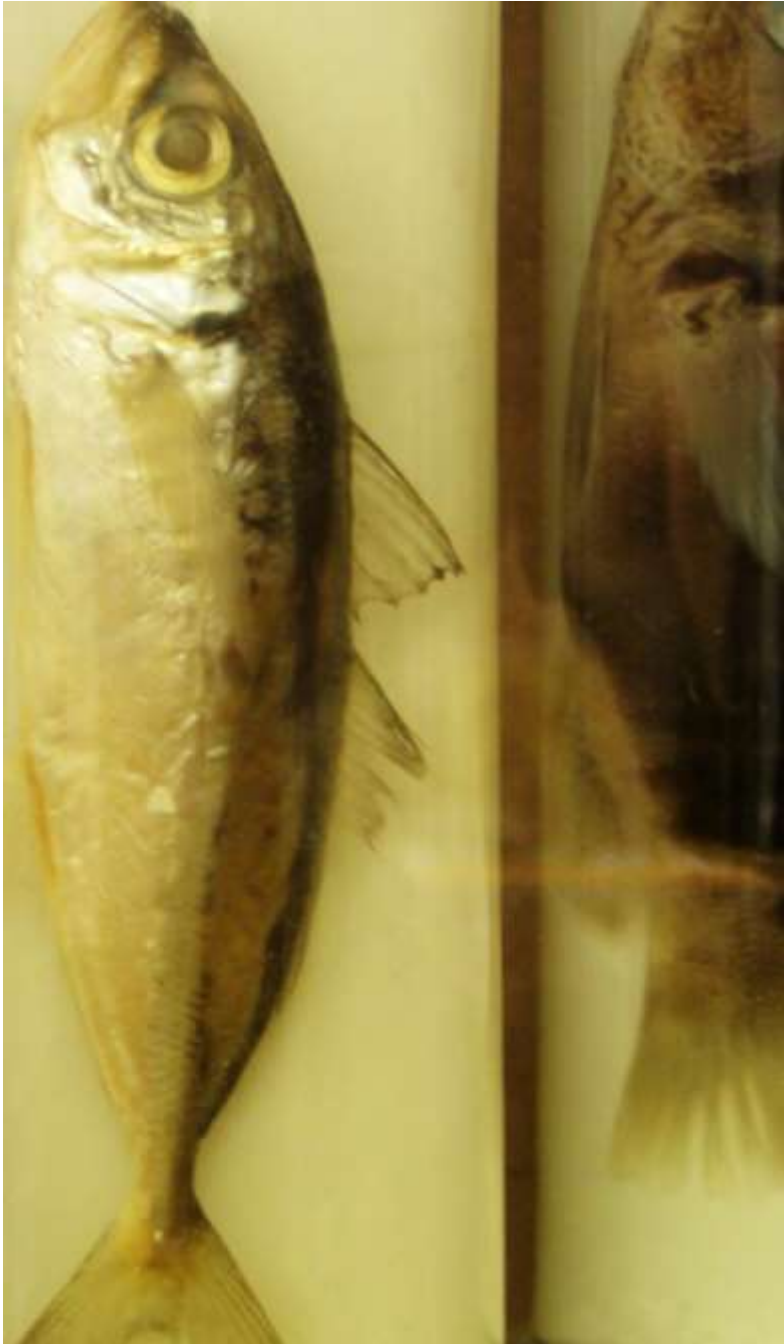
Sardel obecná (anšovka)