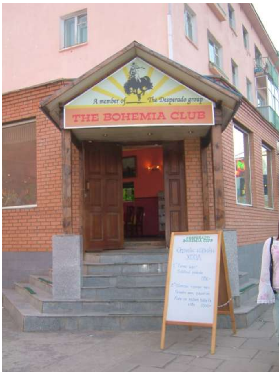
Česká restaurace v Ulánbátaru