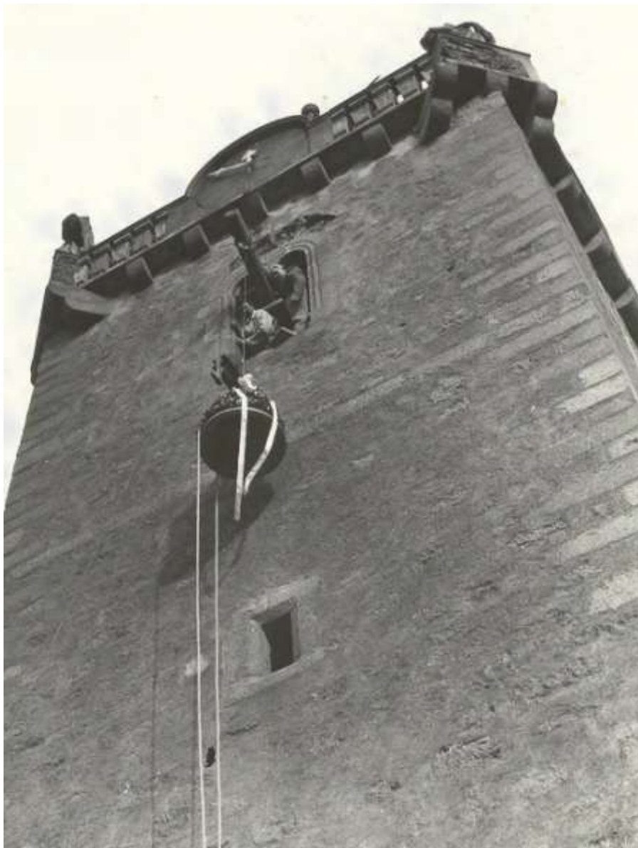
Vytažení zvonu na věž kostela