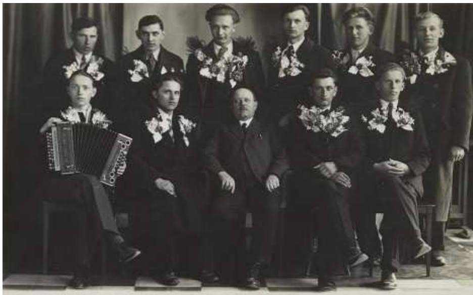
Odvedenci, jež šli na vojnu v roce 1936