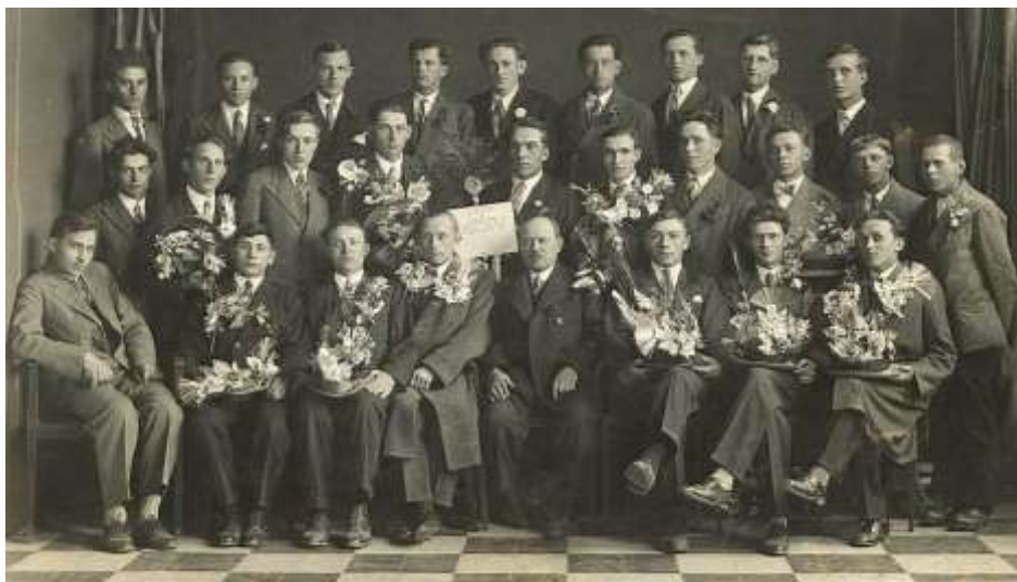
Odvodci v roce 1933