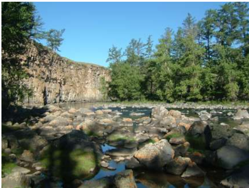
Bájná řeka Orchon