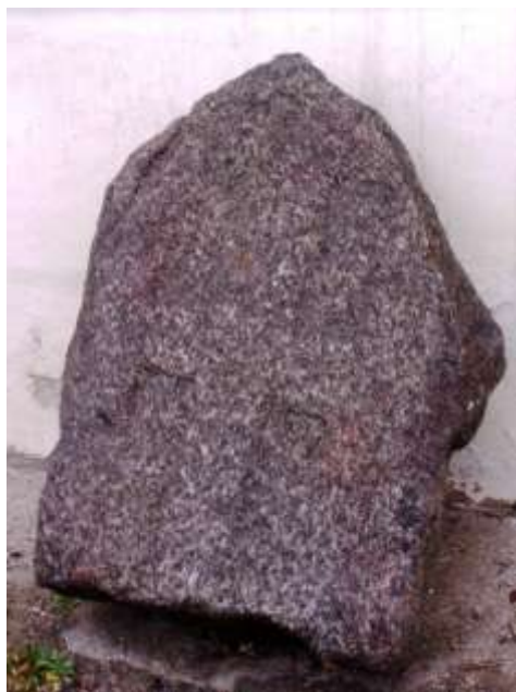
Smírčí kámen u vladislavského kostela