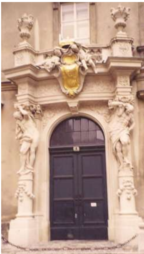
G. Giuliani, Atlánté portálu Liechtensteinského paláce z Minoritenplatz

Nedaleko odtud na severozápad od Hofburgu se nachází Minoritské náměstí, v jehož středu dominuje kostel řádu s charakteristickou věží. Tato stavba ukazuje vývoj gotiky ve městě s působením francouzské stavební huti při výstavbě kostela. Minorité do Vídně přišli v roce 1230, kdy dostali do užívání malý kostelík a pozemky, na nichž si mohli postavit klášter. Jejich začátky byly skromné, ale bohatého mecenáše získali v českém králi Přemyslu Otakaru II. Ten začal v r. 1276 budovat pro řád velkolepý kostel, církevní stavba po smrti krále v bitvě na Moravském poli v r. 1278 zůstala nedokončena. Panovníkovo tělo bylo po 30 týdnů vystaveno v klášterní kapitulní síni a teprve potom odvezeno do Prahy. V kostelíku sv. Kateřiny bylo pohřbeno královo srdce, tato stavba dnes neexistuje. Výstavba kostela pokračovala v mezidobí let 1339–1447. Řád minoritů později začal upadat, kostel byl za obléhání Vídně Švédy těžce poškozen. Zkáza kláštera postupuje i v následujících stoletích, v 19. a 20. stol. byly zbořeny klášterní objekty.