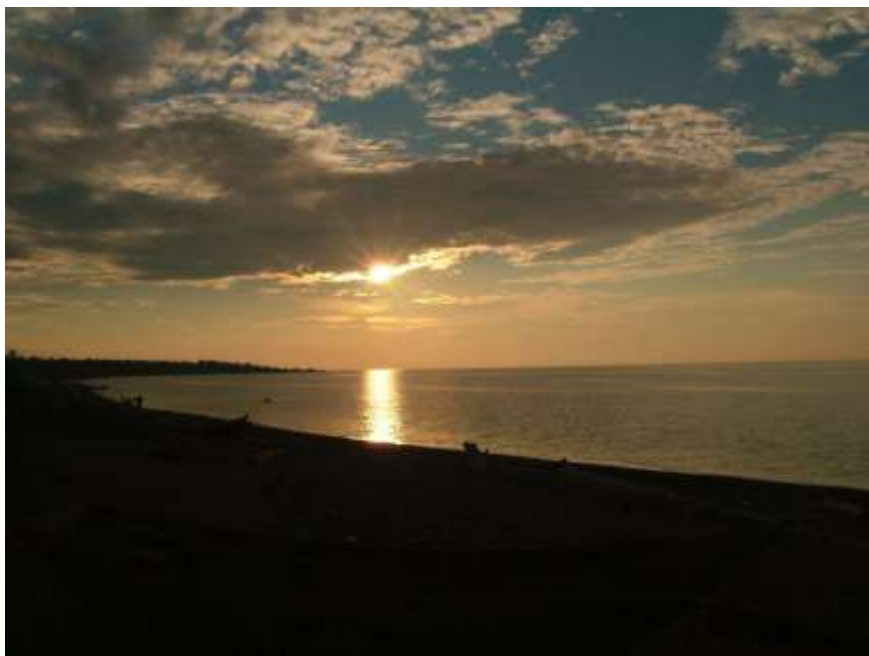
Západ slunce nad Bajkalem