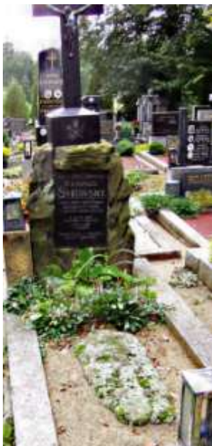
Smírčí kámen na hrobě Svitavských ve Střížově