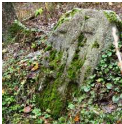
Smírčí kámen u Klementic