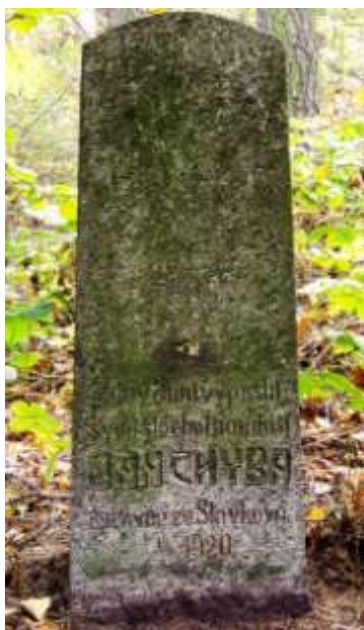
Kámen na Brdcích