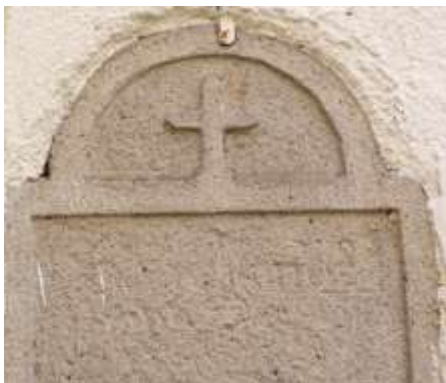
Pískovcový kámen na vladislavském kostele