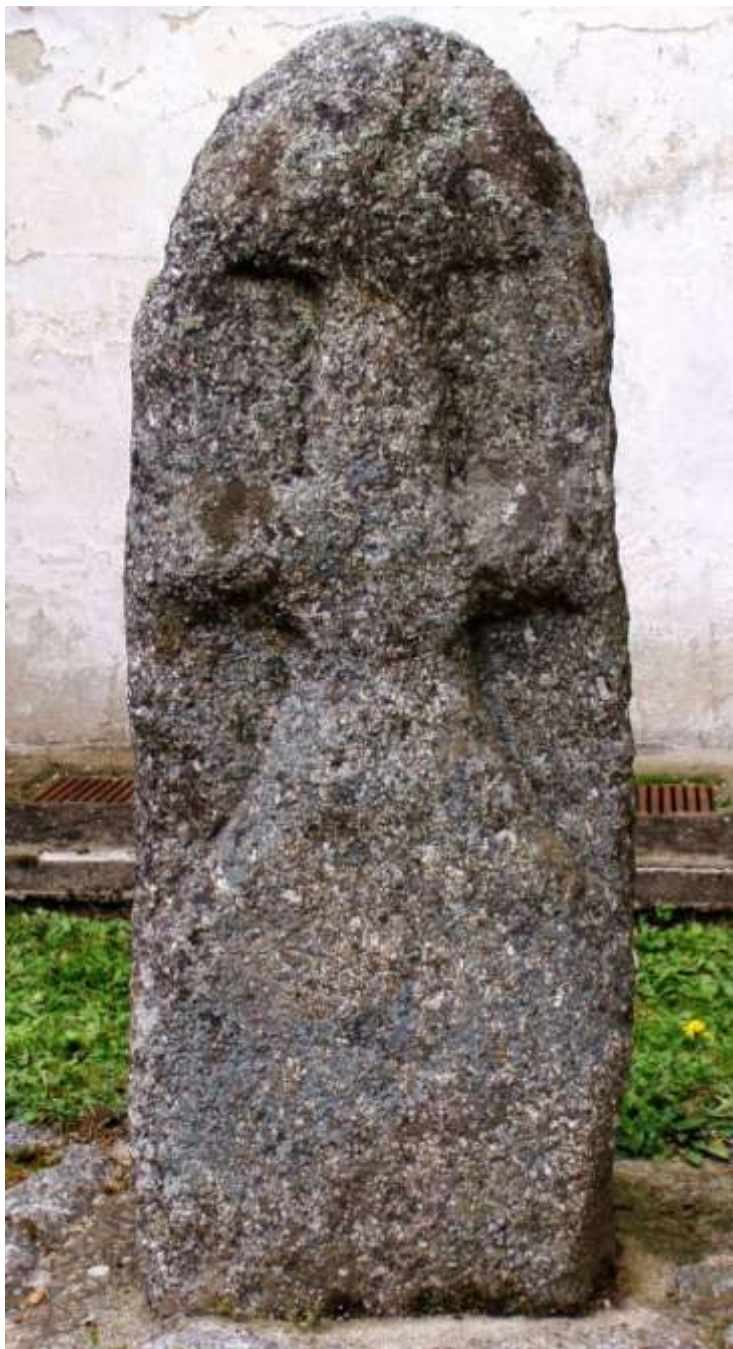
Smírčí kámen na budišovském hřbitově