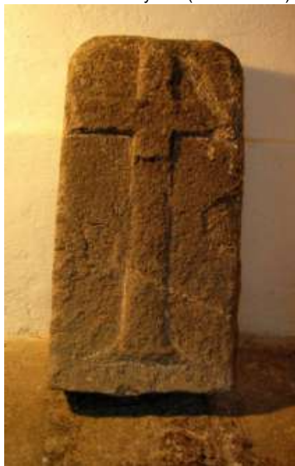
Smírčí kámen ve velkomeziříčském zámku