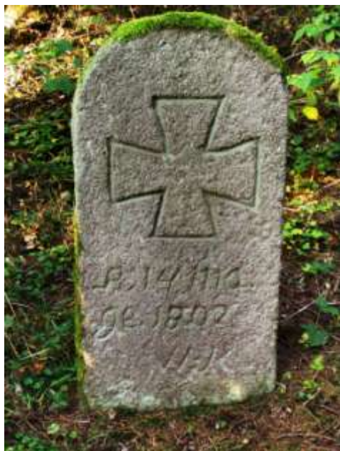
Smírčí kámen u Hodovského rybníka