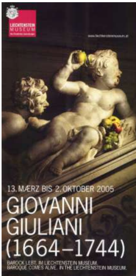
Úvodní stránka propagačního materiálu k výstavě díla G. Giulianiho