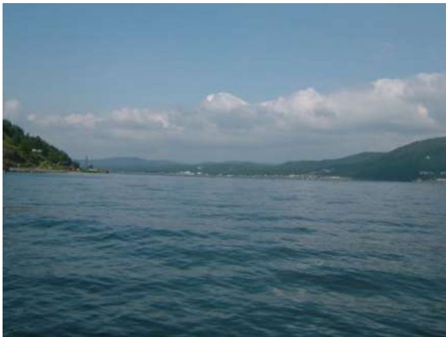
Zrod řeky Angary