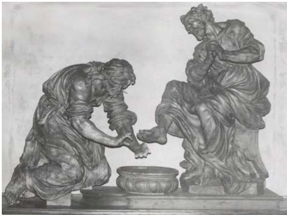
G. Giuliani, Mytí nohou (Kristus myje nohy Petrovi), z křížové chodby kláštera v Heiligenkreuz

vnímá svět baroka v celé jeho složitosti, v oživlých obrazech biblických dějů s umělecky přesvědčivým podáním výjimečného sochaře.