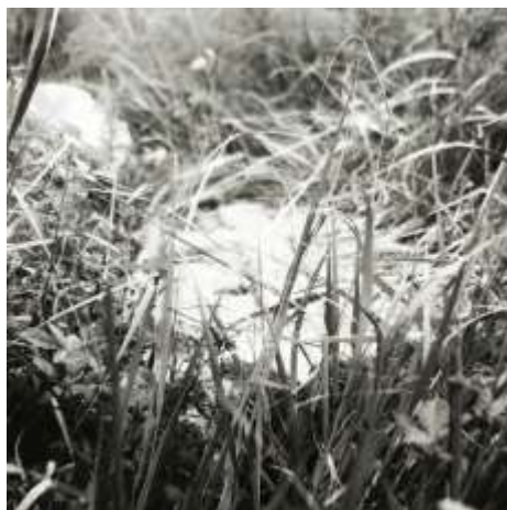
Smírčí kámen u Třesova