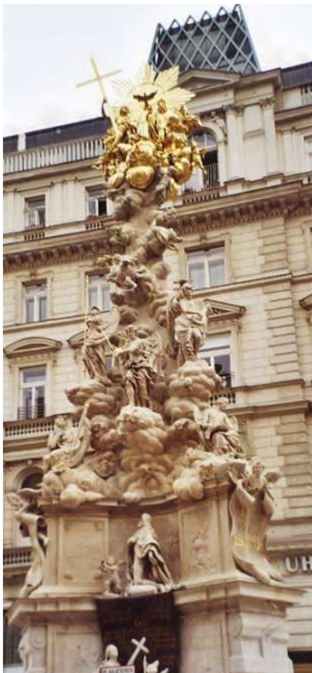
Morový sloup sv. Trojice (1682–93), Vídeň, Graben