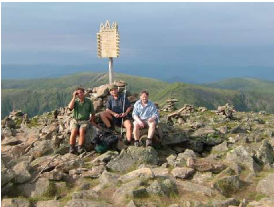
Vrchol hory Pik Čerskovo

Velkým zážitkem rovněž byla ochutnávka vynikající místní kuchyně. Pečení i uzení omulové čerstvě vylovení z Bajkalu a šašlik byli výborným jídlem. Zkusili jsme i jádérka ze šišek limby.