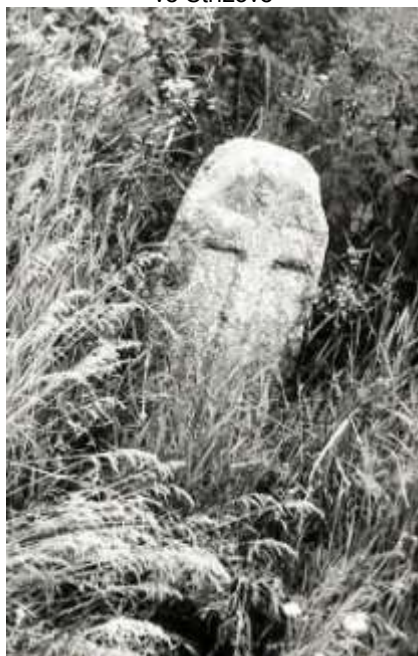
Smírčí kámen u Dolních Vilémovic