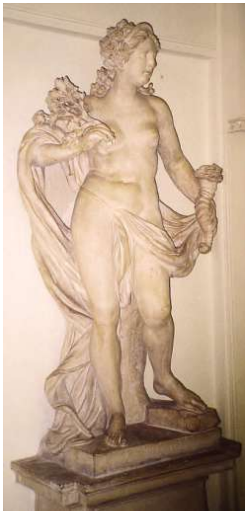
G. Giuliani, Fortuna, schodiště měst. paláce Liechtensteinů