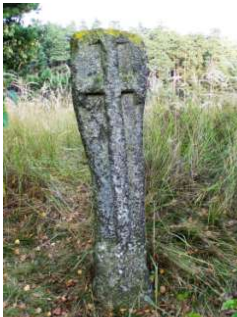
Smírčí kámen na cestě mezi Pyšelem a Častoticemi