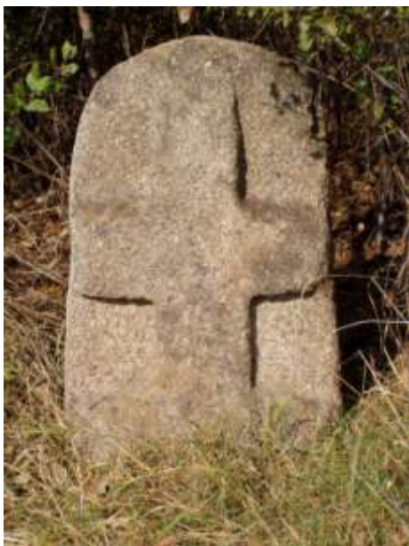
Smírčí kámen u Pyšela (v Říčánkách)