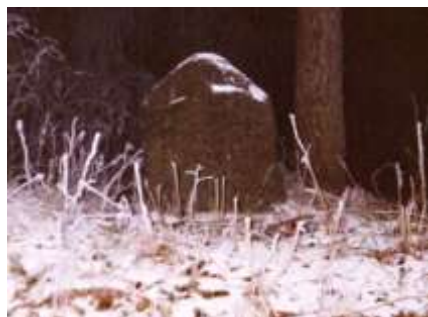
Smírčí kámen v lese Kuchyňka u Přeckova