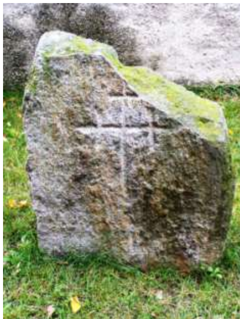
Smírčí kámen na koněšinském hřbitově