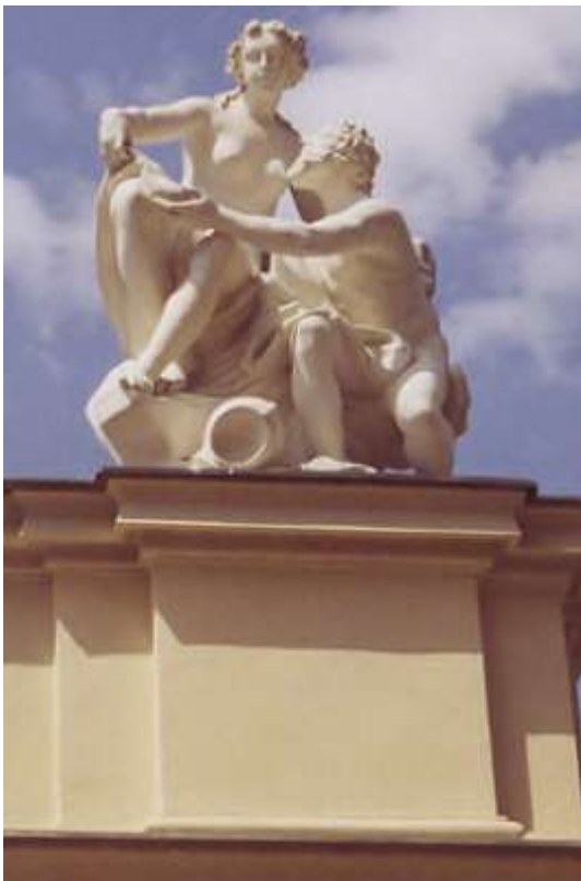
G. Giuliani, Herkules a Omfale, atika vedlejších budov, Liechtensteinský palác v Rossau, Vídeň

Dojem z Giulianiho velkého umění umocňuje chránová hudba, která zaznívá z neviditelného zdroje, zvuk je zde impulsem pro syntézu smyslových vjemů. Polychromie soch navozuje povědomí o barvě obsažené v hudbě, která sjednocuje kontrast religiozity a exotiky, tvarově bohatých plastik s povrchem prosté hmoty dřeva a rafinované barevnosti vzdáleného světa. Divák tak vnímá ve městě hudby – Vídni výtvarné umění v souznění s klášterní melodií a prostřednictvím svých smyslů se ocitá ve světě biblických příběhů a současně je vtahován do dálek exotického kontinentu.