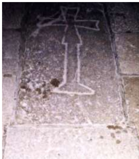
Kámen ve střížovském kostele