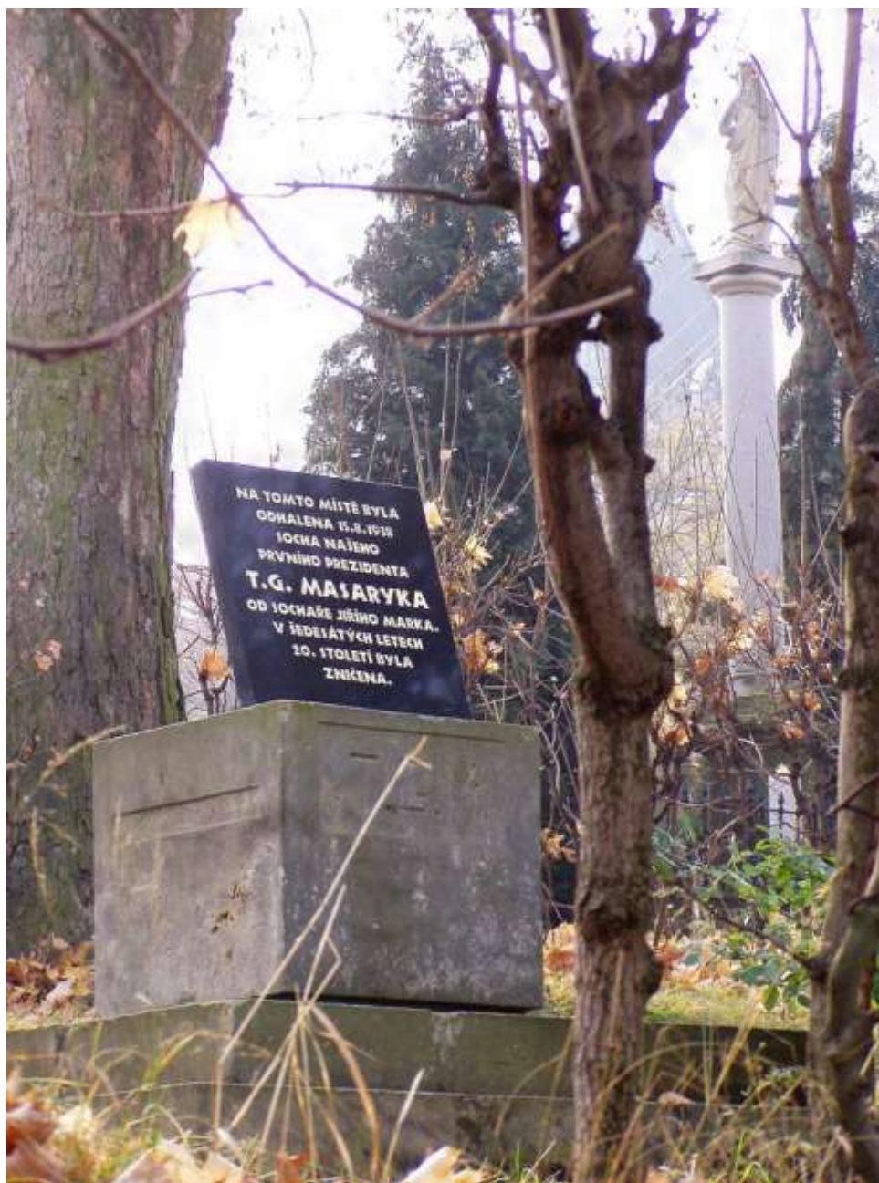
Pamětní deska umístěná 3. listopadu 2005 na podstavec sochy T. G. M. připomínající její zničení