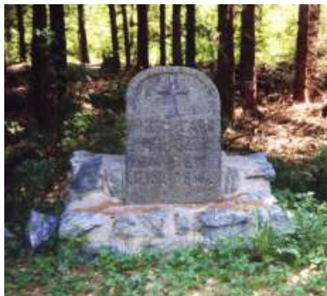
Smírčí kámen u Sedlece