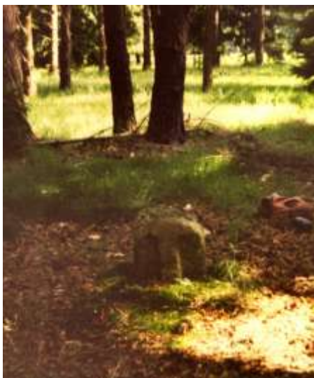
Smírčí kámen u Kladerub nad Oslavou