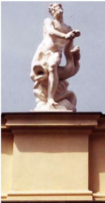
G. Giuliani, Triton a delfín, atika vedlejších budov, Liechtensteinský palác v Rossau, Vídeň

chodby kláštera v Heiligenkreuz s námětem Mytí nohou z r. 1705. Marie Magdaléna se sklání s úctou a láskou ke Kristovi a tento v dalším vyobrazení slouží svému učedníku Petrovi. S jmenovanými sochařskými díly, provedenými ve dřevě bez polychromie, ostře kontrastuje čtveřice černoušků s barevnou povrchovou úpravou z r. 1722–25, kteří jako světloňoši oživovali interiéry palácových sálů podle italských vzorů.