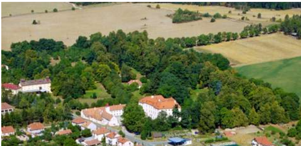
Oblast působnosti projektu Bono Publico

Teď již záleží jen na práci zastupitelstva, zejména toho za rok nově zvoleného, aby se naše obec stala opravdovým kulturním, sportovním a turistickým centrem a důstojným zázemím pro významné třebíčské památky. Jestli se nám podaří do Budišova přivést co nejvíce návštěvníků, budou z toho mít prospěch nejen podnikatelé v oblasti služeb, ale zprostředkovaně i občané Budišova. Projekt totiž pro ně přinese mimo jiné i nejméně 20 nových pracovních míst a s rozvojem turistiky i rozvoj obce samé.