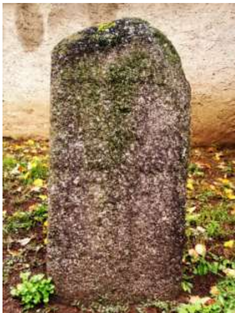
Smírčí kámen na koněšinském hřbitově