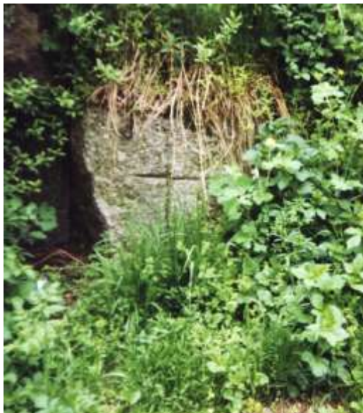
Kámen ve Velkém Meziříčí (Čechovy sady)