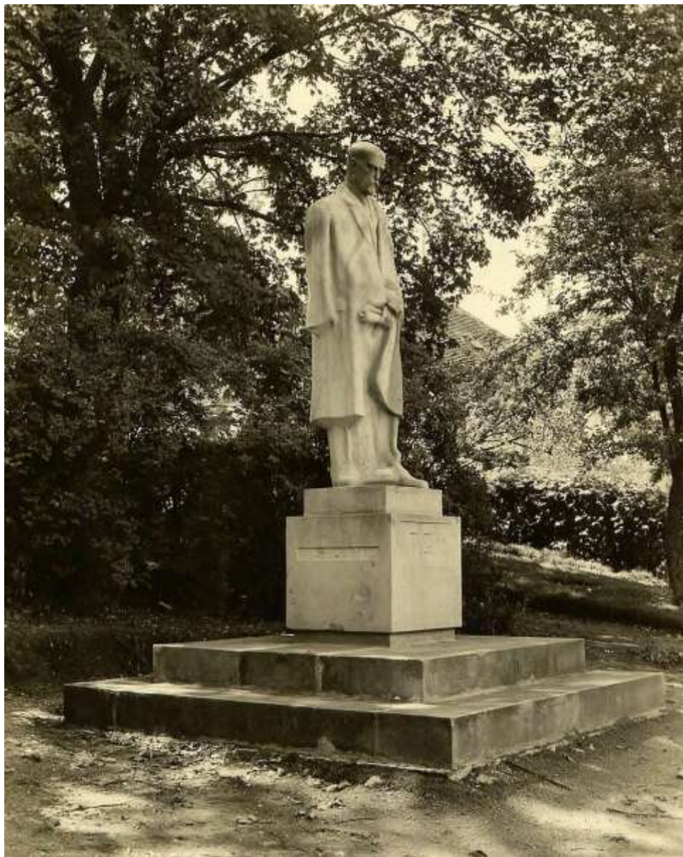
Socha T. G. Masaryka po odhalení 15. srpna 1938