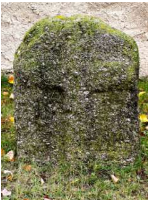
Smírčí kámen na koněšinském hřbitově