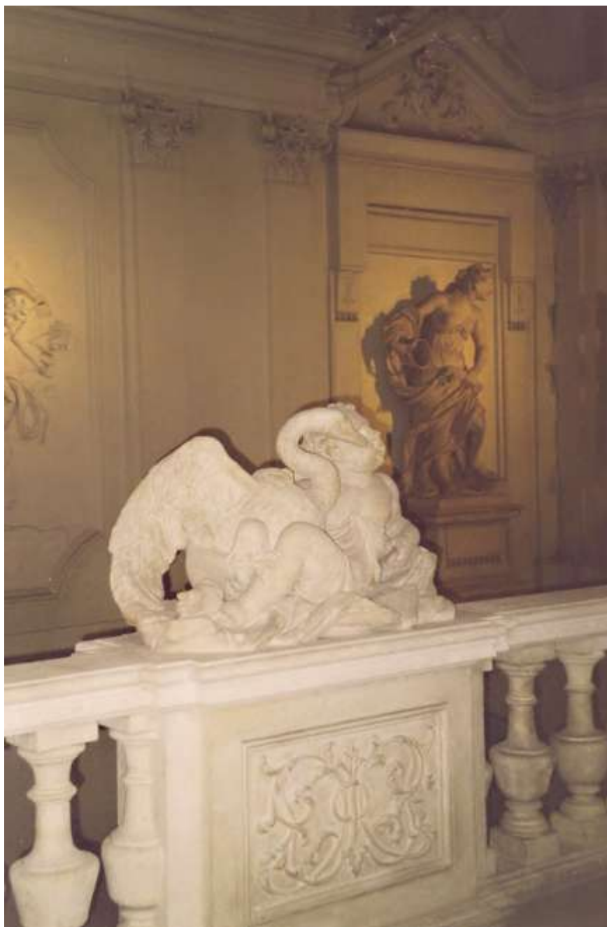
G. Giuliani, Putto s labutí z parapetu schodiště městského paláce Liechtensteinů, Bankgasse, Vídeň