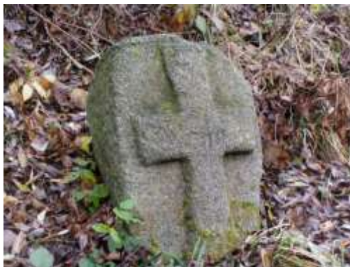
Smírčí kámen ve Velkém Meziříčí (u Penny marketu)