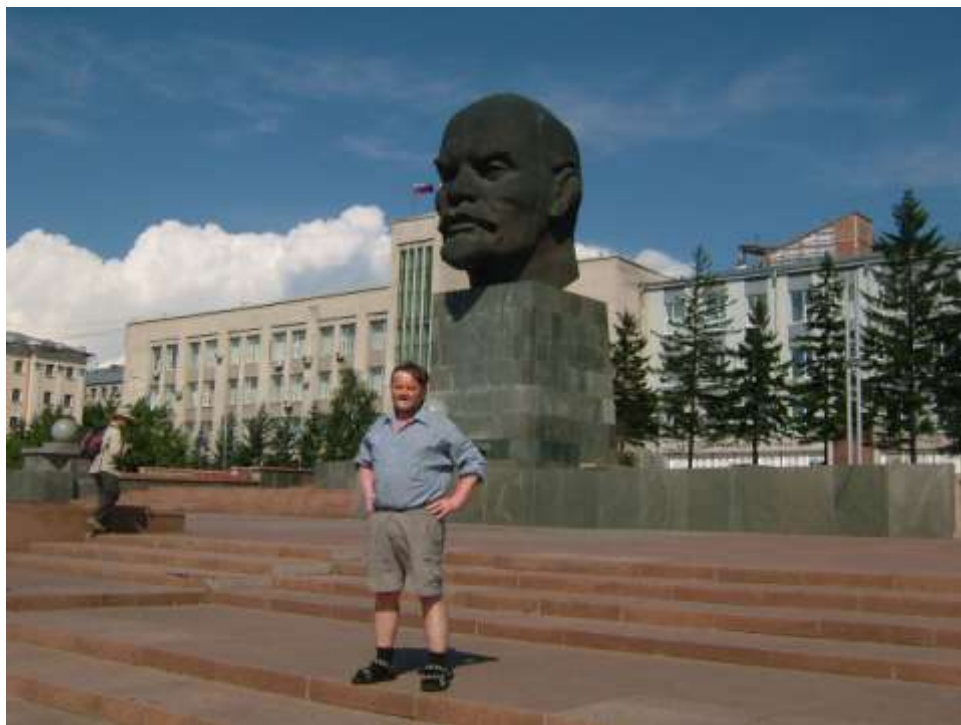
Ulan Ude – největší busta Lenina na světě

Tam jsme nechali batohy v úschovně a na prohlídku jsme vyrazili tramvají a maršrutkou (místní název pro taxi velikosti dodávky). Prohlédli jsme si Sibiřský skanzen, jež reprezentuje splývání Burjatů s Rusy, kteří jejich území okupovali. Burjaté jsou původem kočovníci podobně jako Mongolové. V Ulan-Ude žije asi půl milionu obyvatel. Je v něm asi kilometr dlouhá pěší zóna a náměstí s největší bustou Lenina na světě.