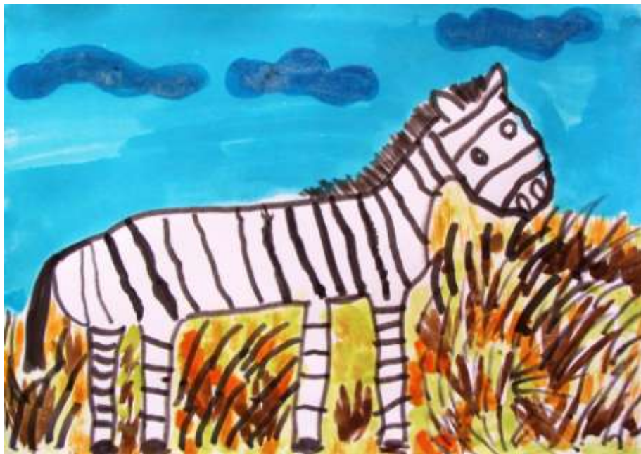
Ondřej Hladík - Zebra