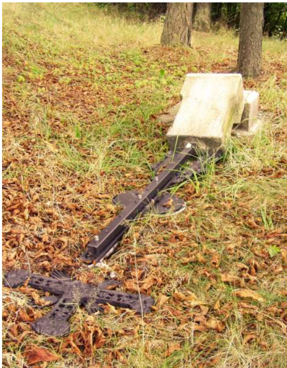
Pán padá pod křížem potřeťi...