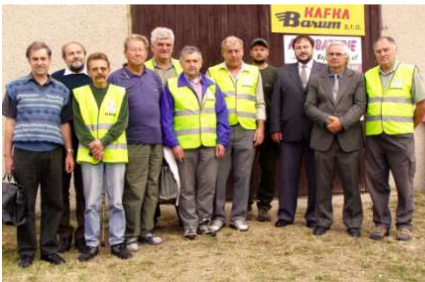
Výstavní výbor organizace a posuzovatelé