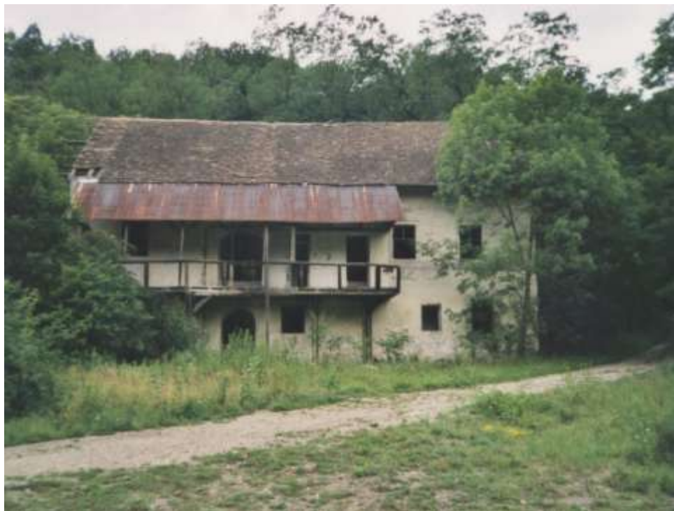
Papírna v Mohelně