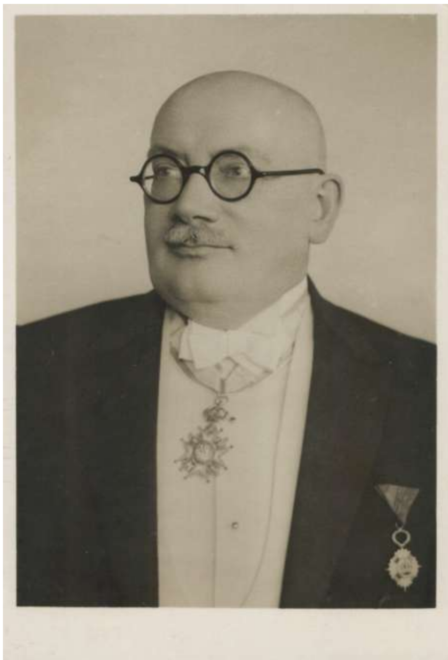
S Řádem jugoslávské koruny a řádem sv. Sávy