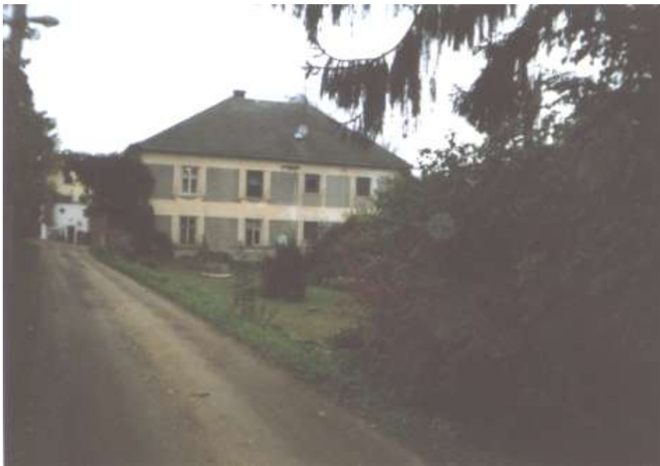
Vaněč – mlýn Dobrovolných