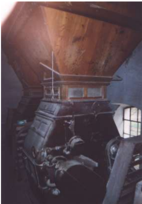
Stejskalův mlýn – válcová stolice