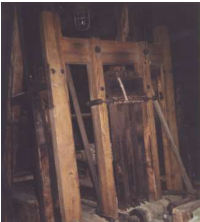
Stejskalův mlýn – pila