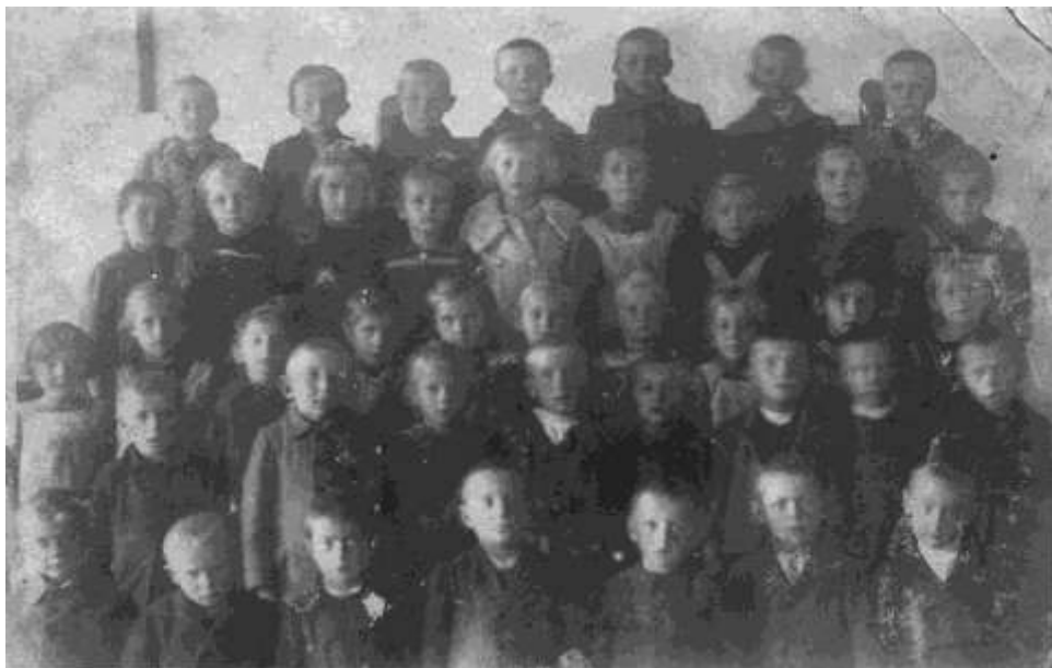
Fotografie školní třídy z roku 1922