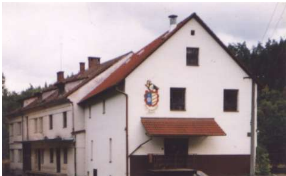
Stejskalův mlýn 1998

U Jelinkova Mlýna odbočíme doprava po modré a zelené značce směrem k zřícenině hradu Dub a Findeisovu, později Stejskalovu, dnes Holomkovu mlýnu. Od tasovské papírny nás cyklistická stezka zavede vzhůru ke zbytkům středověkého gotického hradu založeného snad v 1. pol. 13. století. Roku 1233 je uváděn jako Tasovský hrad (Tassenberg), sídlo pánů z Lomnice na Tasově. Za válek mezi moravskými markrabaty v 2. pol. 14. století byl rozbořen. Do dnešních dob jsou zachovány zdi paláce a hradní příkop.