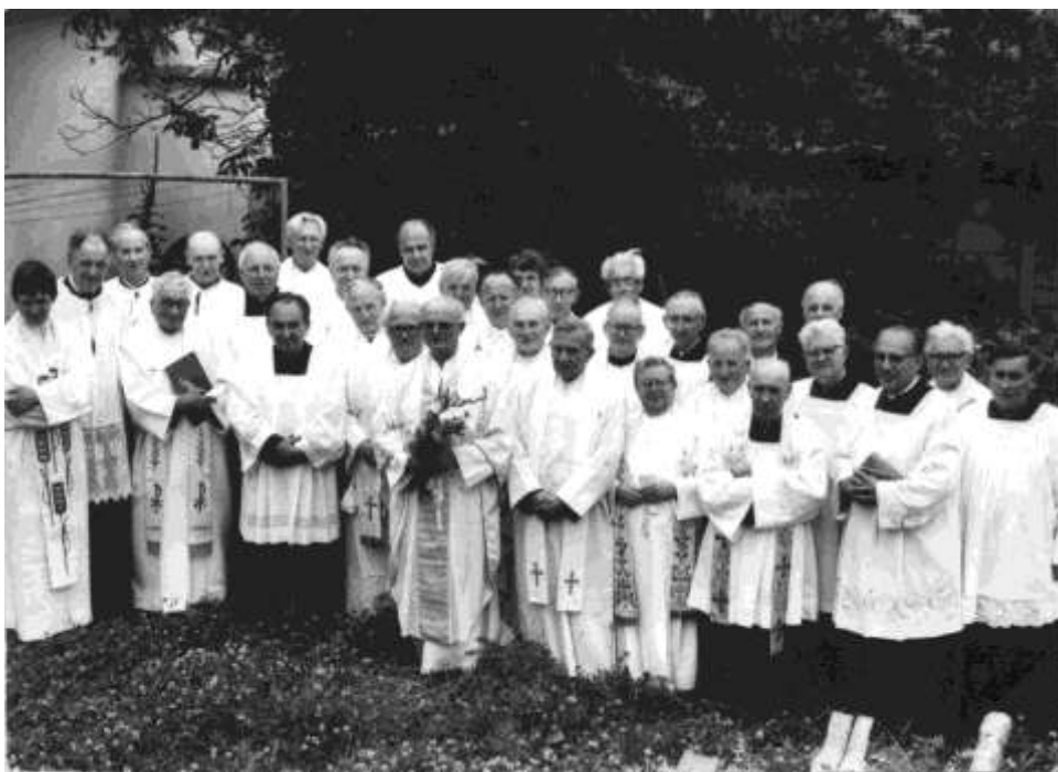
Z oslav 50 let kněžství, červenec 1986