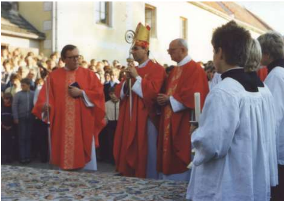
Svěcení mariánského sloupu v Budišově 1990