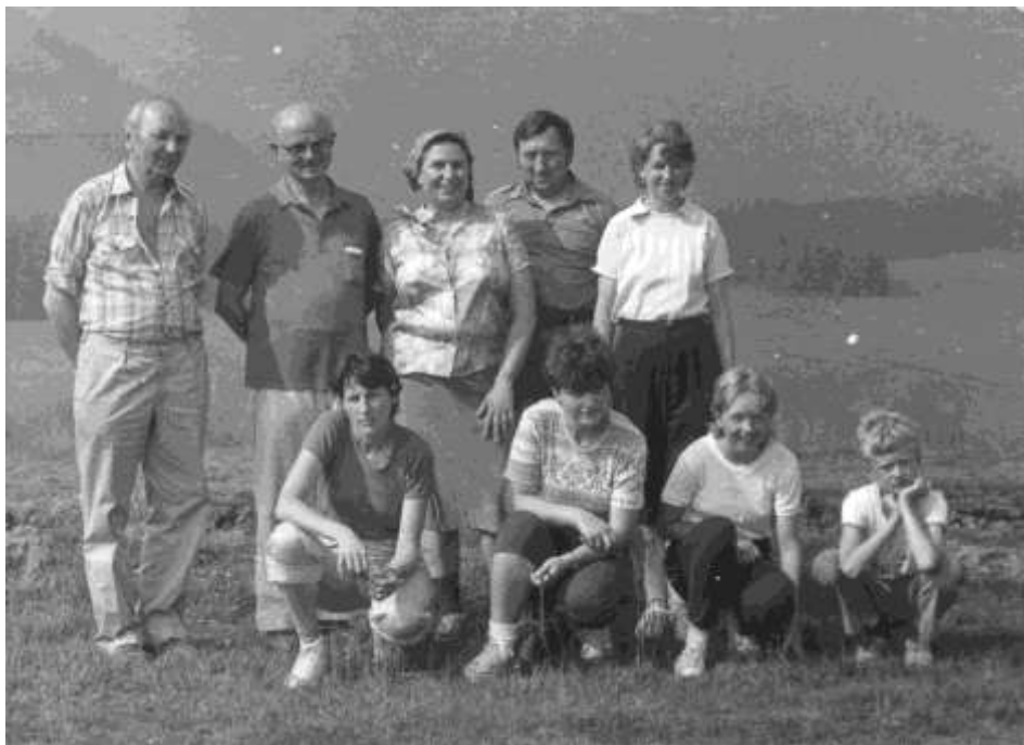
Ždiar, Belianske Tatry, 1. srpna 1986

kostela přes sakristii, ale hlavním vchodem, aby mohl pokleknout před svatostánkem. To samé se dělo i při odchodu z kostela. Podle jeho příchodu na bohoslužby se daly seřizovat hodinky.