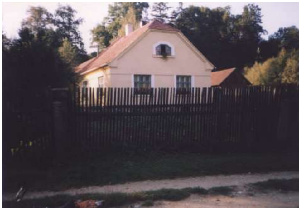
Hájenka v Nesměři