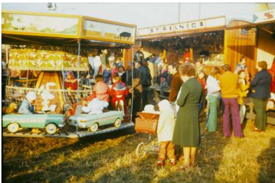
Táž v pozadí před čtvrtstoletím