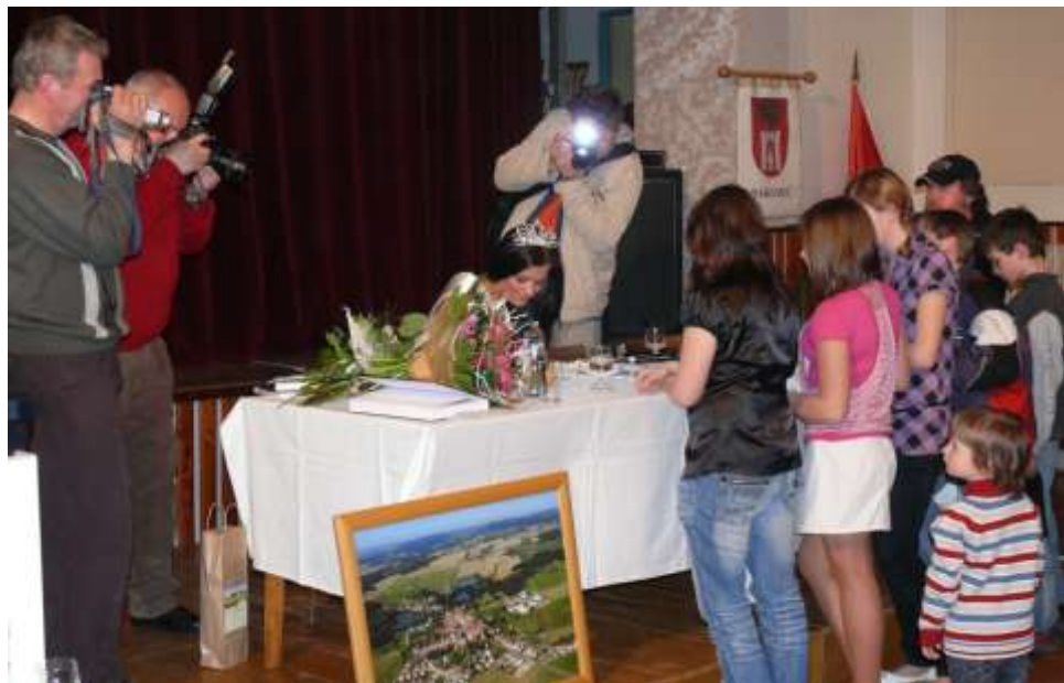
Miss s fanoušky