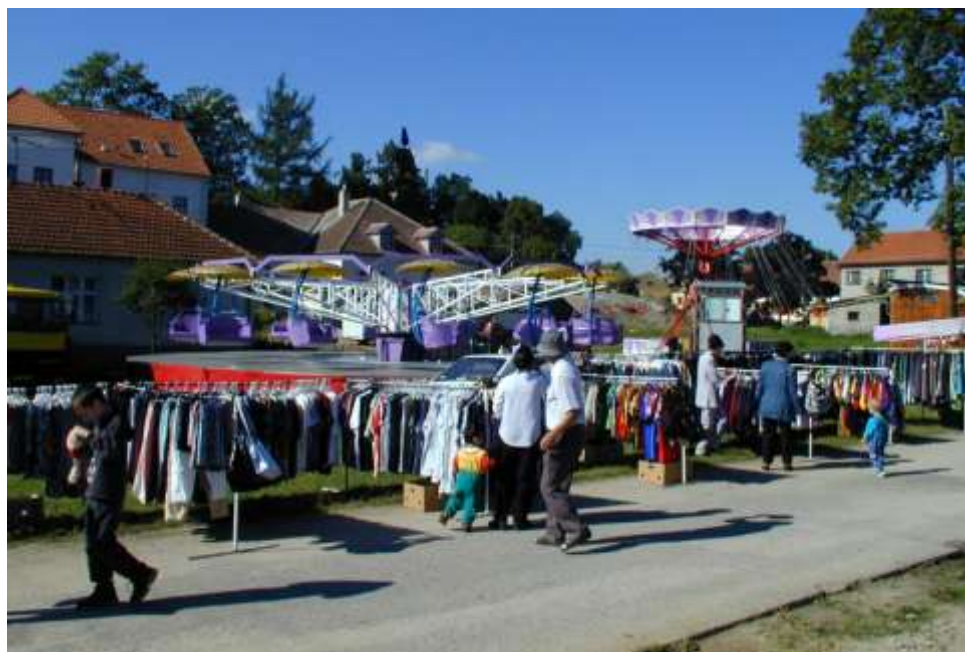
Pout' před desetiletím