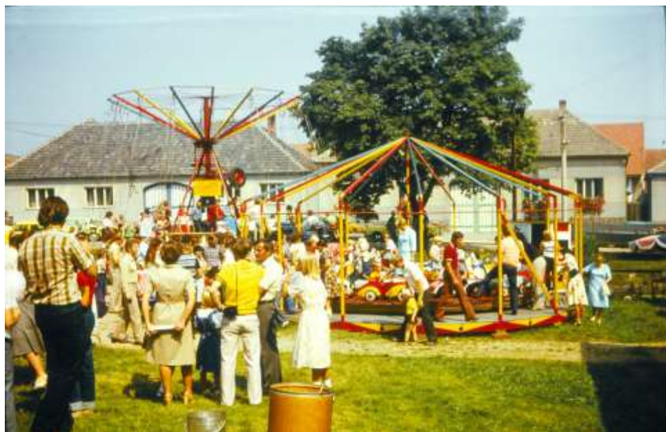
Týž v pozadí před čtvrtstoletím