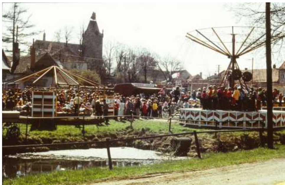
Táž před čtvrtstoletím