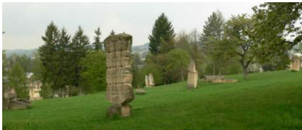
Galerie kamenných plastik v Hořicích

Nejzajímavější místo Hořic však tvoří severozápadní svah návrší směrem k městu, posetý sochami Galerie plastik a Sochařského parku svatého Gotharda, jemuž vévodí 12,4 m vysoký Riegrův obelisk z roku 1903, vztyčený roku 1906. Přírodní galerie kamenných plastik vznikla z mezinárodních sochařských symposií, konaných zde od roku 1966.