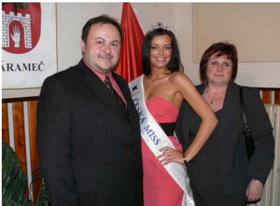
Miss se starostkou Nárámče a starostou Budišova