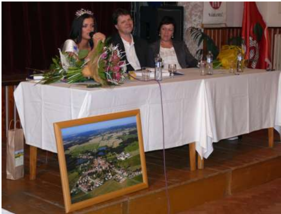
Miss s rodiči

Obec jí připravila v kulturním sále velkolepé přivítání, málokdo chyběl (včetně novinářů). Nechyběla ani autogramiáda, ohňostroj a koncert miss s její skupinou Spirit Rock.