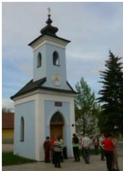
kaple sv. Gotharda v Horákově