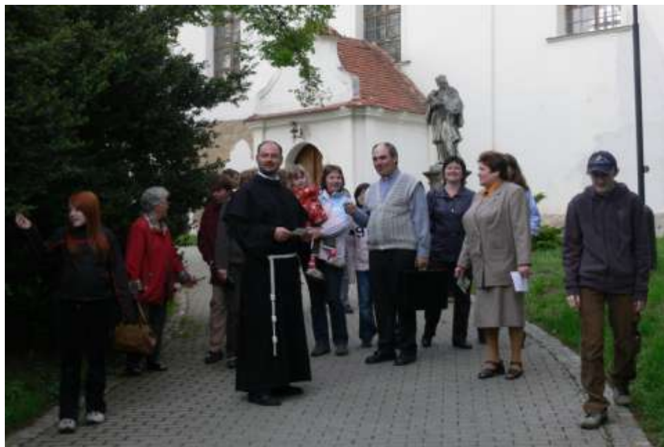
Přivítání v Modřicích

prohlédli kostel a faru a byli pozváni i k poutním oslavám, ba si i zazpívali. Nikomu nevadil návrat do Budišova v pozdních hodinách.