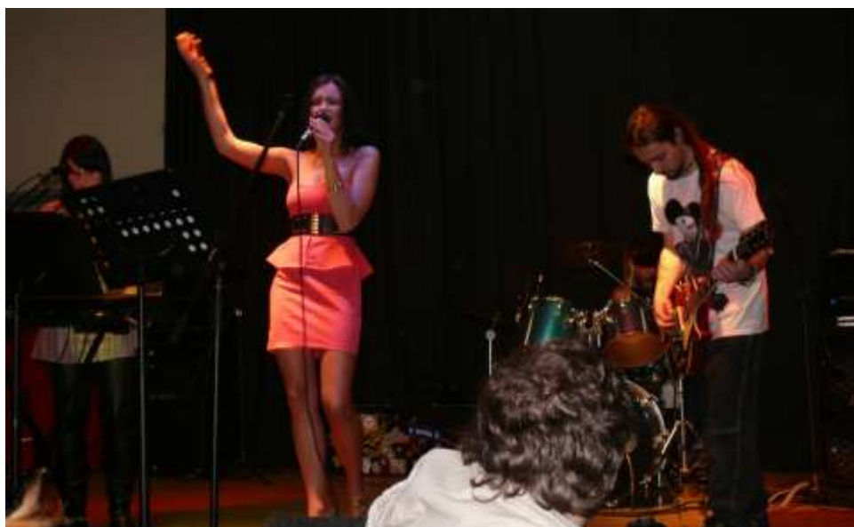
Miss se Spirit Rock