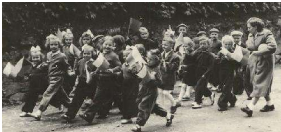
Mateřská škola ve spartakiádním průvodu 29. května 1955