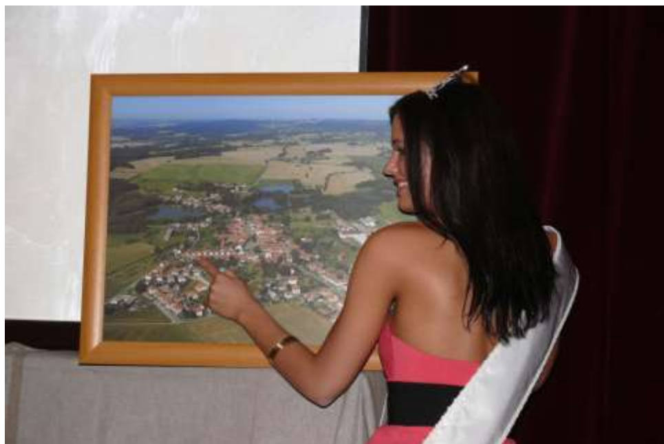
Miss se svým bydlištěm