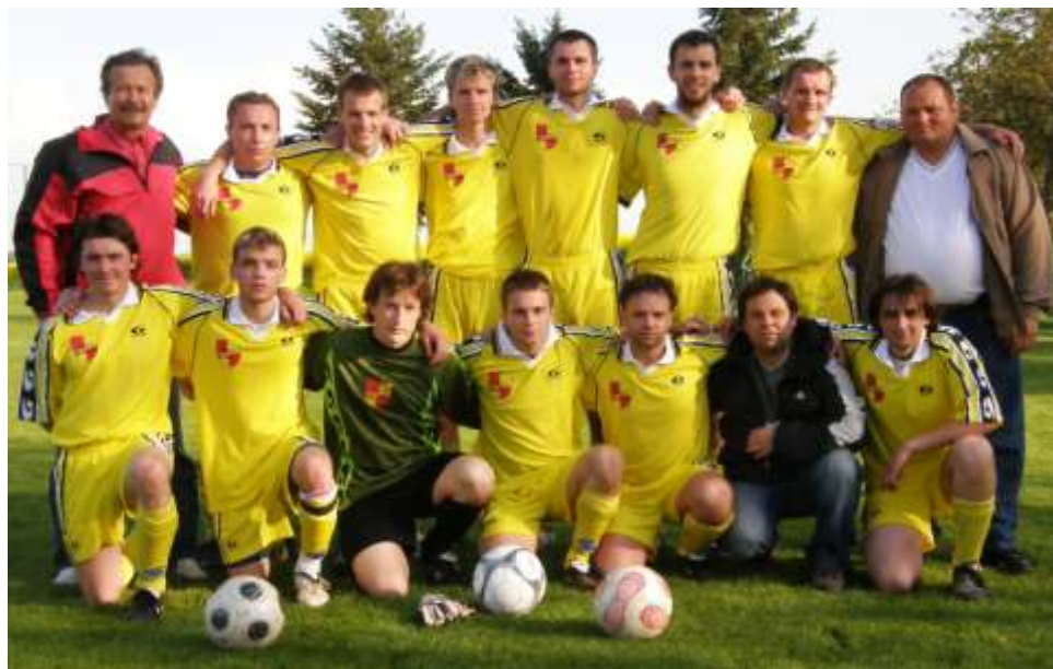
Mužstvo po vítězném utkání s Rantířovem

Vítězství nad silným mužstvem z Rantířova ukázalo na fakt, že přes dvě stě diváků, kteří chodí pravidelně na domácí utkání, nemusí (v případě, že mladí u fotbalu vydrží) mít o budoucnost našeho mužstva obavy.