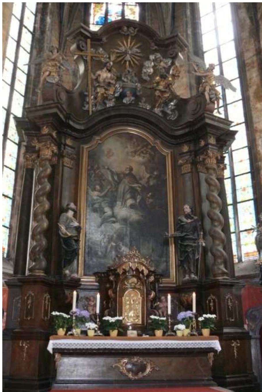
Ještě z loňska oltář ve Slaném, jehož fotka nedopatřením vypadla