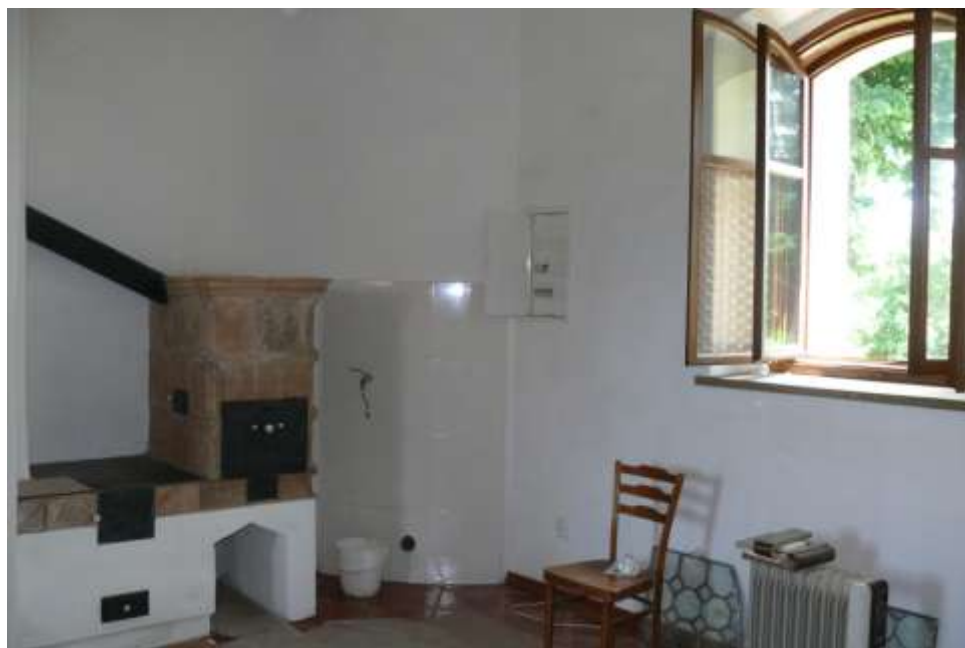
...bude multikulturním prostorem