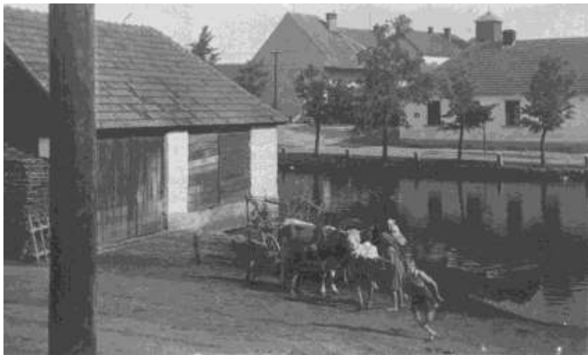
Jedeme na pole, červenec 1941

uklouzla noha a on zmizel pod hladinou. Toník Škarků – kovářů pohotově přiskočil a podal mu bidlo, aby se chytil. Ostatní pak pomohli bratra vytáhnout. Skončilo to jen velkou rýmou.