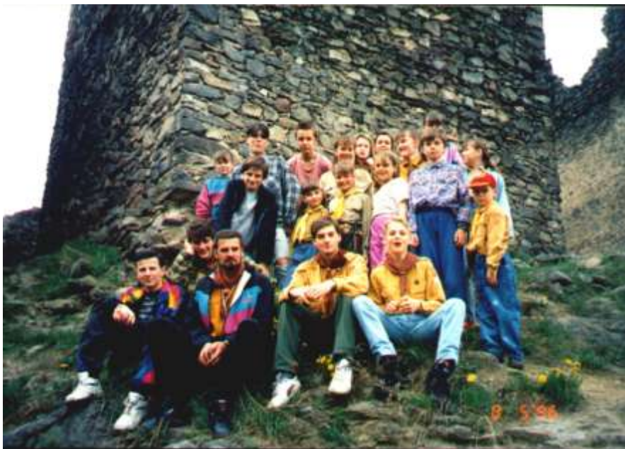
Z výpravy ke zřícenině hradu Rokštejn – 8. 5. 1996

Od roku 1990 do r.1994 se neustále zvyšuje členská základna. Pestrá činnost oddílů i společné akce střediska neustále přitahují do oddílů další členy. S více než 120 členy jsme největší junácké středisko mimo okresní město. Středisko pomáhá místnímu zemědělskému družstvu při sběru kamení, brambor a obracení lnu a za získané peníze pořizuje táborové a sportovní vybavení, zbývá i na pravidelné plavání v třebíčském bazénu, kam jezdíme 1x měsíčně po celou provozní sezónu. Vyvrcholením celoroční činnosti oddílů bývá letní tábor. První střediskový tábor se konal v r.1991 ve Svatoslavi. Zde jsme tábořili na půjčeném tábořišti skautů z Koutů, rovněž vybavení bylo vypůjčené. K rybníku ale byla hodina cesty, proto jsme věnovali mnoho úsilí pro vyhledání nového tábořiště. Podařilo se, od r.1992 táboříme na břehu Znětínského rybníka u Pavlova na Žďársku. Na druhém táboře máme ještě část vybavení půjčeného, ale převážná většina je již vlastního. To značně snižuje náklady na tábor a naše tábory stále patří k nejlépeším. (Pro srovnání letošních 16 dní tábora stojí 1500,- Kč, 14-ti denní podnikový tábor v Mrákotíně 2650,- Kč.). V dalších letech postupně doplňujeme táborové vybavení tak, že nyní používáme jen vlastní majetek.