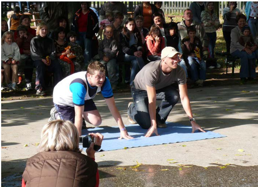
2008 – moderátoři