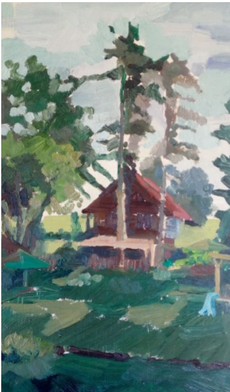
„Čihavka“, olej na desce, 40 × 20 cm, 2020