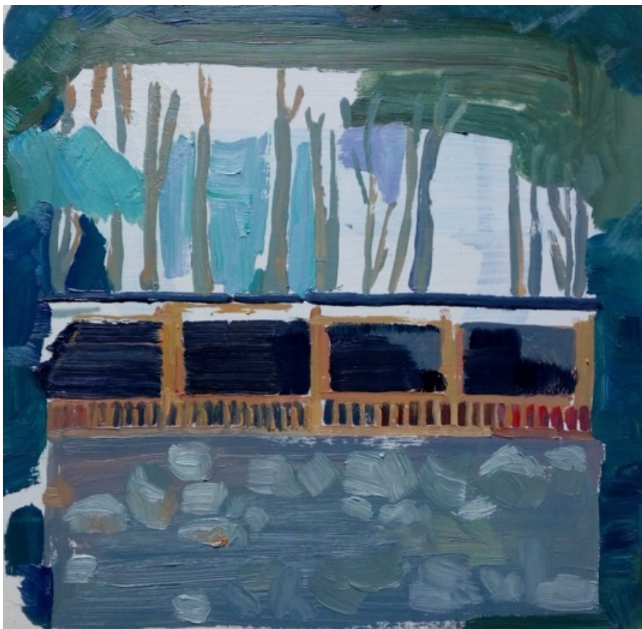
„Chatka“, olej na desce, 30 × 30 cm, 2020