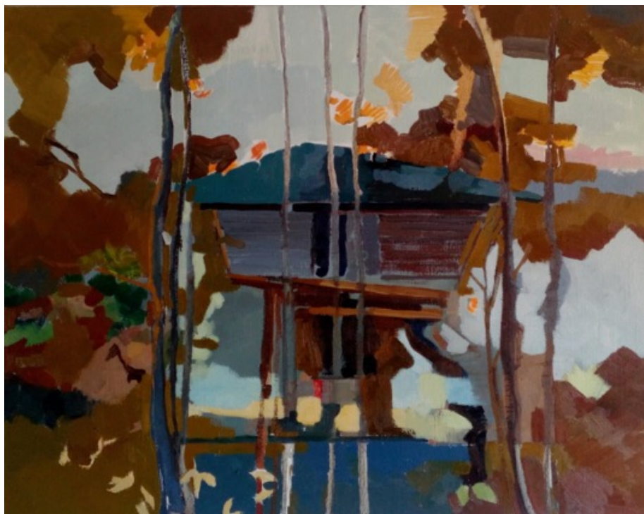
„Čáry v domě na stromě“, olej na plátně, 80 × 100 cm, 2020