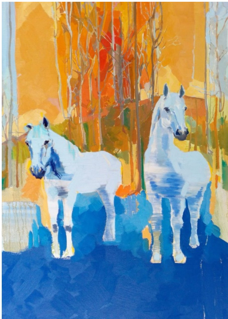
„Modrý koně u Pocoucova“, olej na plátně, 90 × 125 cm, 2020