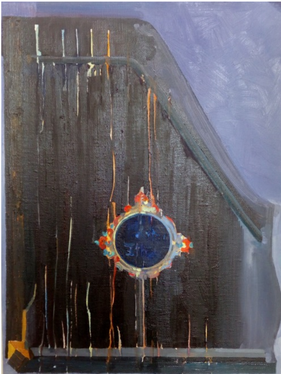
„Babiččina citera“, olej na plátně, 60 × 45 cm, 2019