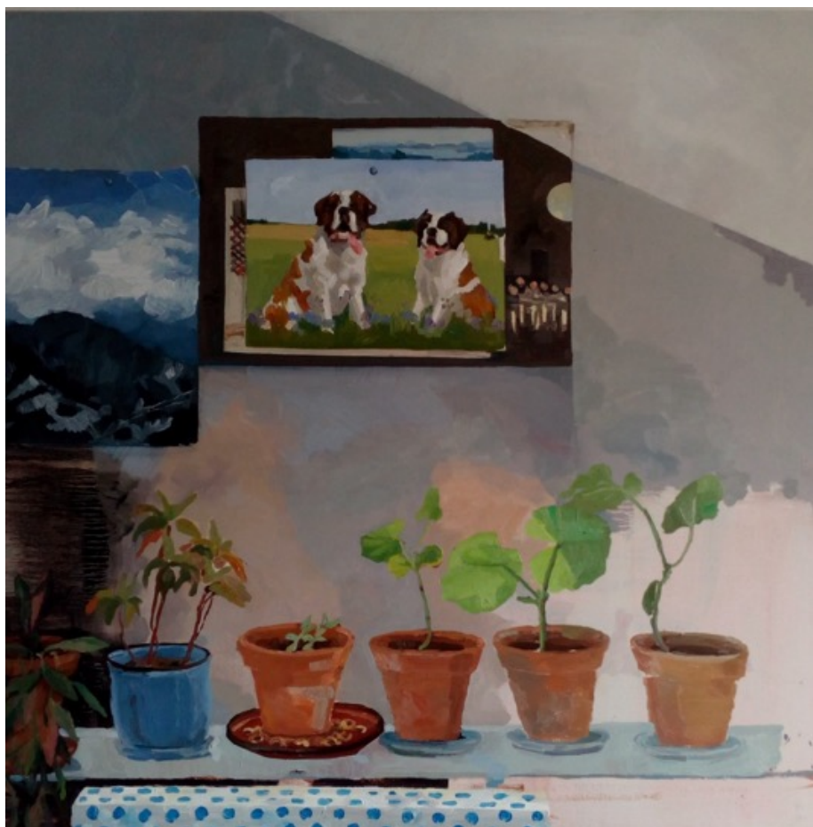
„Pohlednice se psama“, olej na plátně, 100 × 100 cm, 2020