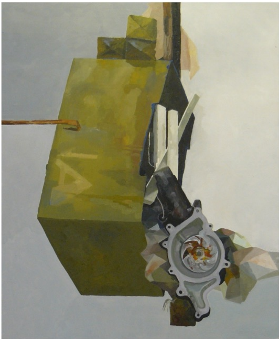
„Papírové IA“, olej na plátně, 130 × 170 cm, 2014