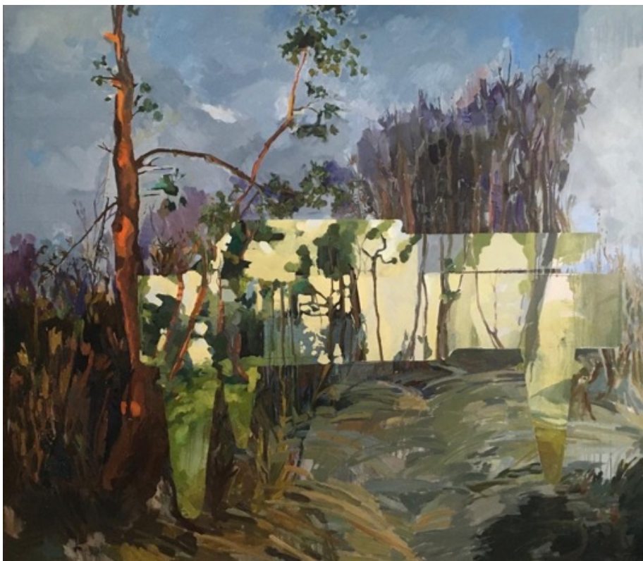
„Původní piano“, olej na plátně, cca 140 × 160 cm, 2022