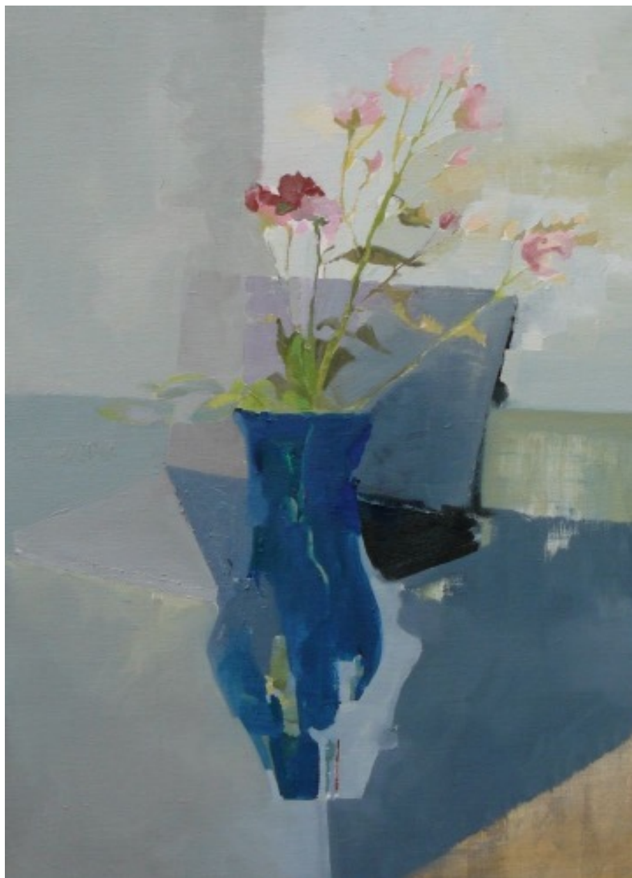
„Růže a notebook“, olej na plátně, 70 × 50 cm, 2016