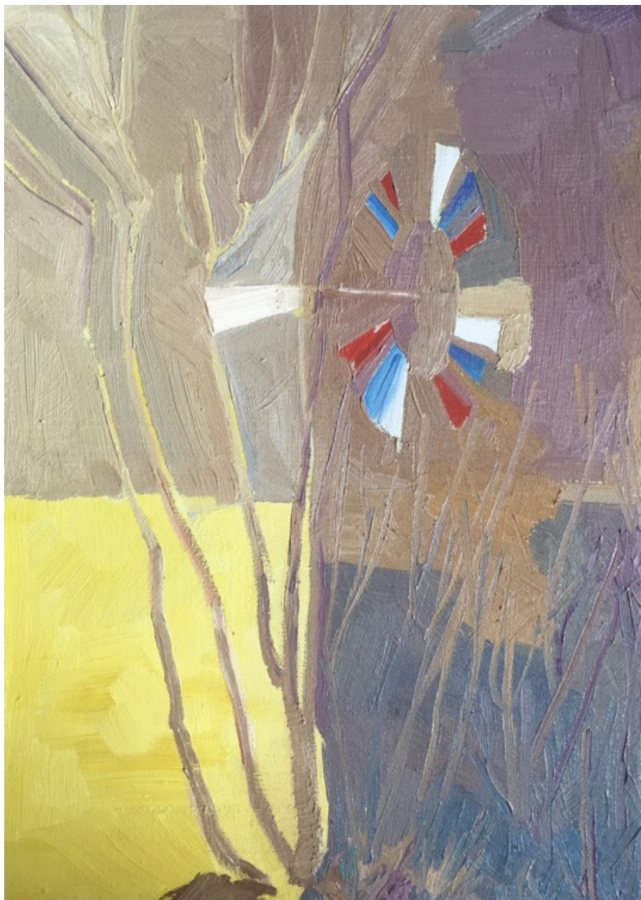
„Větrné čerpadlo u řeky“, olej na plátně, 35 × 25 cm, 2021