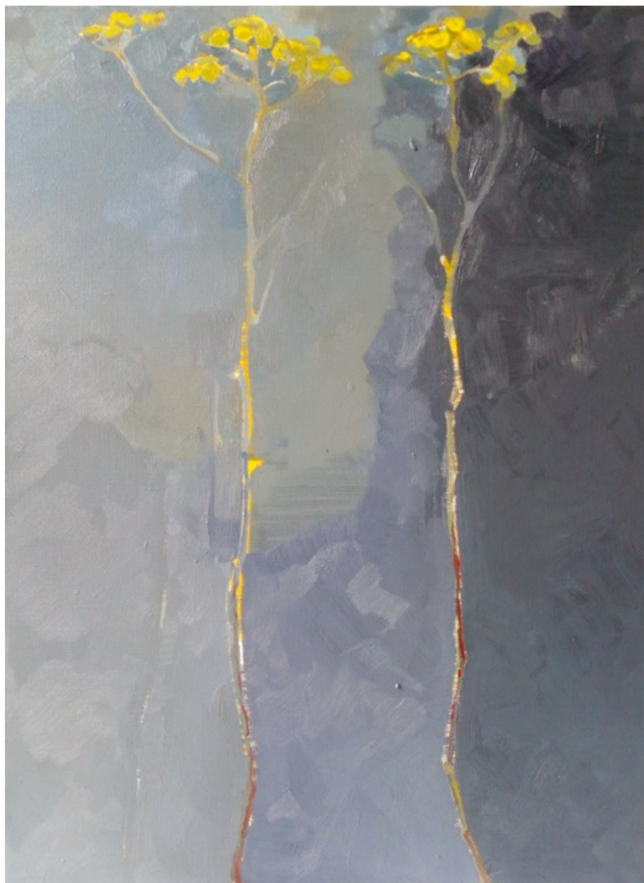
„Hodně barevný obraz, málo barevný kytky“, olej na plátně, 55×75 cm, 2019