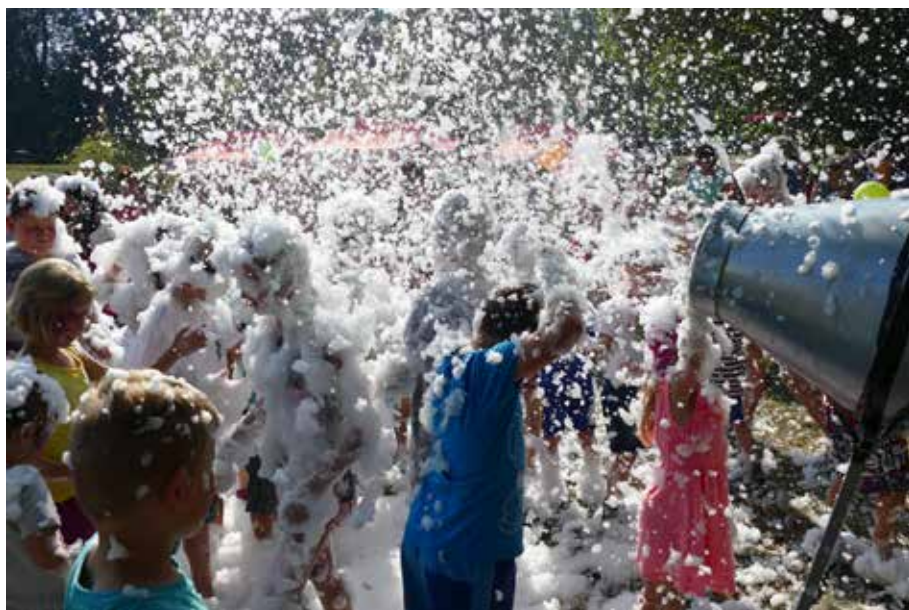
č. 3/2016, str. 21