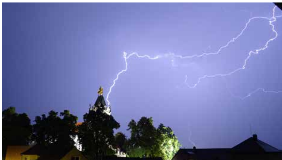
Budišovský zpravodaj č. 4/2022, str. 70