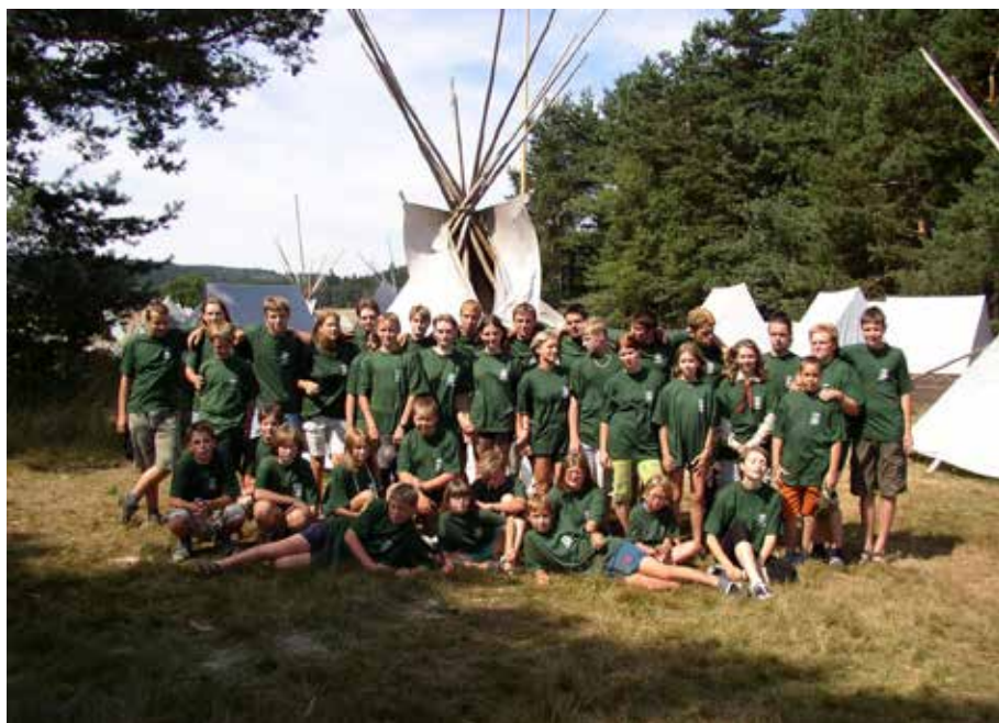
č. 4/2003, str. 45