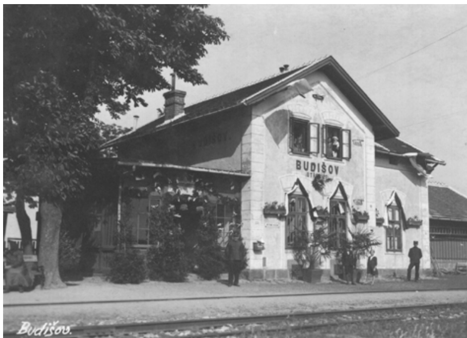
č. 4/1999, str. 8