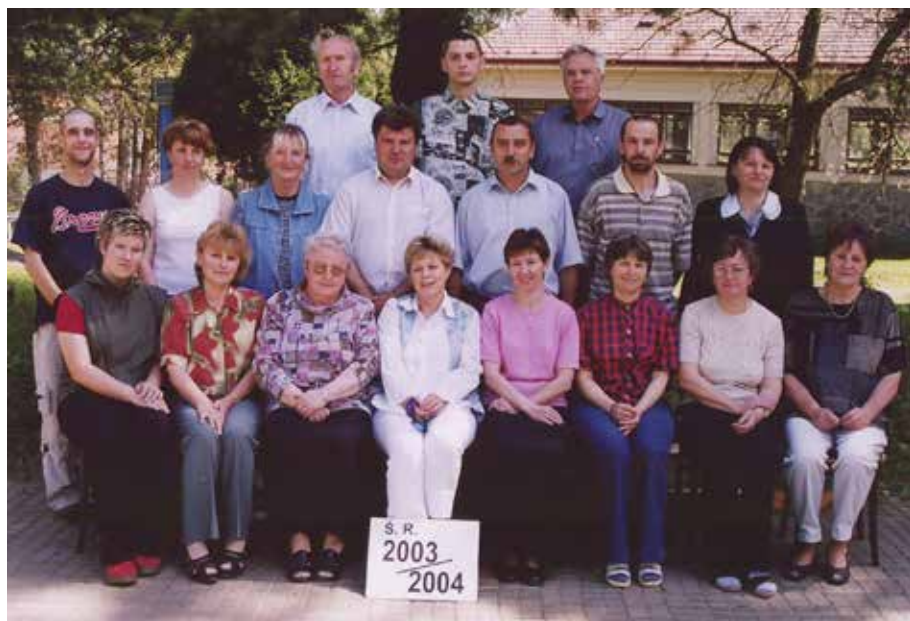
č. 4/2005, příloha str. 16