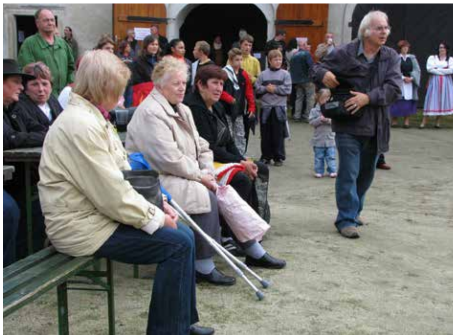
Budišovský zpravodaj č. 4/2013, str. 8

Zodpovědnost za pokus o shrnutí historie Budišovského zpravodaje převzal