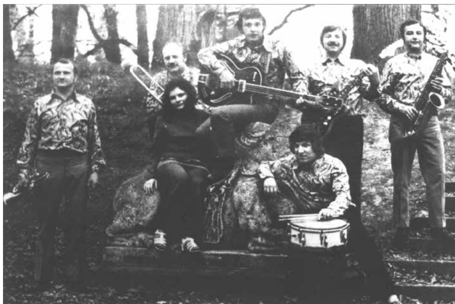
č. 1/2000, str. 16