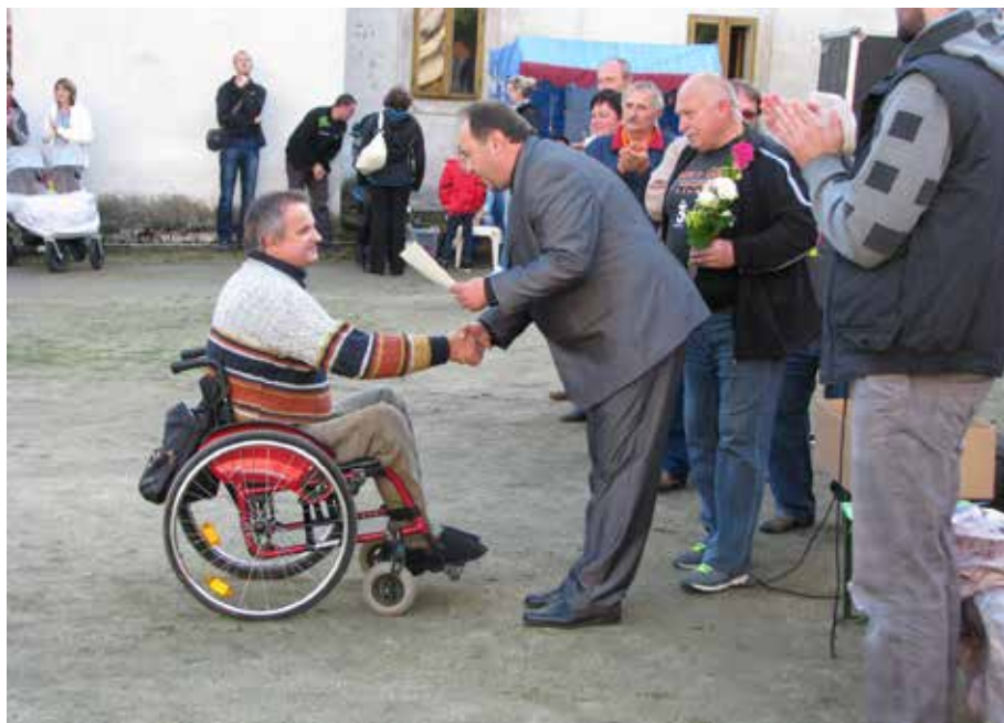
Budišovský zpravodaj č. 4/2013, str. 9