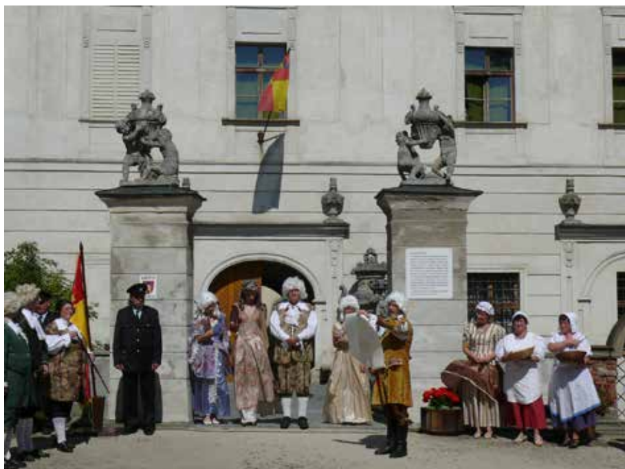
č. 3/2008, příloha str. 13