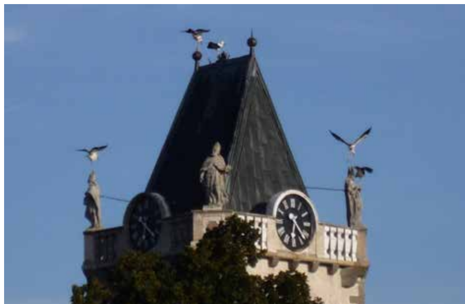
č. 2/2010, str. 77