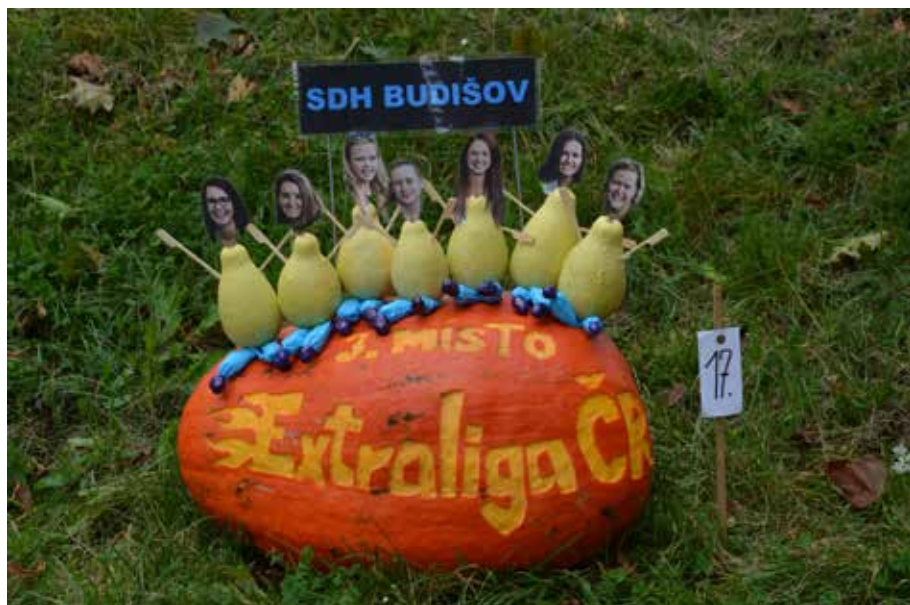
č. 4/2020, str. 43