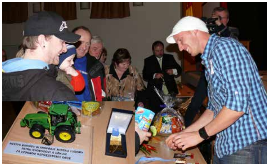
č. 1/2011, str. 69