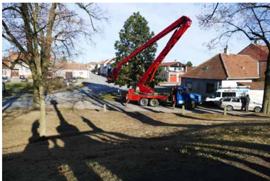
č. 4/2021, str. 58