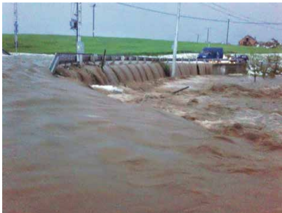
č. 2/2014, str. 25