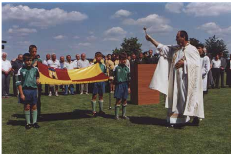
č. 3/2002, příloha str. 9