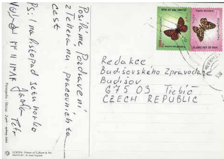
č. 1/2006, str. 70