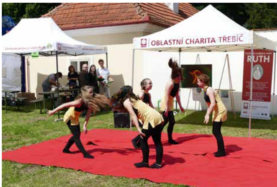
č. 2/2018, str. 19