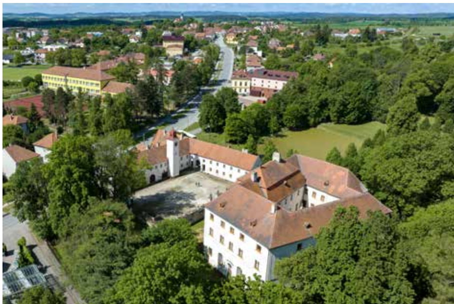
Budišovský zpravodaj č. 2/2022, str. 33