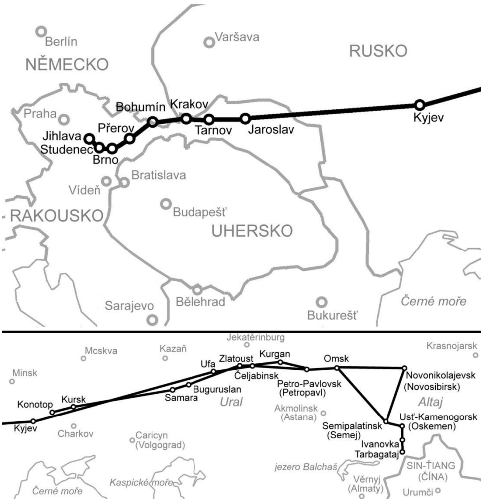
Mapky přibližné cesty zajatců 1914–1916 (místy v textu chybějící či nejasné geografické názvy)