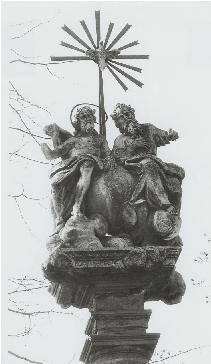
Sloup Nejsvětější Trojice