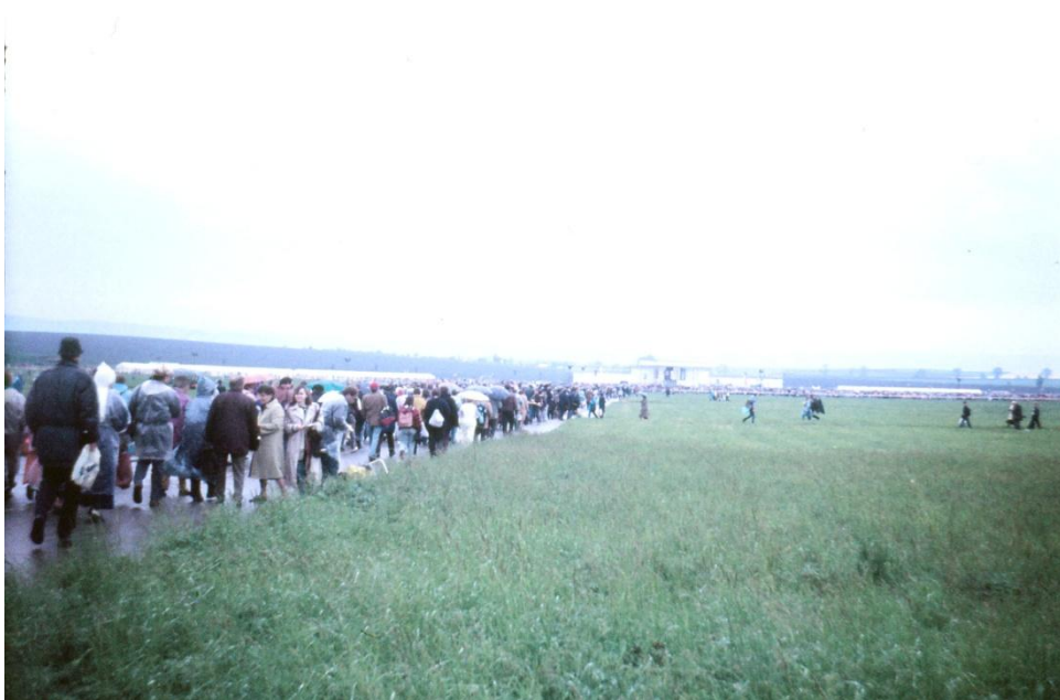
Děšť a mlha na letišti v Olomouci 21. 5. 2005

Lidová strana v Budišově ve spojení s farníky uspořádala 21. května autobusový zájezd do Olomouce na svatořečení blahoslaveného Jana Sarkandra a blahoslavené Zdislavy z Lemberka. Velice nevlídné počasí, které slavnost provázelo, neubralo nic na jedinečné atmosféře vyvolané přítomností papeže Jana Pavla II.