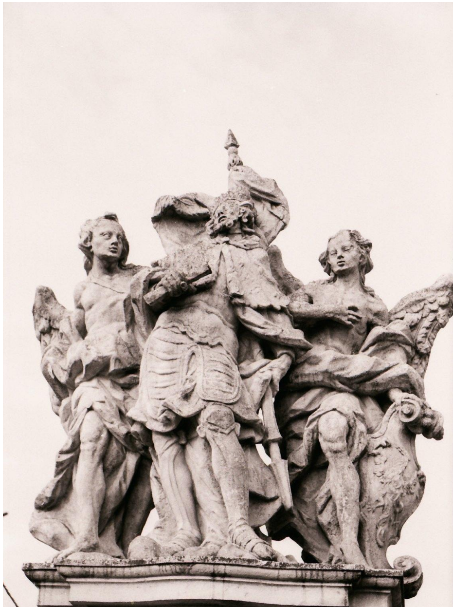
Sousoší sv. Václava