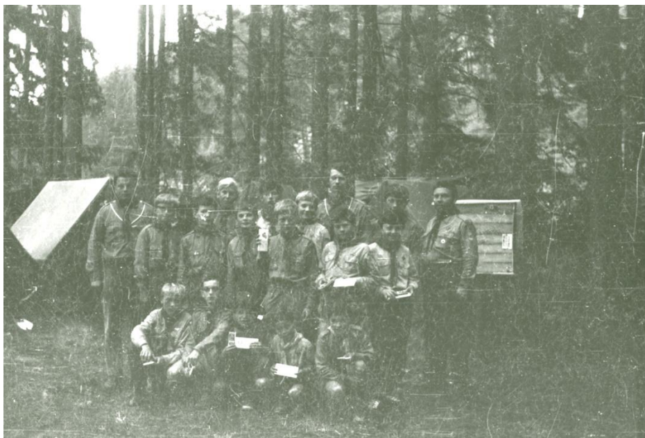
Účastníci tábora Svítlov 70