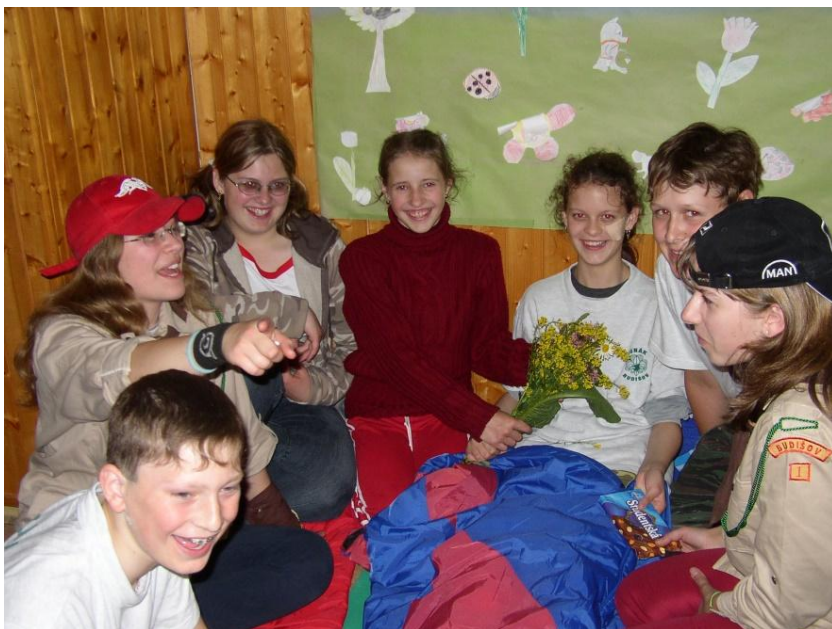
Na Exzodu v Chotěboři (2006)