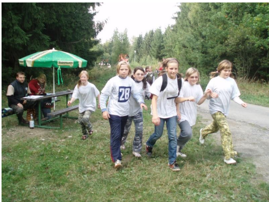
Kobyly při závodě