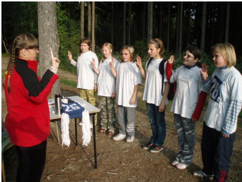
Kobylky v cíli celostátního kola