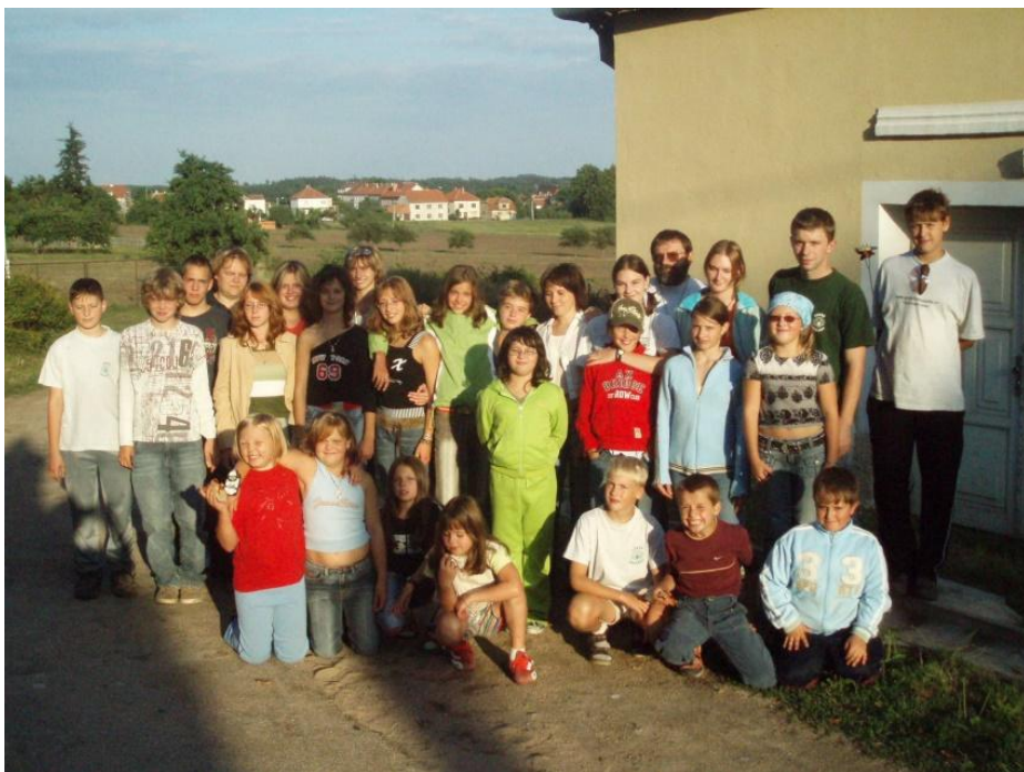
Klubovna a její obyvatelé

pro naši činnost vhodný. Díky sponzorům se nám podařilo zajistit finanční prostředky pro jeho pořízení a koncem roku 1995 jsme se stěhovali konečně do svého. Klubovnu jsme upravili pro své potřeby a dále průběžně pracovali na její celkové opravě. V budově byla zbudována nová elektroinstalace, omítnuty vnitřní prostory, srovnány podlahy do jednotné úrovně a položena dlažba, provedena kompletní výměna střechy včetně krovů a postavena přístavba, kde je kuchyňka, umývárna a WC. V loňském roce jsme provedli výměnu dveří, neboť ty původní již dosloužily. Na příští rok připravujeme generální opravu opěrné zidky za klubovnou.