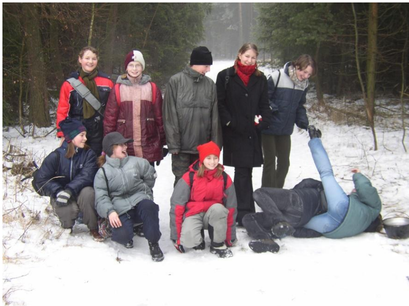
Zimní výprava (2003)