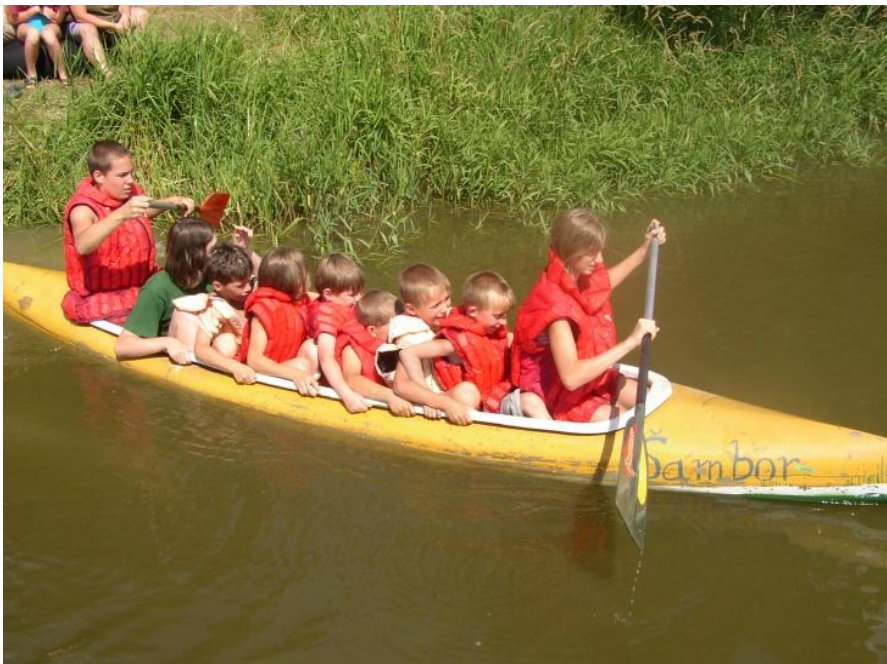
Úplně plné kánoe