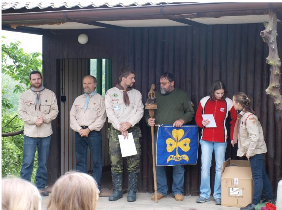
Putovní trofeje pro vítěze Závodů včlat a světlušek v Budišově (2014)