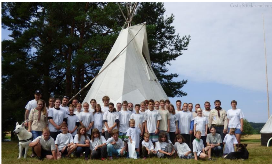
Účastníci tábora 2017