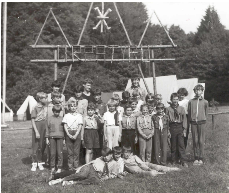
První porevoluční táborníci (Svatoslav 1991)

Zde je jejich přehled. Kdyby se někomu zdály být názvy táborů nesrozumitelné, tak jen pro vysvětlení. Název tábora je složen z počátečních písmen nebo slabik jmen družin na táboře, následuje místo konání tábora, pořadatel a poslední údaj v řádce je počet účastníků. Bohužel, některé údaje se nepodařilo z různých důvodů dohledat.