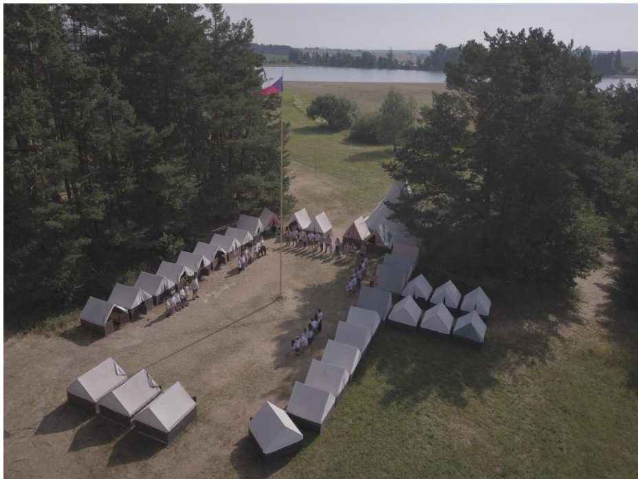
Tábor, který nám mnozí závidí (2018)

Na rozloučenou jeden moc pěkný pohled na tábor z výšky. Škoda, že letos rybáři Znětínský rybník letnili, plocha rybníka by byla o mnoho větší. Do dalších let přeji našim junákům a skautkám mnoho úspěchů při soutěžích a hodně podobných krásných pohledů, vždyť na tábore děti získají mnoho zkušeností, které se jim budou hodit po celý život.