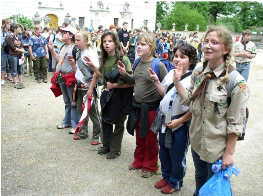
Družina našich skautek na okresním kole v Budišově (2007)