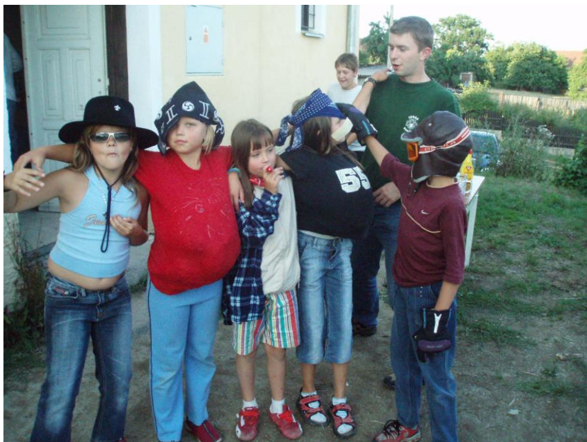
Soutěžní odpoledne v klubovně (2006)