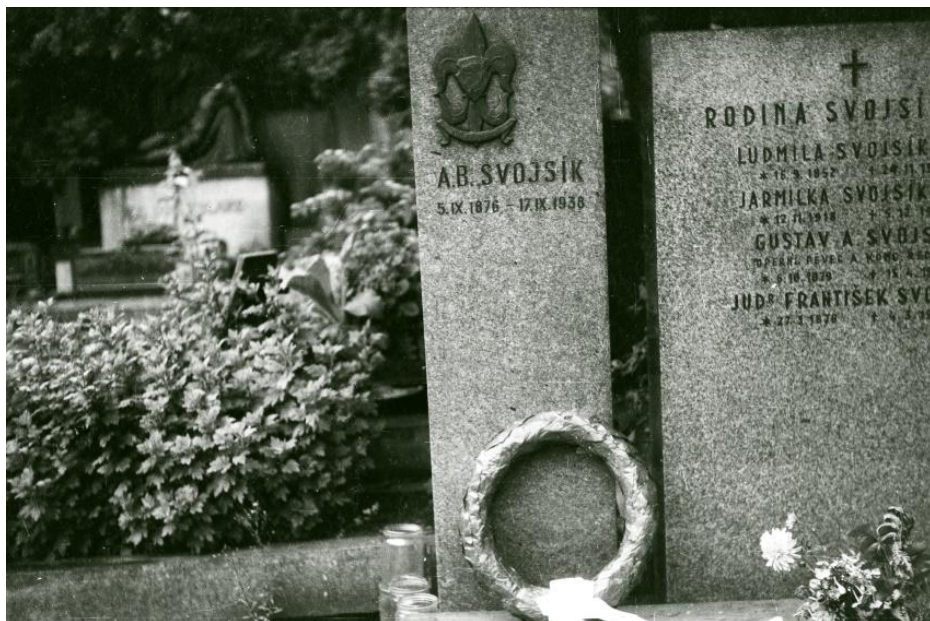
Položený věnec u hrobu zakladatele Junáka na vyšehradském hřbitově

Protože jsme si při své junácké činnosti vydělali nějaké peníze, které jsme chtěli i jako junáci utratit, rozhodlo vedení střediska o uskutečnění autobusového zájezdu do Prahy a okolí. Zájezd byl dvoudenní (22.–23. 8. 1970) – v sobotu pobyt v Praze, kde jsme navštívili Vítkov, Vyšehrad, Petřín, Staroměstské náměstí s orlojem, Hradčany, dále Technické muzeum, Letiště Ruzyň a Václavské náměstí, odkud jsme odjeli na ubytovnu v Kobylisích, kde jsme přenocovali. Nedělní dopoledne jsme strávili v zoologické zahradě, odkud jsme odjeli na Karlštejn. Po prohlídce hradu jsme pokračovali na Slapskou přehradu a pak na Konopiště, které jsme si prohlédli jen zvenku, neboť jsme tam přijeli a zámek byl již zavřen. Z Konopiště jsme se vydali již na cestu domů, zastavili jsme se ještě na večeri v Pelhřimově a do Budišova přijeli chvíli před půlnocí. Jen tak pro zajímavost, tehdejší ceny vstupenek byly velice lidové – Petřín (rozhledna a zrcadlové bludiště) 5,- Kčs, Technické muzeum 1,- Kčs, Pražský hrad (Obrazárna, Klenotnice, Hrobka českých králů, Královský palác, Bazilika sv. Jiří a Daliborka) 2,- Kčs.