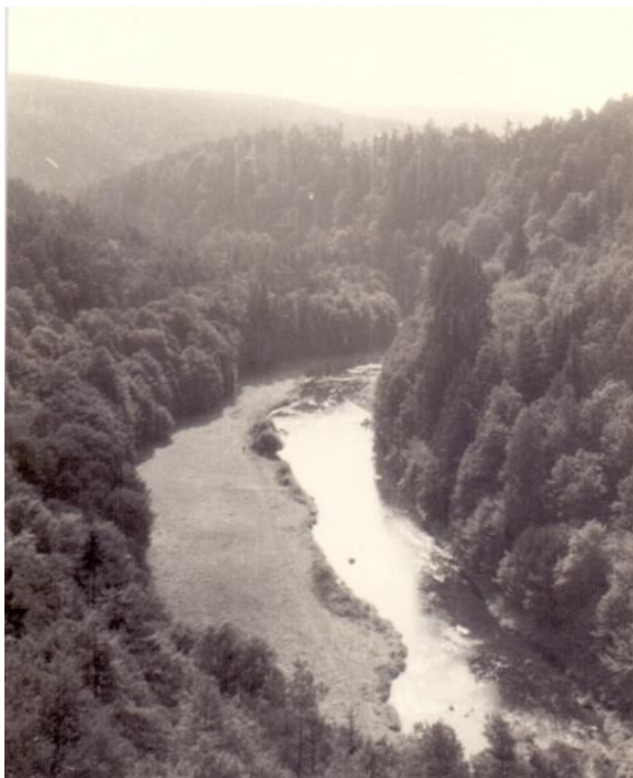
Pohled z Wilsonky dolů na dnes zatopené údolí Jihlavy