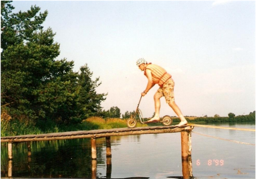
Legendární závody na koloběžce (1999)