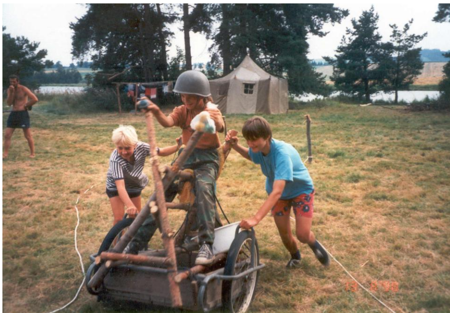
Jezdec na netradičním oři (1998)