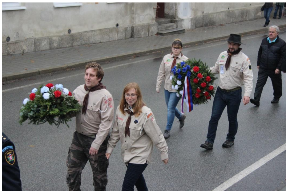
Při kladení věnců – 100 let republiky