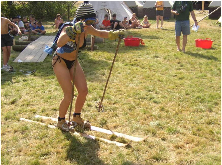
I na táboře se dá lyžovat (2004)