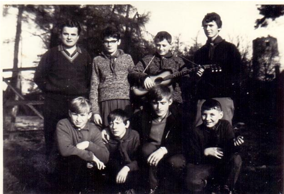
Družina Rysů 24. 12. 1968