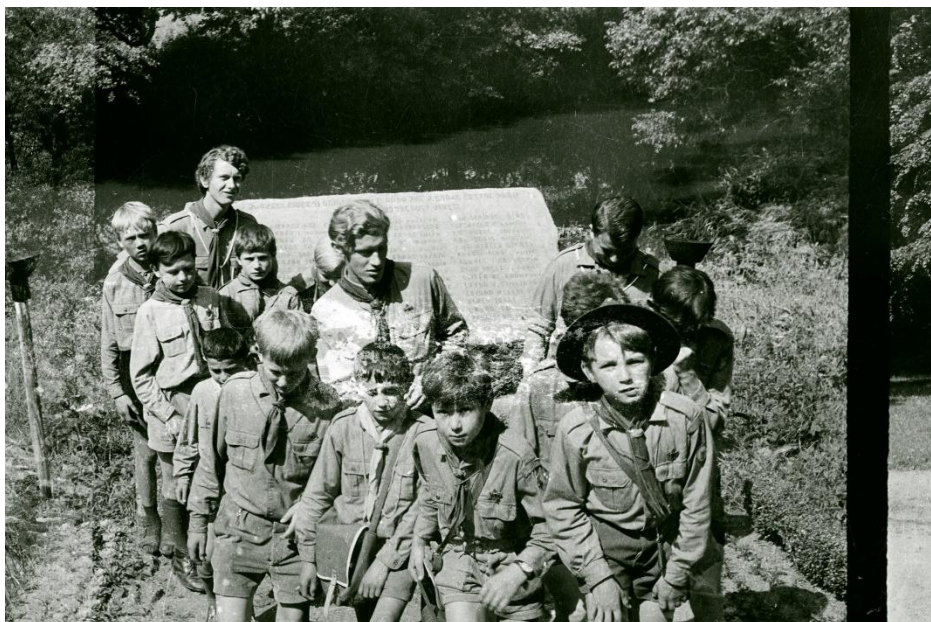
Na výpravě do Velkého Meziříčí