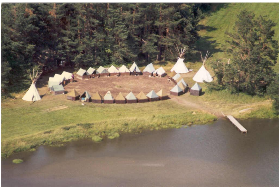
Pohled na tábor z letadla (1997)