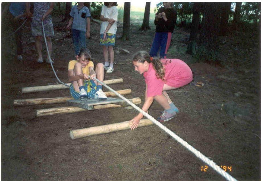
Jízda králů (tentokrát královen)