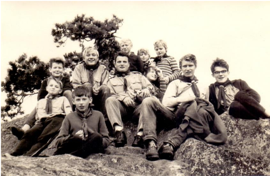
Na Wilsonově skále