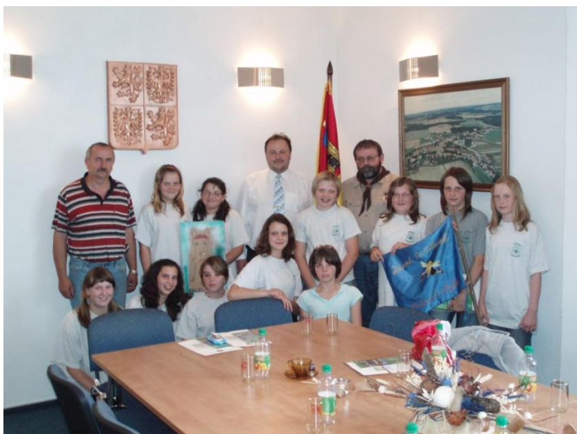
Přijetí u starosty po vítězství v krajském kole