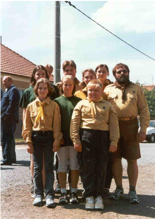
Junáci při svěcení obecního praporu (2002)

Každý skautský rok je naplněn rozmanitou činností. Děti všech věkových kategorií získávají na družinových schůzkách a oddílových akcích junácké dovednosti a znalosti, seznamují se s poskytováním první pomoci a základní zdravotvědou, poznávají přírodniny a přírodu, sportují, připravují se na junácké soutěže – Závody vlčat a světlušek, Svojsíkův závod pro junáky a pro skautky O vlajku náčelní. Každoročně pak probíhají na podzim soutěže Indiánského léta. Rovněž se zúčastňují dalších různých akcí pořádaných oddíly, středisky nebo radami Junáka. Koncem školního roku se připravujeme na tábor. V době po revoluci, kdy ještě po ránu a večer jezdily vlaky, jsme několikrát ročně vyráželi za poznáním na jednodenní výpravy do okolí.