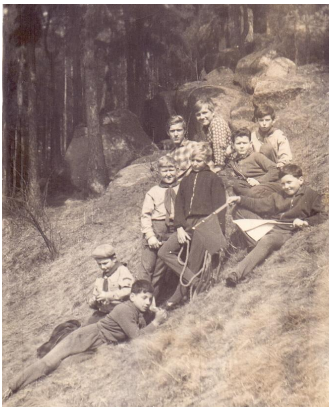
Družina Lišáků 5. 4. 1969