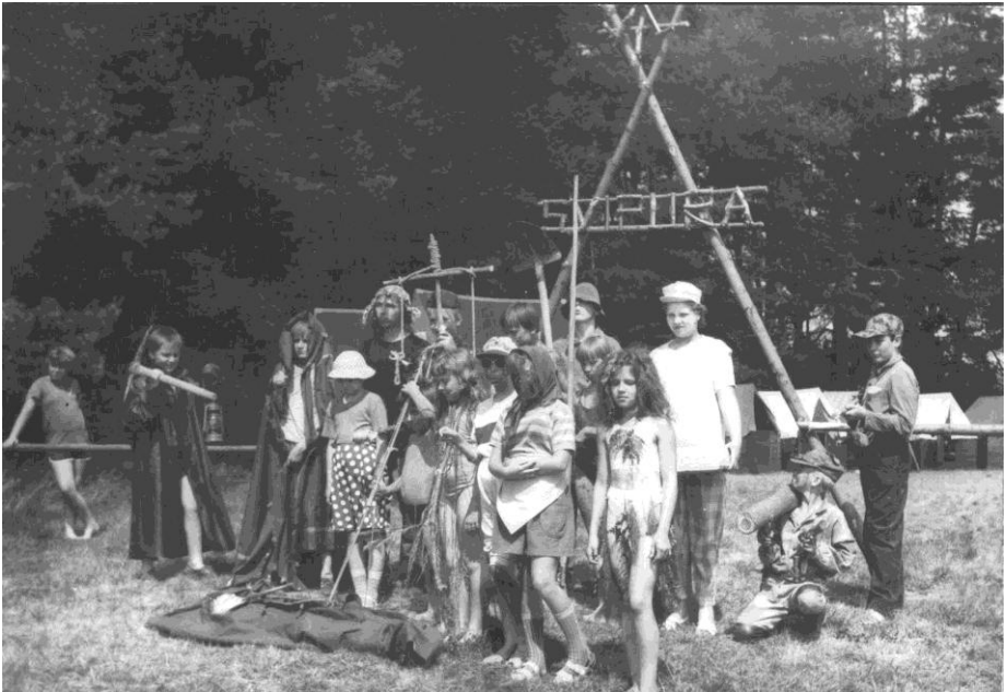
Táborový karneval 1992