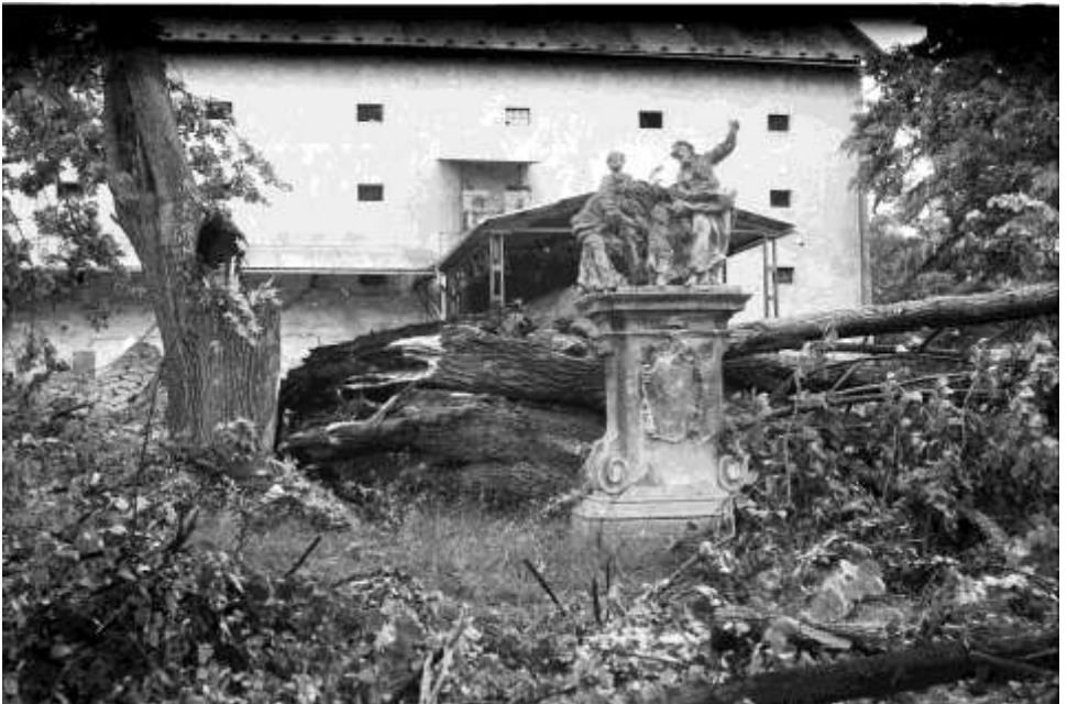
Zničená staletá lípa u sousoší sv. Rodiny (vyhlášený památný strom)

Kromě střech jsou nejvíce poškozeny stromy v zahradách – jsou vyvráceny nebo přepůleny. Ráno nemůžeme poznat naše městečko. Panská zahrada – stromy i nejstarší lípa – vše leží na zemi. Velmi smutný pohled je na zničené naše lesy – Brdca, Kněžský kopec a Holeje.