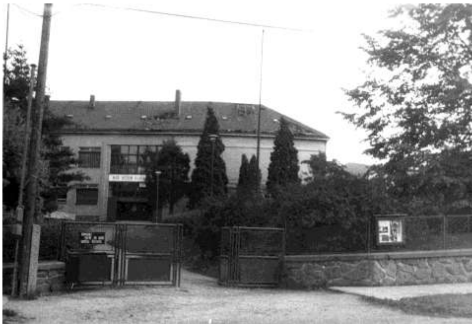
Takto dopadla střecha školy

Větrém bylo zničeno velké množství lesních stromů, stromy byly vyvráceny nebo v půli přeražené. Nejvíce škody bylo v lese pod Zrádným kopcem, na severním svahu Brdců, v lese k Pyšeláku a Na břinčí.