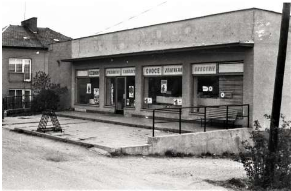
Prodejna potravin u hřiště – dnes restaurace Sport (pozn. red.)