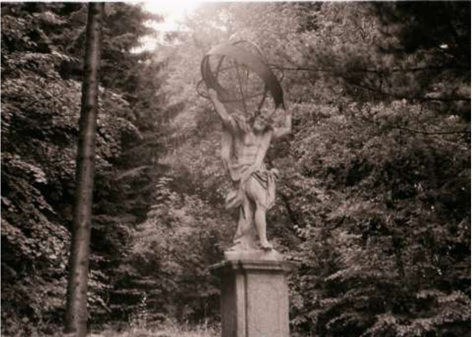
Socha Atlase v zámecké zahradě