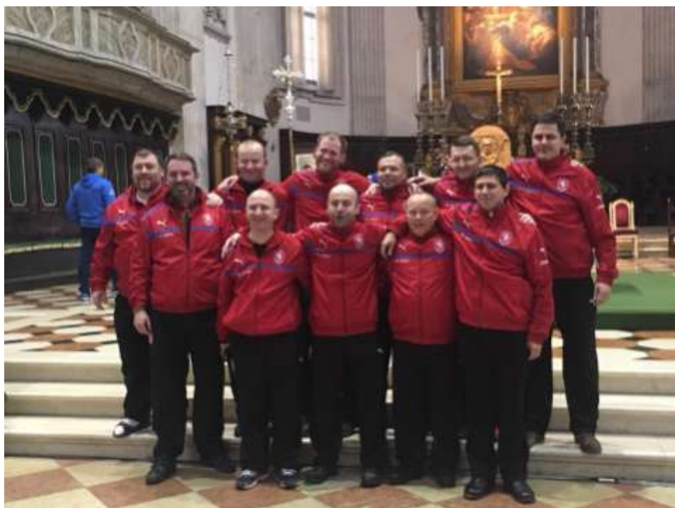
Čeští kněží v katedrále v Brescii