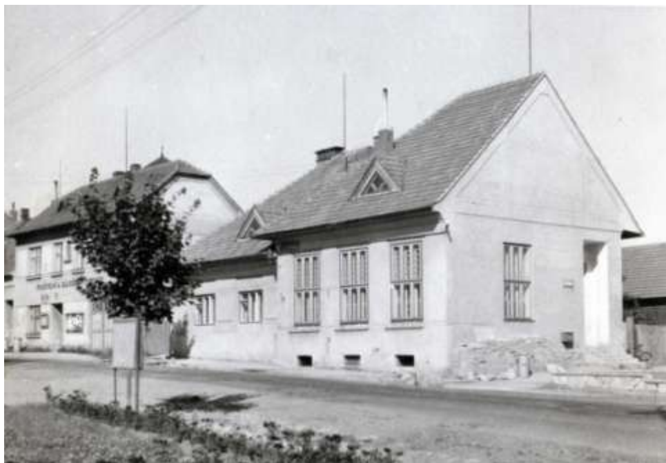
Bývalá budova školy (později pošta, nyní obytný dům)