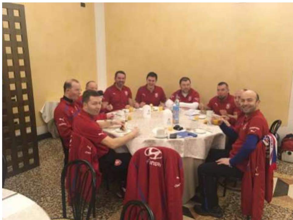
Snídaně v hotelu

Zvítězili Poláci před Portugalskem a Slovenskem. Bramborové byli Maďaři a následovaly Bosna, Rakousko, Chorvatsko, Rumunsko, Itálie, Bělorusko, Albánie, Slovinsko, Česko, Kazachstán, Ukrajina a Černá Hora.