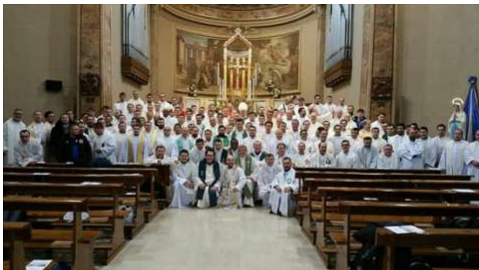
Evropští kněží v Brescii – kdo hledá, najde...