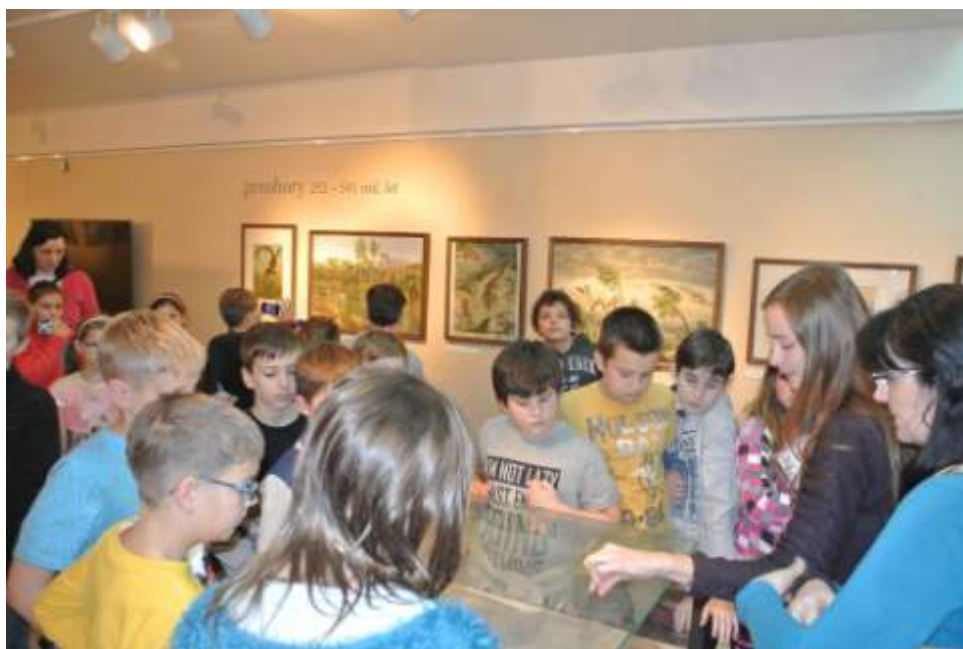
Exkurze do Moravského zemského muzea a Technického muzea v Brně