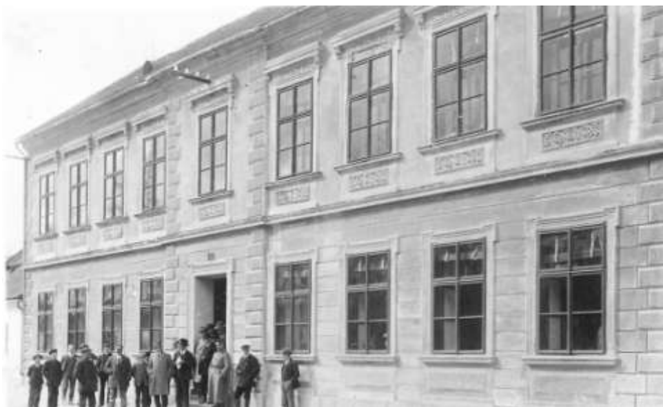
Bývalá budova školy (později národní výbor, nyní obytný dům)