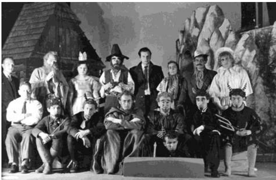
Budišovští ochotníci, rok 1955

Dne 17. a 24. dubna sehrál divadelní kroužek hru Hrátky s čertem. Obě představení měla velký úspěch.