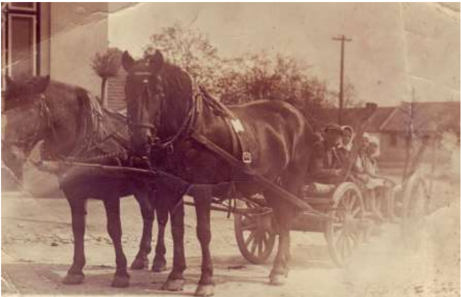
a jejich koně Manda a Greta