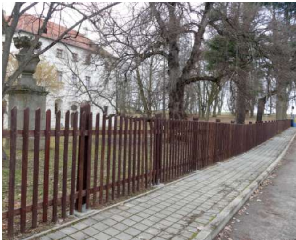
Nová podoba plotu