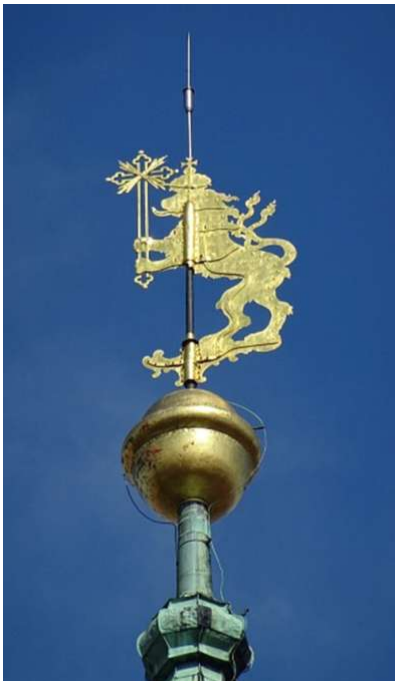
Makovice s korouhví ve tvaru českého lva s křížem