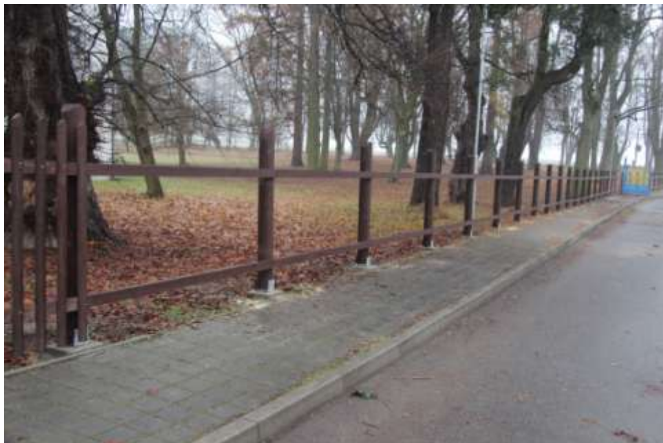
Usazení nových patek, kůlů a rýglů