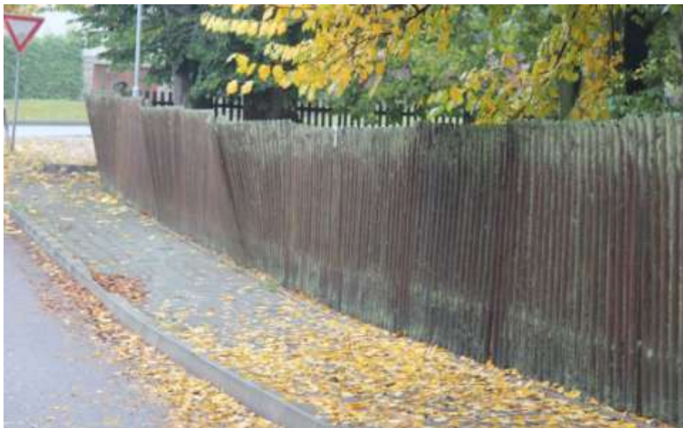
Plot před opravou

Parkoviště (za Zahradnictvím Ing. Molnár) a zámecký plot byly zbudovány v roce 2005. Během posledních dvou let bylo vidět, jak se plot začíná vlnit a různě naklánět. Při stavbě plotu byly dřevěné nosné kůly zabetonovány přímo do země. V průběhu let se do kůly dostala vlhkost, která způsobila jejich zahánívání.