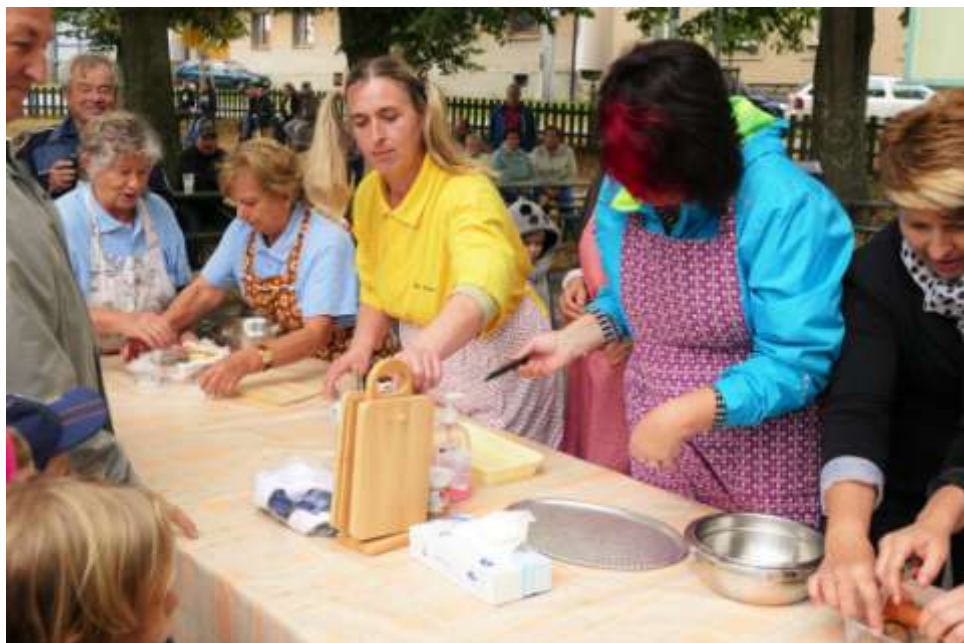
Vaření je dnes módou