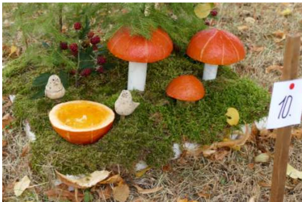
Jediné houby v budišovském katastru 2016