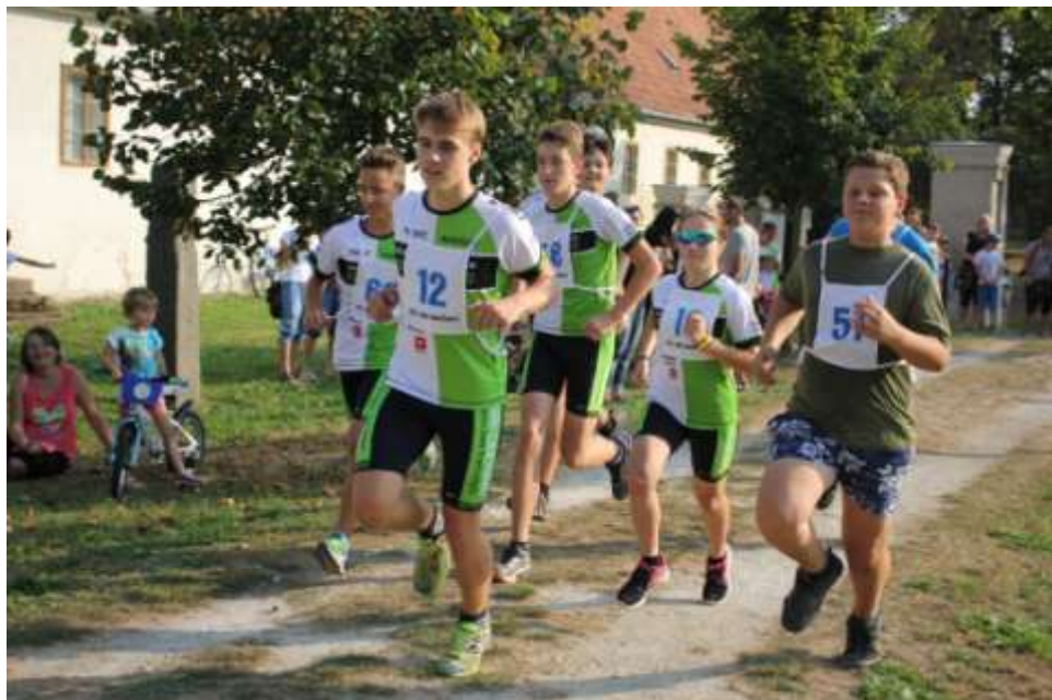
Běh zámeckým parkem

Účastníci běhu přispěli finančním příspěvkem, za který obdrželi barevnou stužku – symbol boje proti rakovině. Za příspěvek všem děkujeme a věříme v podporu i v příštím roce.