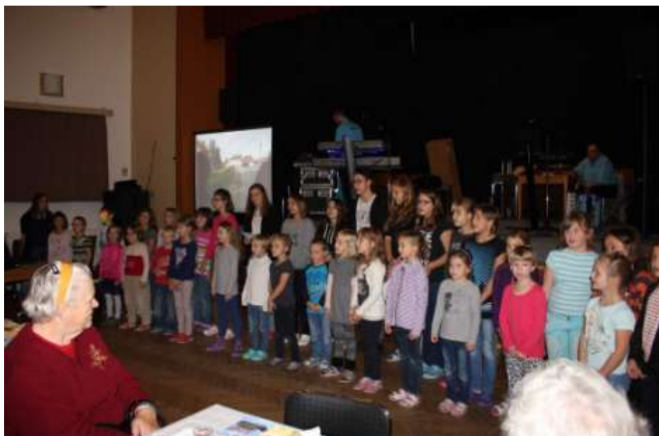
Beseda se spisovatelkou