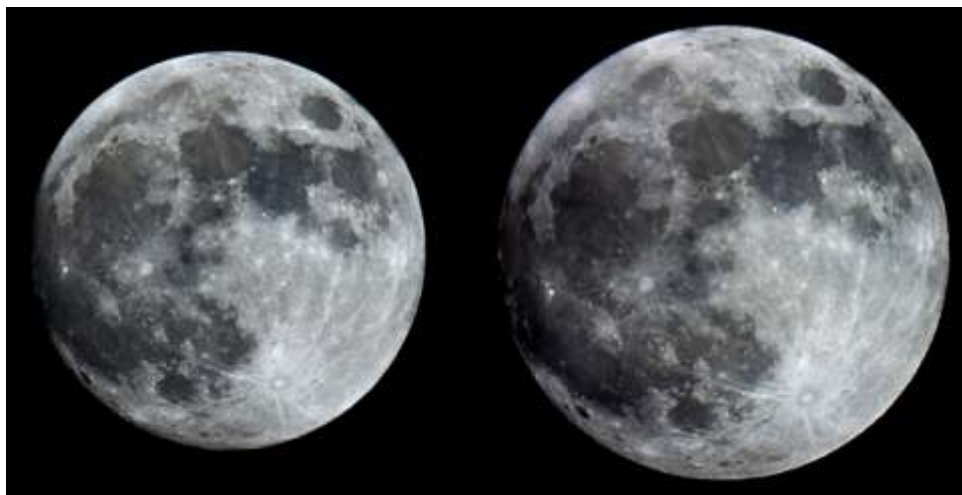
„Nejmenší“ a „největší“ Měsíc

Zdánlivá úhlová velikost Měsíce (úhel, pod kterým ze Země vidíme průměr družice) se tedy mění od 1763,2" v apogeu do 2008,8" v perigeu. Jeví se tedy Měsíc při největším superúplněku o 14 % větší, než při mikroúplněku.