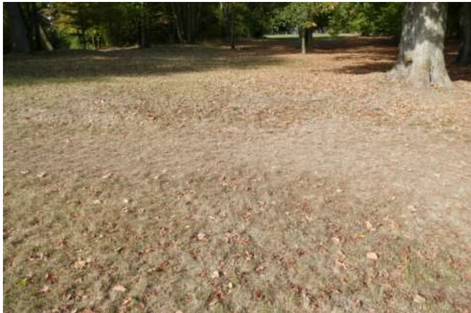
Step v budišovském zámeckém parku 1. října 2016