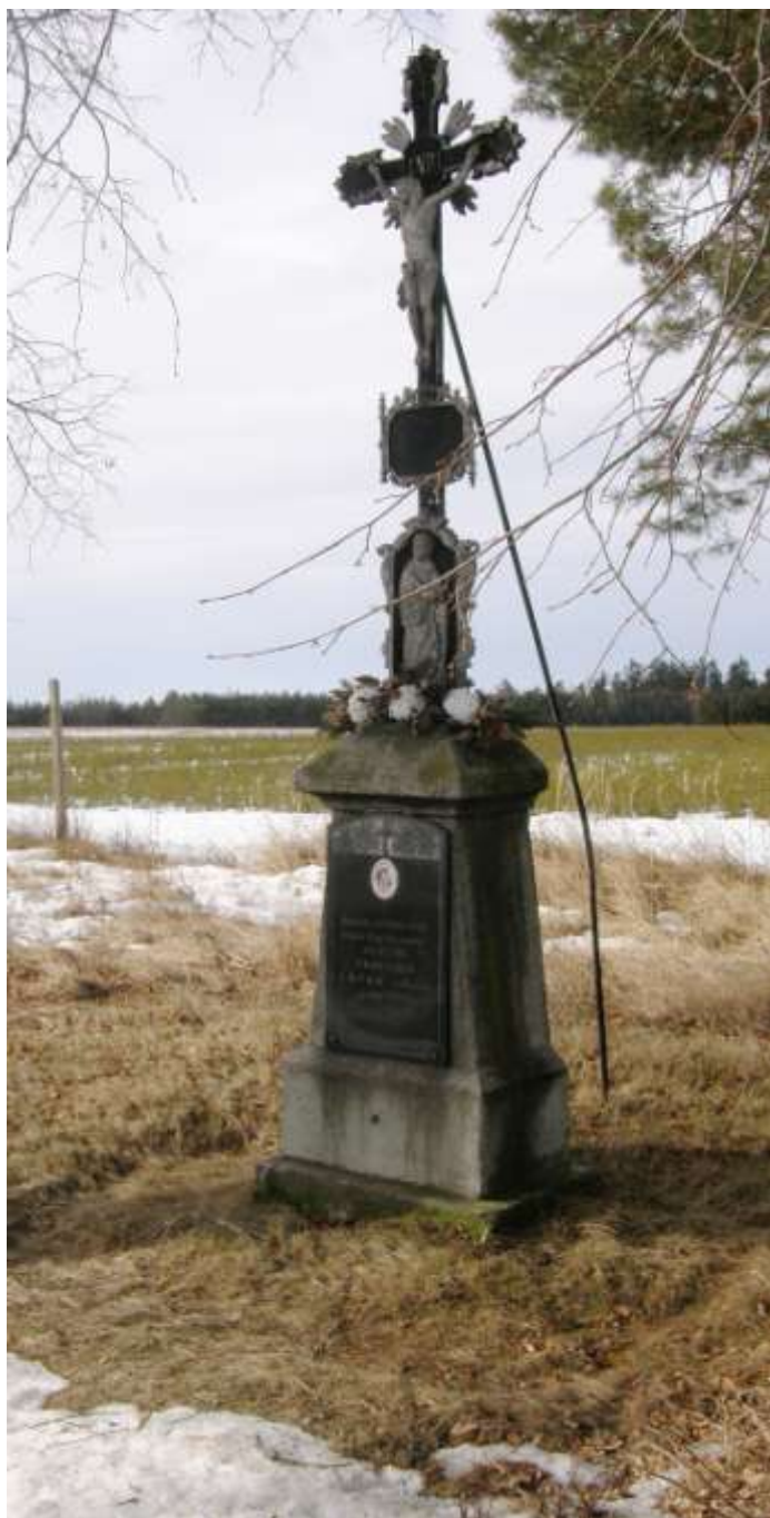
Chybův kříž, u lesních školek Budišov