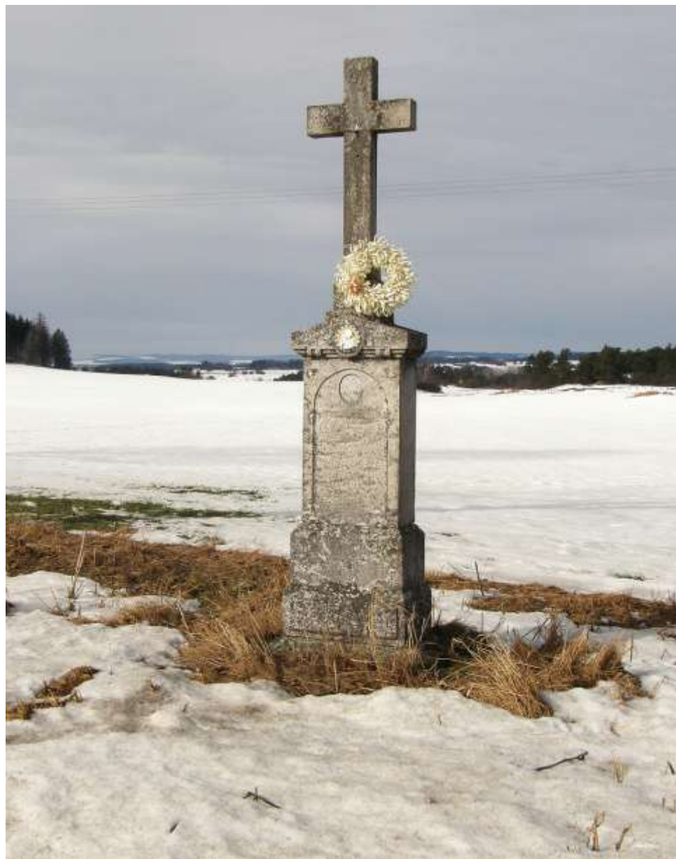
u silnice z Kojatína na Smrk