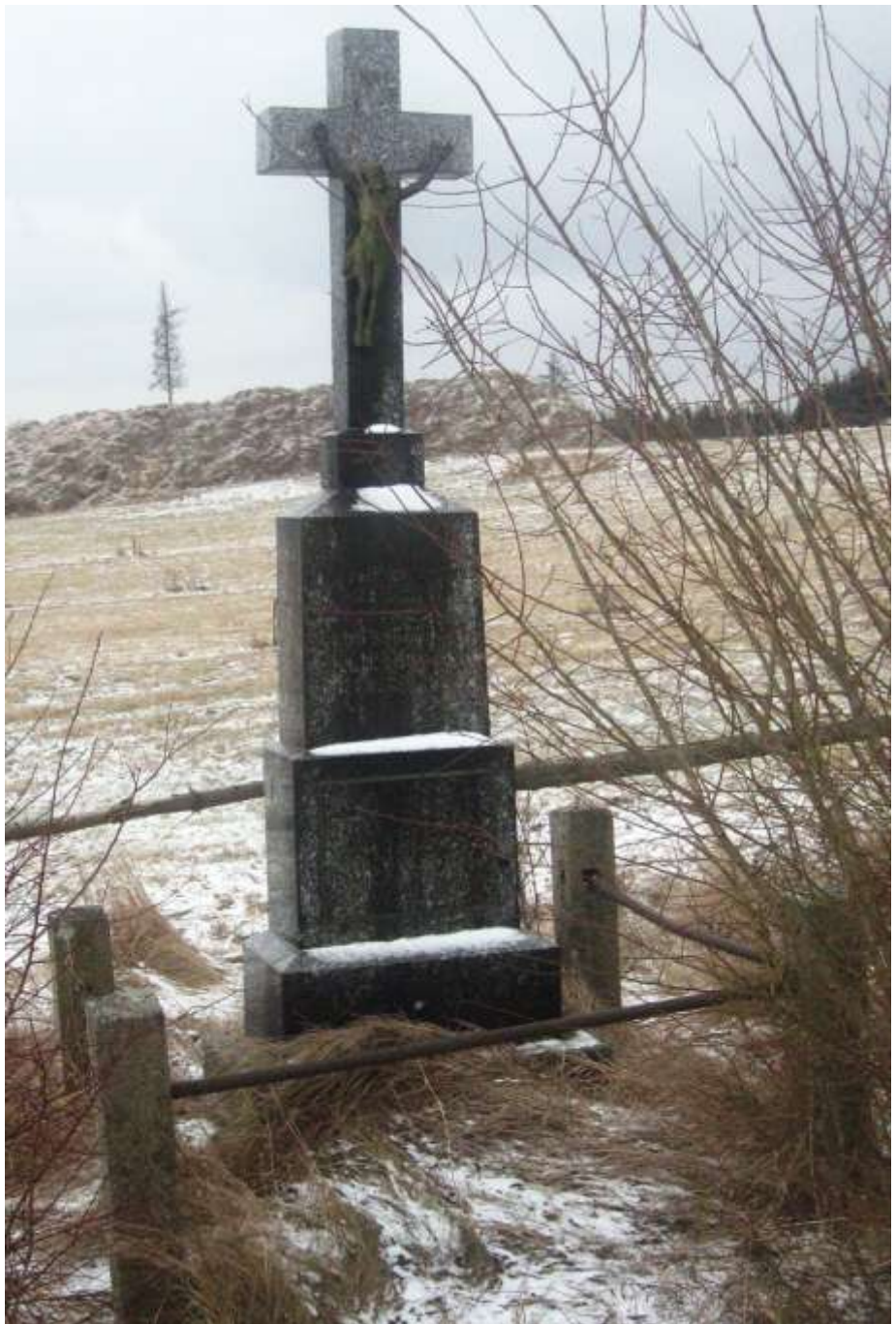
mezi Pozďatínem a Smrkem