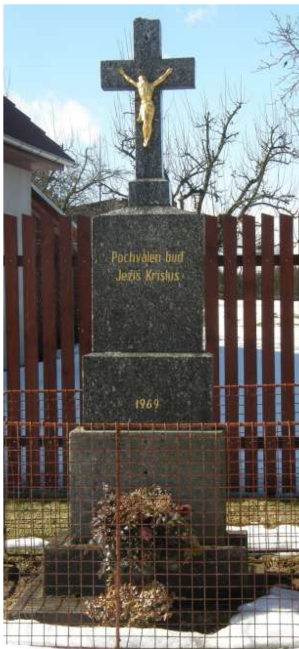
horní konec návsi v Kojatíně