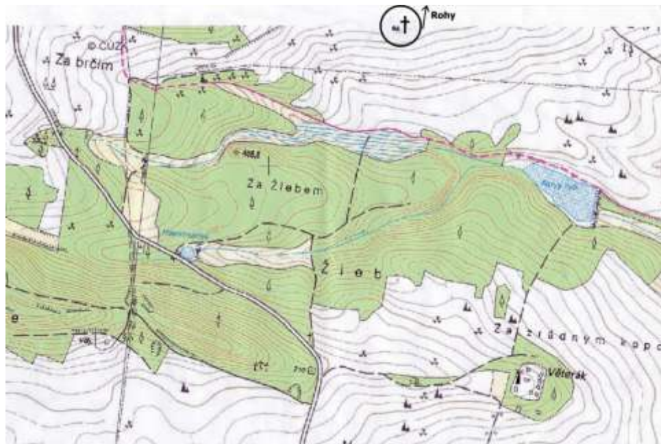
Kroužek značí místo, kde asi stával křížový kámen (cesta zanikla) mapka z webu ČÚZK

Dost komplikovaně jsem hledal a pátral po místě, kde kámen původně stál. Nakonec se zadařilo, díky hodovským občanům.