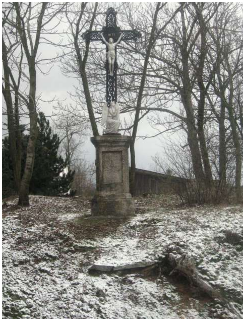
v Pozďatíně u silnice na Pyšel