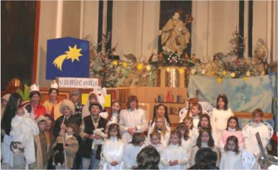
Christus mansionem benedicat – K † M † B † 2010