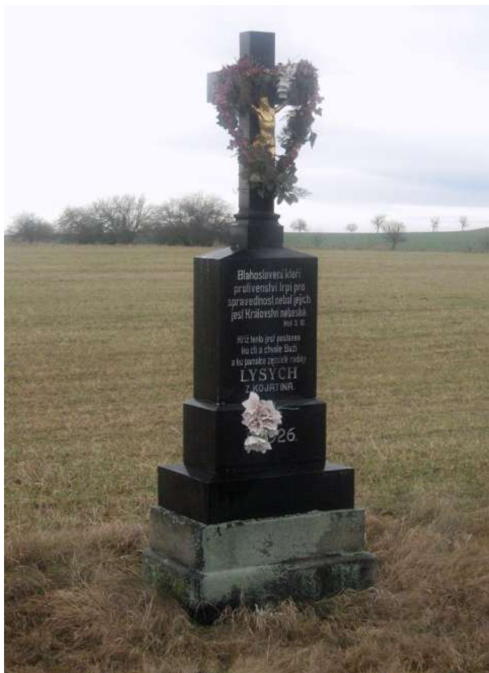
Kříž Lysých, za Kojatínem, směrem na Pozďatín