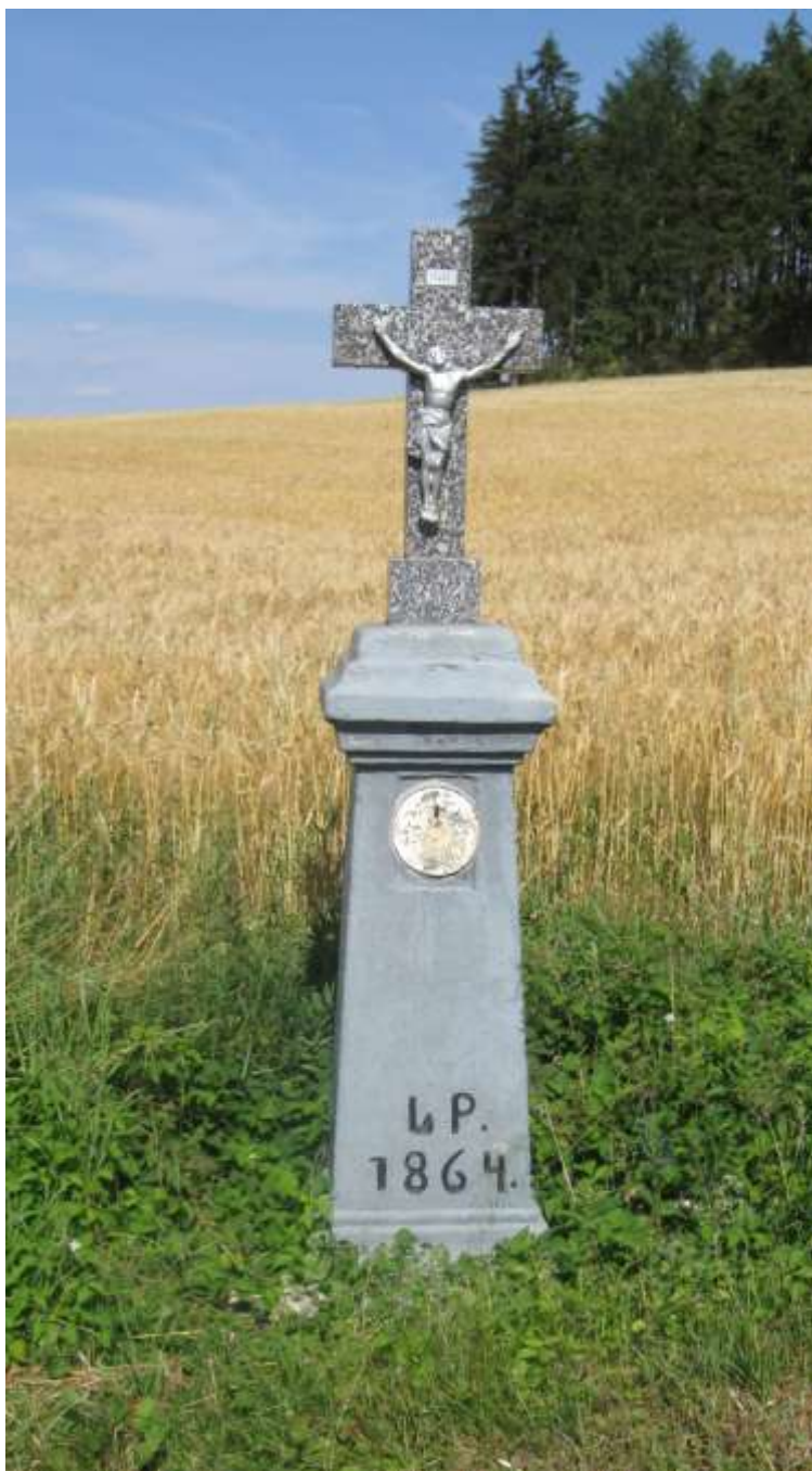
mezi Valdíkovem a Smrkem