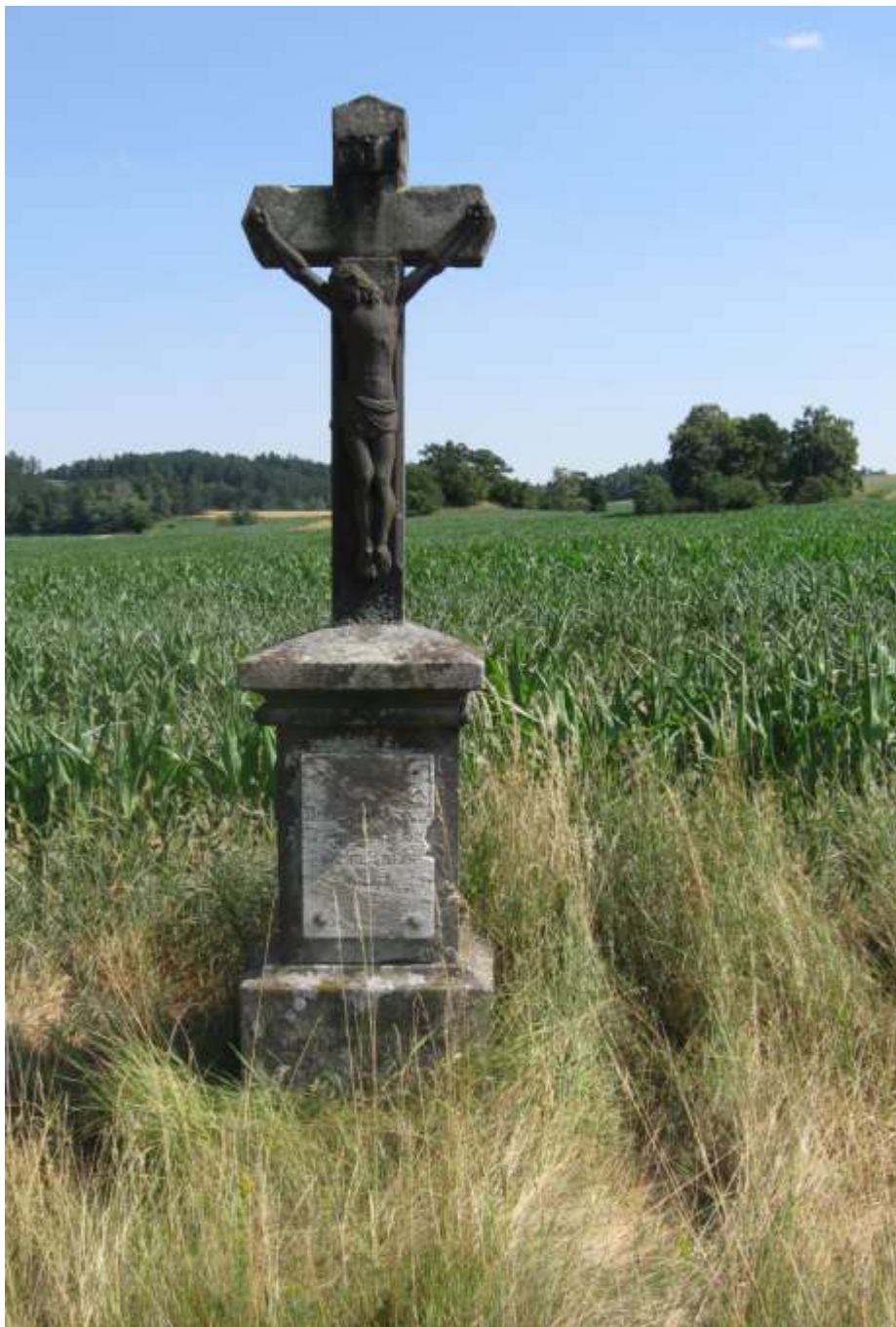
u silnice mezi Valdíkovem a Hostákovem