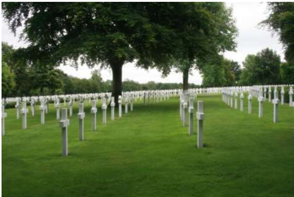
Cambridge, americký hřbitov a památník

hřbitova, kde se mně nad hlavou tyčí stožár s americkou vlajkou, směrem rovně dolů je alej vzrostlých stromů, o devadesát stupňů doprava se nachází bazénky s lekníny, které vedou až ke kapli. V prostoru mezi alejí a kaplí jsou téměř čtyři tisíce hrobů vojáků nejen námořní a letecké obrany, ale i ženistů a dalších profesí, zajišťujících severoatlantický konvoj.