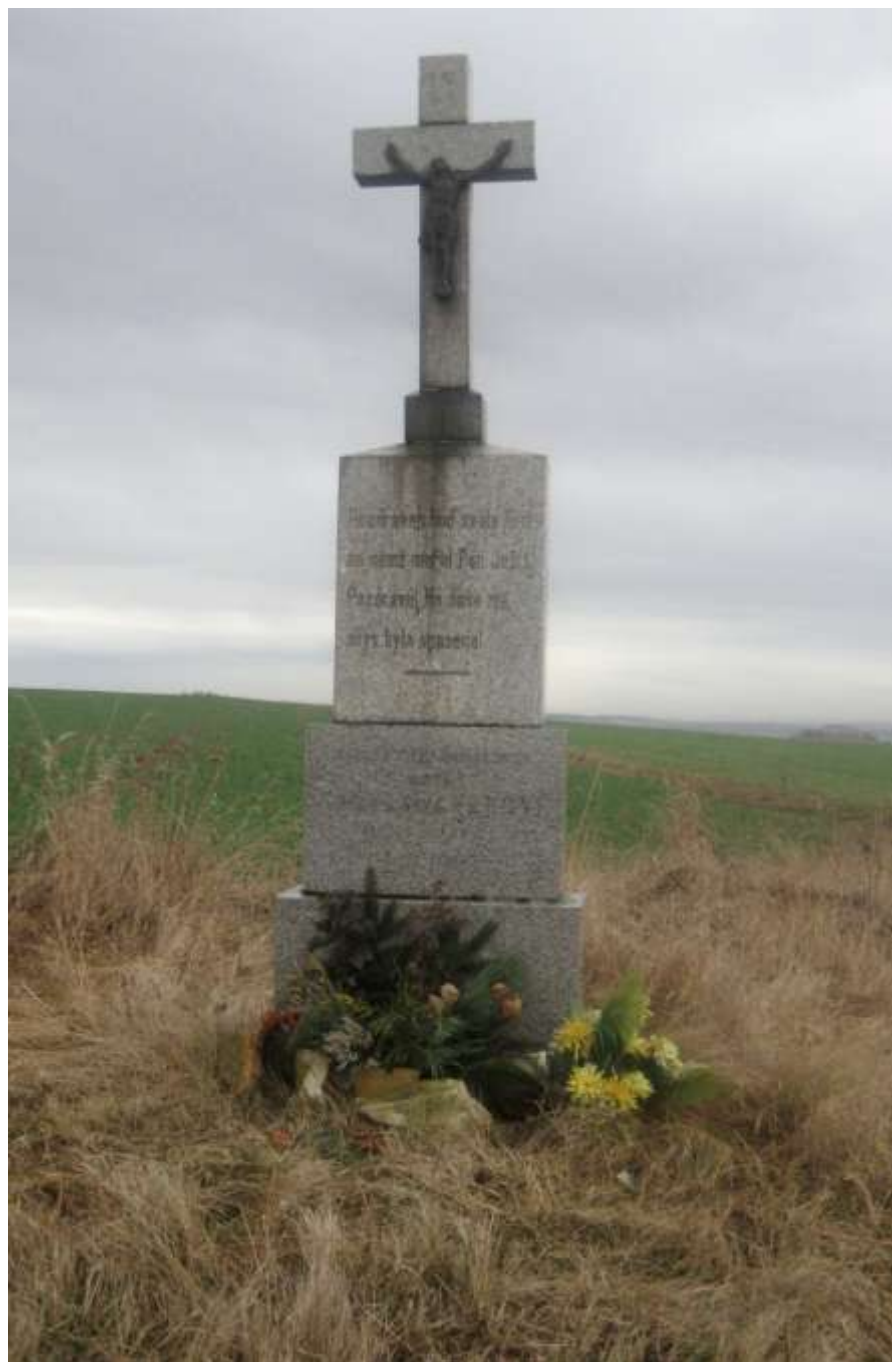
na vrcholu kopce mezi Kojatínem a Smrkem