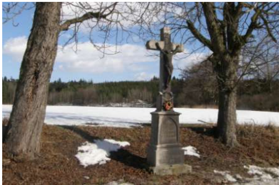
Bouzkův kříž, mezi Náramčí a Valdíkovem