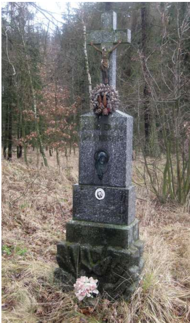
Nováčkův kříž, u železničního přejezdu za Kojatínem