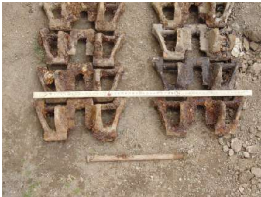
část pásu z německého tanku