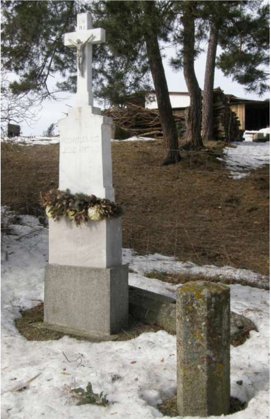
u Kojatína, pod konárnou