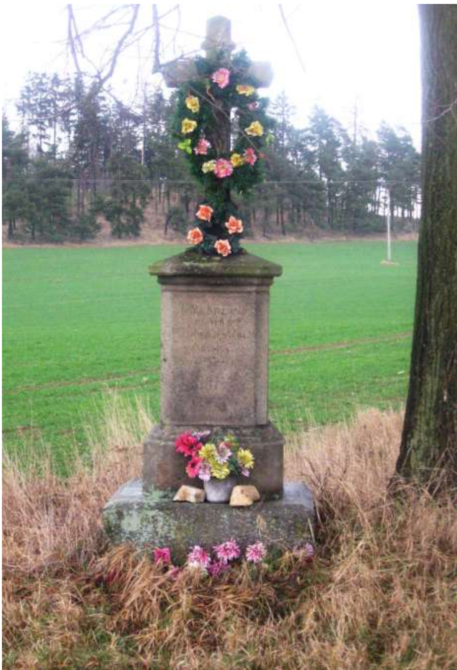
nad Valdíkovem, směrem na Smrk