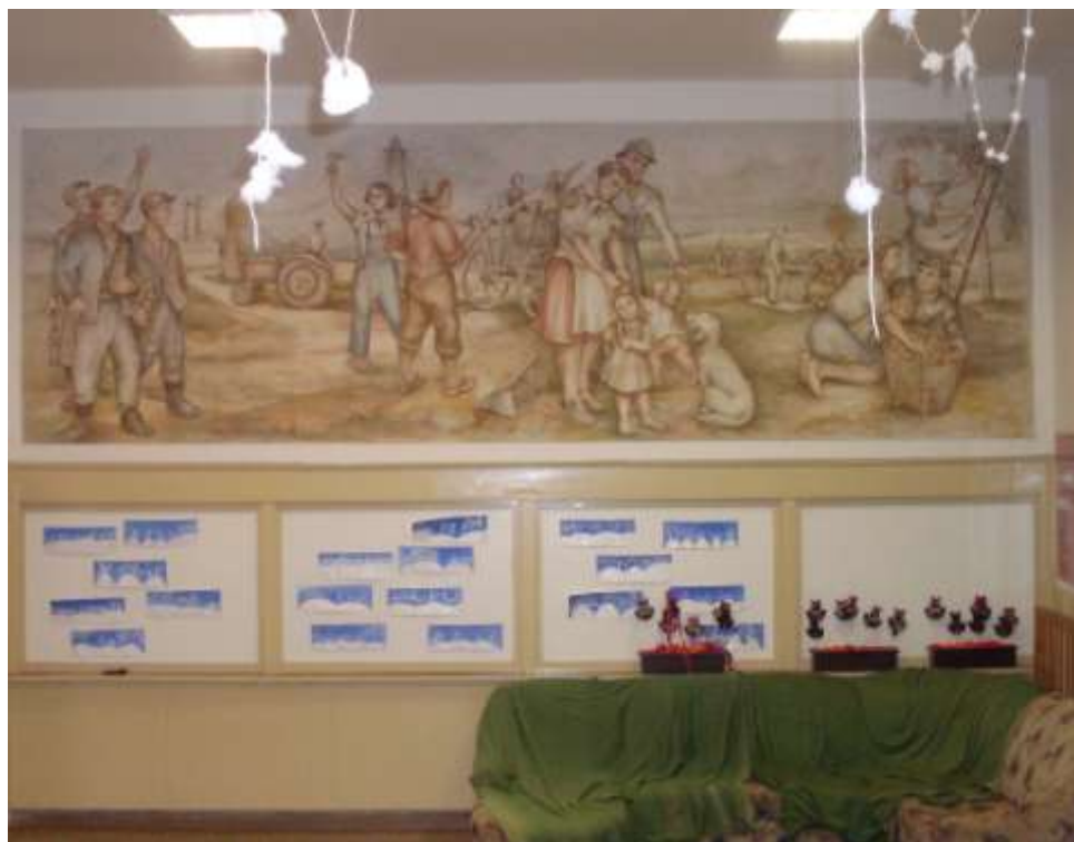
freska ve vstupní hale budišovské školy

Nakonec bych chtěl ještě uvést údaje o malíři získané z internetu: