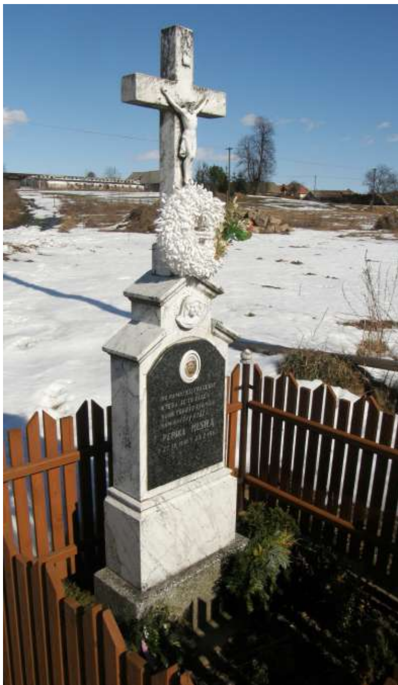
Musilův kříž, v Kojatíně u autobusové zastávky