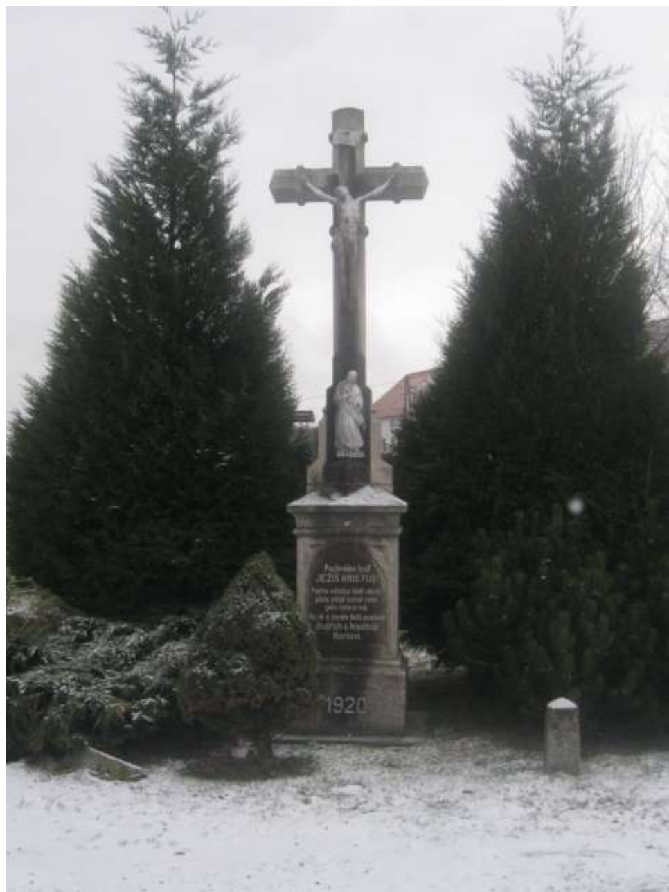
Hortův kříž v Pozďatíně