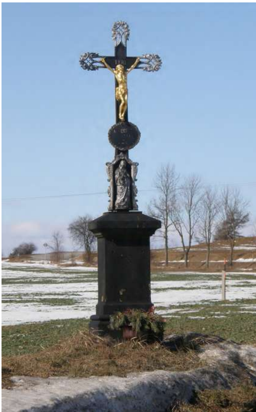
na křižovatce silnic na Smrk a Valdčkov