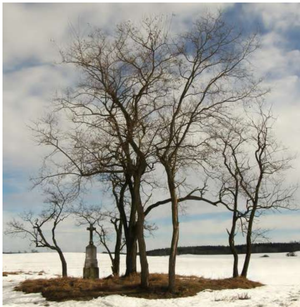
na křižovatce silnice do Kojatína a polní cesty na Spálený dvůr