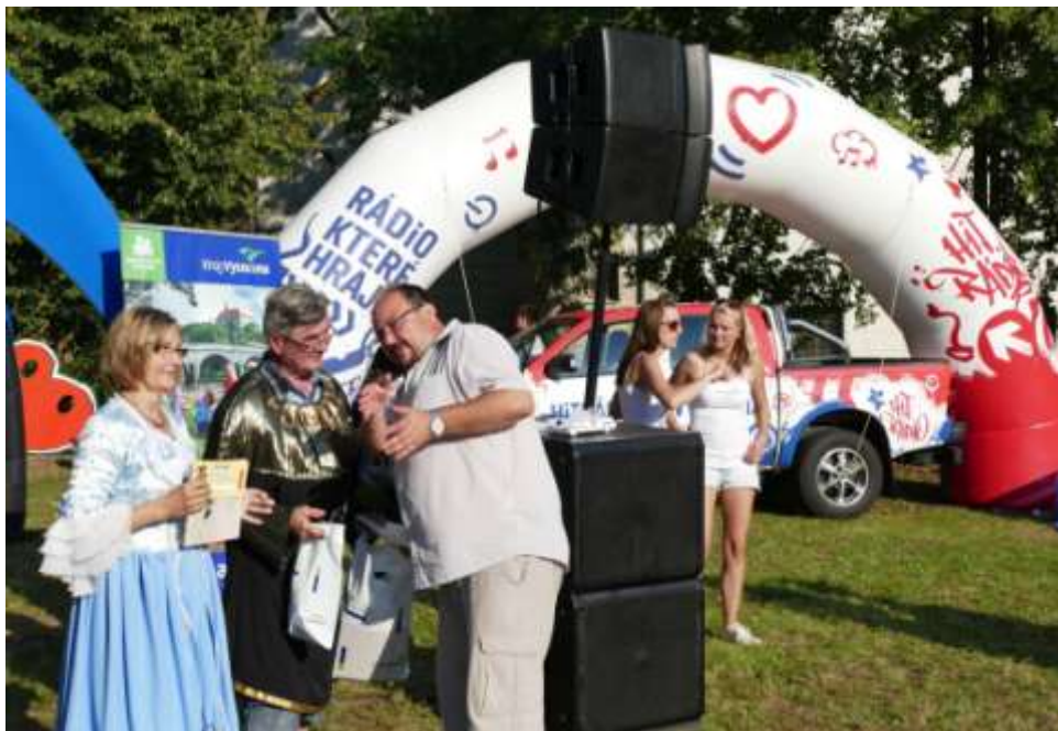
soutěž – to je Dovádění s Vysočinou.