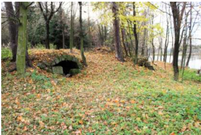
Zbytek pece na len v Doubravě

Již den před tím přivezl si každý fůru polen pařezových. Ta vydala hodně žáru. Byla smolná a vytopila pec na vysoký žár. Pec, na způsob sklepů klenutá, z velkých žulových kvádrů, měla malý poměrně otvor, do něhož druhého dne již časné zrána, ještě za tmy, takže se musilo na práci svítit, vlezla jedna z žen – paní pecová se jí říkalo – do vytopené pece, odkud vyhrabala popel a mnohdy ještě žhavě doutnající uhlíky dřevěné ven; a zvláště ty musily být velmi bedlivě odstraněny, než se tam nakladly snopy suchého a močením před tím připraveného lnu. Jinak bylo nebezpečí, že by len shořel všecek. A pak začalo lámání stonku na „mňadlicích“ (mědlicích). Po vytření lnu nastalo ono „hachlování“ z koudele a pačisky, pak se vytřepalo pazdeří a pačiska i koudel svinuly se do trubek, čistý len pak do „kranečků“ (věnců).