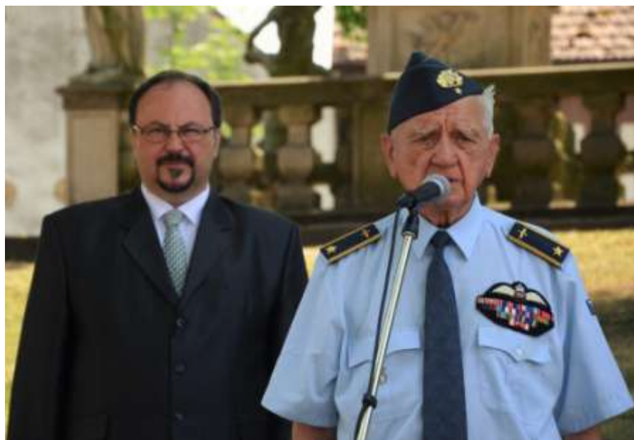
Starosta a gen. Boček