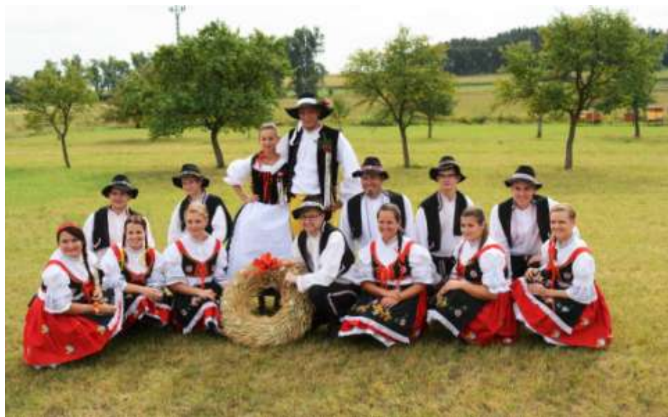
Dožínkový průvod obcí Nárameč