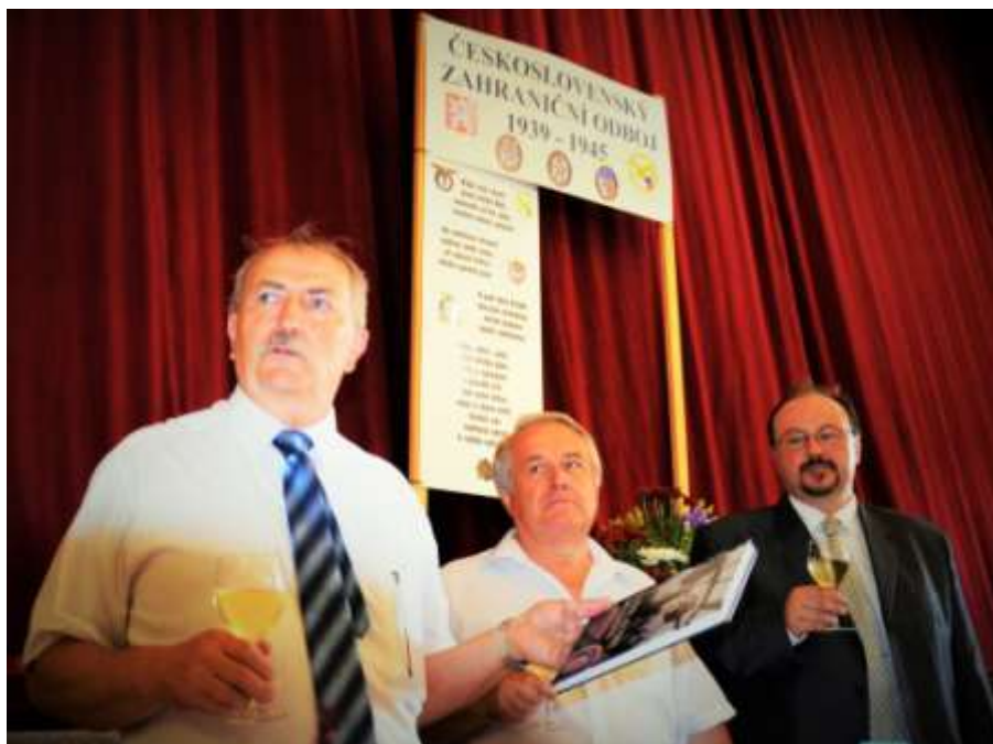
Uvedení knihy do prodeje