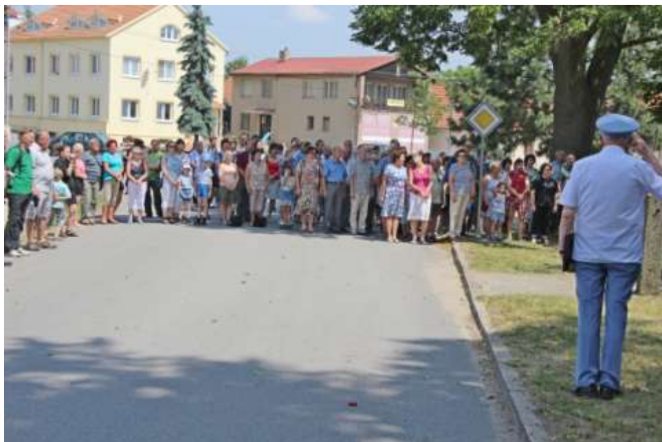
Hojná účast občanů