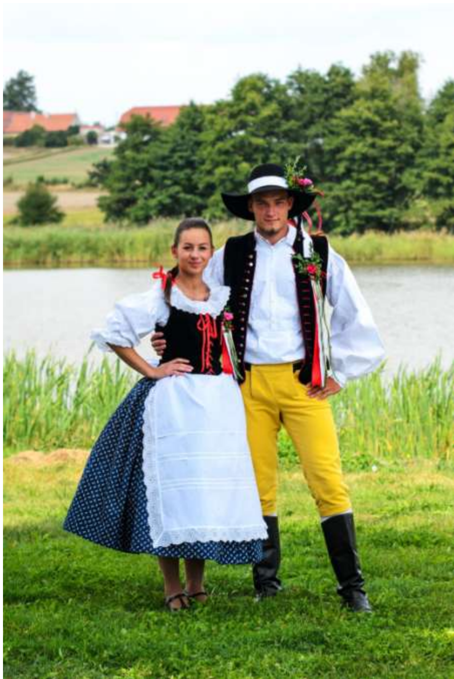
První historický náramečský kroj