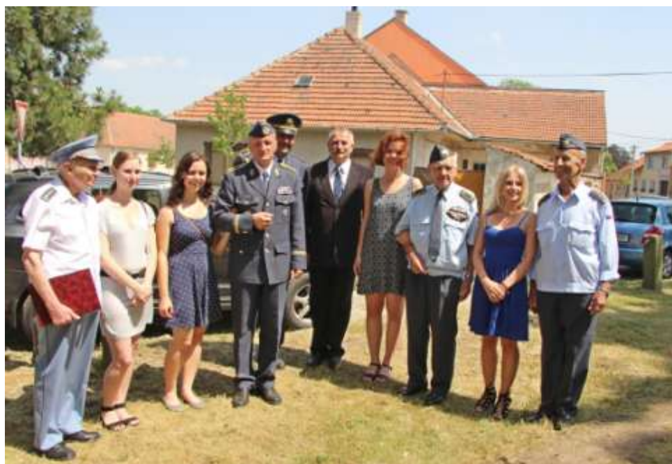
Hosté a hostesky