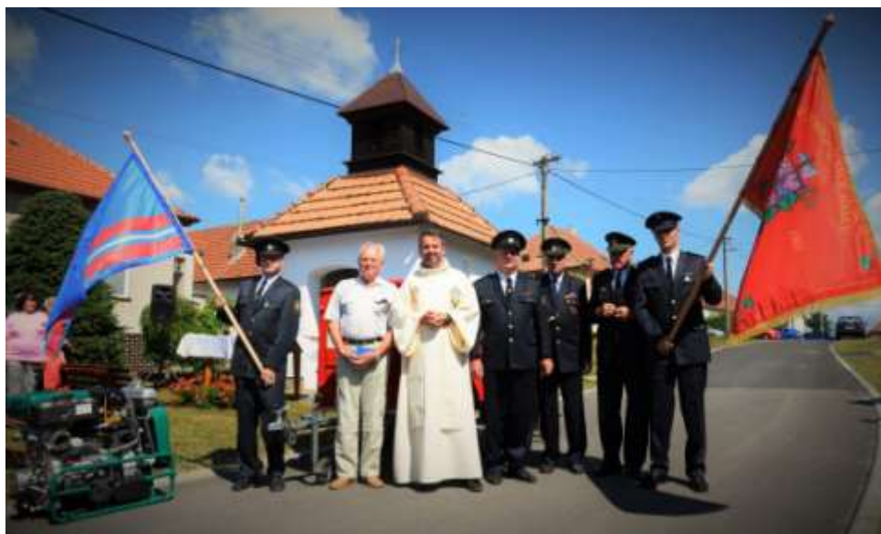
Mše u kapličky v Kojatíně