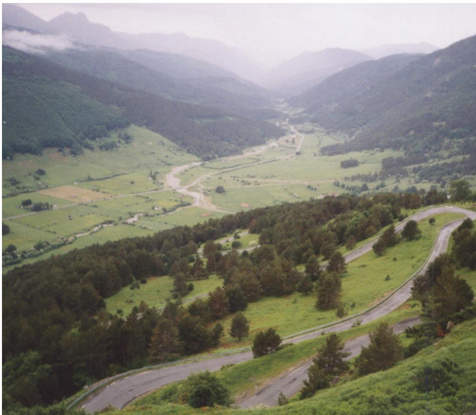
Pyreneje – sjezd do Španělska

Z Francouzského středohoří jsem se dostal do nížiny a po přejetí řeky Garonne jsem se rázem ocitl v Pyrenejích, na které jsem se velice těšil. Přivítala mne zde však mlha, ve které jsem viděl jen kousek před sebe. V duchu jsem si říkal, jednou za život jsem v Pyrenejích a nevidím z nich nic. To bylo večer a já se utěšoval, že ráno se vše prosvítí. Vyspal jsem se v jednom místě pod mostem a v pět hodin jsem vyjel cestou k pyrejskému průsmyku.