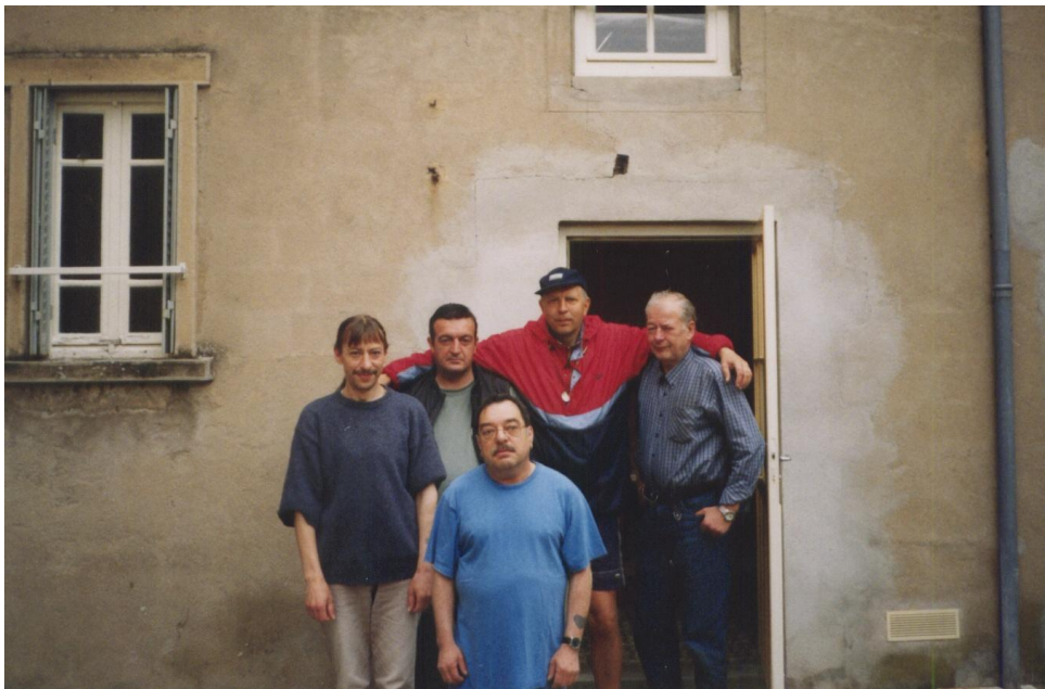
Azylový dům v Paray-le-Monial

Díky tomu mi nastaly velké problémy. Řešil jsem to, jak se dalo. Vždy večer jsem se otíral od hlavy až k patě hadrem, který jsem smočil pitnou vodou z dvoulitrové lahve. Byl jsem si vědom toho, že hygiena je věc nezbytně nutná, neboť cyklista musí dbát především o to, aby se mu nezapařila místa, na nichž sedí, tj. zadek a třísla.