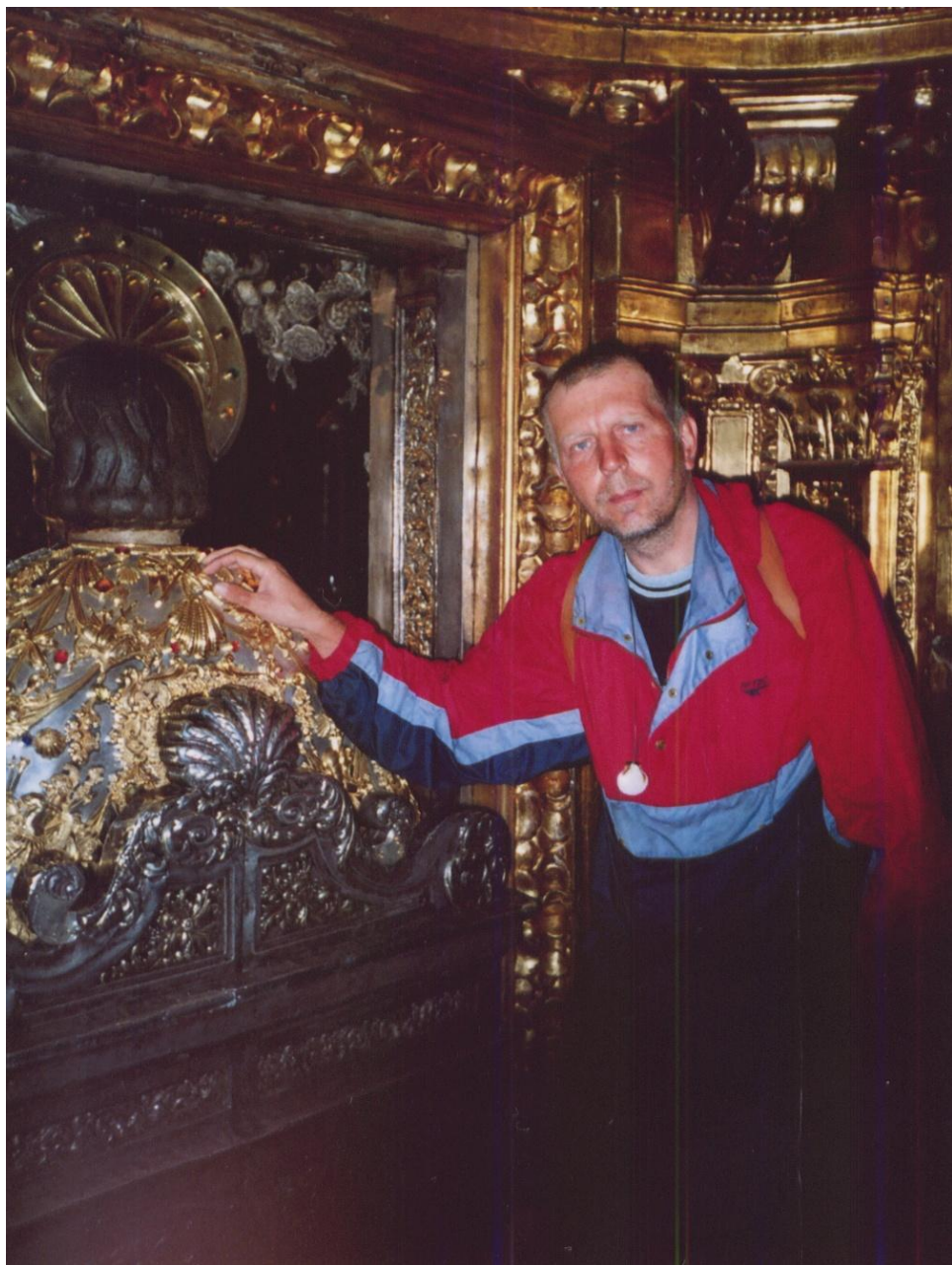
U sochy sv. Jakuba