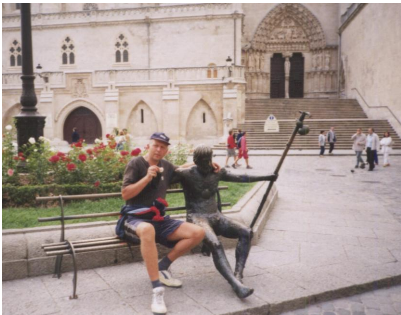
Burgos – se sochou sv. Jakuba