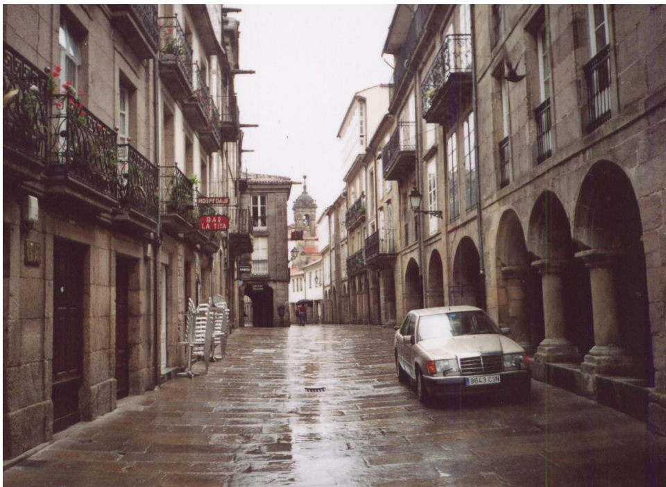
Santiago de Compostella

V Santiagu jsem pobyl dva dny. Při procházce nádhernou starobylou částí města jsem nakoupil dárky a prodal kolo. Koupili je Italové, kteří kolo přidali k ostatním, na nosič svého auta. Poté jsem sedl do vlaku a odjel do Madridu. Cena za vlak ze Santiaga do Madridu činila 38 euro, což bylo pro mne výhodné.