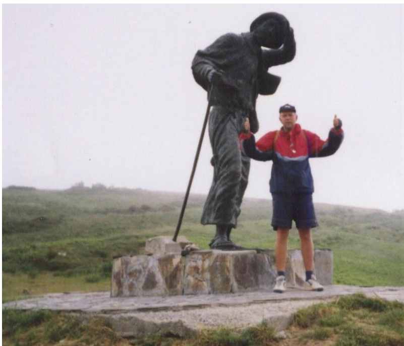
Se sochou sv. Jakuba