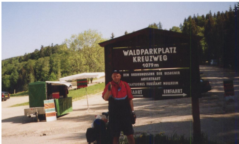
Schwartwald – nejvyšší bod na německém území

V Německu jsem se dostal dvakrát na mši. Zvláště ta v Müllheimu ve mně zanechala jeden z nejsilnějších zážitků. Spal jsem zde na faře a v sobotu večer jsem šel do kostela. Farář mne před plným kostelem přivítal a během mše zde byla vyslovena přímluva za mne (poznal jsem to podle toho, že bylo vysloveno mé jméno a s ním spojené poutní místo Santiago de Compostella). Po mši na mne většina lidí čekala, potřáslí mně rukou s přáním šťastné cesty. Prostřednictvím telefonu jsem z pevných telefonních budek podával zprávy manželce a ta je předávala dalším, ti sledovali průběh mé cesty na mapě.