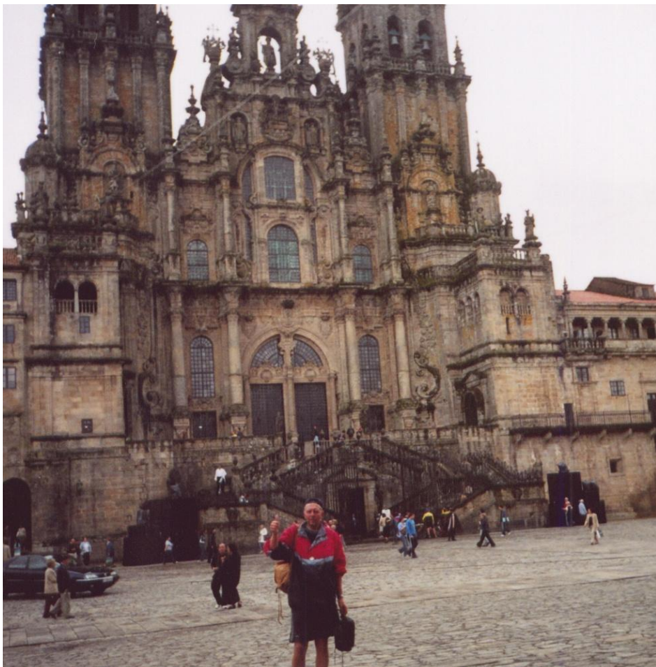
Santiago de Compostella – před chrámem sv. Jakuba

Do cíle svého putování, Santiaga de Compostella, hlavního města a správného střediska Galicie (na úrovni našeho kraje), jsem dojel v poledne 21. června. Měl jsem od 5 hod ráno najeto 90 km. V Santiagu je spousta krámků s upomínkovými předměty a vlastně vše je zde podřízeno bohatému turistickému ruchu. Pěší turisty jsem zde poznával podle toho, že seděli na schodech s konzervou v ruce. Ti, co přiletěli v letadlech, měli své místo v restauracích.