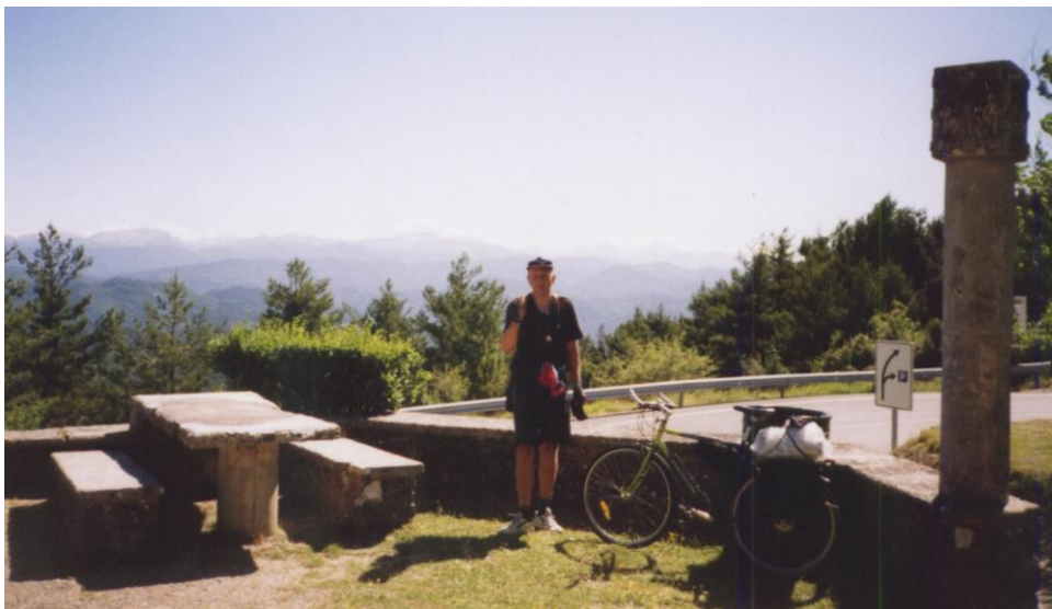
Španělská část Pyrenejí

Při sjíždění do Španělska vedra sice přetrvávala, ale díky osvěžujícímu větru od Atlantického oceánu, jel jsem asi 100 až 150 km rovnoběžně se severním pobřežím, se stala snesitelnější. Ve Španělsku mne přivítala kopcovitá krajina, ale kopce již nebyly tak prudké jako v Pyrenejích, byly spíše táhlé.