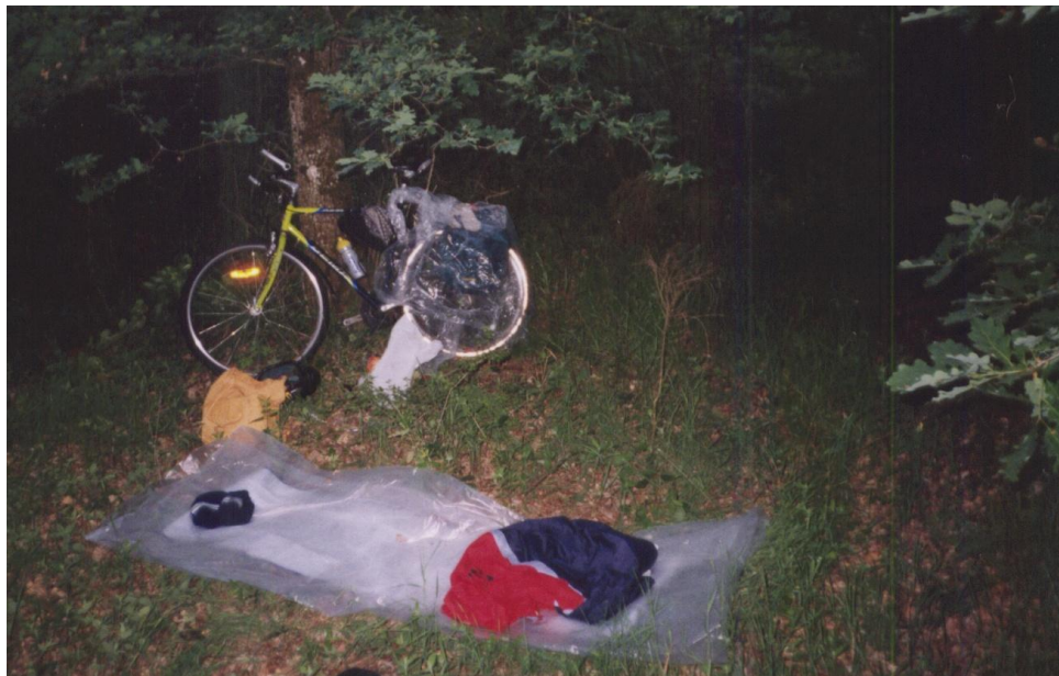
Spaní v lese – Francie

Nezbývalo nic jiného, než hledat nocleh v lese. Tam jsem se většinou vypravil, až se začalo stmívat, aby mne nikdo nesledoval a v noci neokradl. Najít vhodné místo na spaní bylo těžké, jelikož lesy, v nichž převládaly listnaté stromy, byly neuvěřitelně zarostlé. Spal jsem ve spacáku na karimatce a přes sebe jsem měl přehozenou dvojistou fólii.