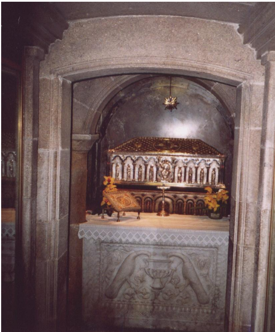
Hrob sv. Jakuba

V pondělí ráno v 8 hod po otevření jsem si před mši svatou prohlédl místo, kde se nachází hrob sv. Jakuba. Dá se jít i nahoru za oltář, kde stojí socha sv. Jakuba. Je odtud nádherný pohledem na barokní loď katedrály. Při mši jsem byl svědkem jedné rarity. Asi deset chlapů rozhoupalo obří kadidelnici a ta se za svištění pohybovala vnitřkem katedrály.