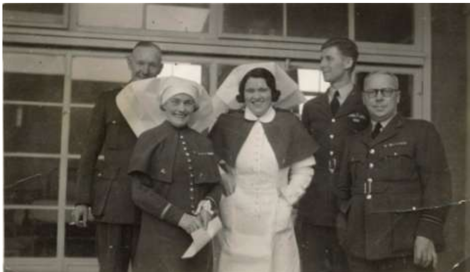
Ošetřovatelky a lékaři v letecké nemocnici v Anglii

Při jednom z letů na Wilhelmshaven s velmi pozdním návratem 22. 2. 1941 utrpěl omrzliny, které si musel léčit v nemocnici.