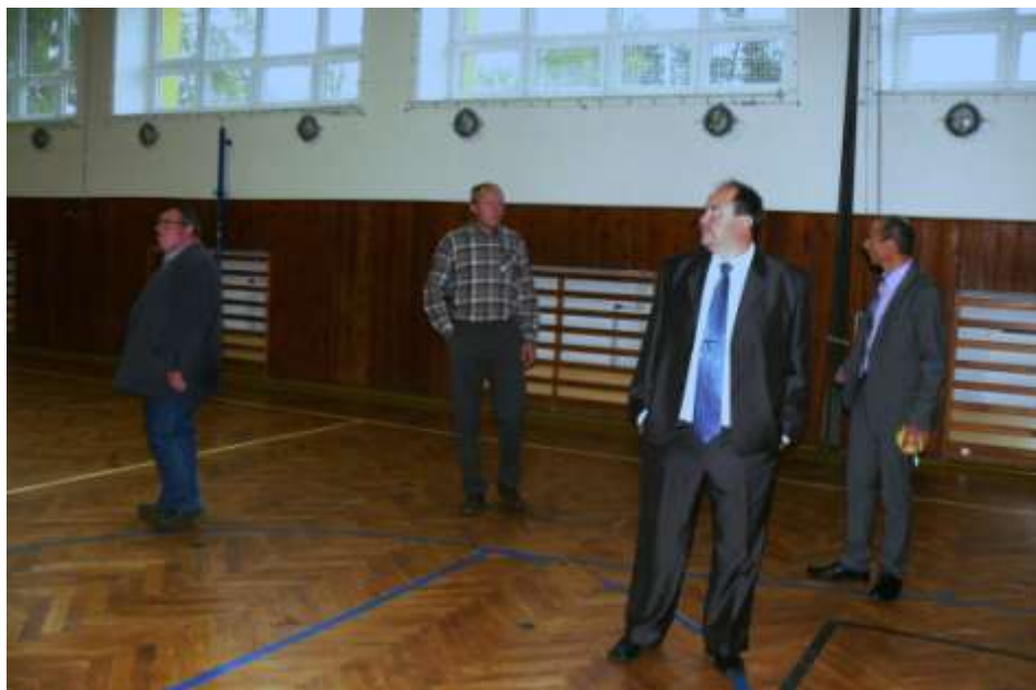
I tělocvična ve škole už nutně potřebovala výměnu oken – a dočkala se