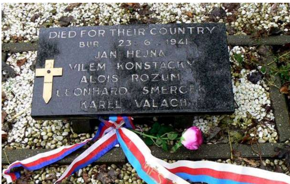
Pomníček v místě dopadu letounu (zkomolení příjmení Holanďanům odpustíme)