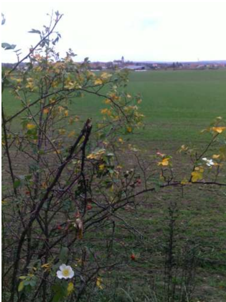
Budišov 17. 11. 2015

Průměrná teplota 1,7°C v noci, 7,7°C ve dne, teploty až 11°C v noci a až 16°C ve dne, 1 cm sněhu 17. listopadu (a to bylo od konce léta vše).