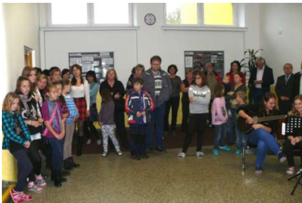
Přes nevlídné počasí dorazilo do školy hodně zvědavých občanů