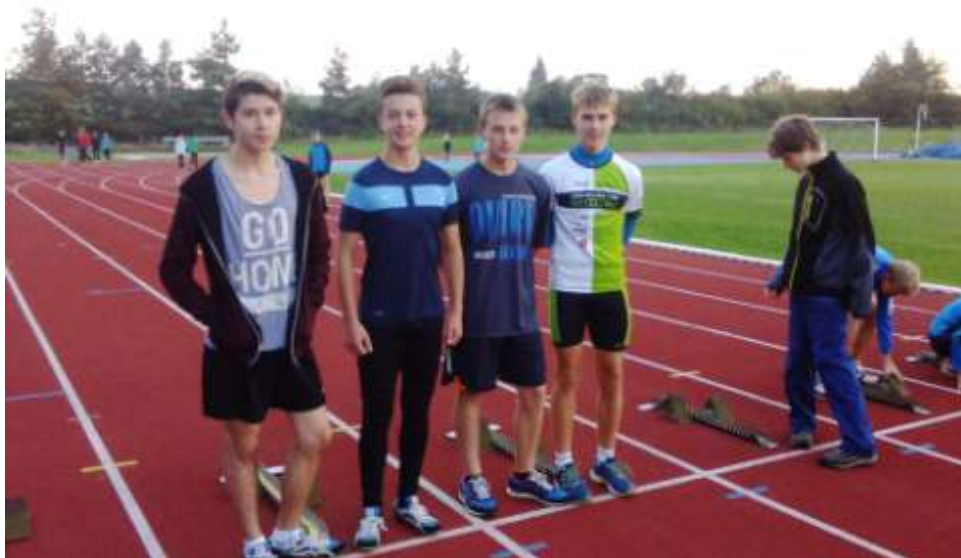
Atletický čtyřboj v Třebíči