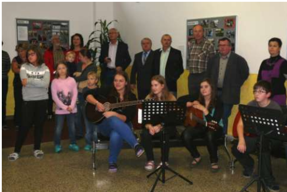
Den otevřených dveří a kolaudace

Na chodbách a ve třídách byly připraveny různé dílničky: čajovna, zeleninové a ovocné hody, dešťové hole, tvoření s jeřabinami, hmatky a ukázky stavebnice Merkur. Relaxační učebna se proměnila ve výstavku nově zakoupených knih pro realizaci čtenářské gramotnosti.