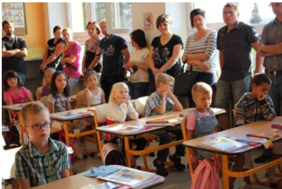
Zahájení školního roku 2015/2016