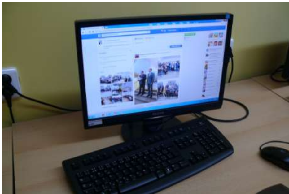
Ještě než při prohlídce školy dorazili zastupitelé do počítačové učebny, již tam mohli vidět rekordní internetovou reportáž ze zahájení akce