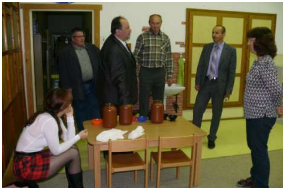
Škola připravila i vědomostní kvíz, který úspěšně absolvoval i starosta městyse