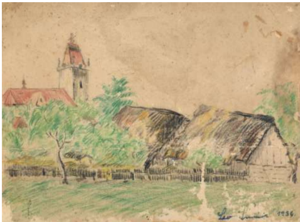
Obrázek Budišova od Leoše Smrčka