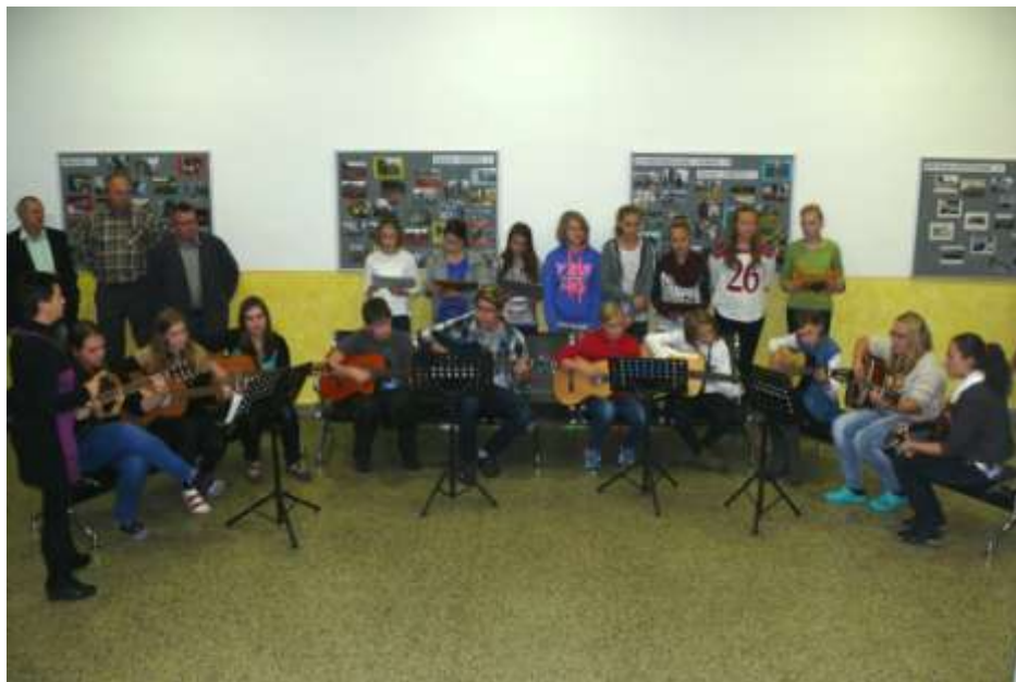
Zahájení hudbou obstarali žáci budišovské školy pod vedením pí uč. Staré