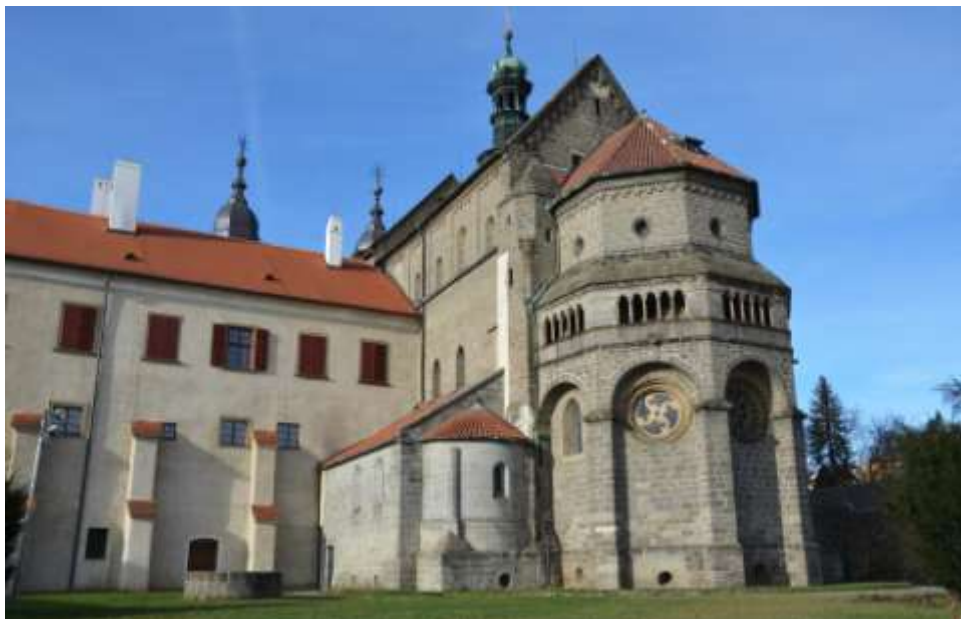
Celkový pohled od jihu

benediktinského na Moravě. Dokazuje to ještě r. 1336 okolnost, že papež Benedikt II. opatu břevnovskému a třebíčskému jakožto představeným nejpřednějších klášterů řádu benediktinského v Čechách a na Moravě vydal Bullu o konání kapitulních shromáždění, o klášterní kázni a studijním pořádku.