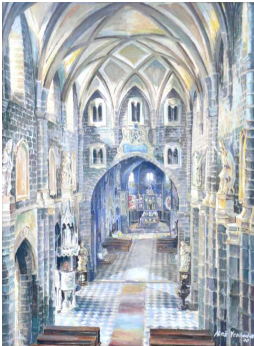
Vnitřek basiliky, obraz Aleše Venhody