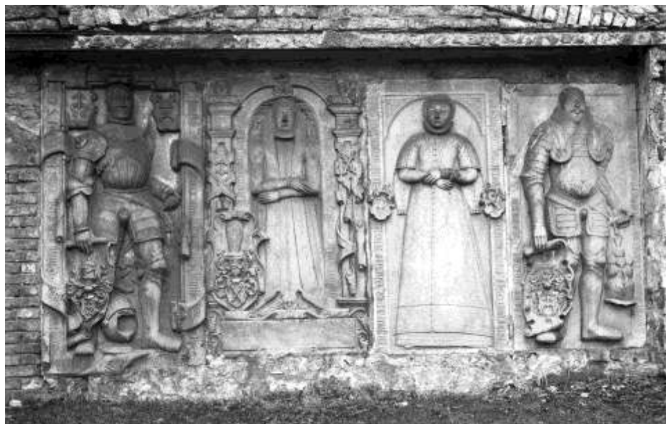
Zahrada kapucínského kláštera