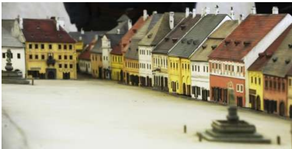
Výsek z modelu města Třebíče Stanislava Vršky, dům č. 10 – spodní část náměstí, sedmý dům zprava, s vývěsním štítem

V průjezdu tohoto domu je vymalován kůň ke stromu přivázaný, na kterém je zavěšen bič, bota, kartáč aj. Říkají, že je to kůň krále Matyáše. Nebude to však nic jiného, nežli znamení hospodské.