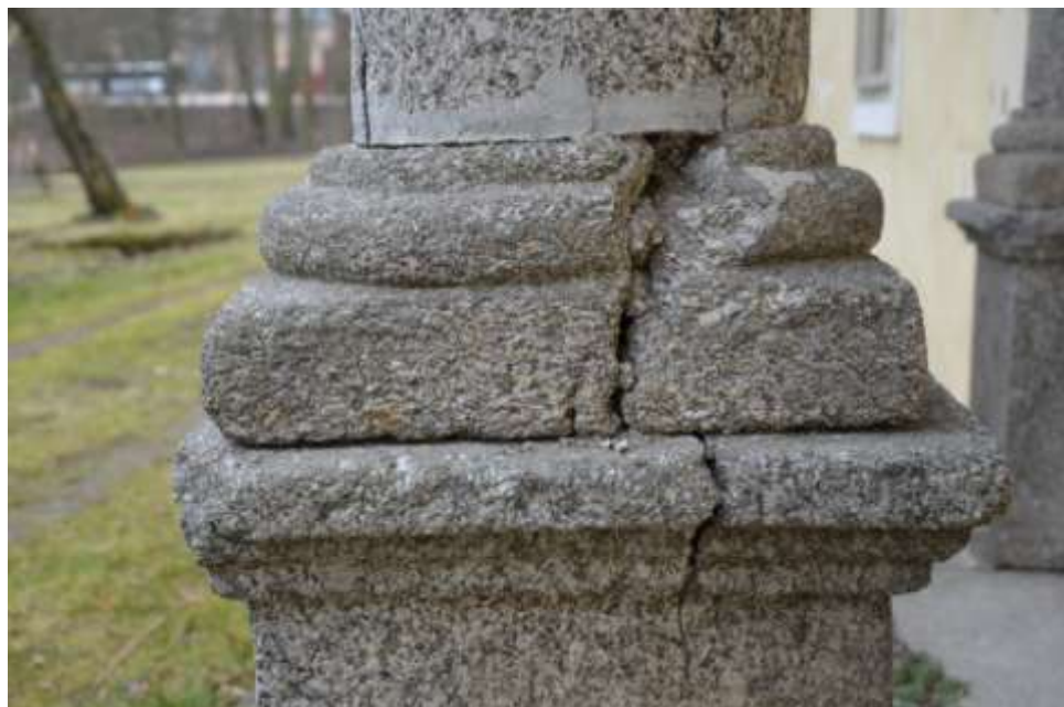
Detail sloupu zahradnického domku