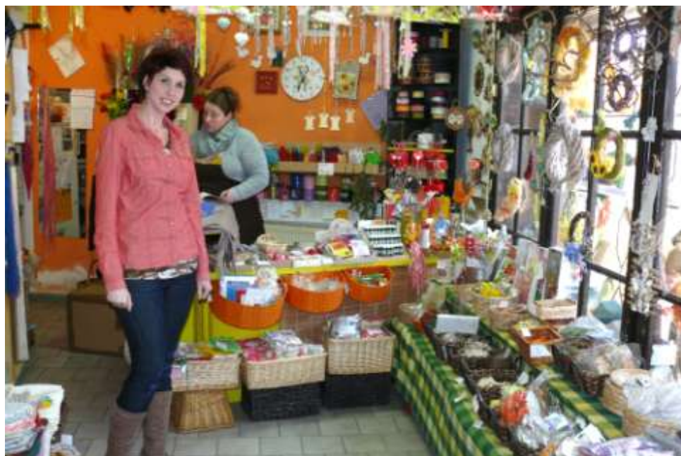
Kytky u Vrátek s předsedkyní