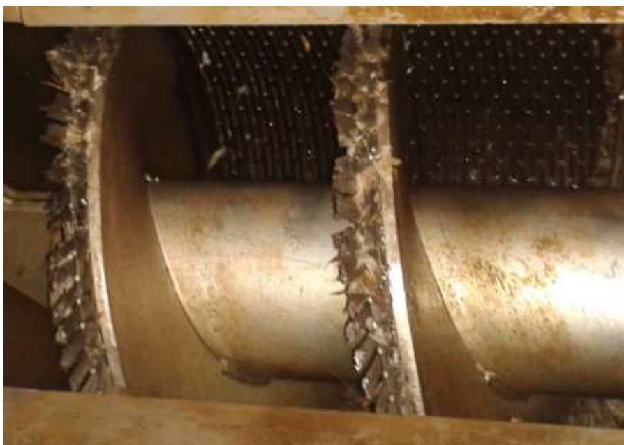
Česle po čištění