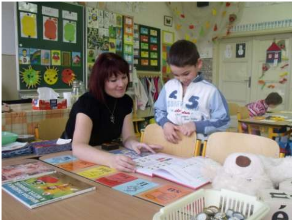
Zápis žáků do 1. třídy