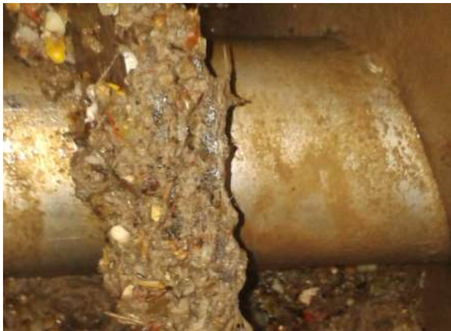
Česle před čištěním