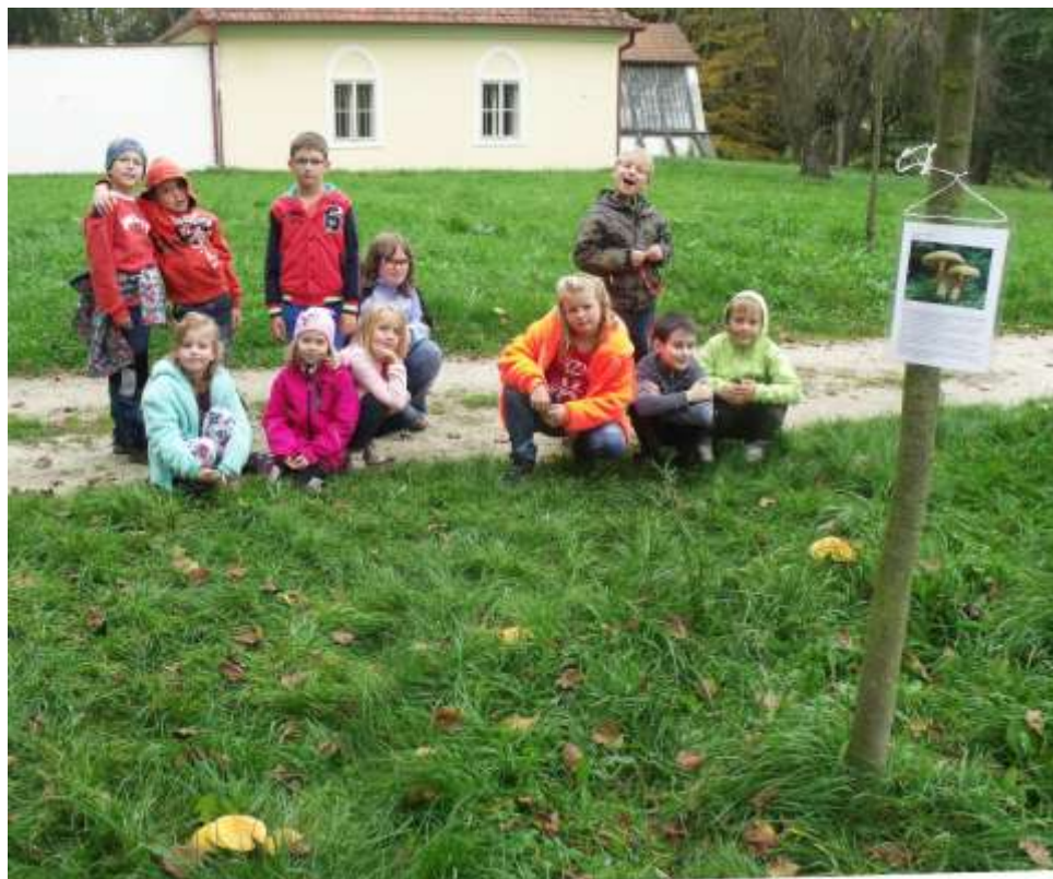
Děti z přírodovědného kroužku Poštolka v místě nálezu bedlovnice zlaté

houby i celého naleziště neznámým vandalem, což je mi velmi líto. Doufejme, že se bedlovnice zlatá objeví i v dalších letech v naší lokalitě a její osud nebude tak smutný.