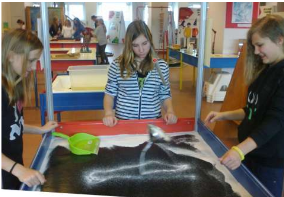
Výlet do planetária