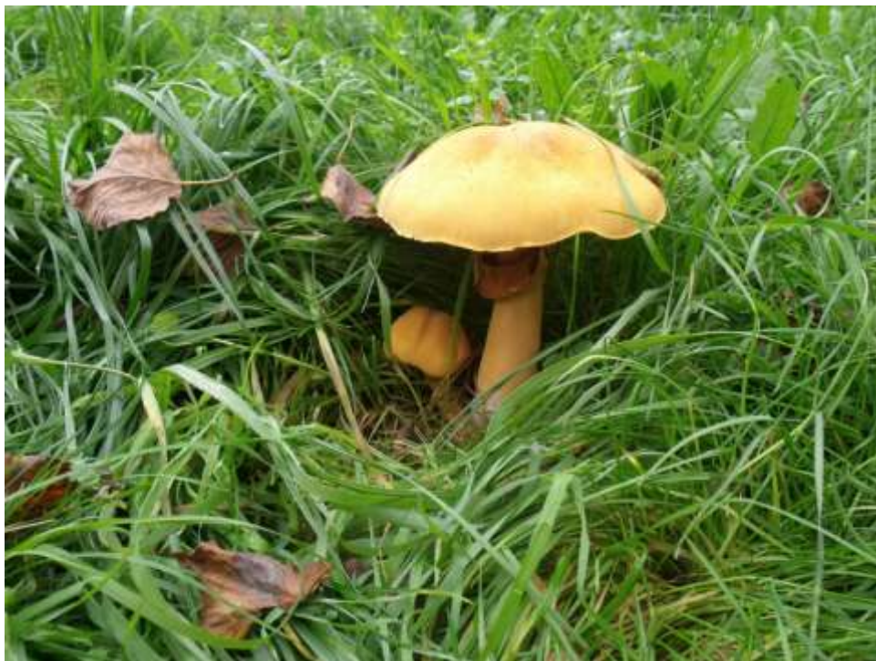
Bedlovnice zlatá v budišovském zámeckém parku

Po návratu domů jsem v atlasech hub hledal, o jaký druh se může jednat. Během několika minut se mi podařilo houbu určit. Jednalo se o vzácnou bedlovnici zlatou. Při čtení popisu tohoto druhu byla zmínka o tom, že případný výskyt je vhodné nahlásit na některou z mykologických stanic.