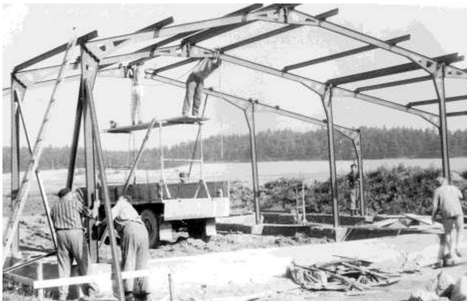
Stavění nosných pilířů, rok 1986