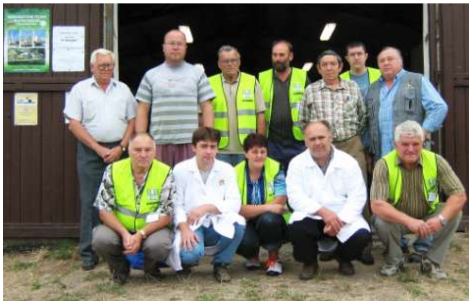
Pořadatelé a posuzovatelé, rok 2007