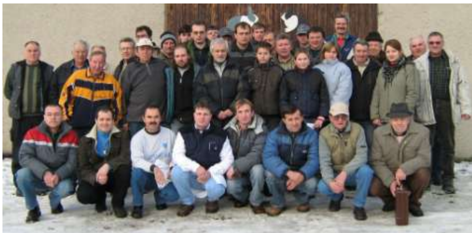
Výstava Holandský králík, rok 2005

na obálce: Výstava Na Padělcích, rok 1982