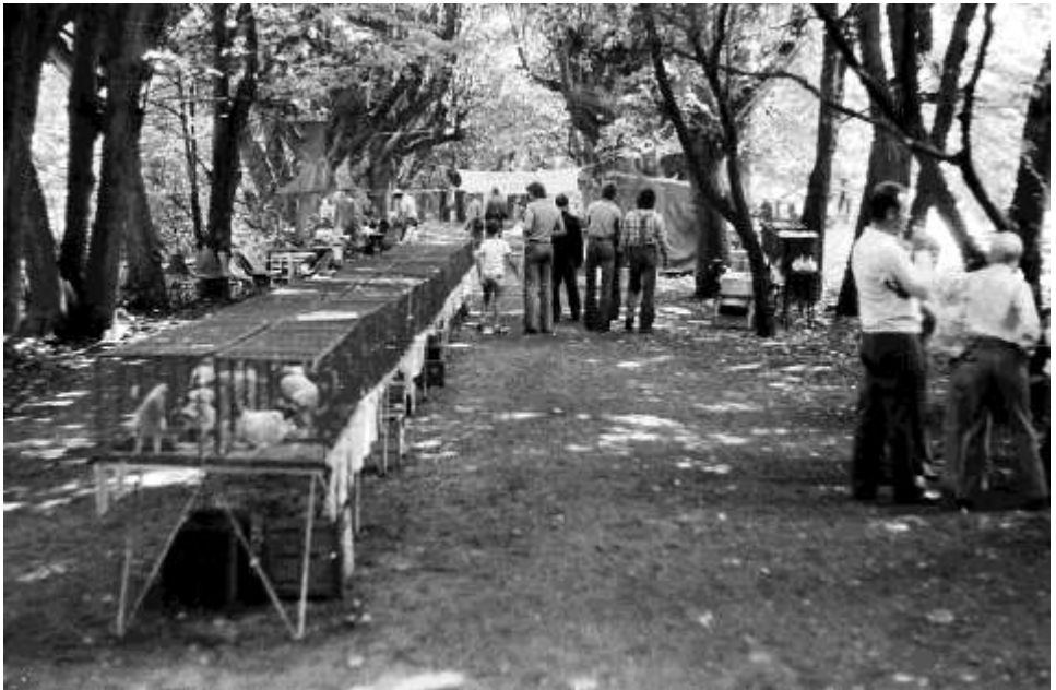
Výstava v zámecké zahradě, rok 1974