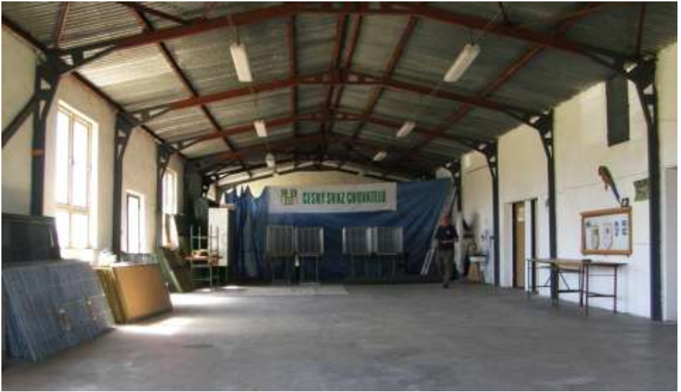
Vnitřek haly chovatelského areálu

Budišova na městečko. V důsledku moru králíků nemohli být na této výstavě králíci vystaveni, přesto bylo vystaveno 230 holubů a 130 kusů drůbeže a exotického ptactva.