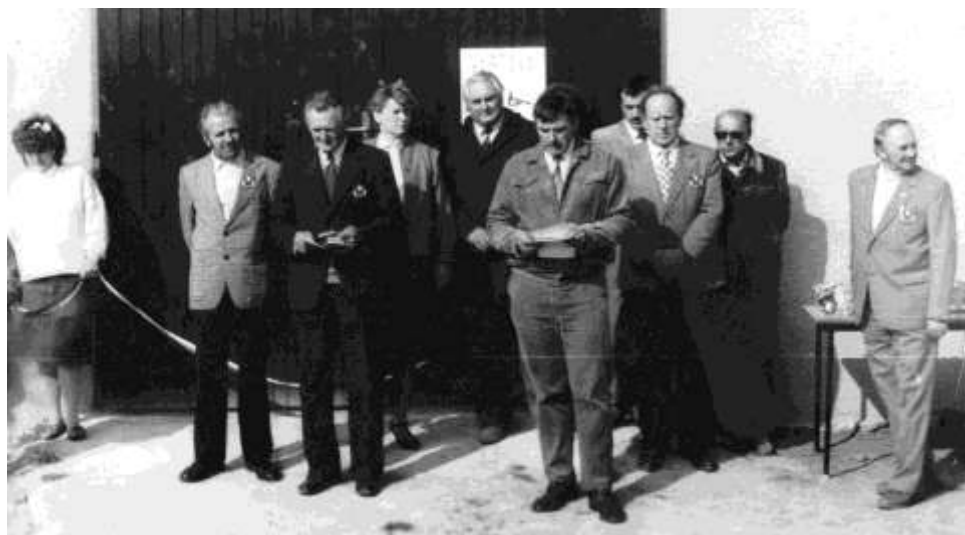
Slavnostní otevření haly chovatelského areálu 3. 10. 1987