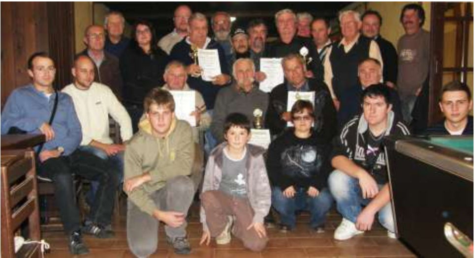
Výroční schůze, restaurace U Kazdů, rok 2011