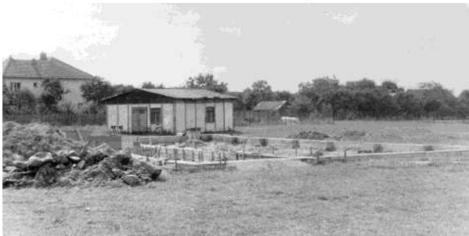
Dřevěný sklad na krmiva a betonové základy chovatelského areálu, rok 1985

26. 5. brigáda na stavbu kolny sloužící k uschování materiálu. 20. 10. dochází k asfaltování střechy kolny.