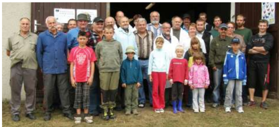
Pořadatelé a posuzovatelé, rok 1982

V roce 2000 připadla krajská výstava na okres Třebíč. Budišovská organizace měla zájem uspořádání této výstavy. Nakonec bylo dohodnuto uskutečnit tuto výstavu v Moravských Budějovicích, jelikož na této straně okresu se větší výstava ještě nekonala. Z Budišova tam byly zapůjčeny klece a voliéry.