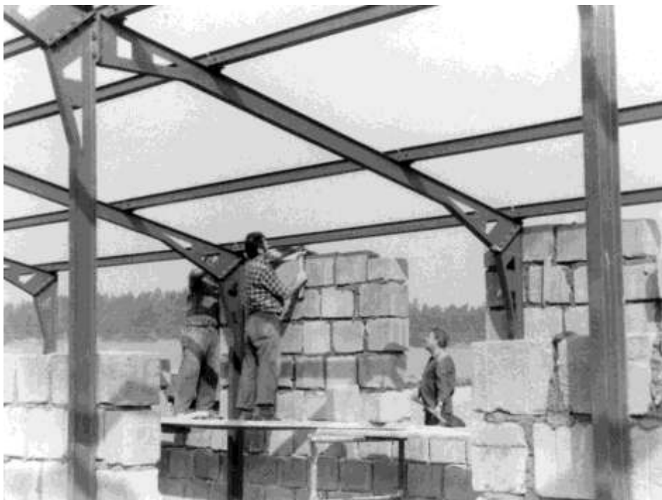
Vyzdívání stěn haly, rok 1986