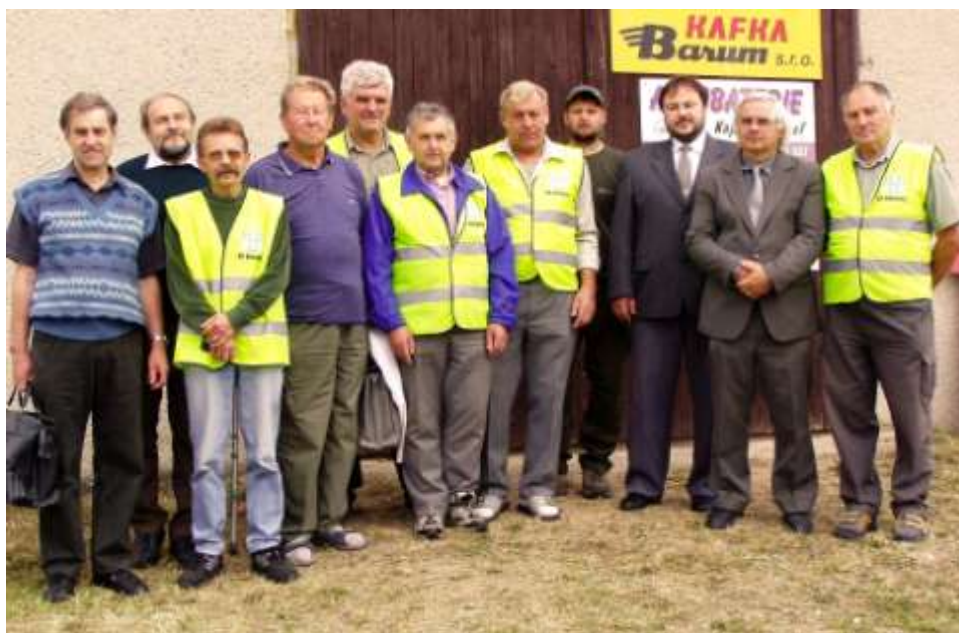
Pořadatelé, posuzovatelé a zástupci obce, rok 2005