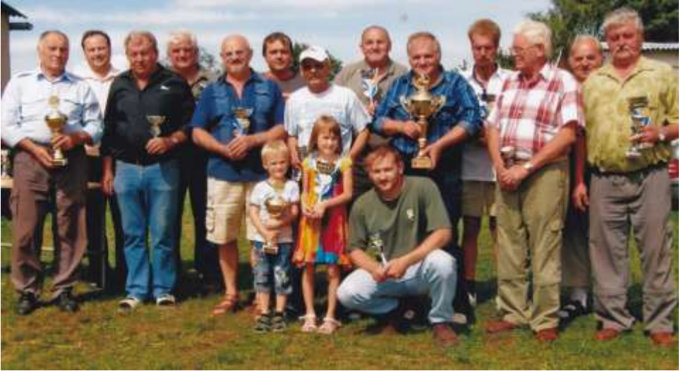
Ocenění vystavovatelé po předání jednotlivých cen