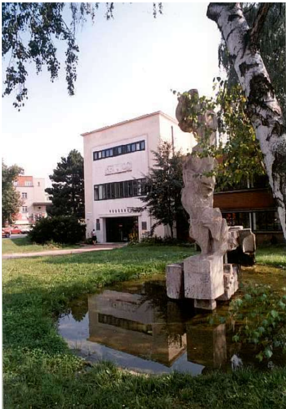
Obr. 7 VIII