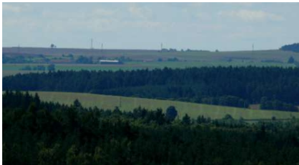
Okrašovice, vpravo okrašovické lípy a na obzoru vysílač u Klučova