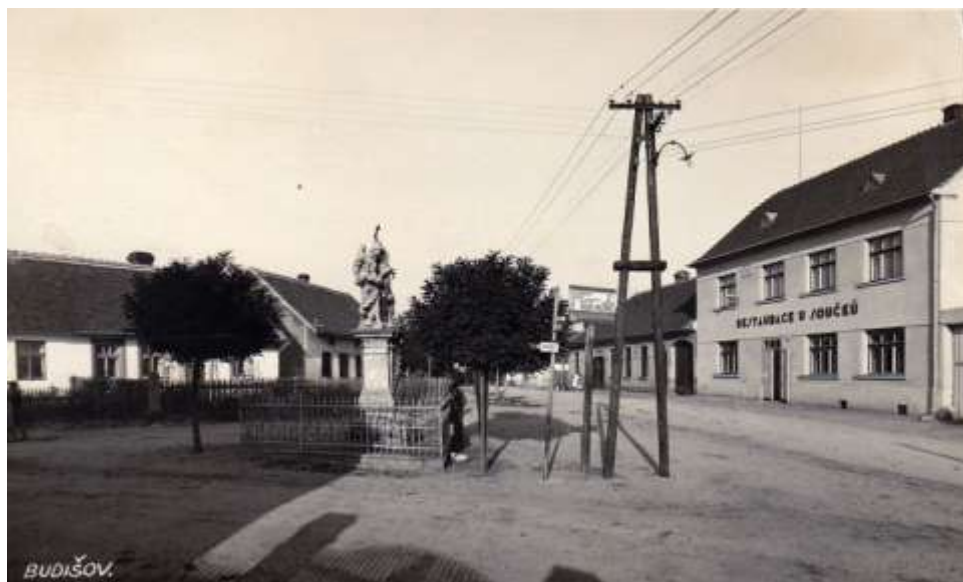
Sousoší sv. Václava, Kazdův dům první zleva

Otec jezdil pravidelně každý měsíc do Moravských Budějovic a Třebíče na nákupy nového zboží. Vozili je ve velkých proutěných koších vystlaných dřevitou vlnou a my museli pomáhat při vybalování a ukládání do skladu.