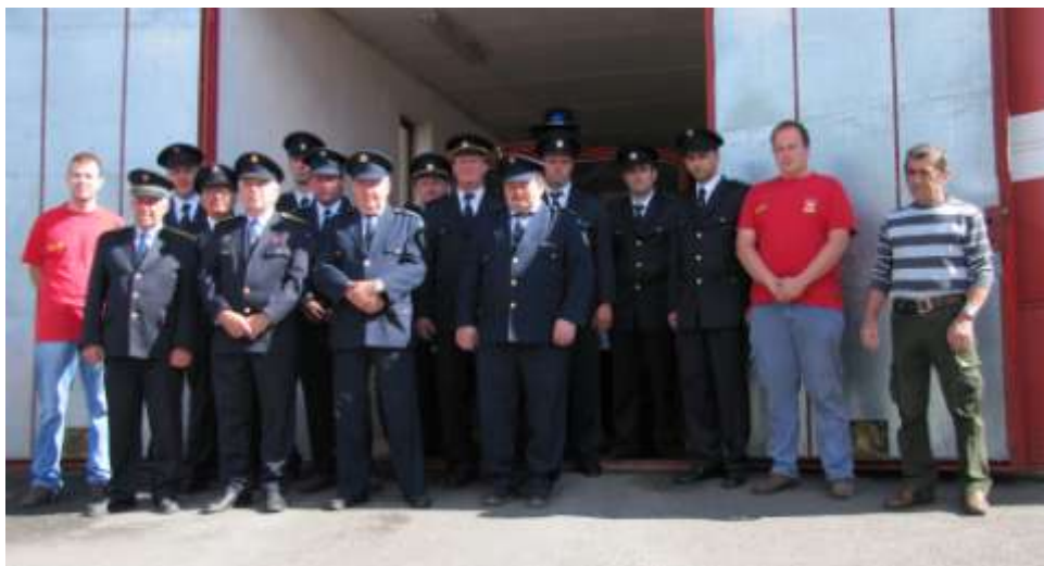
Společná fotografie při objížďení okrsku Budišov

K výkonu hašení tohoto požáru bylo potřeba i dýchacích přístrojů, které v té době byly zapůjčeny (v současné době máme, při zdokonalování techniky, tři dýchací přístroje značky Saturn 7)