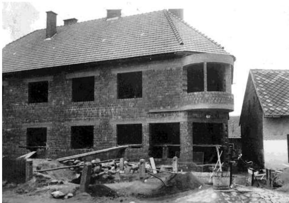
Stavba nového domu, asi rok 1942