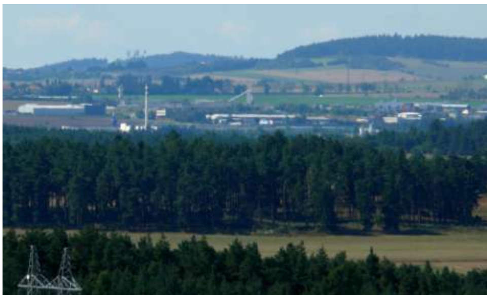
Průmyslová čtvrť Třebíč s komínem UP a za ním věž třebíčských hasičů