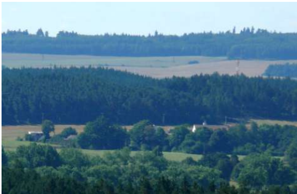
Pohled na východ Hostákova, nad ním kopec Křemel s vysílačem