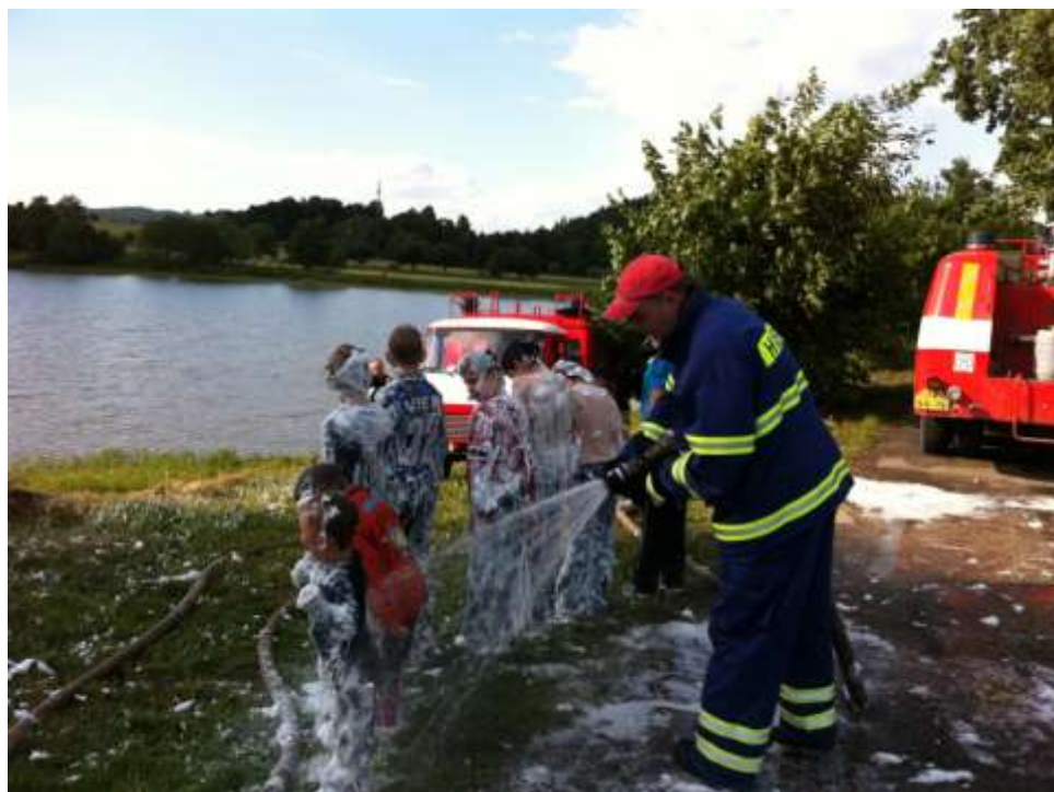
Údržba dětské techniky (rok 2011)