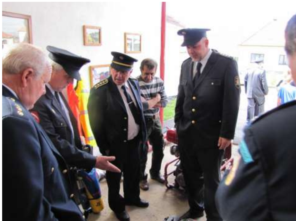
Den otevřených dveří v hasičské zbrojnici včetně návštěvy vedení okrsku Budišov