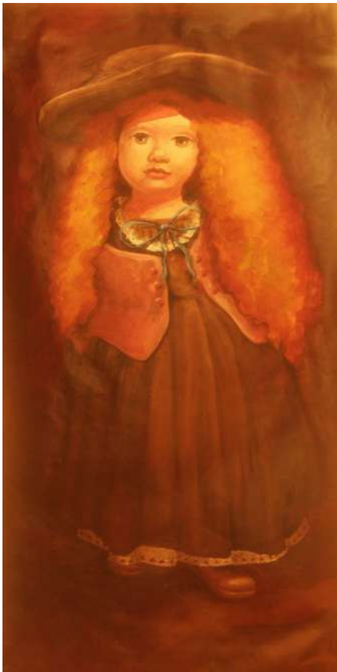
Paní s kudrnatýma vlasama – olej na papíře, 2011