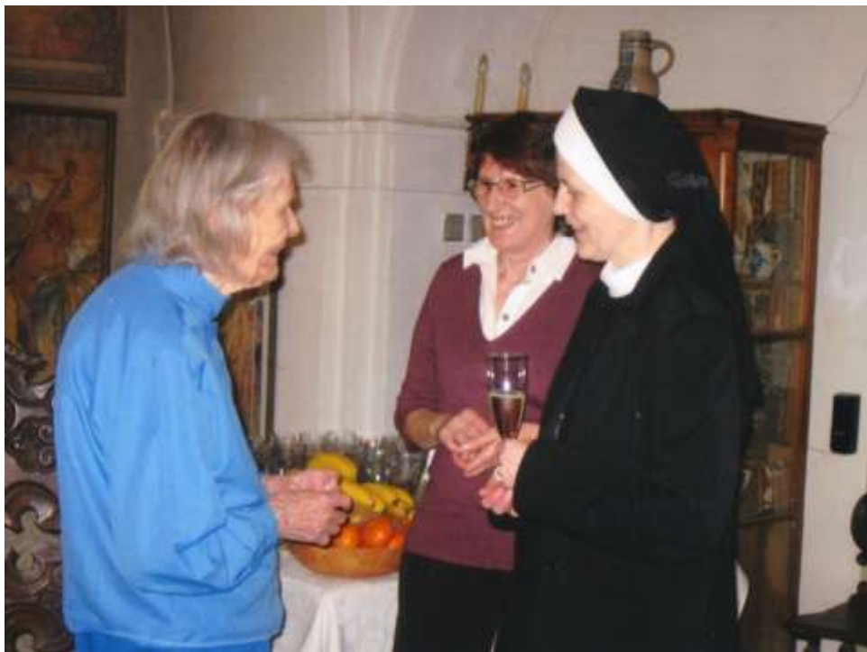
Mezi přáteli při oslavě svých 95. narozenin

Narodila se 5. 7. 1917 v Londýně. Stala se úspěšnou hudební skladatelkou (mezi její významná díla se řadí klavírní koncert, suita českých lidových melodií a hudba pro balet Macbeth). Se synem Alfonse Muchy, Jiřím Muchou, se seznámila za II. světové války. Bylo to v době, kdy Jiřímu Muchovi zemřela, po dvouměsíčním manželství, jeho žena, hudební skladatelka a dirigentka Vítězslava Kaprálová. Po ukončení války se v komunistickém Československu také živila jako překladatelka a pracovala pro hudební nakladatelství. Část svého života prožila ve Velké Británii.