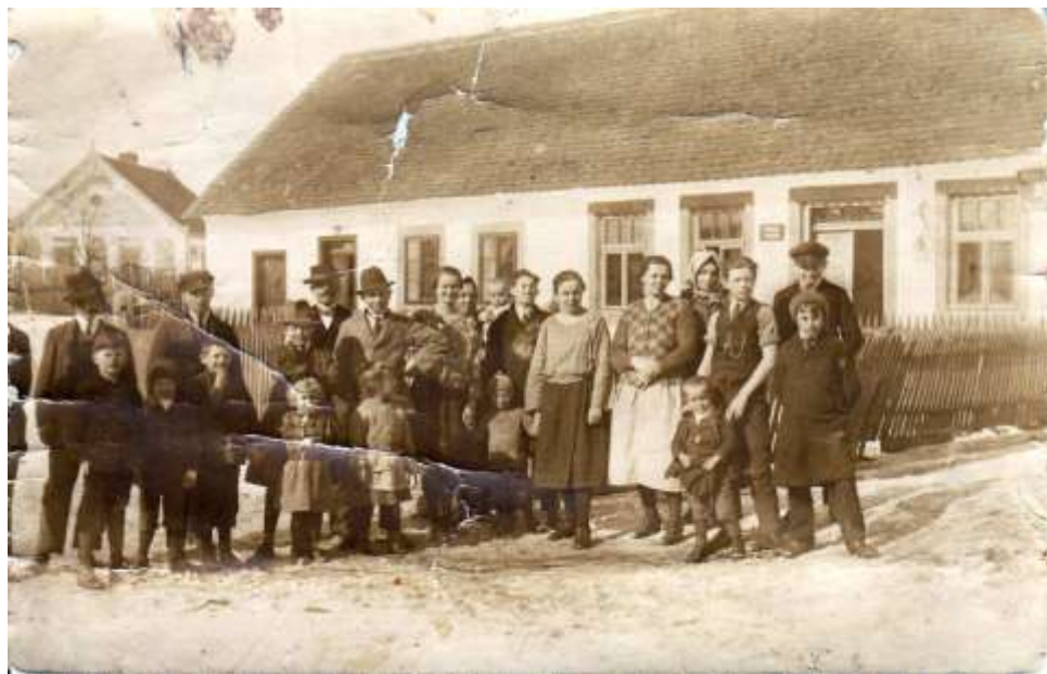
Před původním domem Kazdů

Někdy na konci třicátých let (přesný rok neznám, ale vím, že stavitelem byl pan Šula (myslím, že ze Studnic), byl dům přestavěn už s prostorem pro obchod mého otce. Obchod byl vybaven na dvou stranách systémem zásuvek a skříněk. V čele obchodu se ve spodní části nacházely velké zásobníky na sypké zboží (mouku), odkud se navažovalo do sáčků. Mouka se tehdy dodávala v 50kg pytlích a rodiče často vzpomínali, co to bylo za dřinu je přepravovat ze skladu vzadu za domem, vynést je do obchodu a pak v malém prostoru mezi pultem je zvednout a vysypat do zásobníků.