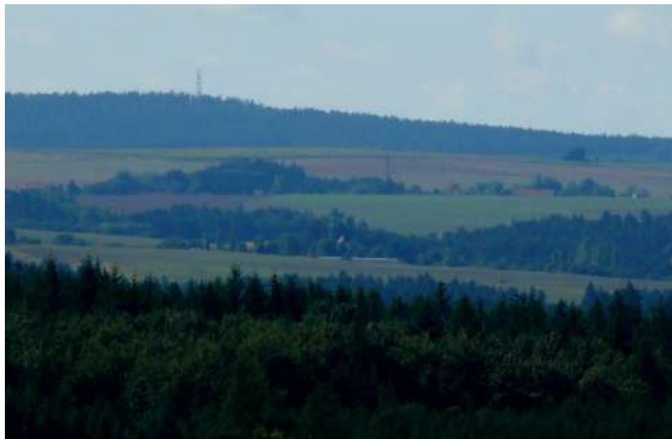
Střížov, Slavičky a na obzoru vysílač Na Skalném u Boňova