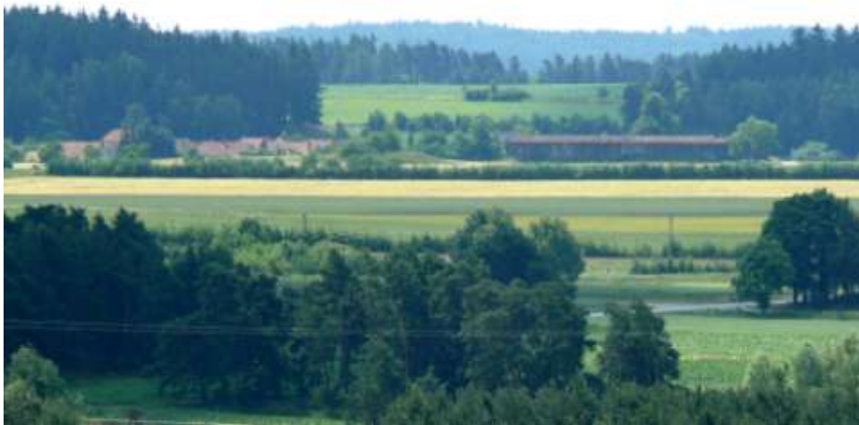
Pohled ke Kojatínu a na křižovatku ke Spálenému dvoru

V minulém čísle zpravodaje jsme se rozhlédli z věže kostela prostřednictvím osmi celkových pohledů, což nám sice umožnilo trochu se na věži orientovat, ale moc jsme toho neviděli. V dalších snímcích se budeme moci podívat na to, co je vidět z dvanáctkrát menší vzdálenosti. Přirozeně to budou jen výřezy.