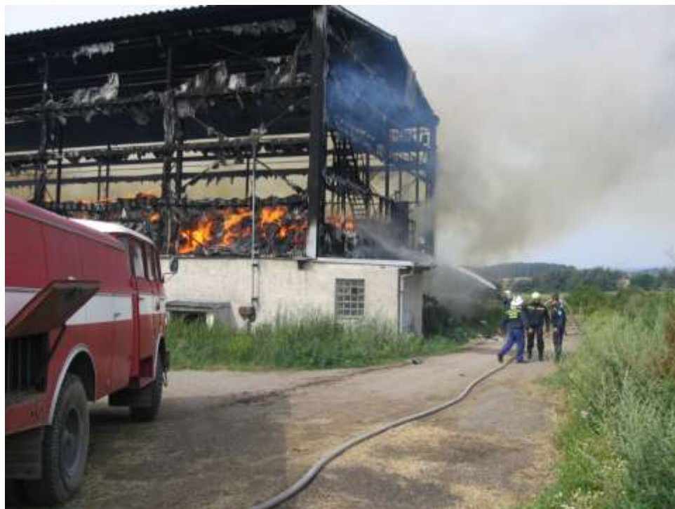
Zásah v ZD Budišov při požáru seníku (rok 2005)

Díky jim se dokoupilo ostatní soutěžní vybavení.