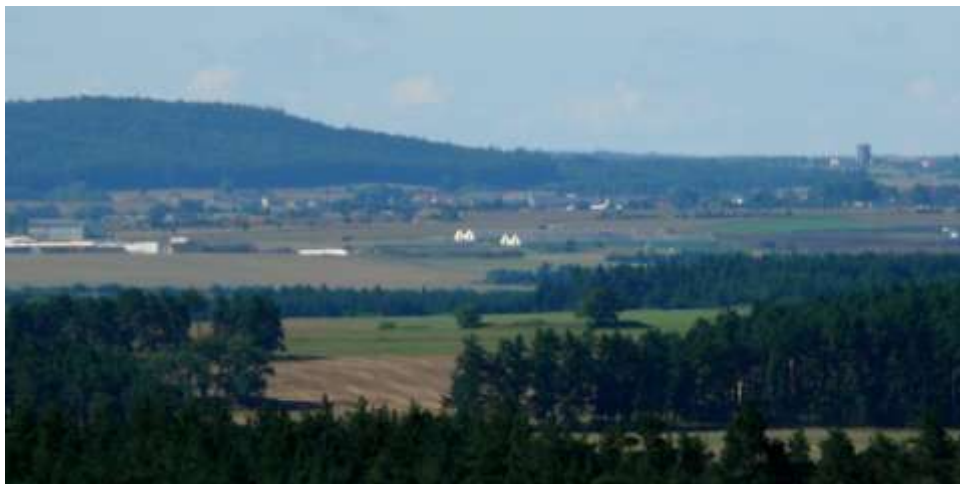
Vlevo Kožichovice, za nimi Střítež, vpravo na obzoru Mikulovice se silem