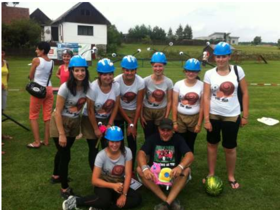
Dívčí soutěžní tým na estrádě v Kojatíně i s jejich nejlepším trenérem (rok 2012)