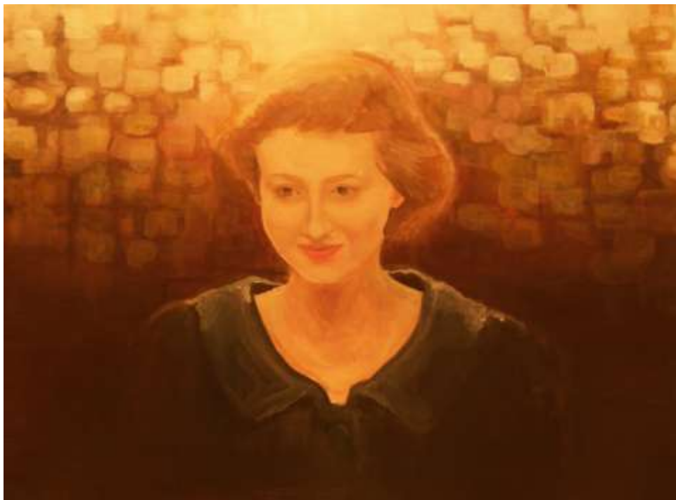
Alegorie světla a světelný rastr – kombinovaná technika na papíře

Mne snad nejvíce oslovil obraz pod tajemným názvem Alegorie světla a světelný rastr (komb. technika na papíře), kde z detailu ženy vyzařovala tajemnost a duševní vyrovnanost nebo rozpolcenost? Nechyběl ani budišovský kostel (tužka na papíře), který působil jako koráb v mlze, z něhož vystupuje věž, coby stěžň, se zářící korouhví na svém vrcholu.