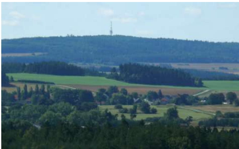
V popředí Valdíkov, za ním Hostákov a na obzoru Klučovská hora s vysílačem