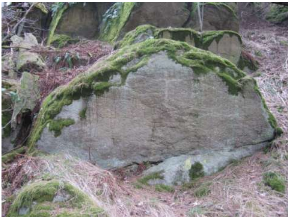
Výtvar místních chlapců

Uhřínovskými kameny končí vyprávění o smírčích kamenech.