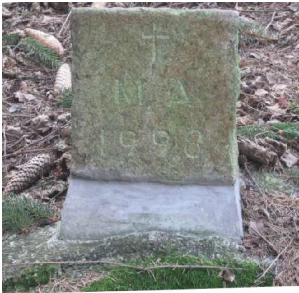
Tragická událost v srpnu 1998

Za posledními kameny se vypravíme do Uhřínova. Zde jsou celkem čtyři. První s pozitivně vytesaným reliéfem kříže a bodáku se nachází na okraji trati Žlíbky a připomíná smrt francouzského vojáka za napoleonských válek. Poblíž tohoto kamene se v lese nachází nejmladší smírčí kámen s vyrytým menším křížkem, letopočtem 1998 a dvěma písmeny M A. Připomíná tragickou událost, která se v těchto místech stala v srpnu 1998. Kámen sem byl umístěn v roce 2008. Třetí kámen s pozitivně vytesaným reliéfem kříže a letopočtem 1852 najdeme nedaleko silnice do Dolních Radslavic. Na tomto místě došlo náhodným výstřelem k zabití myslivce.