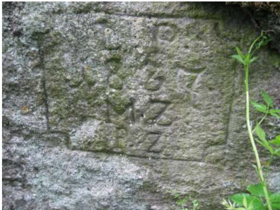
památný kámen u Vladislavi

Za dalším památným kamenem se vydáme z Lipníka do Vladislavi, kde za vesnicí, u cesty k bývalé prachovně, můžeme na skále spatřit v ozdobném rámečku vyrytý nápis připomínající výšku vody při staleté povodni v r. 1837 a vedle letopočtu L P 1837 písmena M. Z. P. Z.