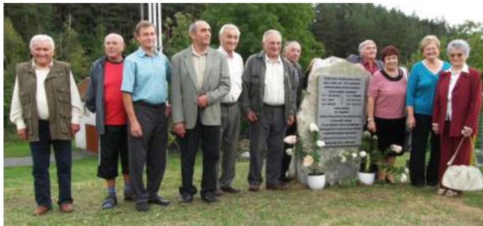
Děti z vystěhovaných hroznatínských rodin