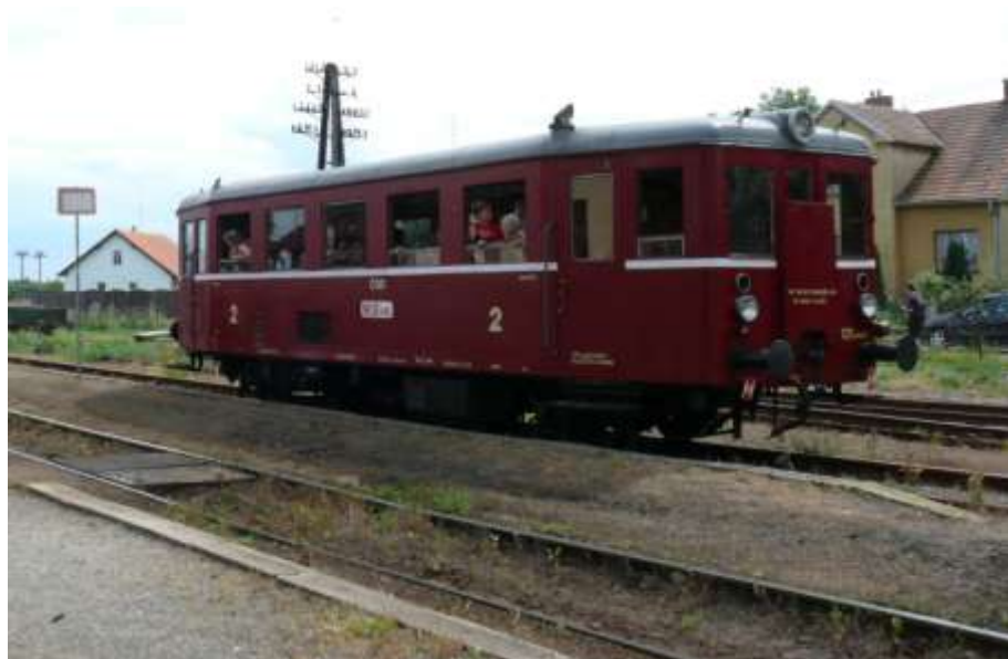
21. června 2008 – motorový vůz 131.1448 „Hurvínek“