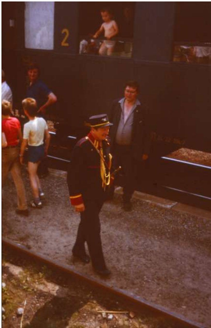
Z oslav 100 let dráhy Studenec – Velké Meziříčí r. 1986