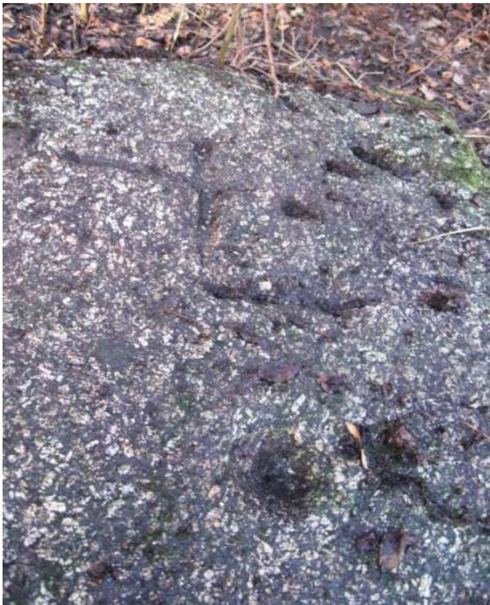
Kámen v Osovém, detail

Z Rohů se vydáme do nedalekého Osového. Tam býval na mezi, u stezky do lesa Ochoza, smírčí kámen s pozitivně vystupujícím reliéfem kříže, který je vyobrazen ve Vlastivědě moravské Velkomeziříčského okresu. Byl však při melioračních pracích zahrnut. Kromě tohoto kamene bývaly v Osovém ještě dva kameny v lese. Jeden z nich