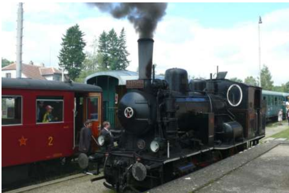
28. srpna 2010 lokomotiva 310.922