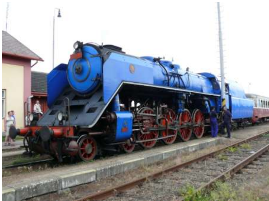
21. června 2008 – lokomotiva 498.022 „Albatros“