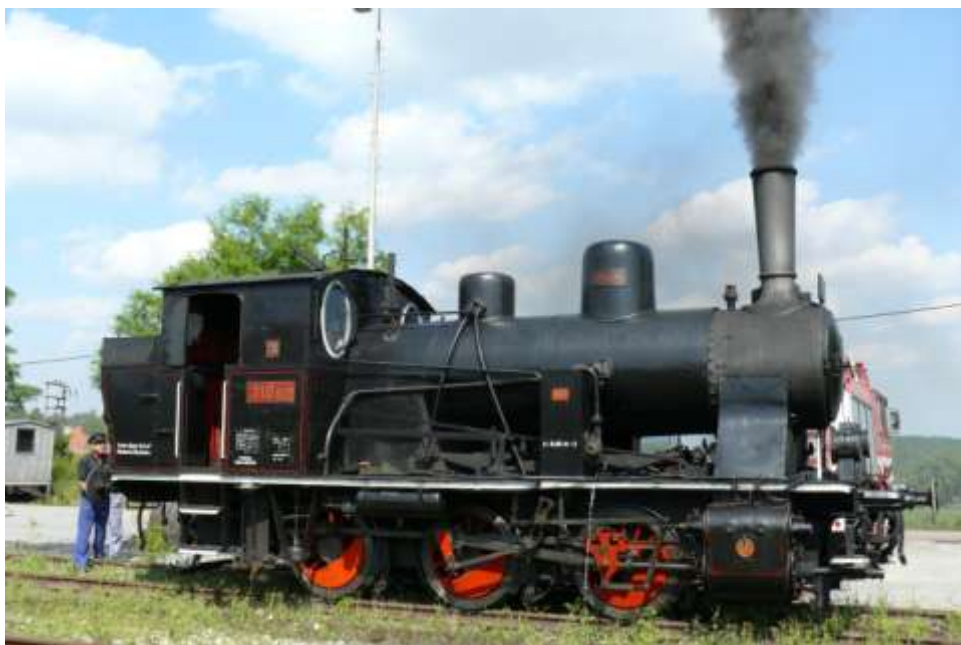
15. srpna 2009 lokomotiva 310.922