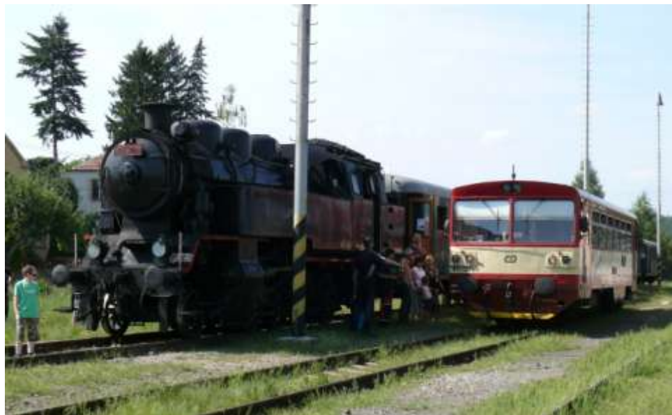
21. srpna 2011 lokomotiva 433.001 „Skaličák“ (v porovnání s dnešní „osmsetdesítkou“)