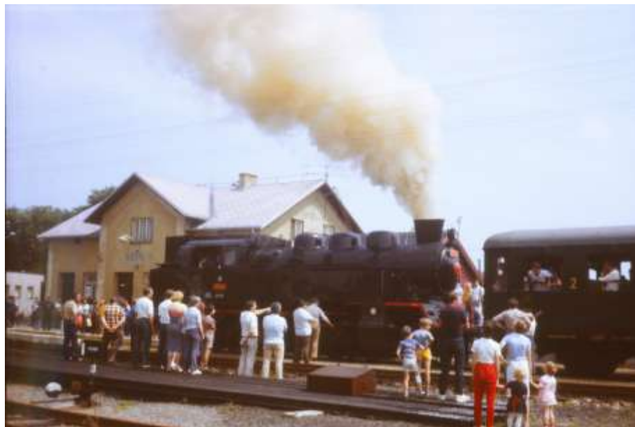
15. června 1986 – lokomotiva 433.002 „Matěj“