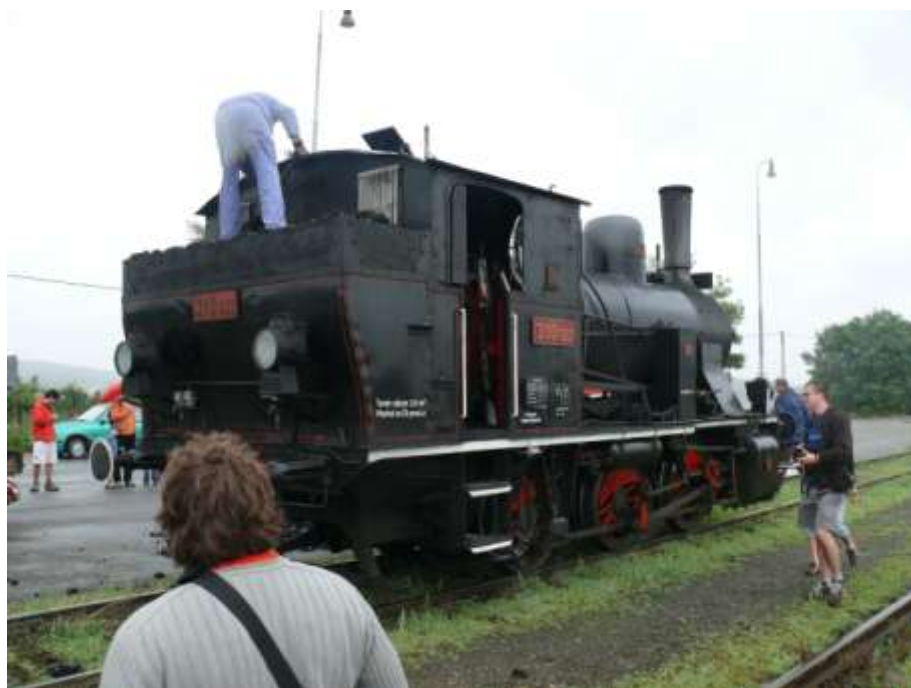
16. srpna 2008 lokomotiva 310.922 „Kačenka“