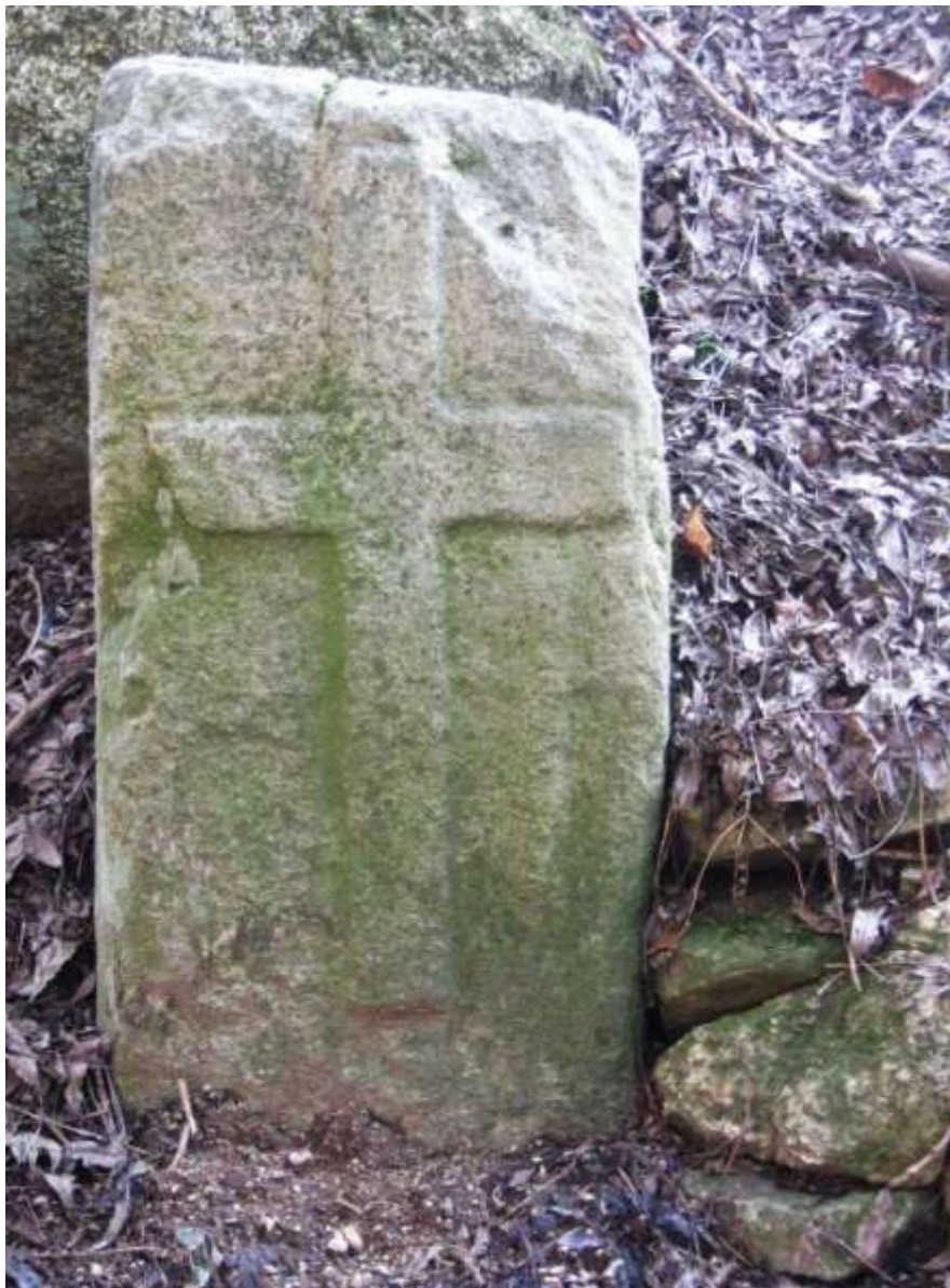
Uhřínov - smírčí kámen u trati Žilbky

se ztratil, podle vyprávění ho někdo použil do základů při stavbě domu, druhý se zachoval. Ten má dovnitř vyryty dva křížky a dva důlky. Podle jednoho z pamětníků tam býval i letopočet 1704, který se časem odlomil. Mezi starší generací se v Osovém traduje pověst, že poblíž tohoto kamene pazderníci bílili prádlo, u kamene svačili a do těch důlků si dávali vajíčka. Pověst o tom, proč byl kámen vztyčen, se nedochovala.