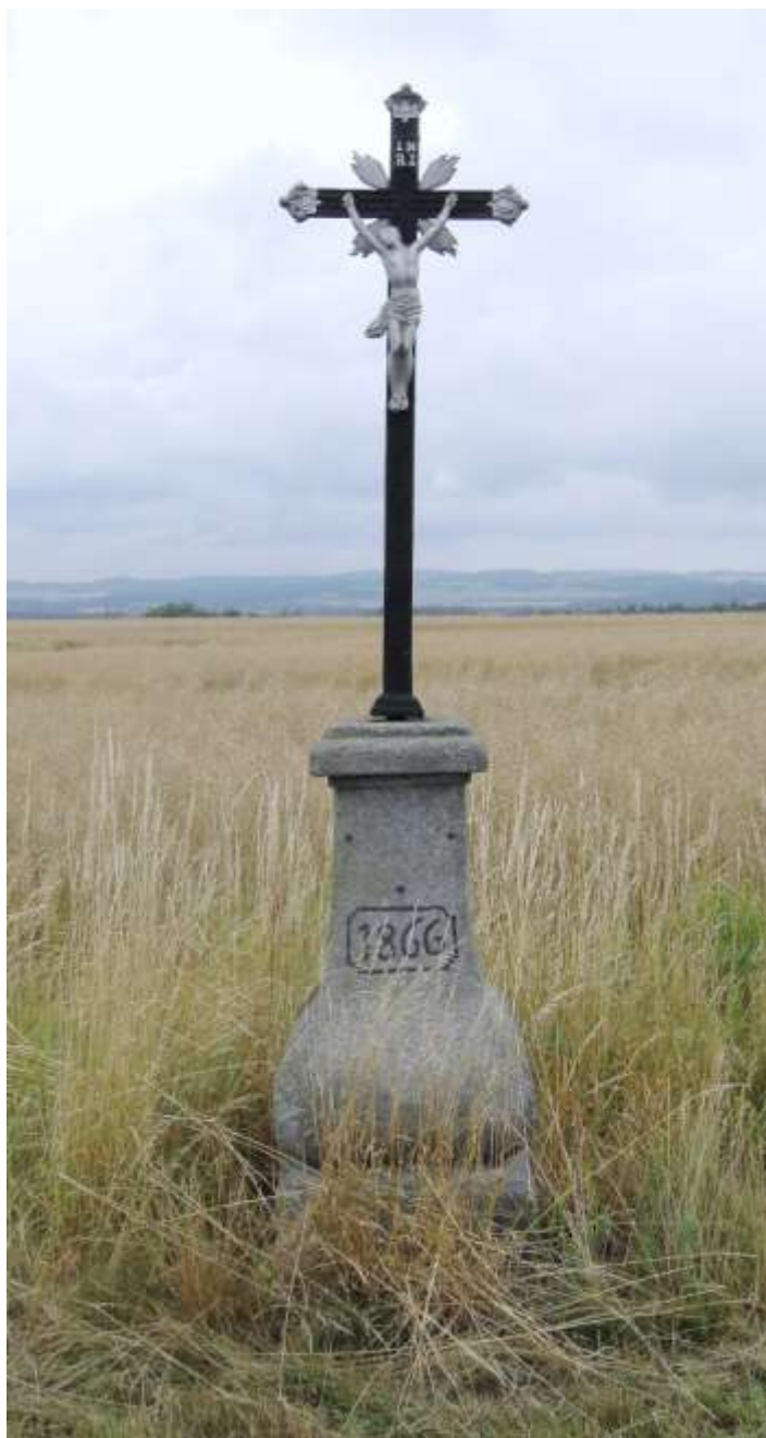
Od železného kříže na kamenném podstavci s letopočtem 1866 za Pyšelem ve směru na Zahrádku je krásný pohled na krajinu v okolí Tasova.