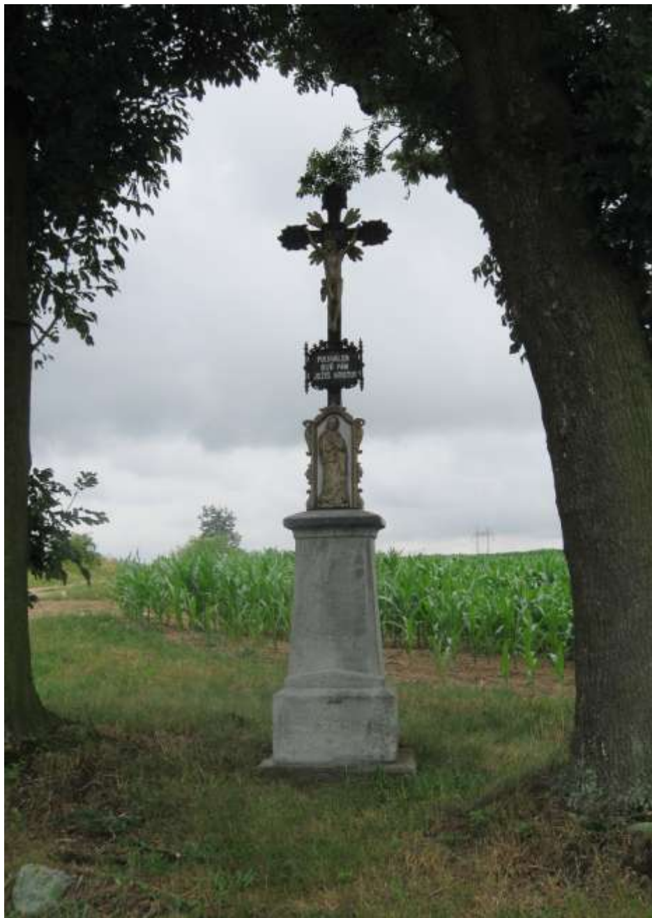
Na tabulce železného kříže mezi Pyšelem a Častoticemi stojí: POCHVÁLEN BUĎ PÁN JEŽÍŠ KRISTUS