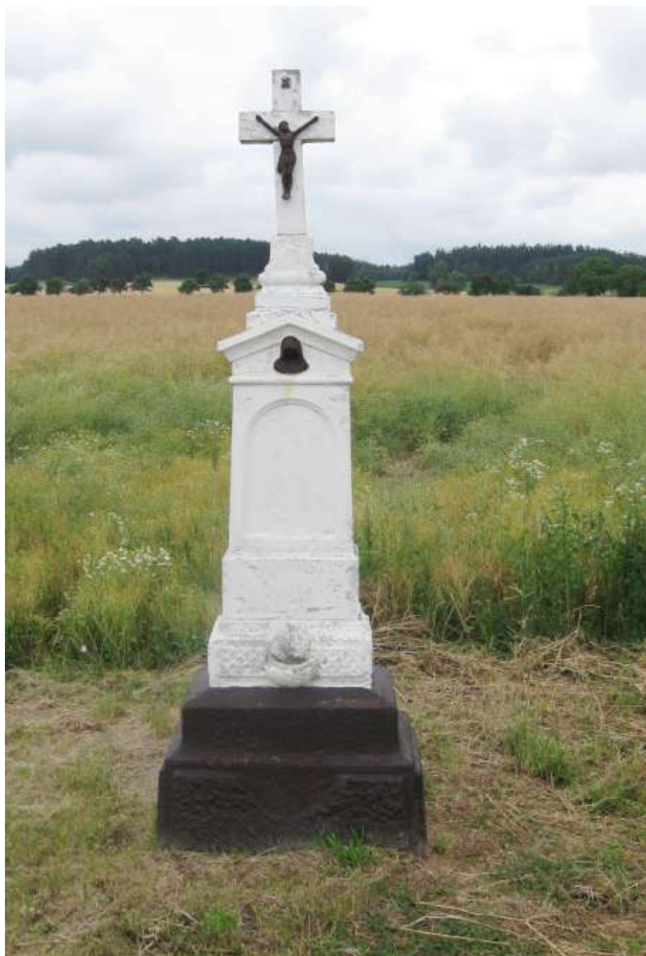
S Pyšelem se ve směru na Vaneč loučí bílý kamenný kříž na černém podstavci.