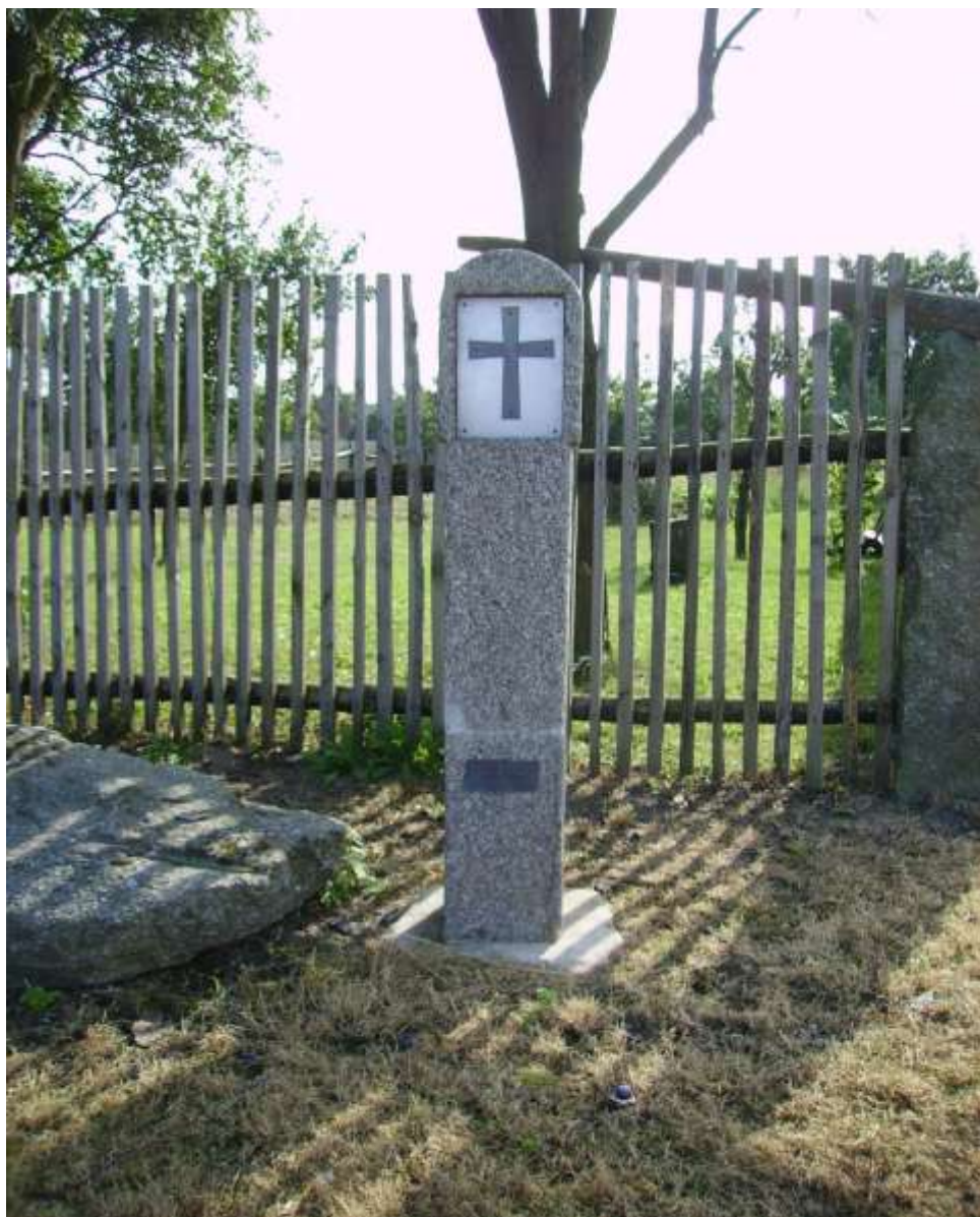
Nynější umístění, dříve v polích