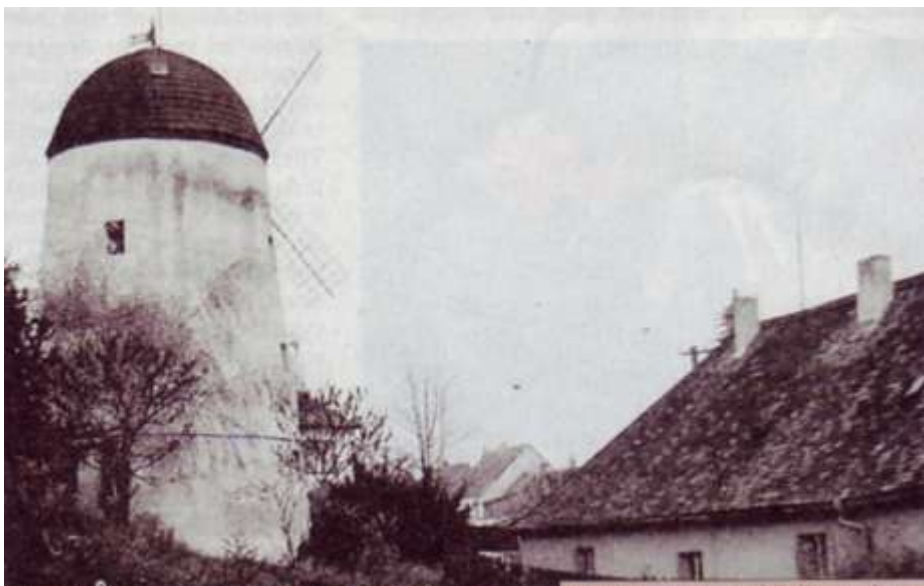
Třebíčský mlýn v 80. letech 20. století

synové Franz (1808–1885) a Karel (1810–1884), kteří se narodili v Třebíči. Časem mezi nimi došlo k neshodám, které vyvrcholily v roce 1835, kdy se Karel od bratra odtrhl a osamostatnil se (rozchod bratří však nebyl absolutní, společně se např. podíleli v roce 1836 na stavbě větrného mlýna, který dodnes tvoří jednu z dominant Třebíče, v němž se nemlela mouka, ale smrková kůra na činění kůží v místních koželužnách). V roce 1842 kupuje bývalý Padrtův mlýn v Třebíči-Borovině, který přebudovává v novou koželužnu, která se stává největší koželužskou manufakturou v kraji. Stalo se tak díky neustálé modernizaci výroby. Karel Budischowsky byl jedním z prvních podnikatelů na Moravě, kteří instalovali do závodu parní stroj. Roku 1853 továrna zakoupila i stroj na štípání kůže, který umožňoval rozříznout kůži naplocho na dvě části. Zpracovávali i kůže pocházející z indického divokého skotu. Díky těmto aktivitám se firma zařadila mezi nejmodernější podniky celé habsburské monarchie. Odrazila dokonce i nápor Američanů, kteří kolem roku 1870 zaplavili trh buvolími kůžemi.