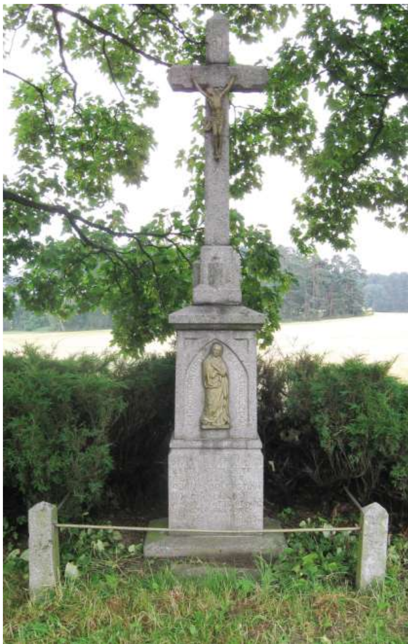
Kamenný kříž mezi Pyšelem a studeneckým nádražím postavila rodina Rohovských z Pyšela č. 14