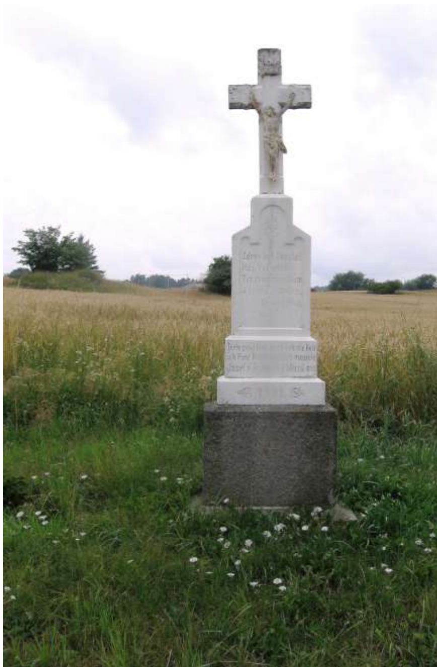
Před vjezdem do Pyšela ve směru od Budišova nás přivítá mramorový kříž Musilů, kteří jej postavili v roce 1901