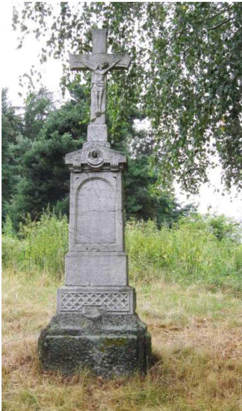
Jeden z nejhezčích kamenných křížů z roku 1920 se nachází za Pyšelem u silnice na Pozďatín.