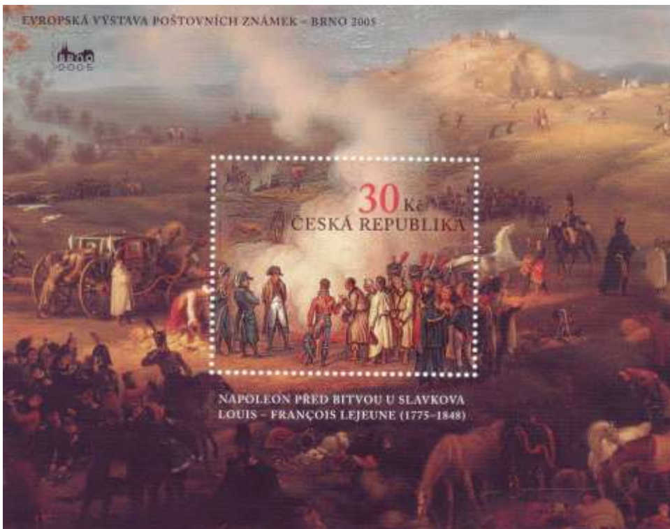
aršík s tématikou Slavkovské bitvy