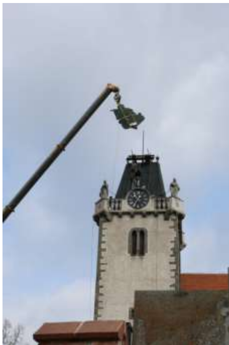
Obr. 1 a, b – Snímání plastiky s věže