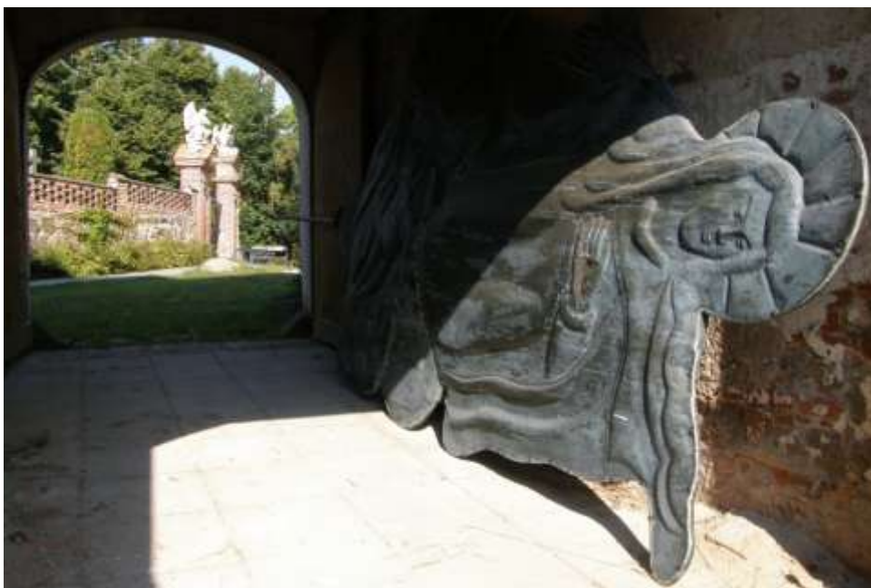
Obr. 4 – Útočiště plastiky pro půl roku