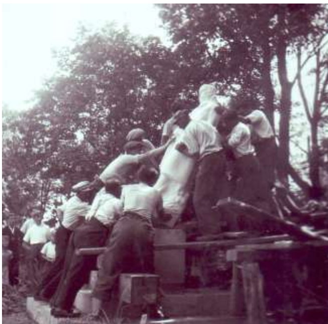
Stavění sochy na podstavec