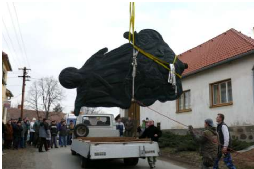
Obr. 2 – Uložení plastiky k odvozu