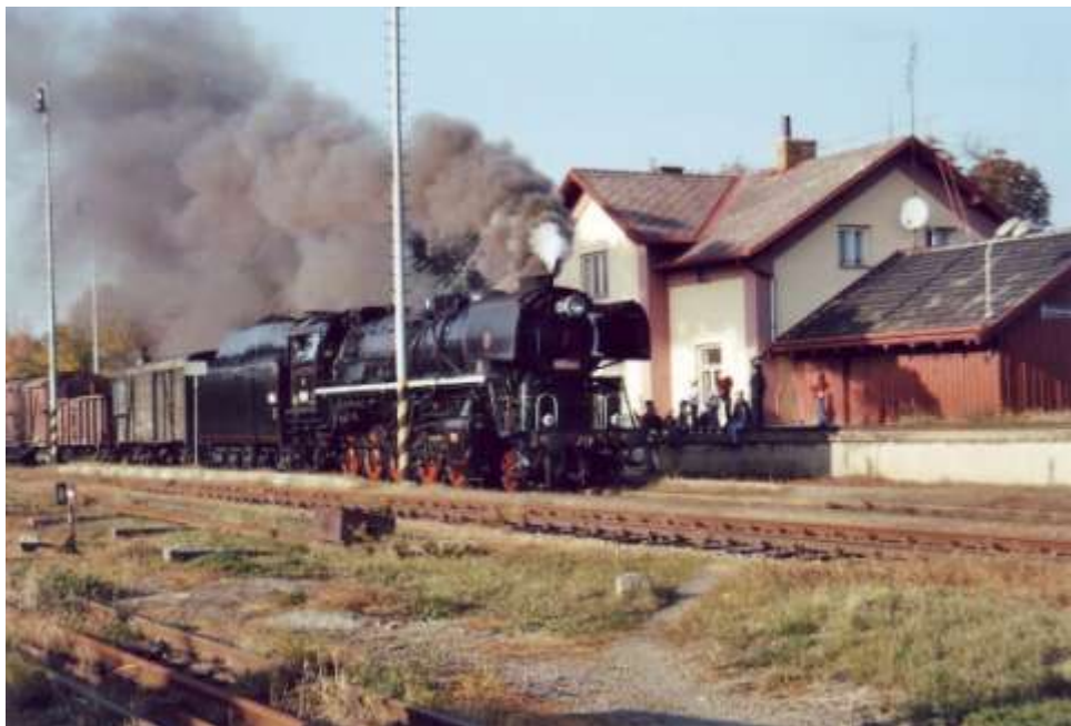
Štoker přijíždí na nádraží v Budišově