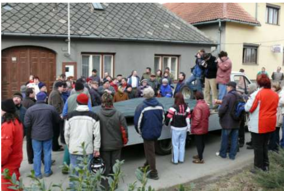
Obr. 3 – Rozloučení s korouhví