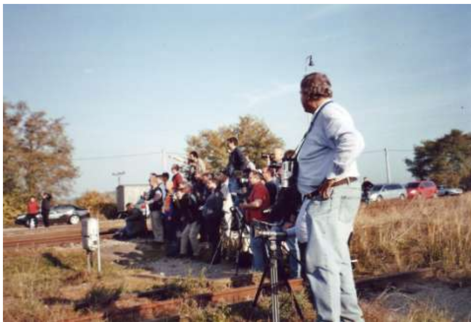
Němečtí objednatelé se připravují na příjezd vlaku

Snad pár slov k této krasavici. Parní lokomotiva Štoker řady 556 (ta „budišovská“ měla přesné označení 556.0506) sloužila pro nejtěžší nákladní vlaky na hlavních tratích. Byla vyráběna v plzeňské Škodovce v letech 1951–1958 v počtu 510 kusů. Lokomotiva byla vybavena šnekovým příkladačem, díky kterému měla přezdívku Štoker. Poslední stroj dojezdil roku 1983.