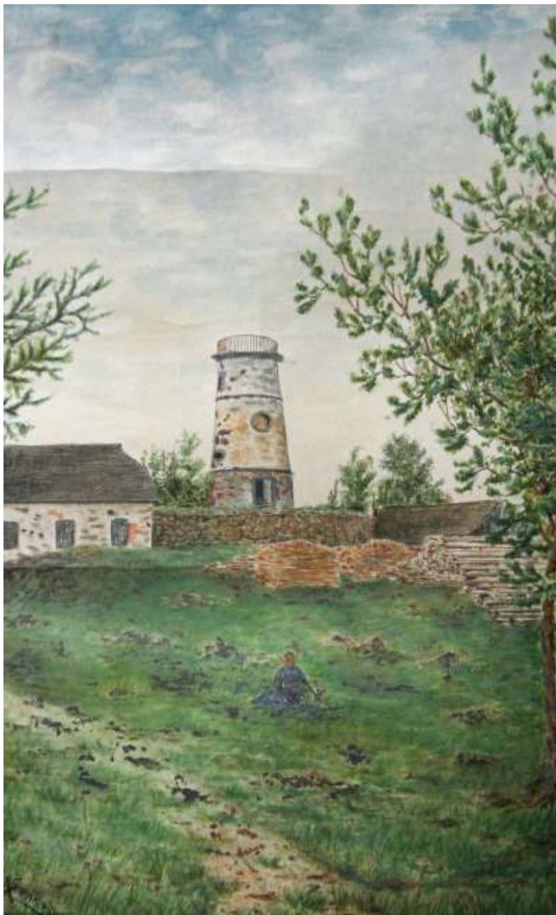
akvarel František Zejda