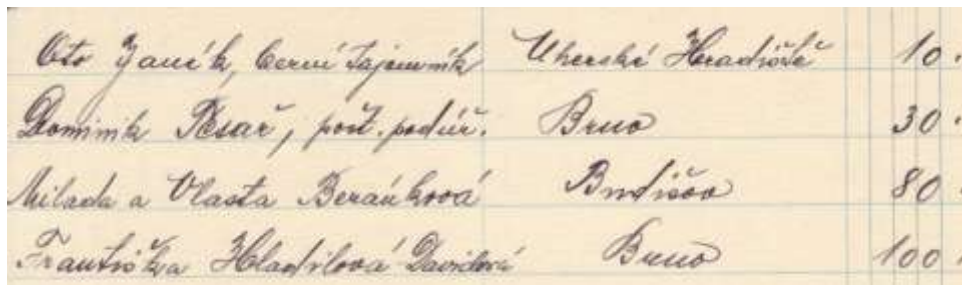
Fotokopie Knihy dárců

O tom, že tato výzva měla odezvu, svědčí fotokopie jmenného seznamu dárců z Knihy dárců na postavení pomníku panu prezidentu Osvoboditeli T. G. Masarykovi v Budišově u Třebíče 15. srpna 1938, na památku 400. výročí povýšení Budišova na městečko a 20. výročí Československé republiky