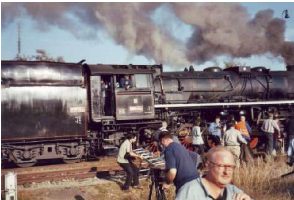
Němečtí příznivci se rychle přesouvají ke svým autům

Kuriozitou se stalo, že jim v záběrech vadila i tráva a býlí v kolejišti, kterou se snažili jednotlivci ze země rukama vytrhat. O „výzdobu“ naší čekárny nejevili větší zájem. Díky značkám aut a filmovému vybavení se dalo usuzovat, že se jednalo o zájemce ze zámožnějších vrstev. Jak se podařilo zjistit, parní lokomotiva s vagony jela tak, aby nenarušovala stávající provoz na trati a na své trase měla vytyčených i několik zastávek mimo železniční stanice, určených pro filmový a fotografický záznam.