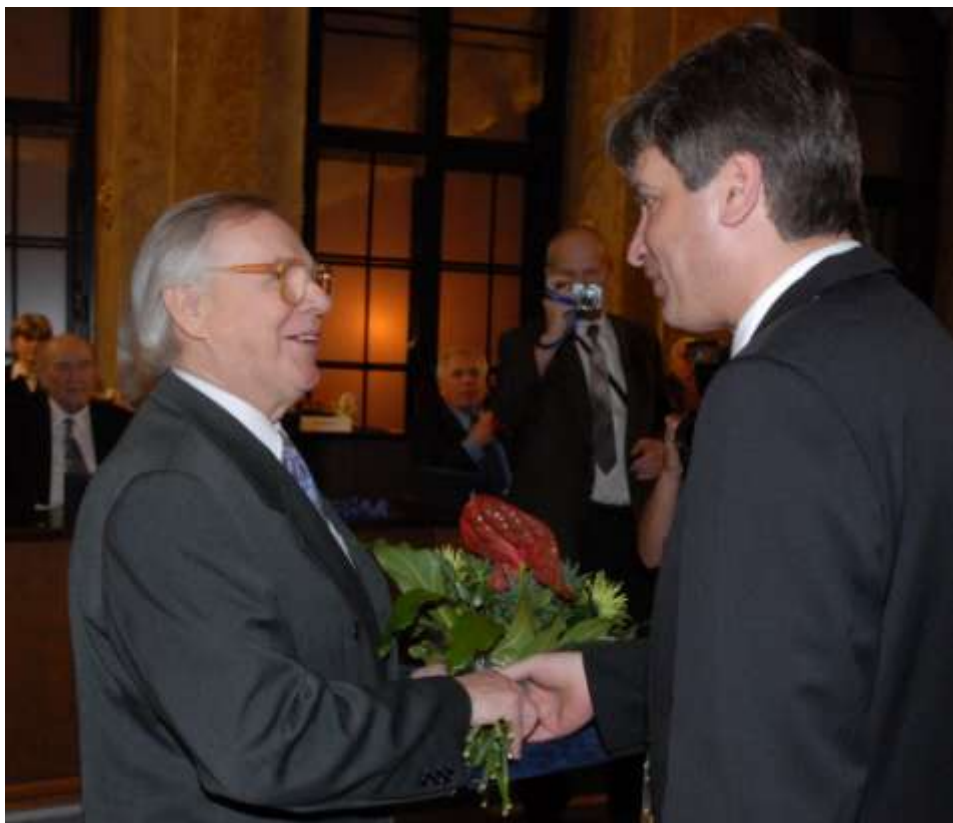
Cenu předává a gratuluje brněnský primátor Roman Onderka