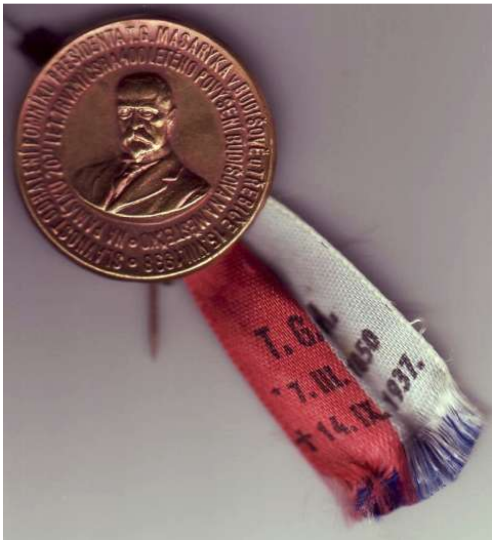
Pamětní odznak s trikolorou