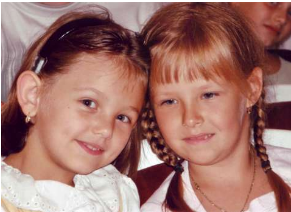
fotografie Karel Pavlíček