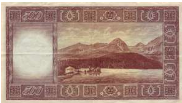
Bankovky vydané po roce 1950