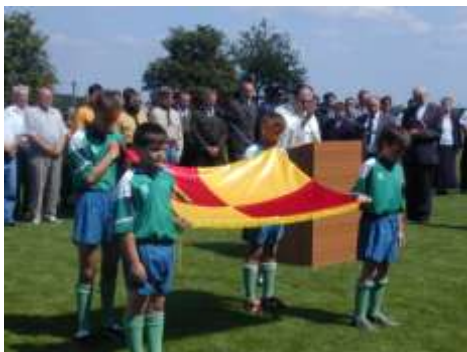
Žehnání obecního praporu 2002

Budova základní školy byla dostavěna v roce 1951. Mateřská škola sídlí v budově dokončené roku 1986. Budova, v níž je zdravotní středisko a lékárna, byla dostavěna roku 2001 a sídlí v ní i obecní úřad, pošta a nákupní středisko Centrum. Areál budov Zemědělského družstva v Budišově s čerpadlem pohonných hmot leží na jihu městyse, na východě u rybníka Pyšeláku najdeme dětský domov Holeje, dříve Amalienhof. Pod zámekem je od roku 1997 zahradnictví, čerpadlo pohonných hmot poblíž bylo otevřeno roku 1996. V sousedství stojí budišovský lihovar. V městyši jsou restaurace Sport, U Kazdů, hostinec U Floriánka a cukrárna. V tomto století přibýly v Budišově nové stavby – ke škole byla přistavěna nová kuchyně s jídelnou a obnoven byl kulturní sál. U školy vzniklo víceúčelové hřiště. U silnice k Mihoukovicím stojí nový dům s pečovatelskou službou. Nad novým obecním rybníkem postavila DTJ Nové Město na Moravě sportovně tělovýchovné centrum.