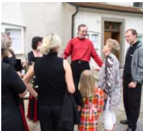
Se souborem Musica Animata 2004