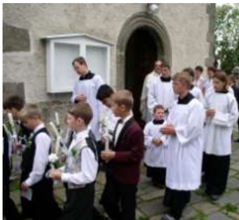
První svaté přijímání dětí v Budišově 2003

V dalším se dozvíme něco o našem novém knězi, který logicky propojuje všechny předchozí informace. V obci Budišov se narodil a strávil zde dětství, ve farnosti budišovské působil jako ministrant, pastorační pomocník a později občas i jáhen, vše v trebičském a velkomeziříčském děkanství v rámci brněnské diecéze. Prošel konviktem, seminářem i teologickou fakultou a nyní (doufejme, že dočasně) završuje seznam pramicantů v Budišově.