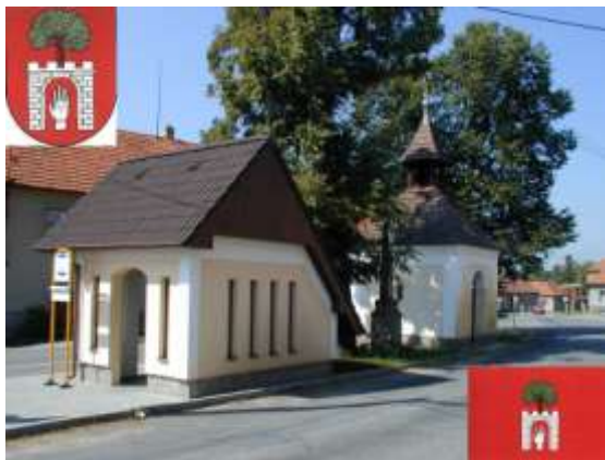
Nejsvětější Srdce Páně v Námračí