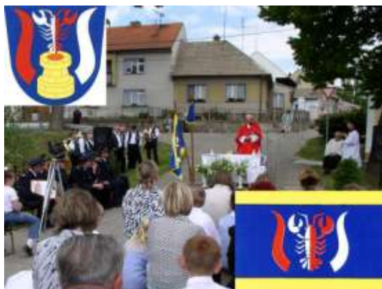
Žehnání obecního znaku a praporu ve Studnicích