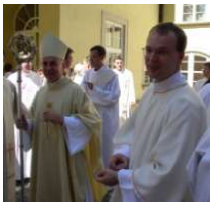
S rodiči a Otcem biskupem při jáhenském svěcení 2005