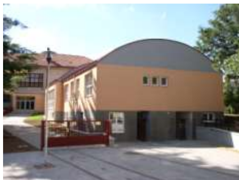
Přístavba školní jídelny 2006