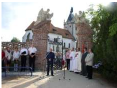
Žehnání obnovené hřbitovní zdi 2005