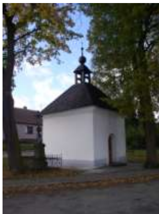
Sv. Jan Nepomucký v Hodově