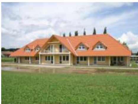
Dům s pečovatelskou službou 2005