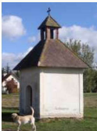
Zvonice v Klementicích