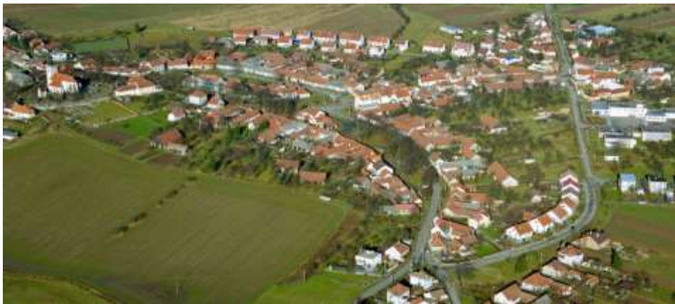
Uprostřed místo slavnosti, vlevo kostel, vpravo úřad městyse

Následující stránky mají za úkol představit místo a aktéra primiční slavnosti, kterou se nám náš nový Otec představí (i když jej všichni známe), poskytnout pomůcku pro aktivní účast na slavnostní mši a být snad i jakousi památkou na tuto nevšední událost.