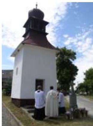
Žehnání kříže v Kamenné