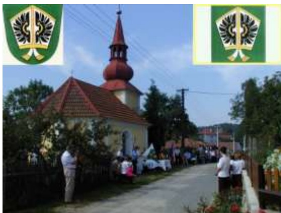
Žehnání obecního znaku a praporu v Rozích