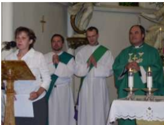
První mše v Budišově po jáhenském svěcení 2005