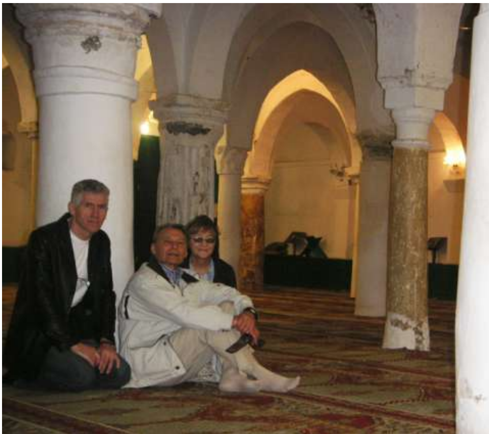
Mešita Velbloudice – Tripolis

stresovaného Evropana. Tam čas a zodpovědnost stále nehrají takovou roli jako u nás. Uvedu příklad: Asi 20 lidí jsme měli odjet na Sabratu, jednu z oněch starořímských památek. Organizátoři našeho pobytu sdělili, že odjedeme zítra v 11 hodin a dodali „In š'alláh“ tedy „Dá-li Bůh“. Jako skupinka zkušených cestovatelů jsme se trousili po poledni do hotelu. Dali jsme si ještě kávu a v klidu čekali půl hodiny. Když se nic nedělo, někdo to šel sdělit pořadatelům... ti se nejdříve divili, že jsme ještě neodjeli, pak zběsile mobilovali a pobíhali, asi za 5 minut předjel autobus, který stál za hotelem na parkovišti, řidič jen čekal na pokyny... a celý organizační tým se na nás usmíval, jak to dobře a rychle vyřešili! Holt čas a organizační přesnost mají v Africe stále ještě jiné parametry.