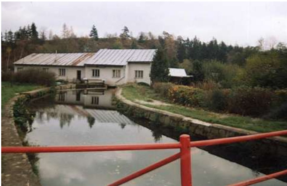
Poušov – vodní elektrárna