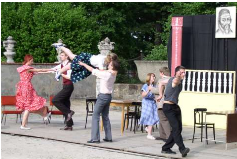
Ve víru R'n'R