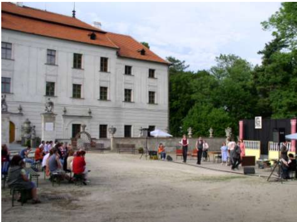
Divadlo na nádvoří

Škoda jen, že diváků bylo méně, než je zvykem, ale ti, co přišli, určitě nelitovali.