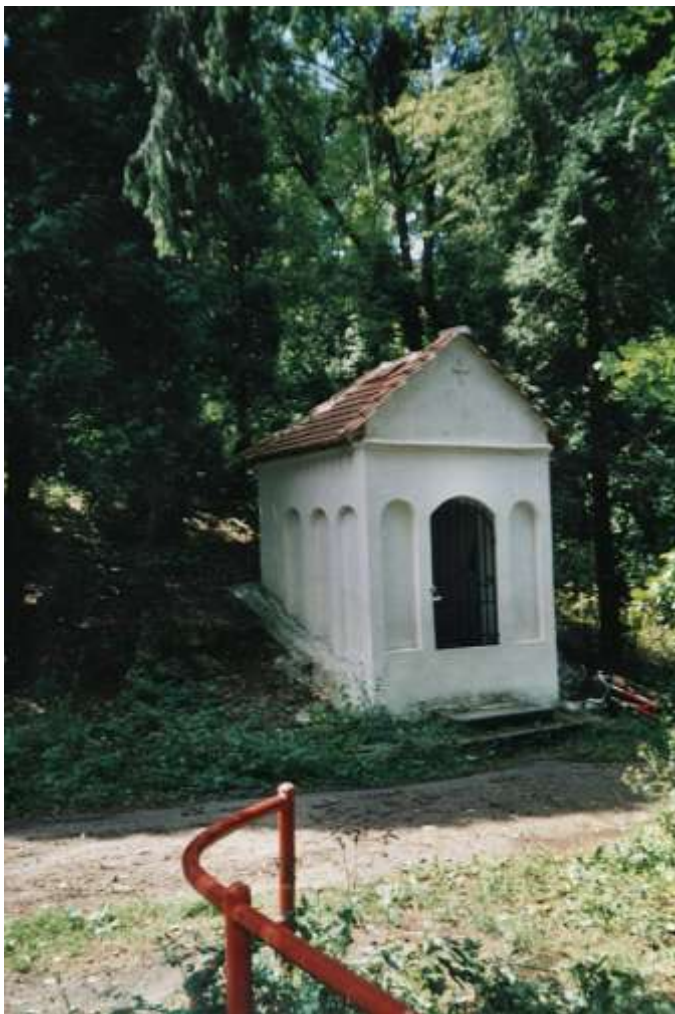
Kaplička u Janova mlýna