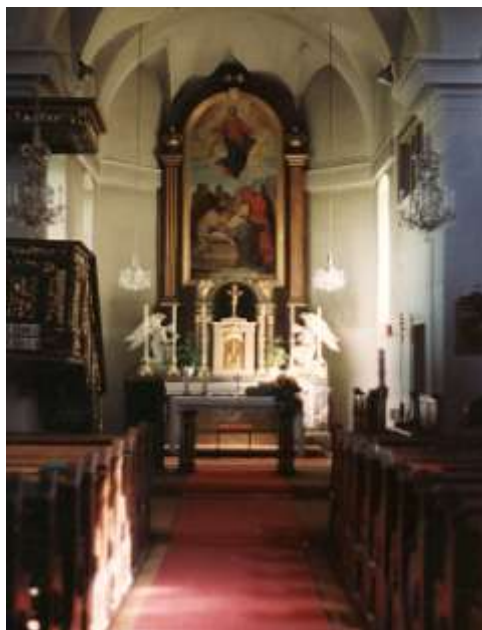
Náhrobek a kostel v Niederabsdorfu