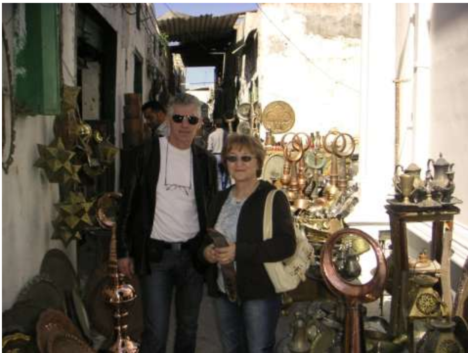
Tržiště (súk) – Tripolis