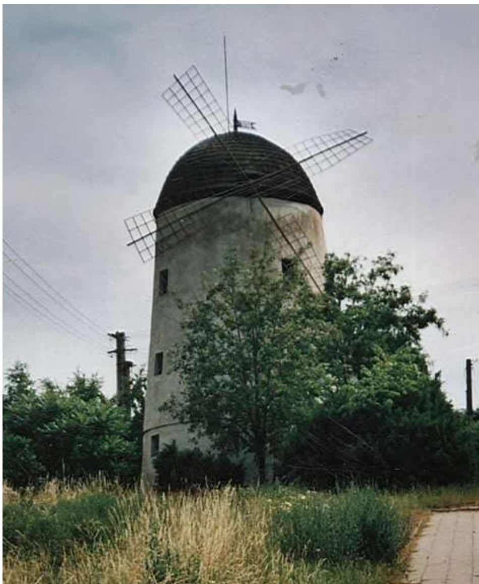
Větrný mlýn na Stařečce

Sepsáno podle: Třebíčského kronikáře Jiřího Joury, kronikáře Ptáčova, pana Benáčka Mlynářský rod Stejskalů, Jan Padrnos 1972