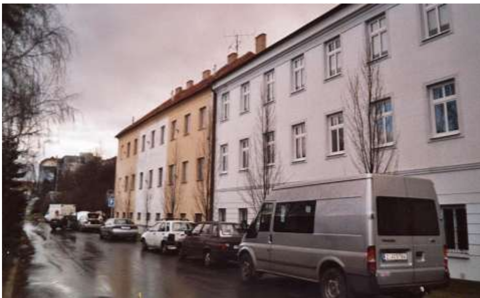
Kohnův mlýn (budova zleva)