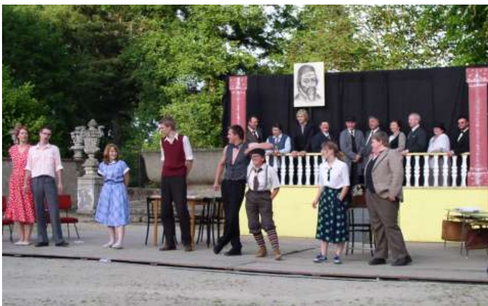
Děkujeme, příště přijdeme zase