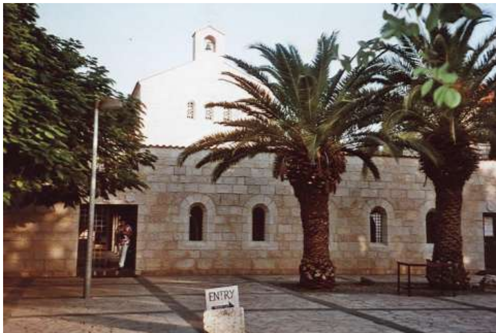
Tabcha – rozmnožení chleba a ryb

Při celkovém pohledu na město nelze přehlédnout zlatou kopuli muslimské svatyně Skalní dům, v místech, kde měl podle tradice Abrahám obětovat svého syna Izáka. Po muslimy je toto místo, kde měl prorok Mohamed na svém oři vstoupit do nebe.