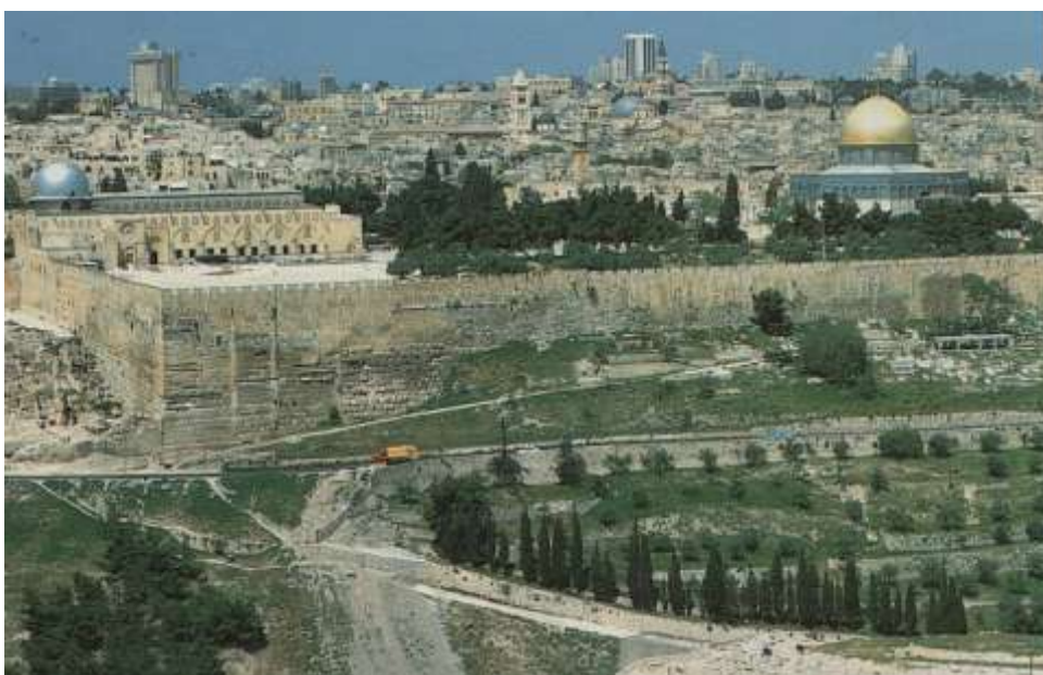
Pohled z Olivové hory

Z Betléma vyjíždíme přes check-point (zeď zde sahá až na okraj Jeruzaléma) na sever. Jedeme kolem řeky Jordán, jež vytéká pod horou Hermon a proudí do Genezaretského jezera. Délka řeky je vzdušnou čarou 90 km, díky různým záhybům se její délka prodlouží asi na 270 km. Krajina kolem Galileje je nádherná především zjara, ale