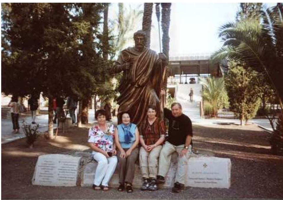
Kafarnaum – u sochy apoštola Petra