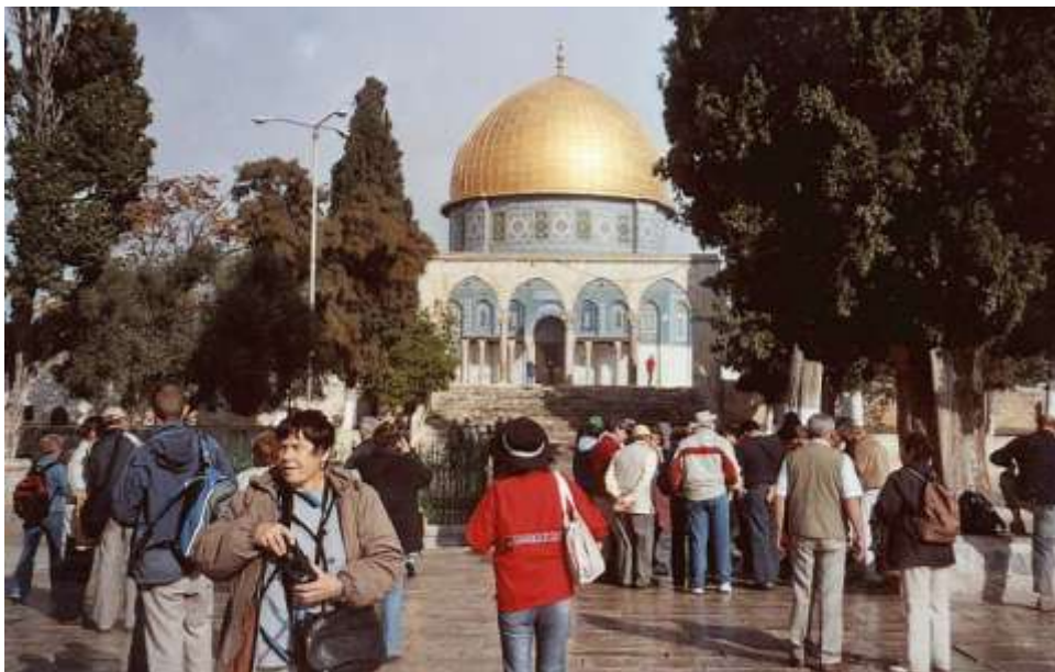
Jeruzalém – Skalní chrám (Omarova mešita)