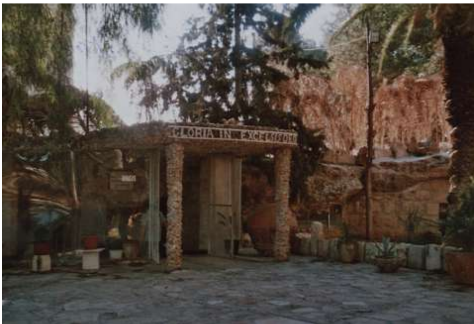
Betlém – Pole pastýřů