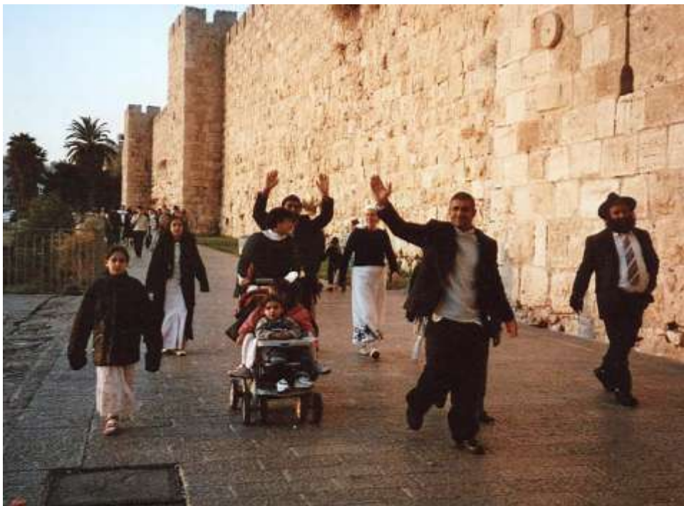
Jeruzalém – Javská brána

Za hradbami procházíme Damašskou branou k Zahradnímu hrobu, asi čtyři sta metrů od Božího hrobu. Toto místo považoval anglický generál Gordon (stejně jako některé církve dodnes) za Golgotu – Boží hrob. Ve skále, kde jsou vytesány hroby, připomíná Zahradní hrob lebku. I pro mne je toto tvrzení přijatelné.