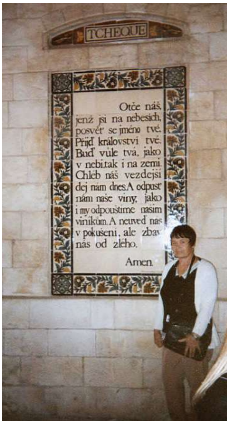
Jeruzalém – chrám Pater noster