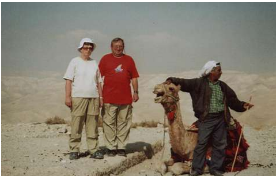
V Judské poušti