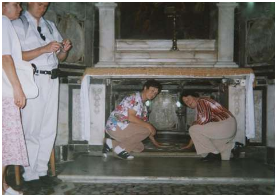
Ain Karen – místo narození Jana Křtitele