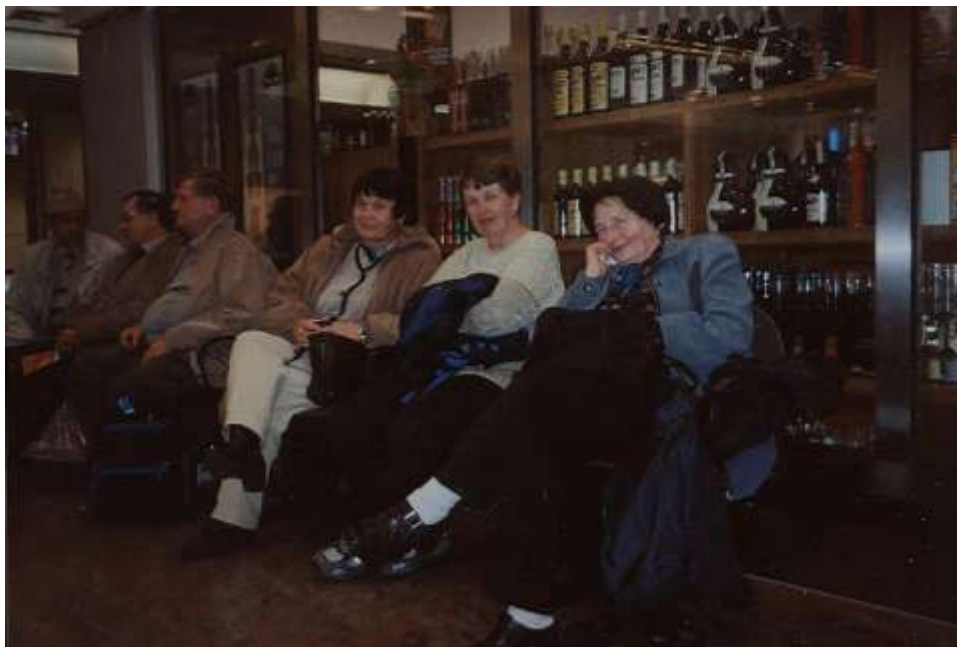
Čekání na pražském letišti

Odlétáme z Prahy letadlem izraelské společnosti EL-AL ve 2 hod. 45 minut. Po příchodu do letištní haly v Praze jsme byli dovezeni k odbavení. Jako první následoval důkladný osobní pohovor a rentgen všech zavazadel.