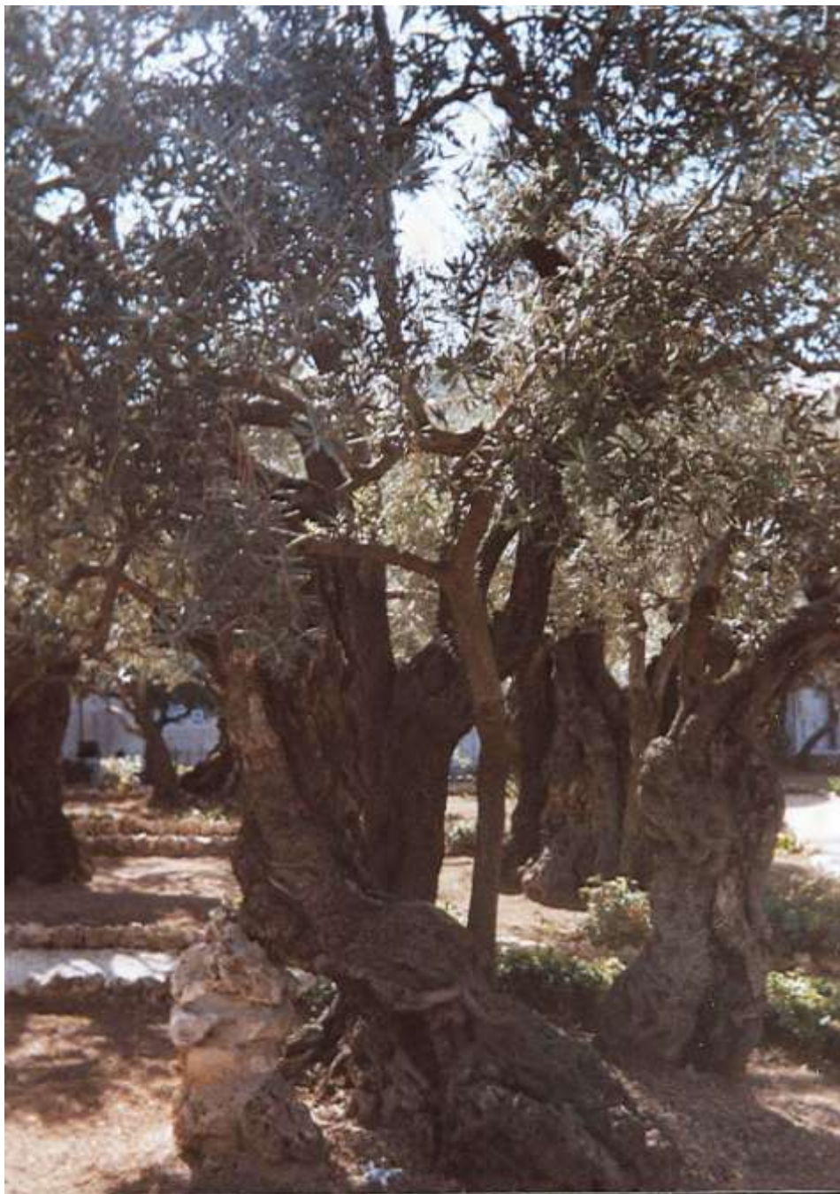
Z Getsemanské zahrady