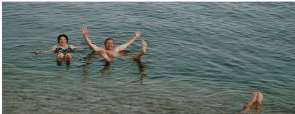
Koupání v Mrtvém moři

Koupání v Mrtvém moři patřilo k dalším nezapomenutelným zážitkům. Ve chvílích, kdy si sednete nebo lehnete do vody, již nohy pod sebe nedáte, jste nadnášeni a připadáte si jako ve stavu beztlíže. V létě, kdy venkovní teplota přesahuje 40 stupňů, vám nehrozí spálení kůže. Je to díky odpařující se vodě, která vytváří jakoby filtr ultrafialovým paprskům, který vás chrání před spalujícím sluncem. Před osmi lety obsahovala mořská voda 33 % soli, dnes se již mluví o 40 %.