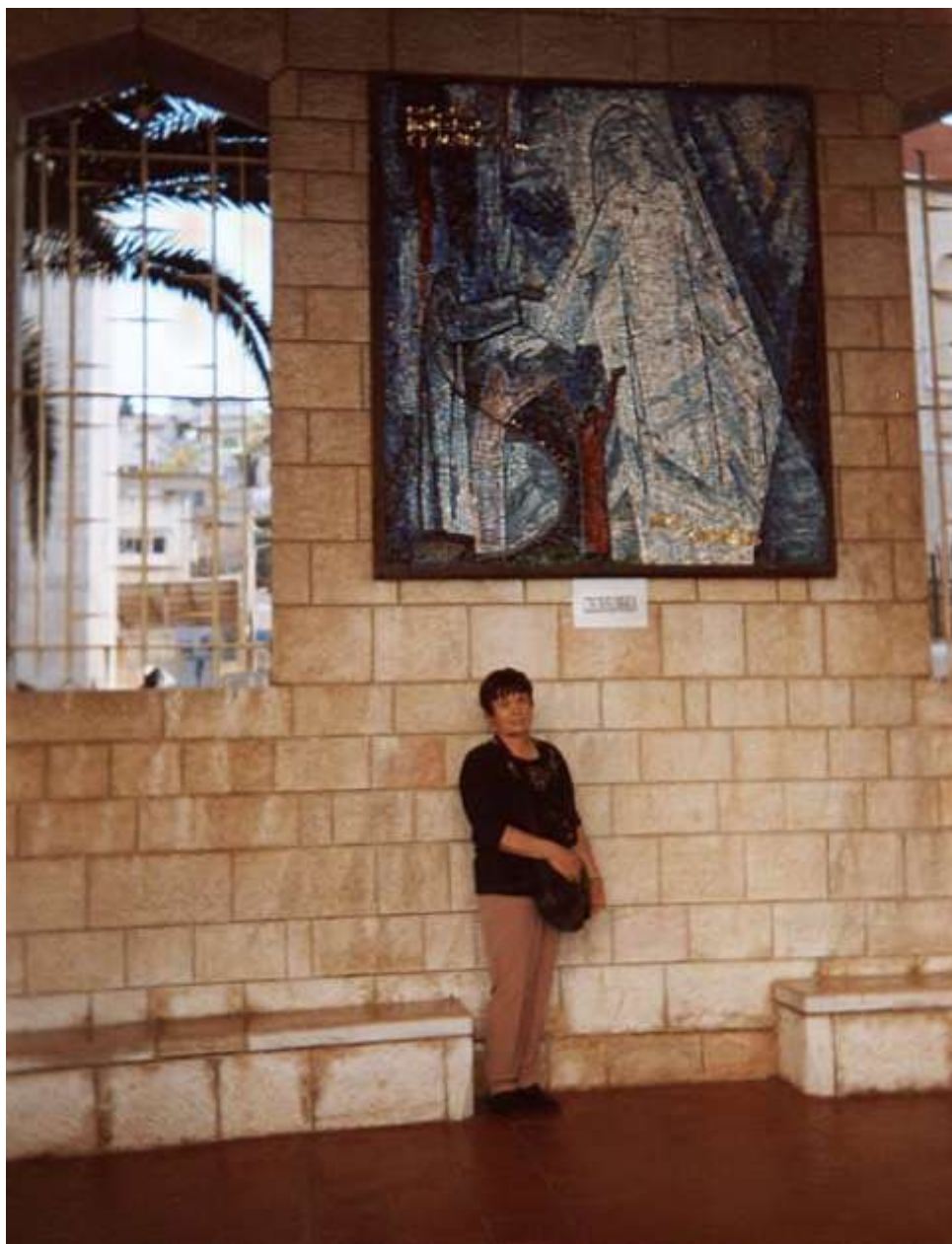
Nazaret – česká mozaika v chrámu Zvěstování P. Marie