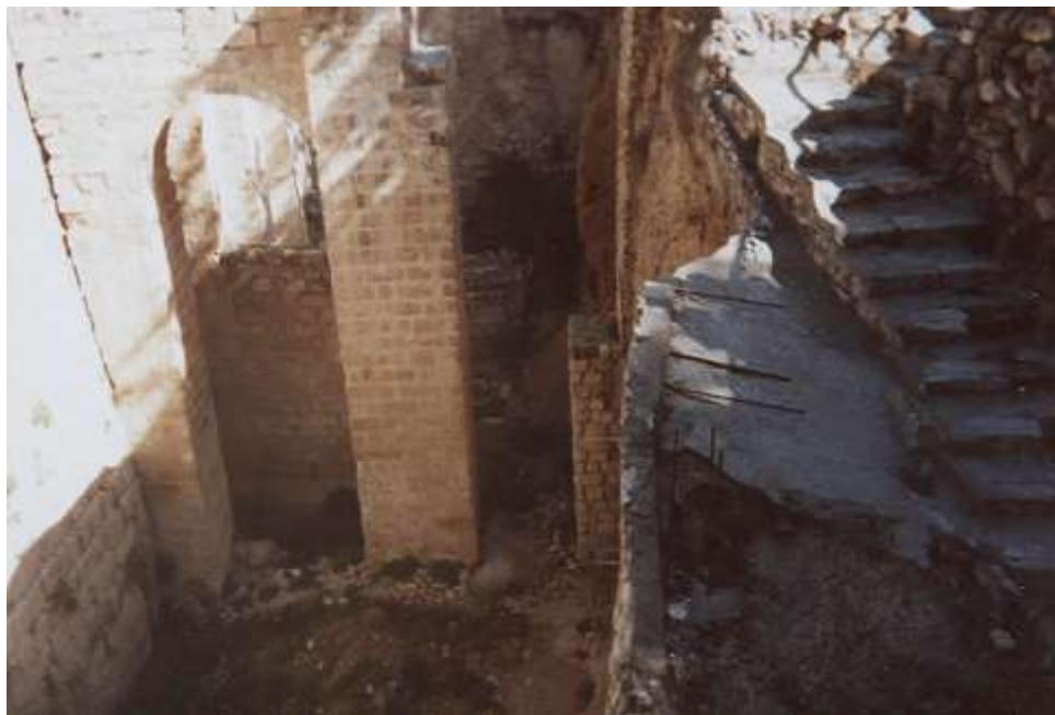
Vykopávky u rybníka Betseda

Cestou s kopce vcházíme do chrámu Všech národů, stojícího na místě Ježíšova zatčení. Uvnitř chrámu, před hlavním oltářem, je zachovaný kus skály. Podle tradice měla být svědkem Ježíšovy agonie. Zde se, večer před svým umučením, Pán Ježíš modlil a ve smrtelné úzkosti krví potil. Před bazilikou stojí několik olivovníků, údajně starších více než 2000 let. Dále navštívujeme pravoslavný chrám Zesnutí P. Marie.