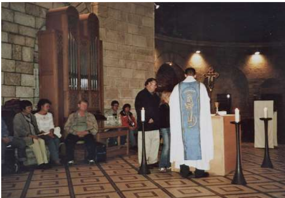
Jeruzalém – chrám Zesnutí P. Marie