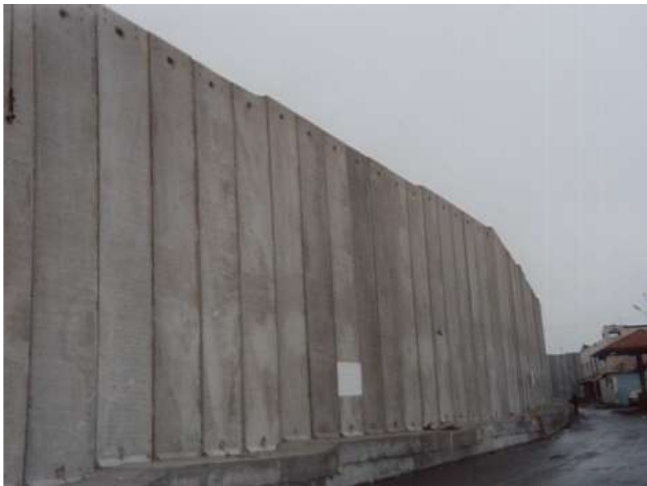
Betonová zeď mezi Betlémem a Jeruzalémem