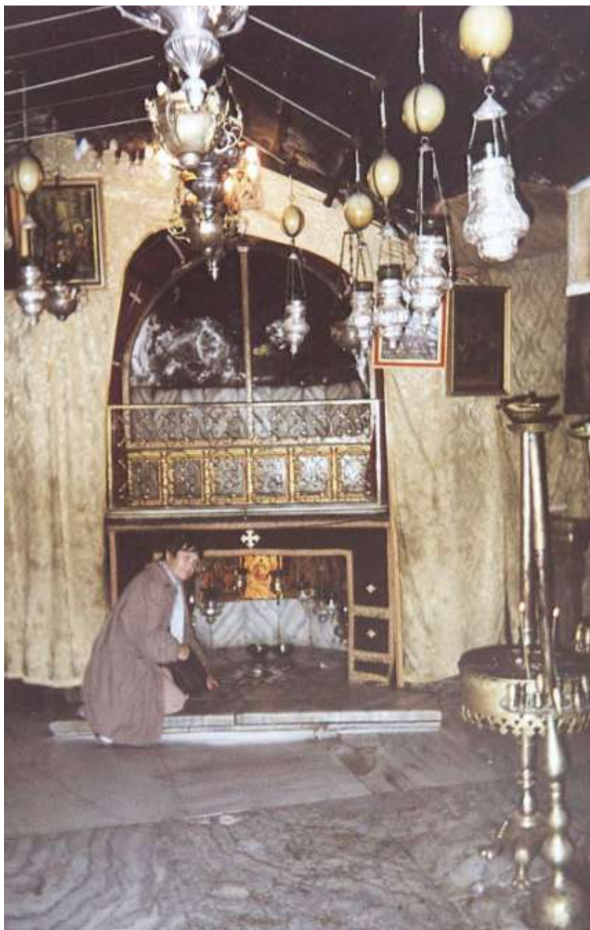
Betlém – místo Narození Páně