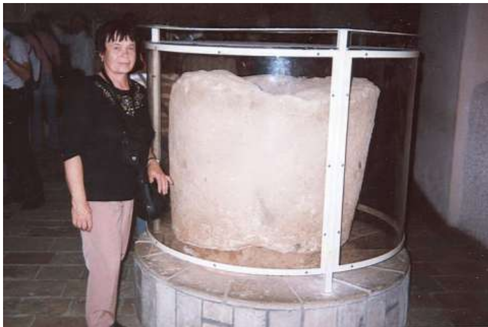
Nádoba na víno v Káni Galilejské

Autobusem pokračujeme v cestě, kolem které jsou plantáže zeleně, do Káni Galilejské. Zde si v chrámu vyslechneme čtení z evangelia. Vstupujeme do krypty pod oltářem, kde je za sklem velká kamenná nádoba, ve které proměnil Pán Ježíš vodu ve víno. Před chrámem je ochutnávka vína.