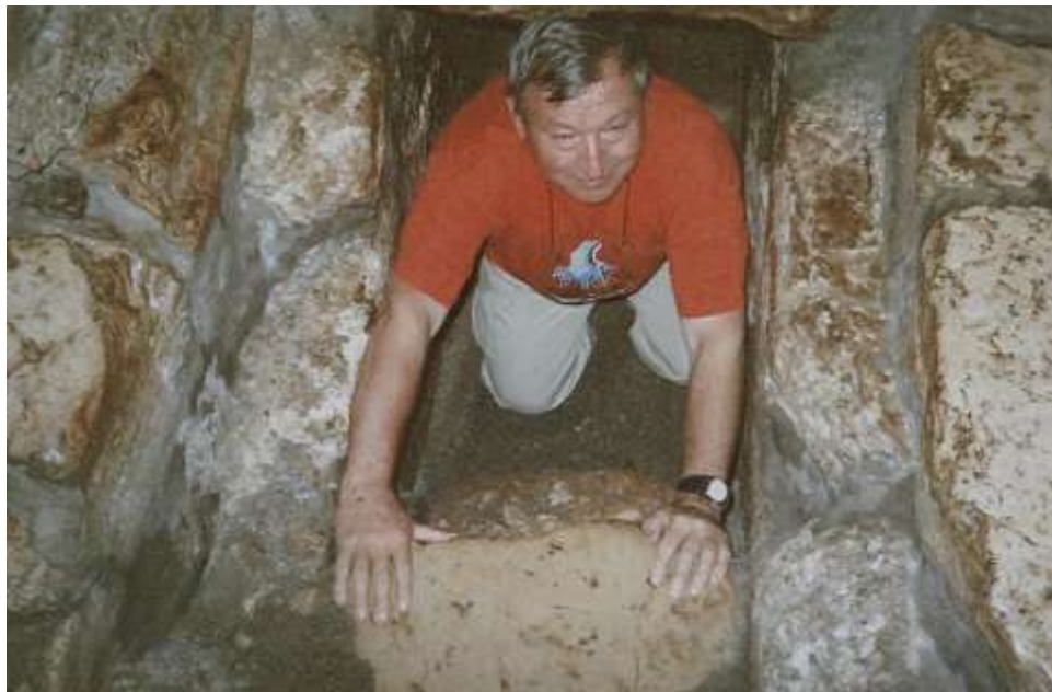
Betánie – vstup do Lazarova hrobu

V malé komůrce – hrobu je totiž vydýchaný vzduch, takže při vycházení jsou všichni propoceni.