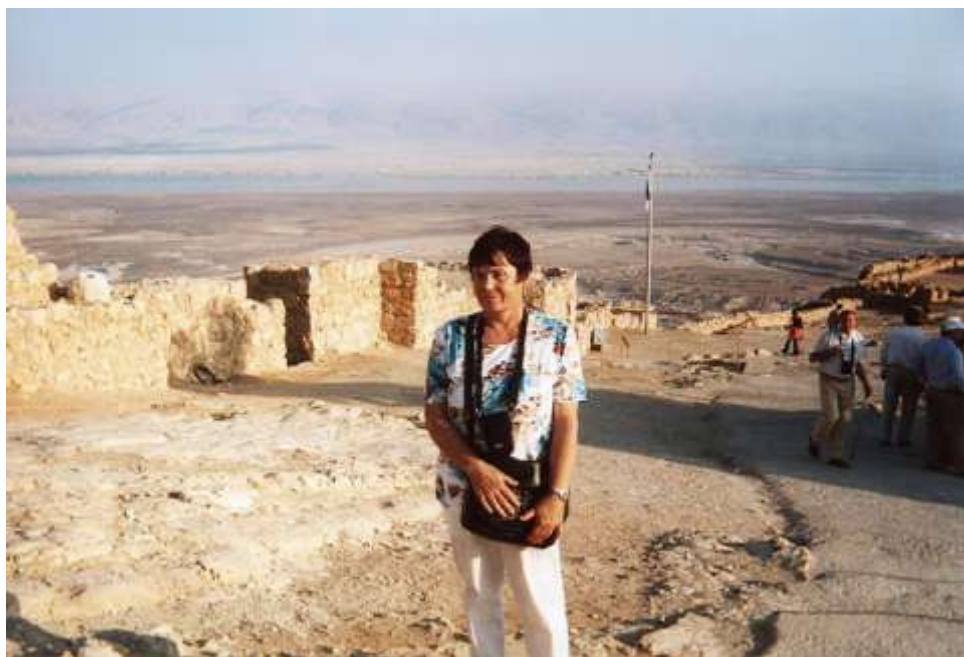
Na vrcholu hory Massada

Dále přejíždíme přes Judskou poušť, směrem na Jericho. Při jedné ze zastávek, na vysokém kopci, jsme měli mši sv. Přicházejí sem Beduíni s velbloudem a mladí chlapci přijeli na oslích. Za fotografii s nimi požadovali 1 dolar. Při jedné z dalších zastávek do dostáváme ke značce 0 m nad mořem.