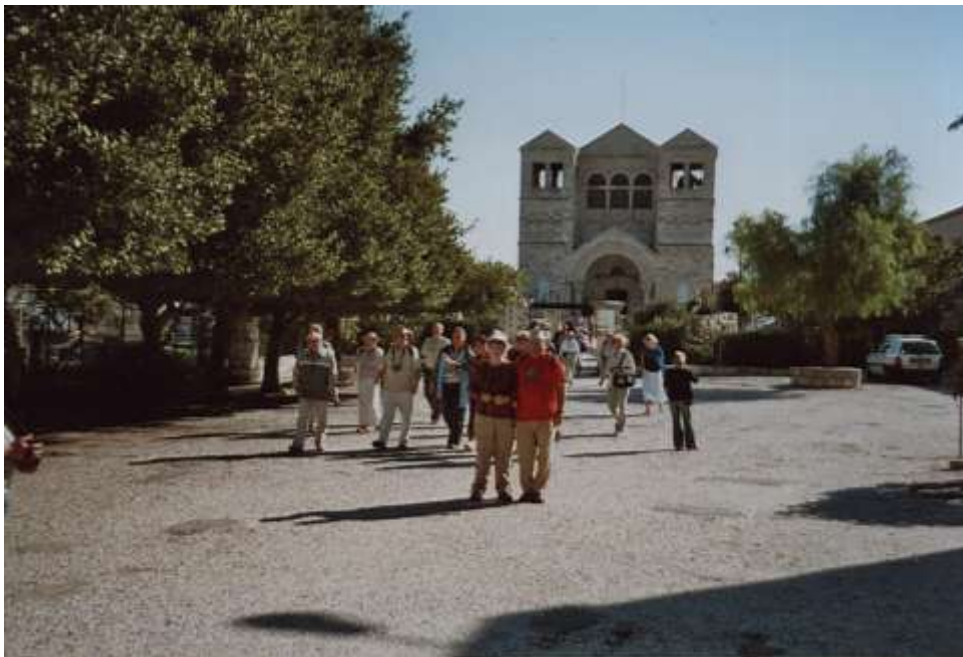
Hora Tábor – chrám Proměnění Páně

V Betlémě žije asi 30 % křesťanů (v celém státě 2–3 %) a v enklávách převažují zejména palestinští muslimové. Křesťané jsou zde jakoby mezi dvěma třecími kameny – Židy jsou považováni za Arabů a Palestinci za západáky. Ve všech palestinských enklávách je velká nezaměstnanost, více než třetina lidí je bez práce. Proto mnozí z křesťanů odcházejí do Evropy, Ameriky, Austrálie a do jiných zemí. Na rozdíl od muslimů, kterým ve světě pomáhají jejich arabští souvěrci, křesťané si mezi sebou nepomáhají.