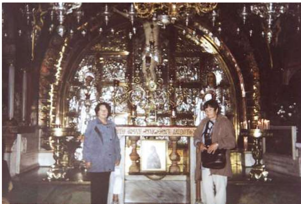
Kalvárie – v chrámu Božího hrobu

Po mši sv. v kapli „Ejhle člověk“ jdeme do chrámu Božího hrobu, místa, kde byl vrchol Kalvárie. Po prohlídce chrámu pokračujeme v cestě na horu Golgotu, na jejímž úpatí se v zahradě nachází skalní hrobka, kde byl P. Ježíš po ukřížování a sejmutí s kříže uložen.