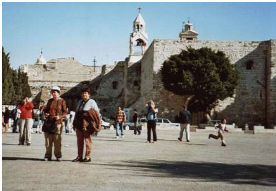
Betlém – chrám Narození Páně

Měli jsme polopenzi. Snídaně byly na způsob švédského stolu, vynikající džemy, zeleninové saláty ve velkém výběru, bílý i tmavý chléb, placky, libový salám (asi jako náš Junior), máslo, jogurt, káva a čaj. K večeři byla k hlavnímu jídlu vždy polévka. Převažují lehká jídla, ryby, drůbež, skopové a k pití se podává voda.