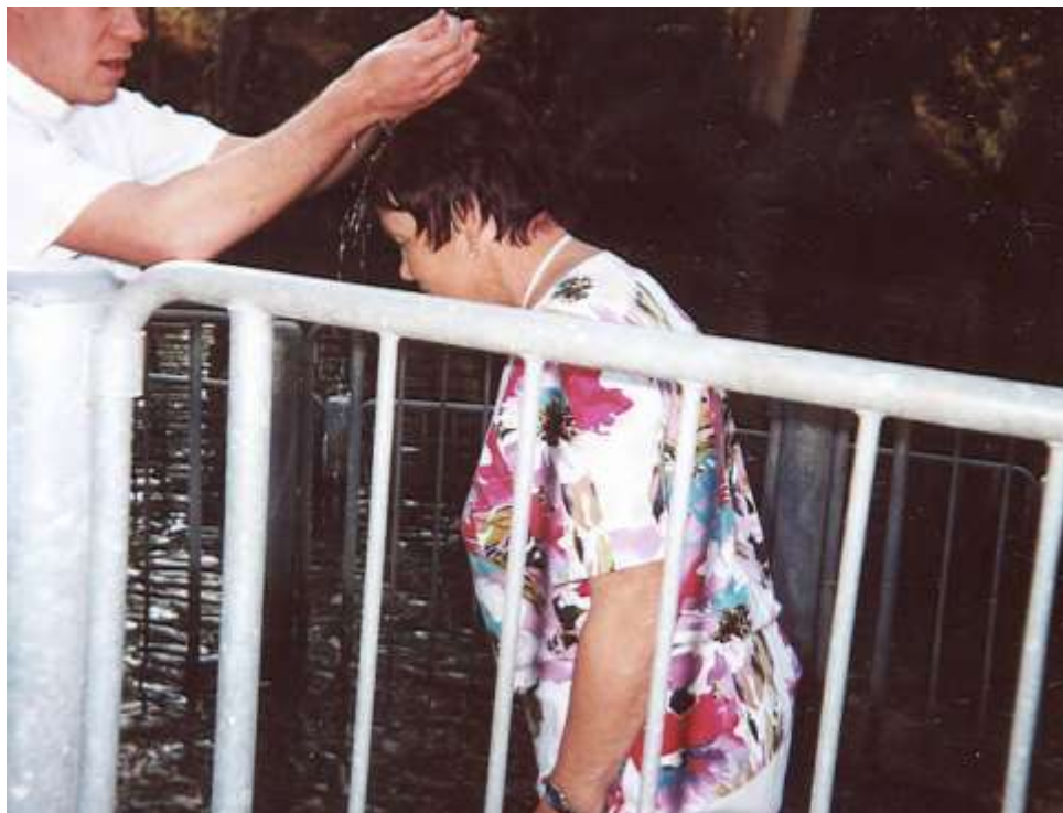
Řeka Jordán – obnova křtu

Podél pobřeží Genezaretského jezera pokračujeme do města Tiberias, kde nás čeká asi hodinová projížďka lodí po jezeře. Celková délka jezera, nacházejícího se 213 m pod hladinou Středozemního moře, je asi 20 km a jezero je místy široké až 12 km. Galilejské jezero je hlavní zásobárnou pitné vody pro Izrael. Pozoruhodným zavlažovacím zařízením je uměle vybudovaný kanál, odvádějící vodu z jezera do pouště.