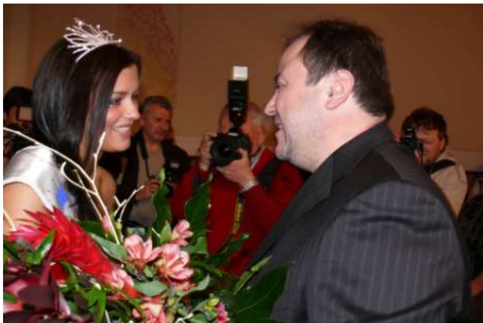
Ad 24. Z mikroregionu – Česká miss v Náměči