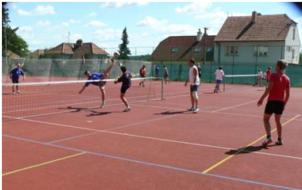
Ad 16. Na víceúčelovém hřišti