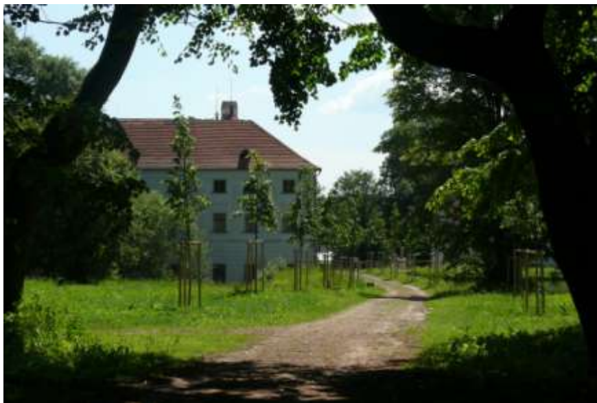
Ad 7. Obnova zeleně v zámeckém parku