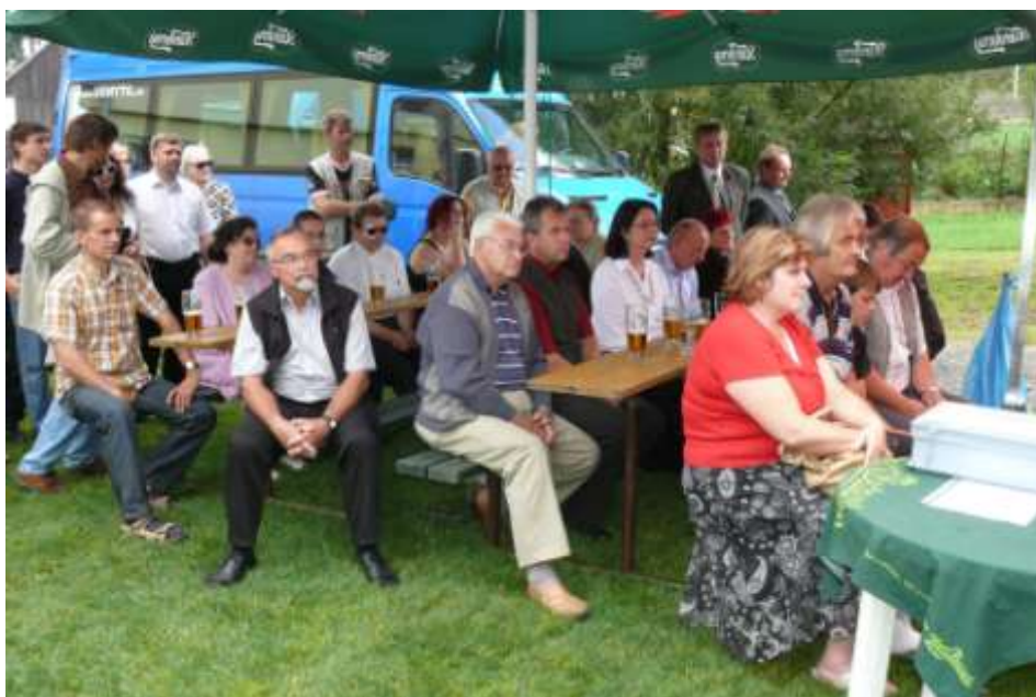
Ad 24. Z mikroregionu – oslavy v Oslavičce