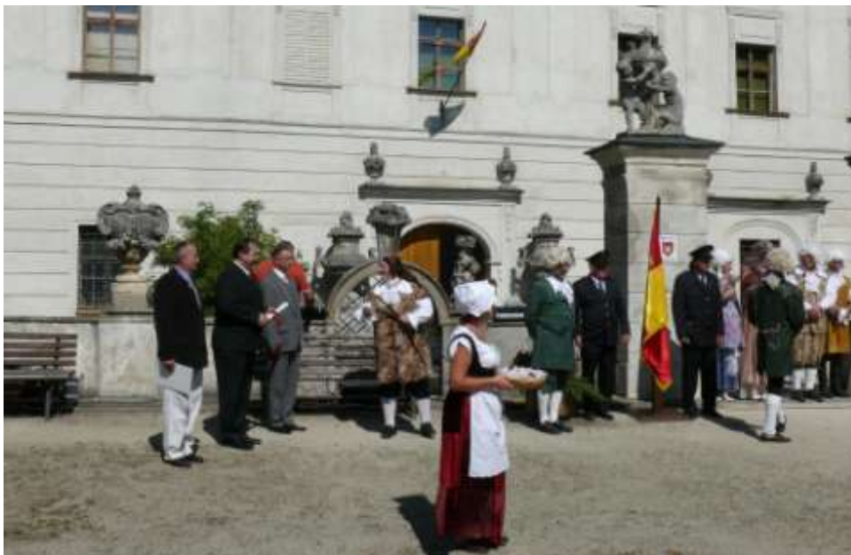
Ad 15. Oslavy k 470. výročí povýšení Budišova na městečko