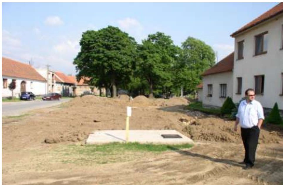
Ad 7. Proměny Pekařáku 3