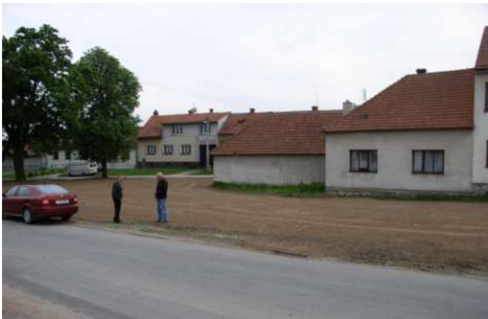
Ad 7. Proměny Pekařáku 4