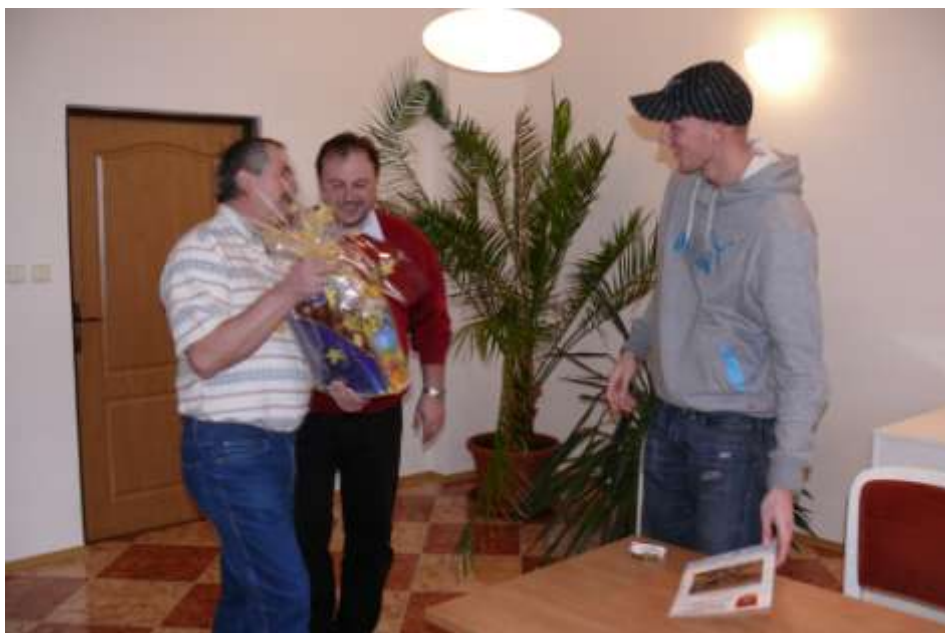
Ad 16. Se Svobodou