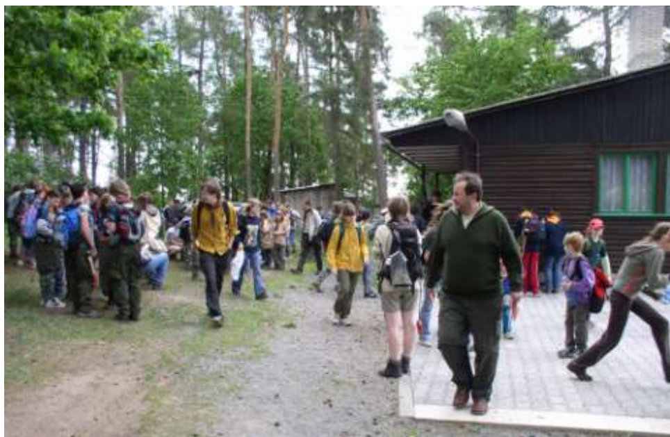
Ad 15. Na Svojsíkové závodě