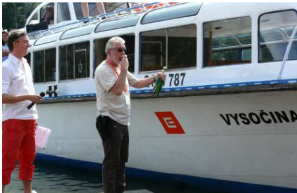
Ad 24. Křest lodi Vysočina s mikroregionem na Dalešické přehradě