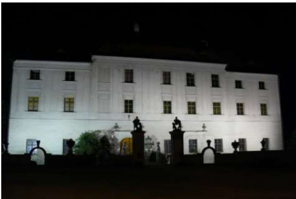
Ad 15. Zkouška osvětlení zámku pro později neuskutečněné „Posezení na zámku“