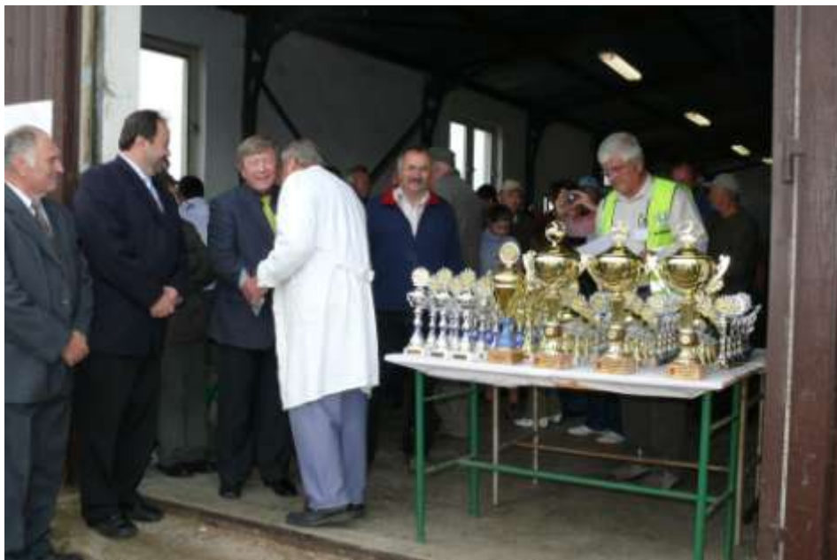
Ad 15. Poháry městyse pro chovatele