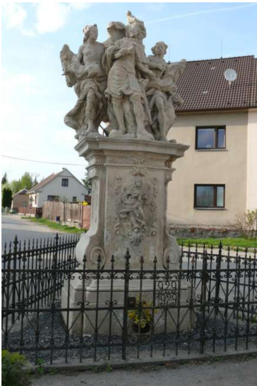
Ad 13. Opravené sousoší sv. Václava s anděly