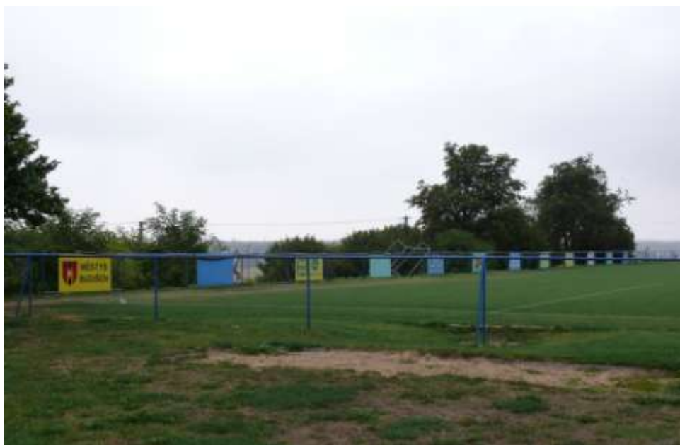
Ad 16. Hřiště FC Budišov-Nárameč