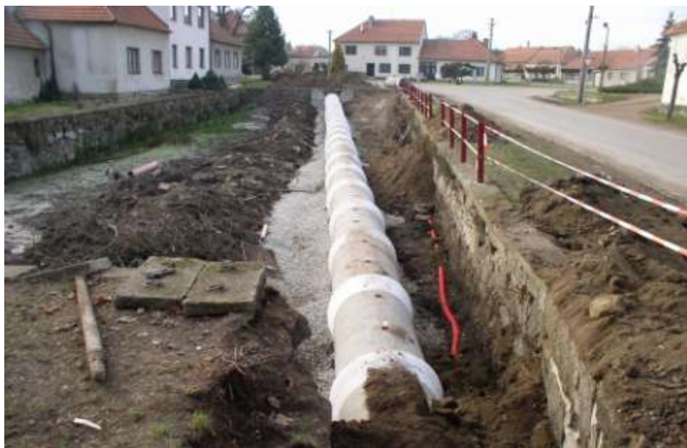
Ad 7. Proměny Pekařáku 2