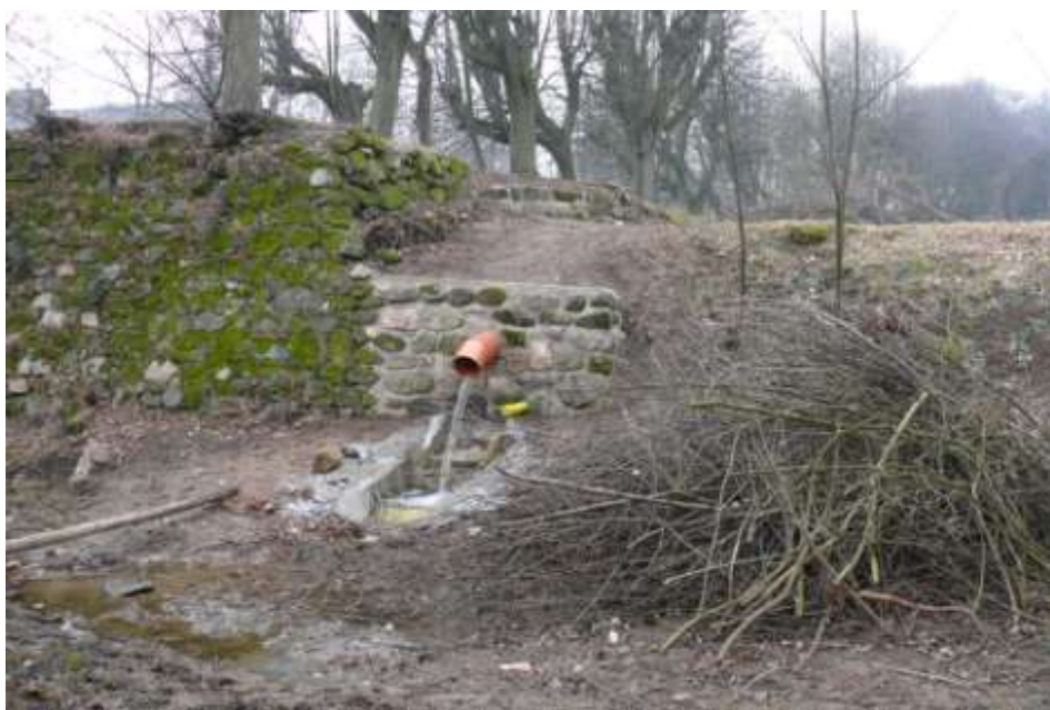
Ad 20. Oprava hráze Pivovárku