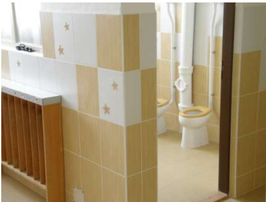
Ad 5. Sociální zařízení ve školce