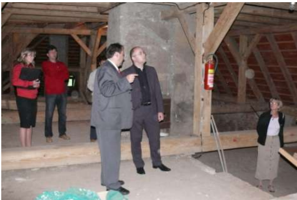
Ad 5. Prohlídka zámku pro opravu střechy