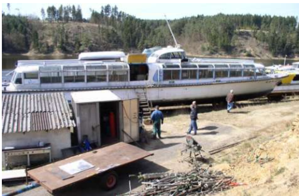
Ad 24. S mikroregionem na Orlické přehradě