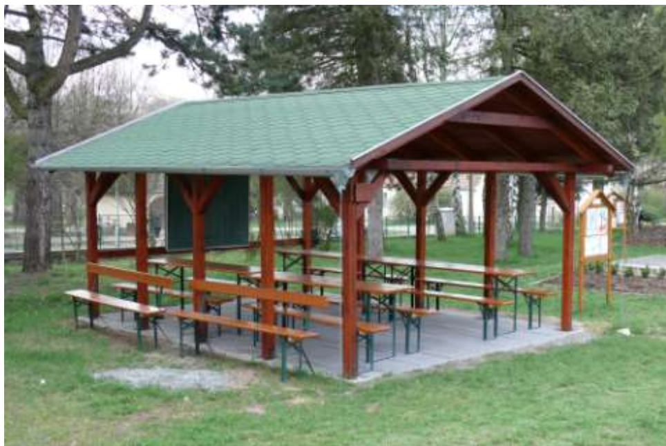
Ad 14. Zelená učebna