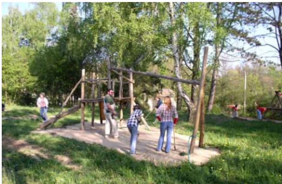
Ad 14. Brigáda skautů na dětském hřišti