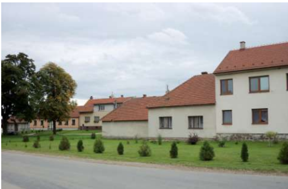
Ad 7. Proměny Pekařáku 5