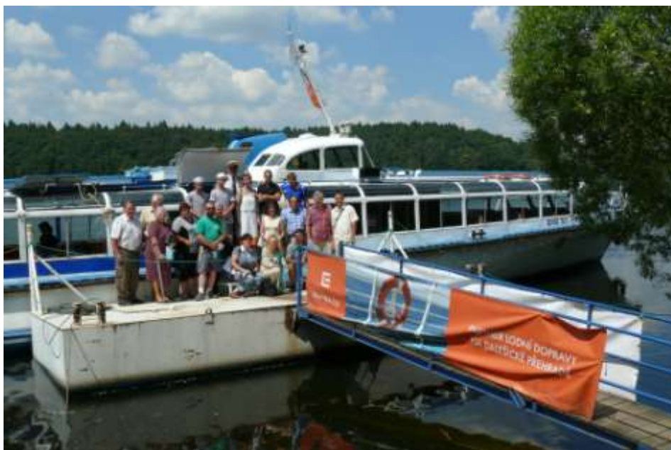
Ad 24. S mikroregionem na Dalešické přehradě - Kramolín