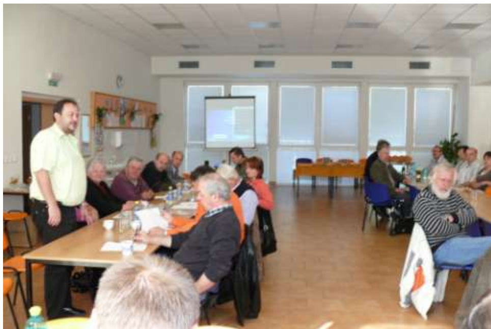
Ad 24. Valná hromada mikroregionu Horácko v Budišově