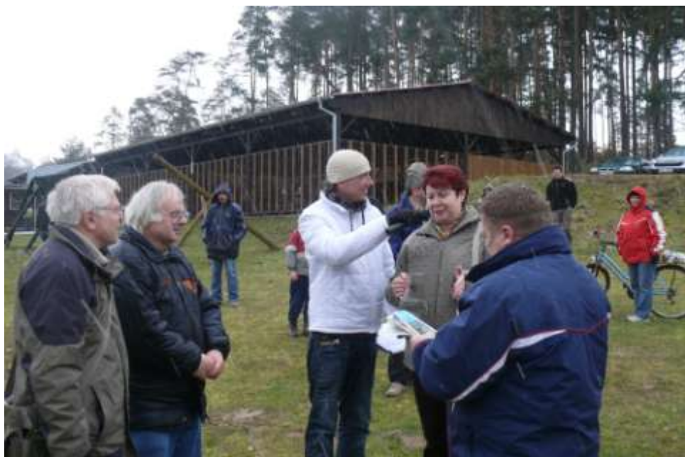
Ad 24. Zahájení druhého ročníku provozu lodi s mikroregionem na Hartvíkovické pláži