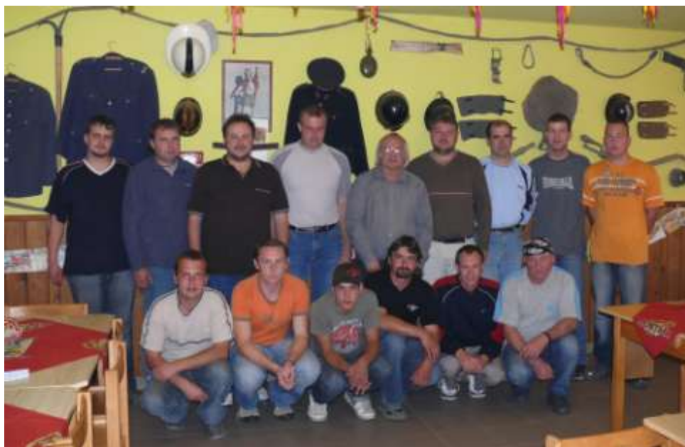
Ad 15. Zástupci městyse s hasiči