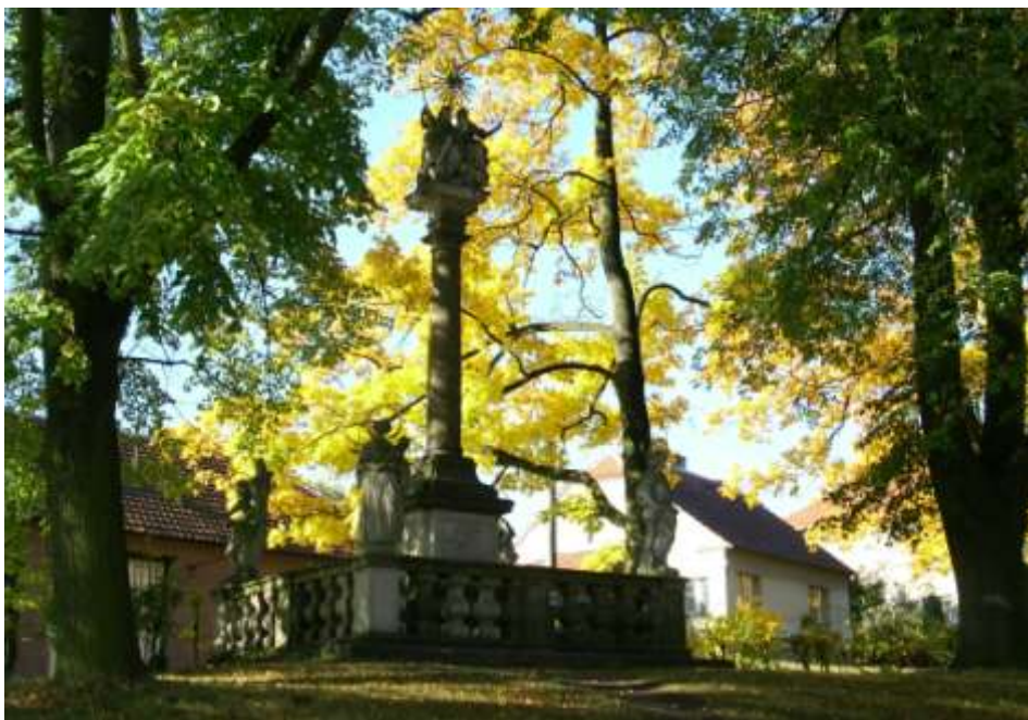
Ad 13. Opravené sousoší Nejsvětější Trojice