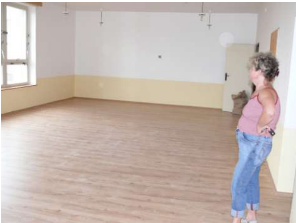
Ad 5. Plovoucí podlaha ve školce