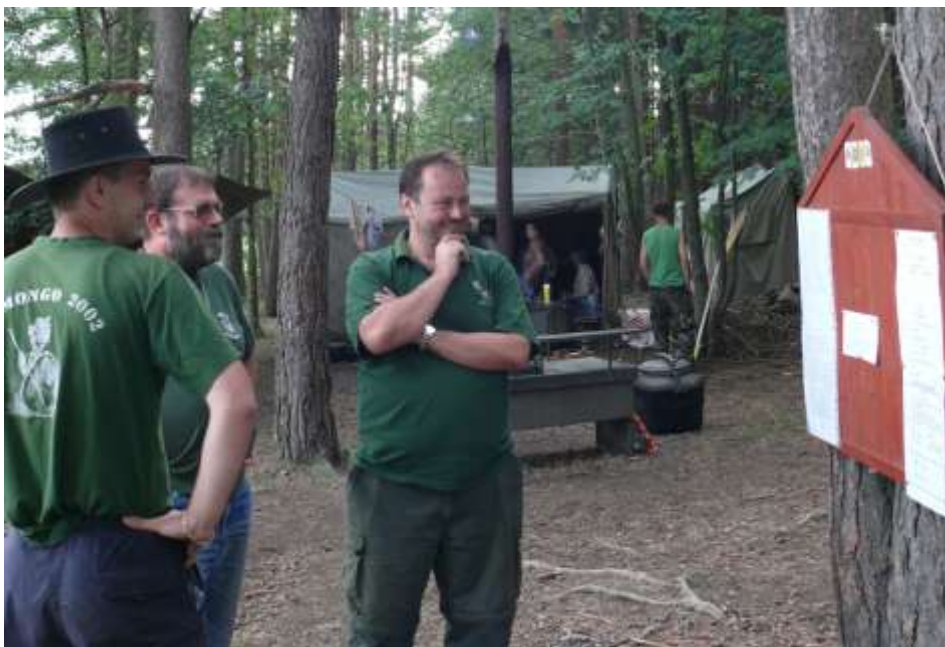
Ad 15. Na táboře skautů