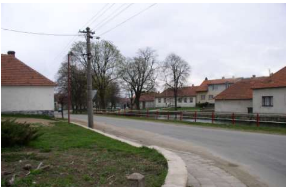
Ad 7. Proměny Pekařáku 1