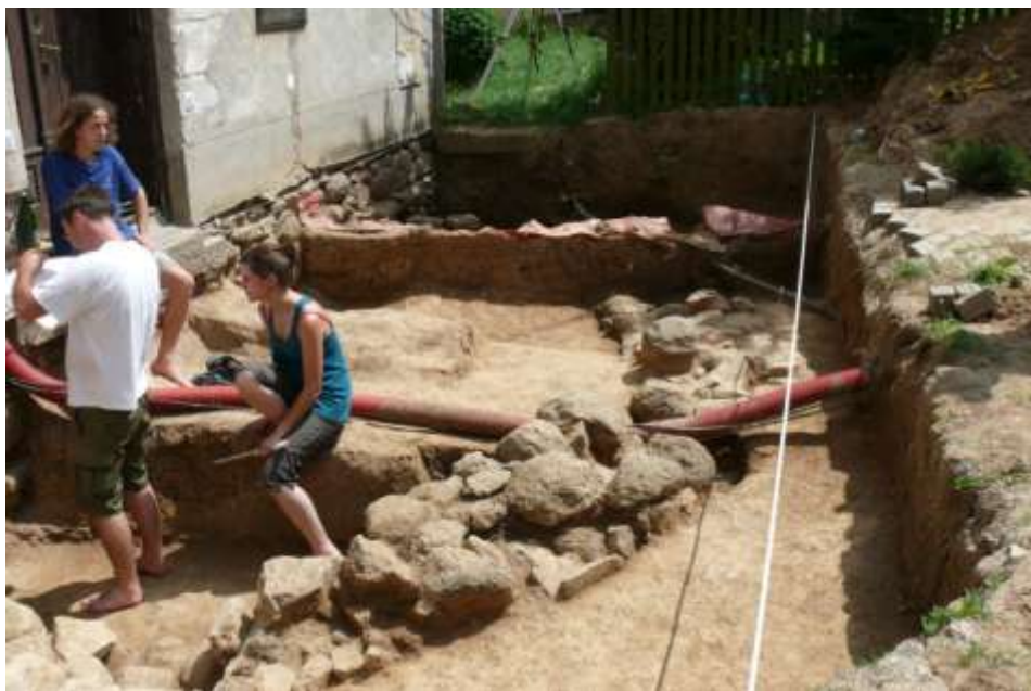
Ad 24. Z mikroregionu – objevená rotunda v Tasově