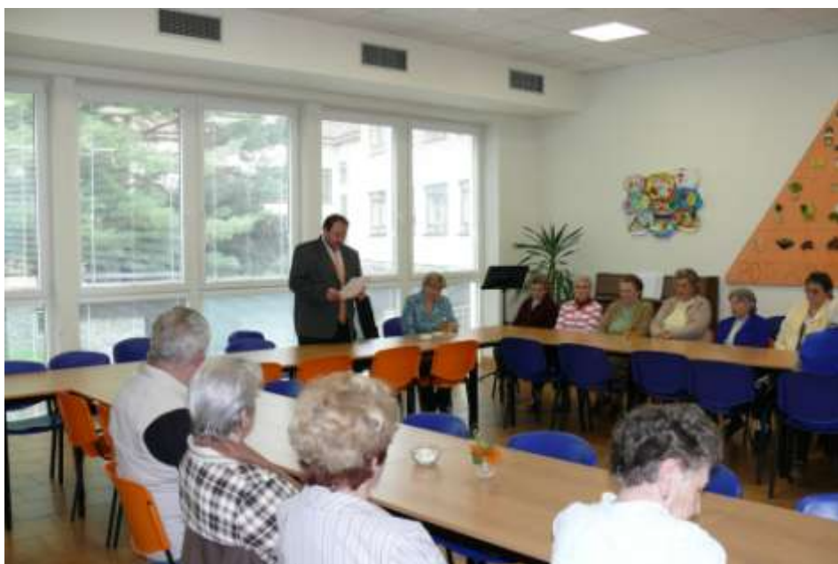
Ad 12. Schůzka zástupců městyse se seniory