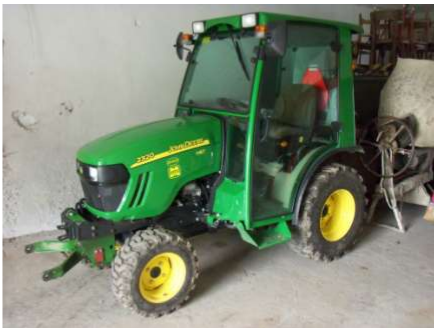
Ad 7. Multifunkční malotraktor