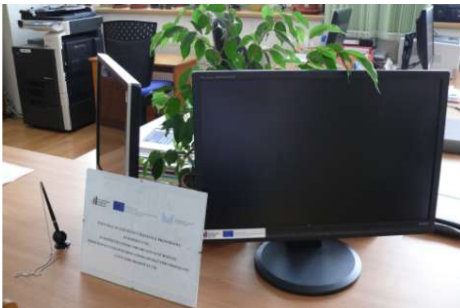
Ad 8. Pracoviště pro Czech POINT