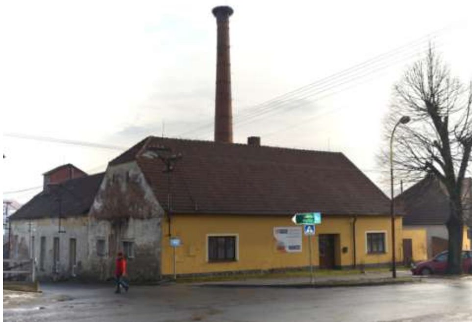
lihovar v Tasově