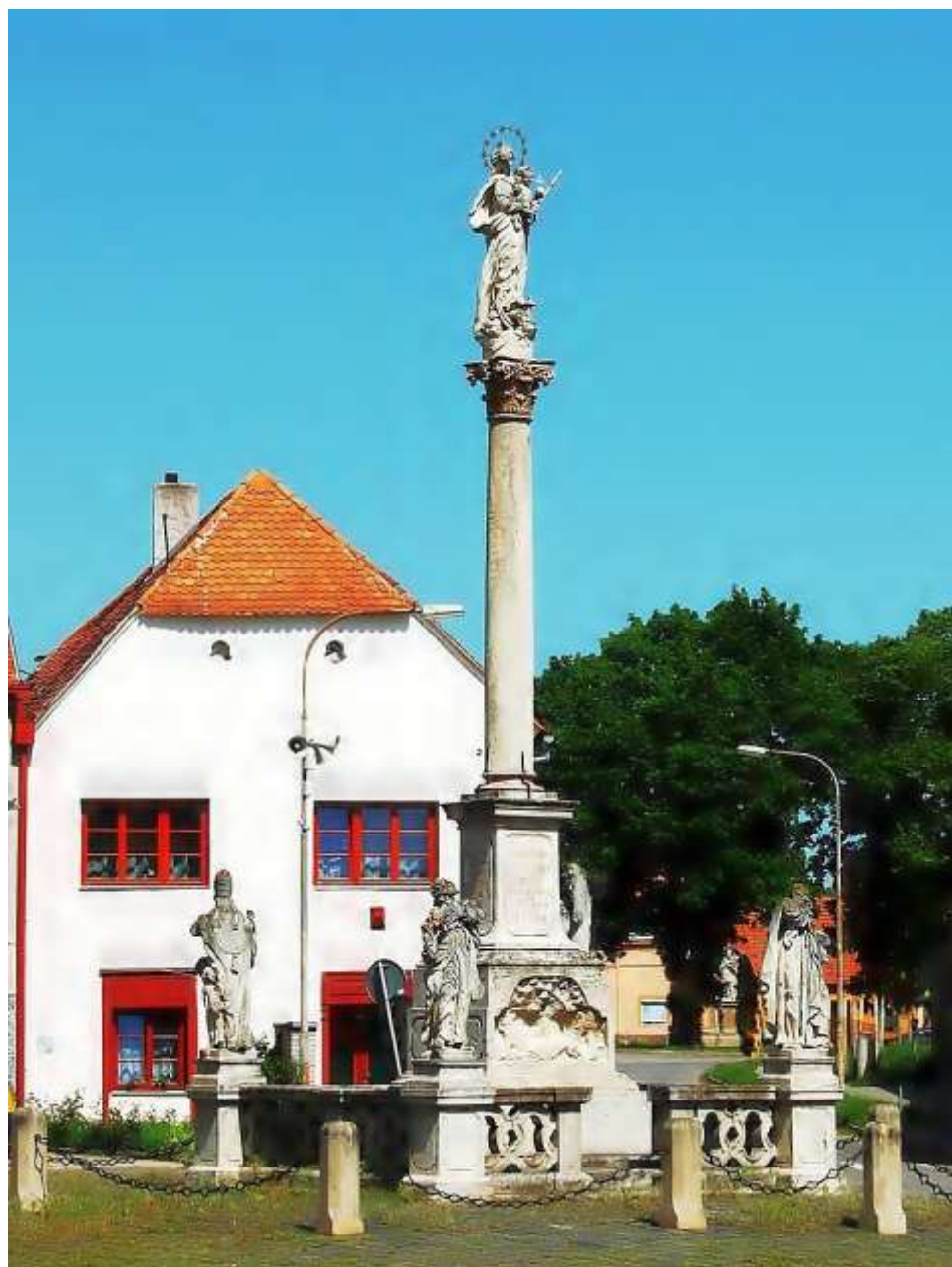
Hostěradice – mariánský sloup