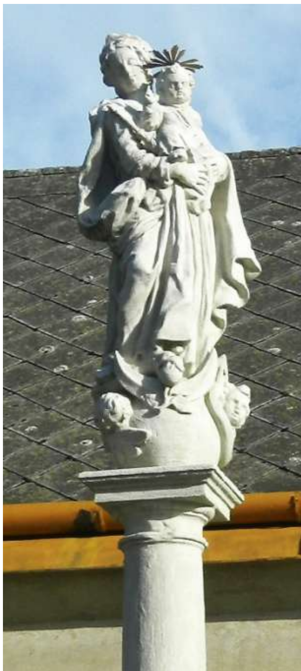
Lesonice – sloup P. Marie