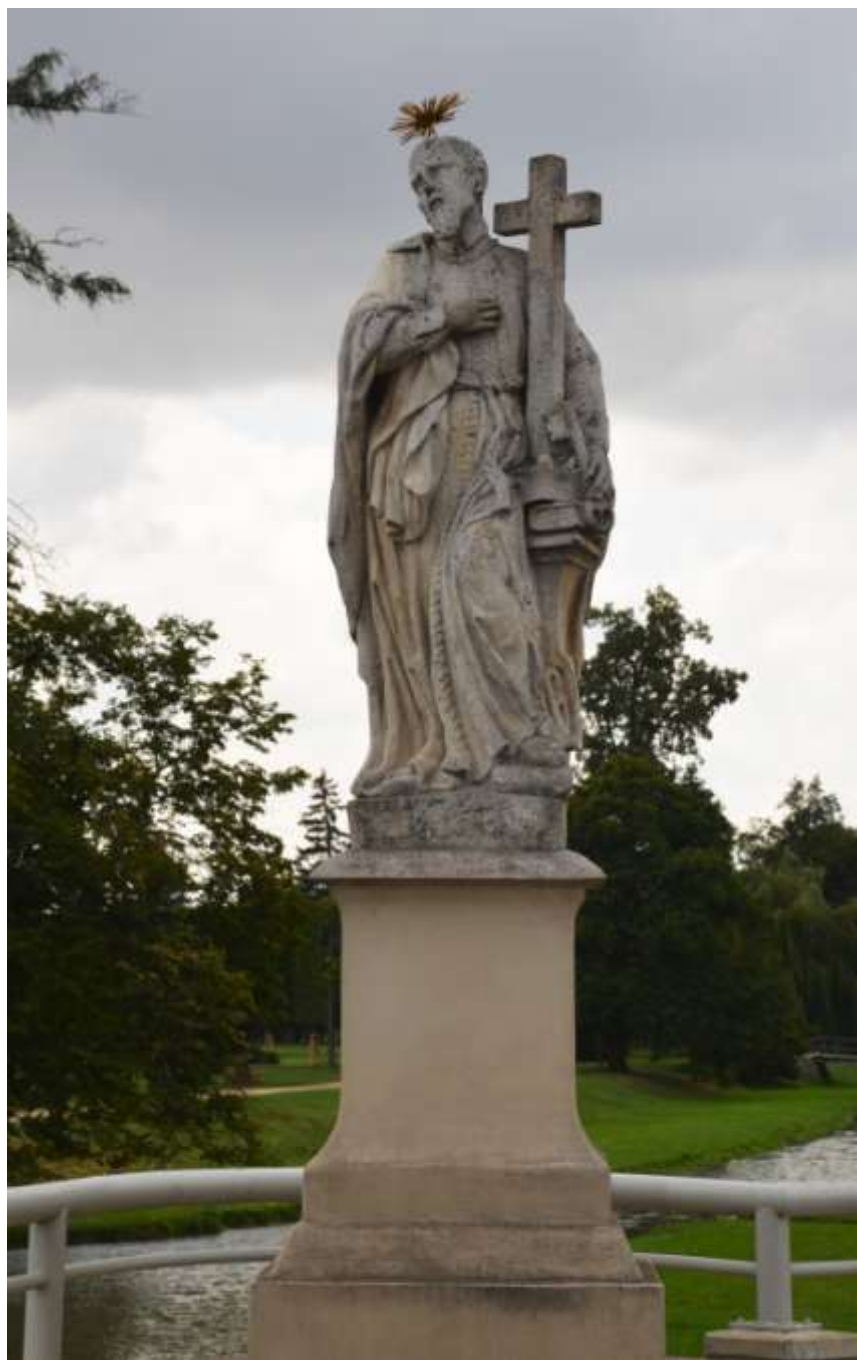
Jaroměřice – socha sv. Jana Sarkandera