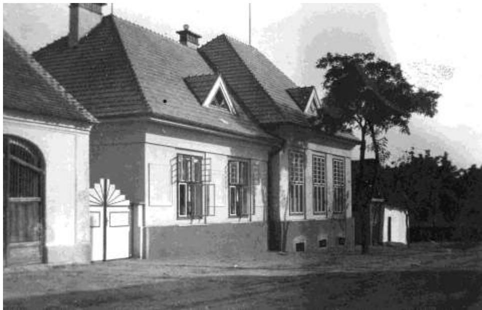
Budova bývalé budišovské školy, poté pošty, nyní jsou v ní byty

knihovna má dvěstětřicet osm svazků a žákovská dvěstěopadesát sedm, učebnic pro nemajetné žáky jest dvěstě. Škola má šicí stroj a příruční lékárníčku.