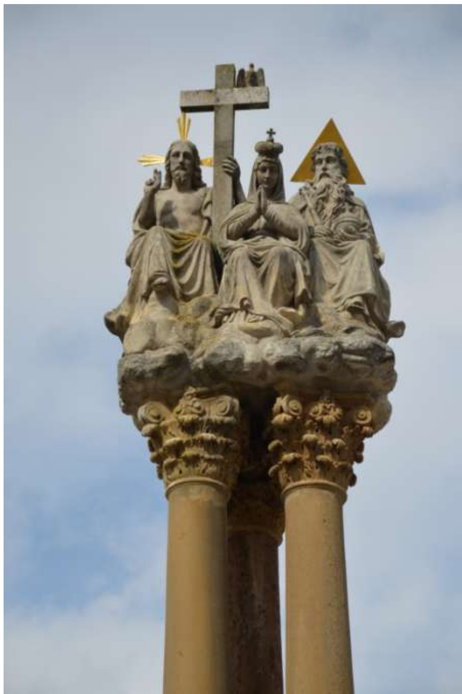
Jaroměřice – sochy sloupu Nejsvětější Trojice s Pannou Marií