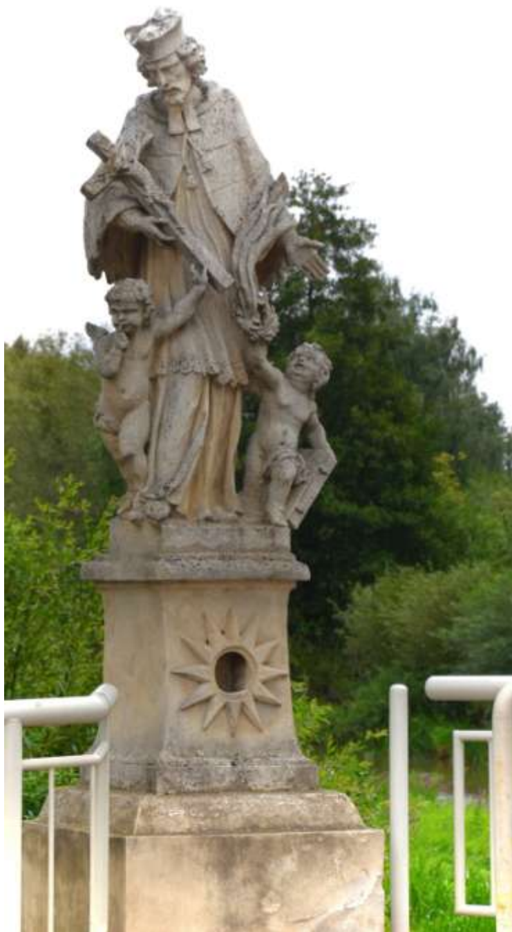
Jaroměřice – socha sv. Jana Nepomuckého