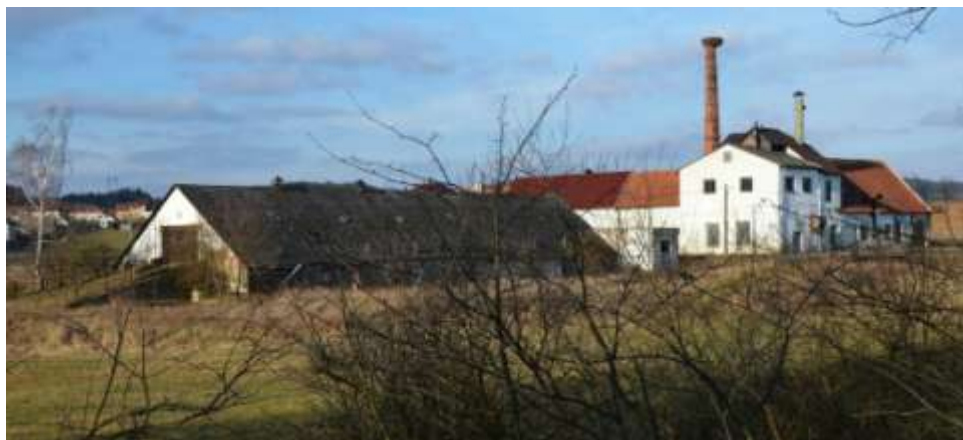
lihovar v Náramči-Topole

Lihovary na fotografiích jsou v dnešní době buď osiřelé (Budišov), popř. slouží jinému účelu (Tasov), snad jen jediný je dones „živý“ (Náramč, lihovar v Topole), pálí se v něm ke konci roku slivovice. Potěšující je, že dodnes na komíny těchto lihovarů přilétají a hnízdí čápi.