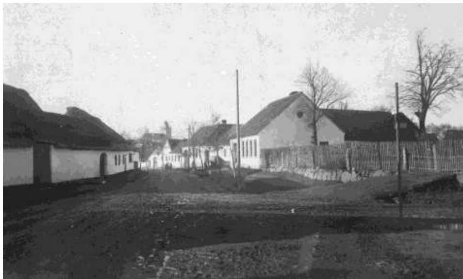
Pohled od sousoší sv. Václava