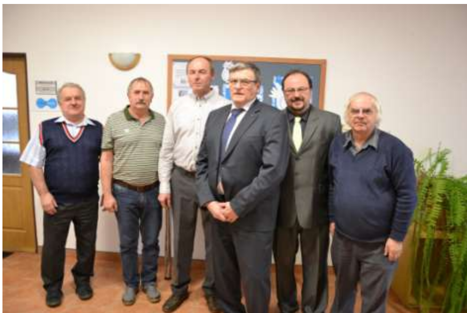
S radními městyse