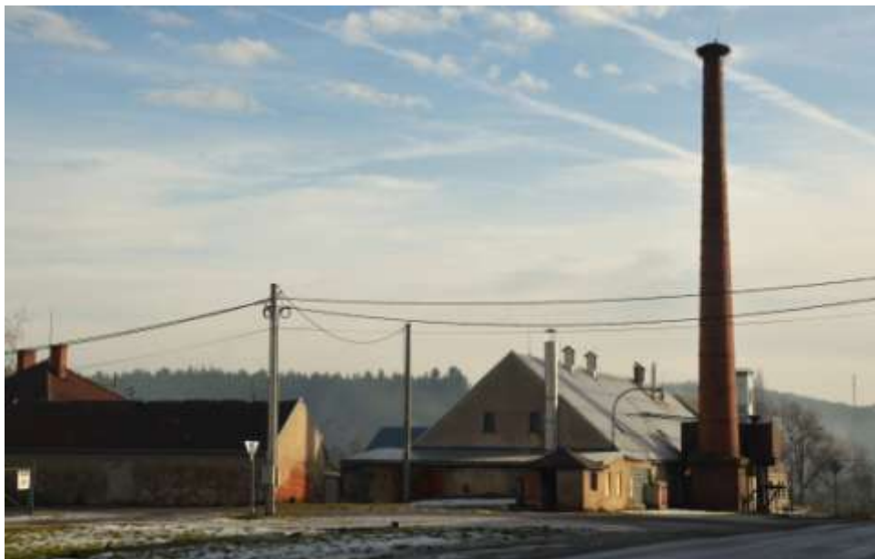
lihovar v Budišově