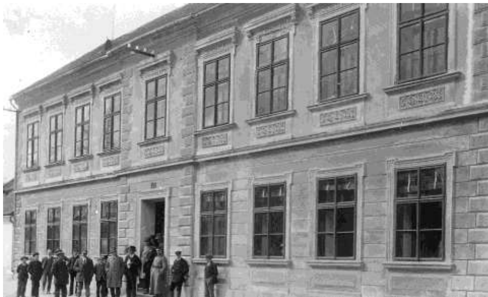
Budova bývalé školy, později zde sídlil místní národní výbor, dnes jsou zde byty

Nyní jsou přiškoleny obce: Studnice a Kojatín. V Budišově tvoří jednu obec Mihoukovice.