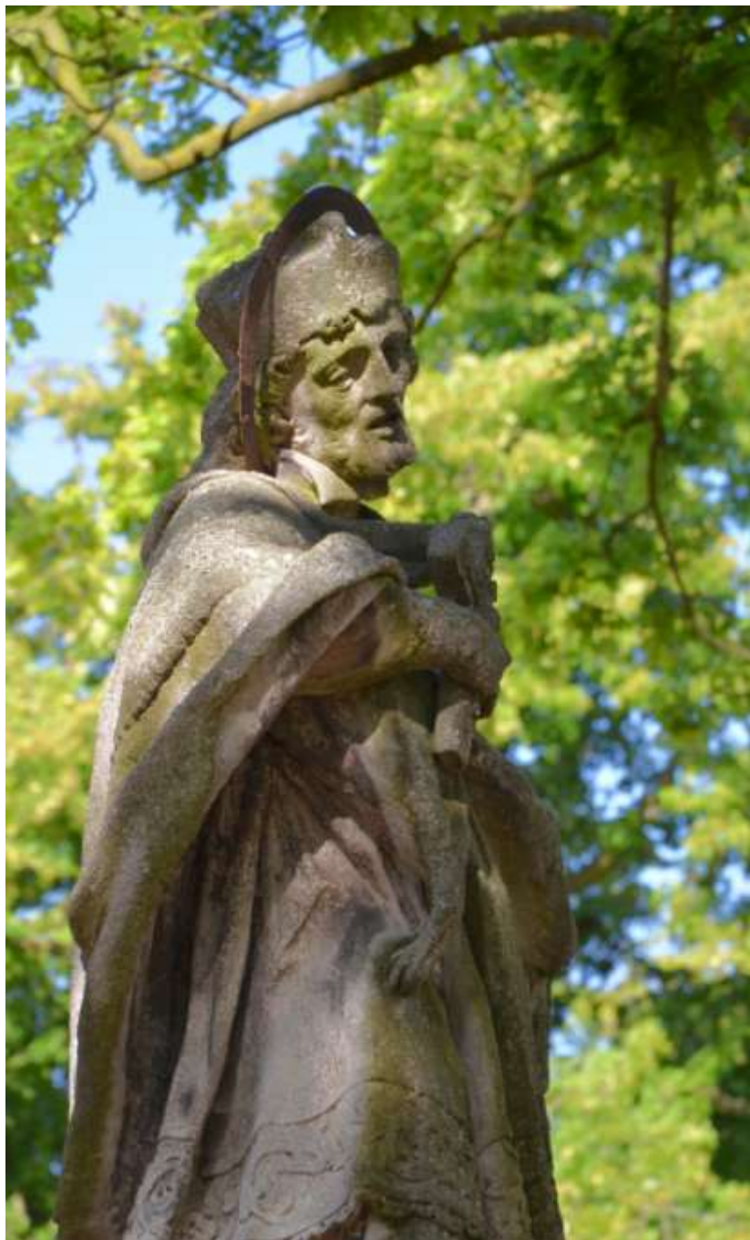
Budišov – socha sv. Jana Nepomuckého