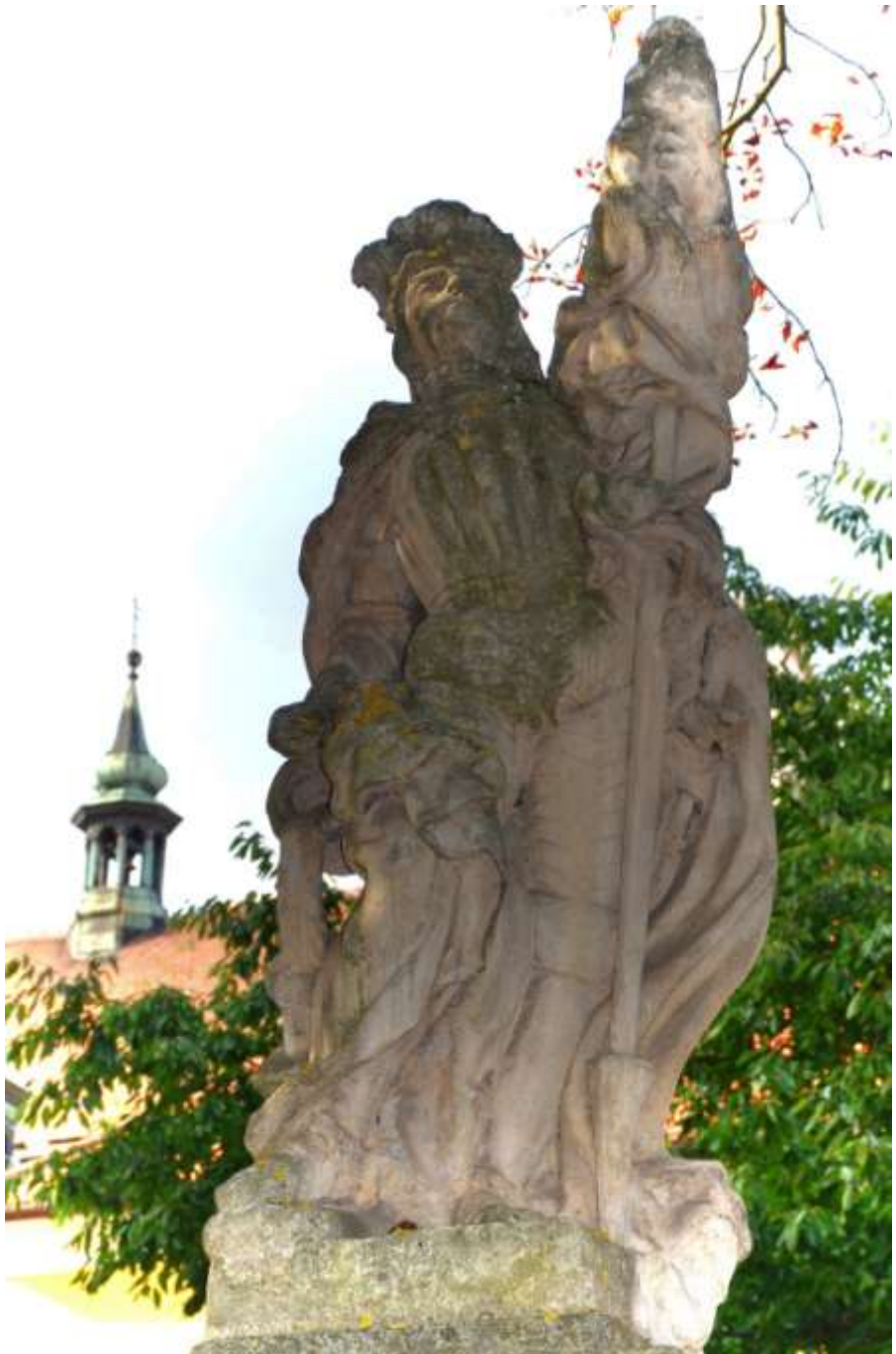
Třebíč – socha sv. Floriana