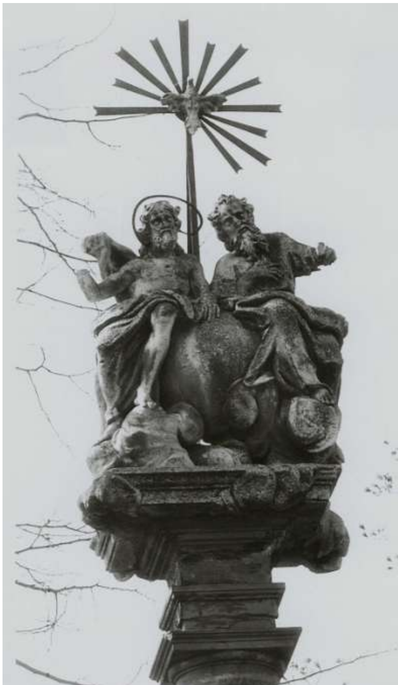
Budišov – sloup Nejsvětější Trojice