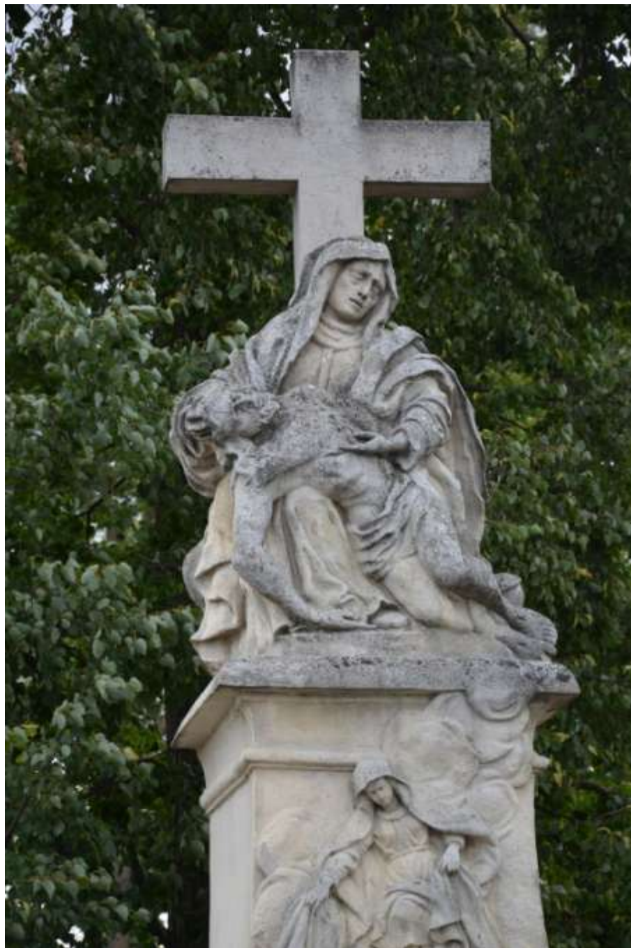
Jaroměřice – Pietà