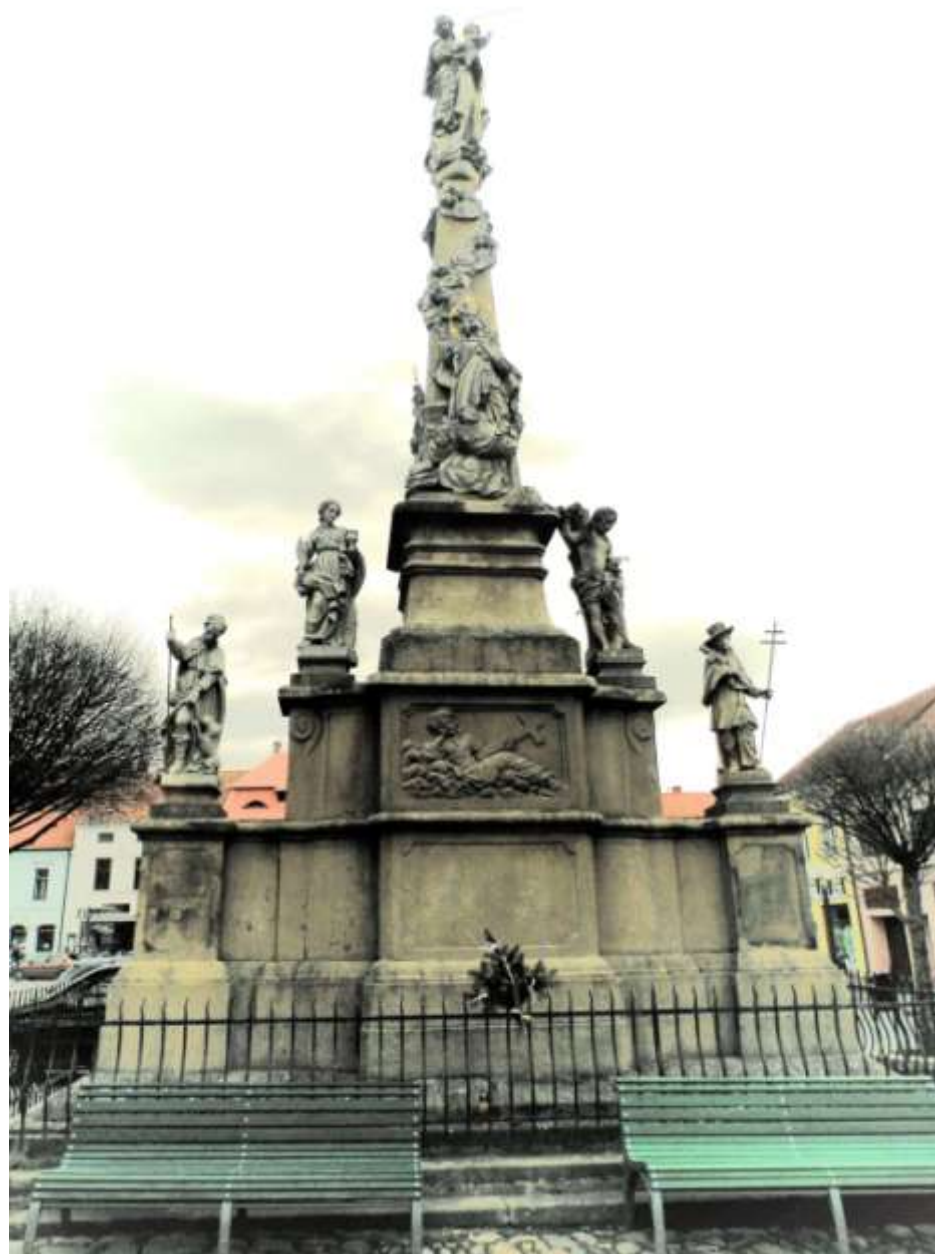
Ivančice – mariánský sloup