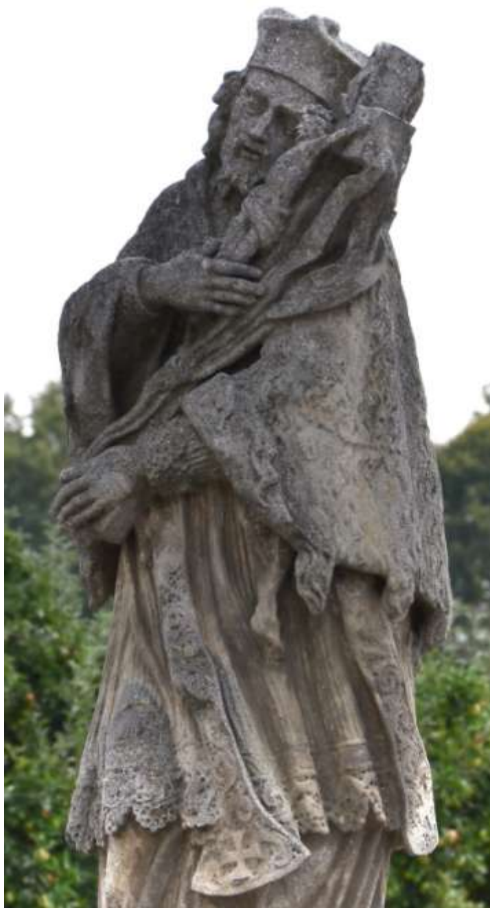
Stařeč – socha sv. Jana Nepomuckého