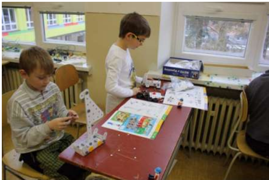
Práce se stavebnicí ROTO z Kraje Vysočina

Naše škola s úspěchem požádala o dotační program Ministerstva školství, mládeže a tělovýchovy na rok 2015 a získala tak pro výuku stavebnice Merkur v celkové hodnotě 45 650 Kč.