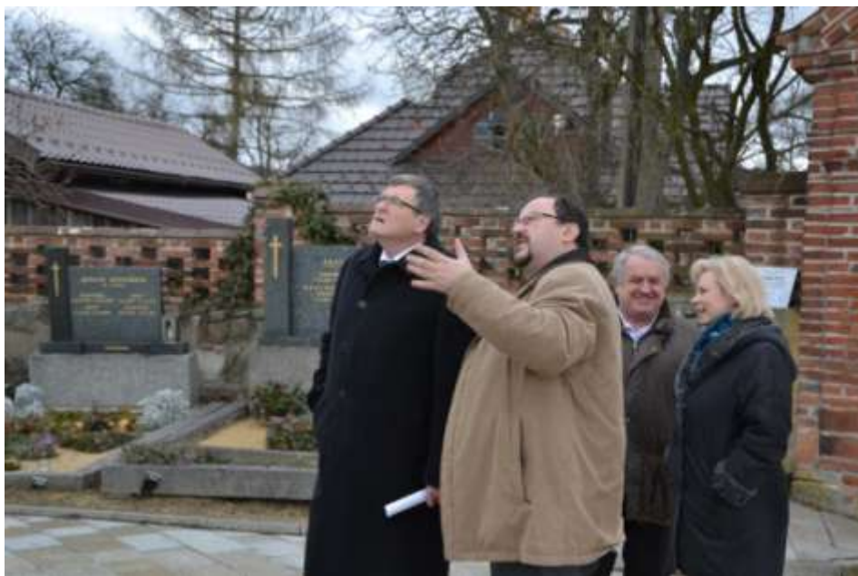
Se starostou, místostarostou a vedoucí sekretariátu hejtmana