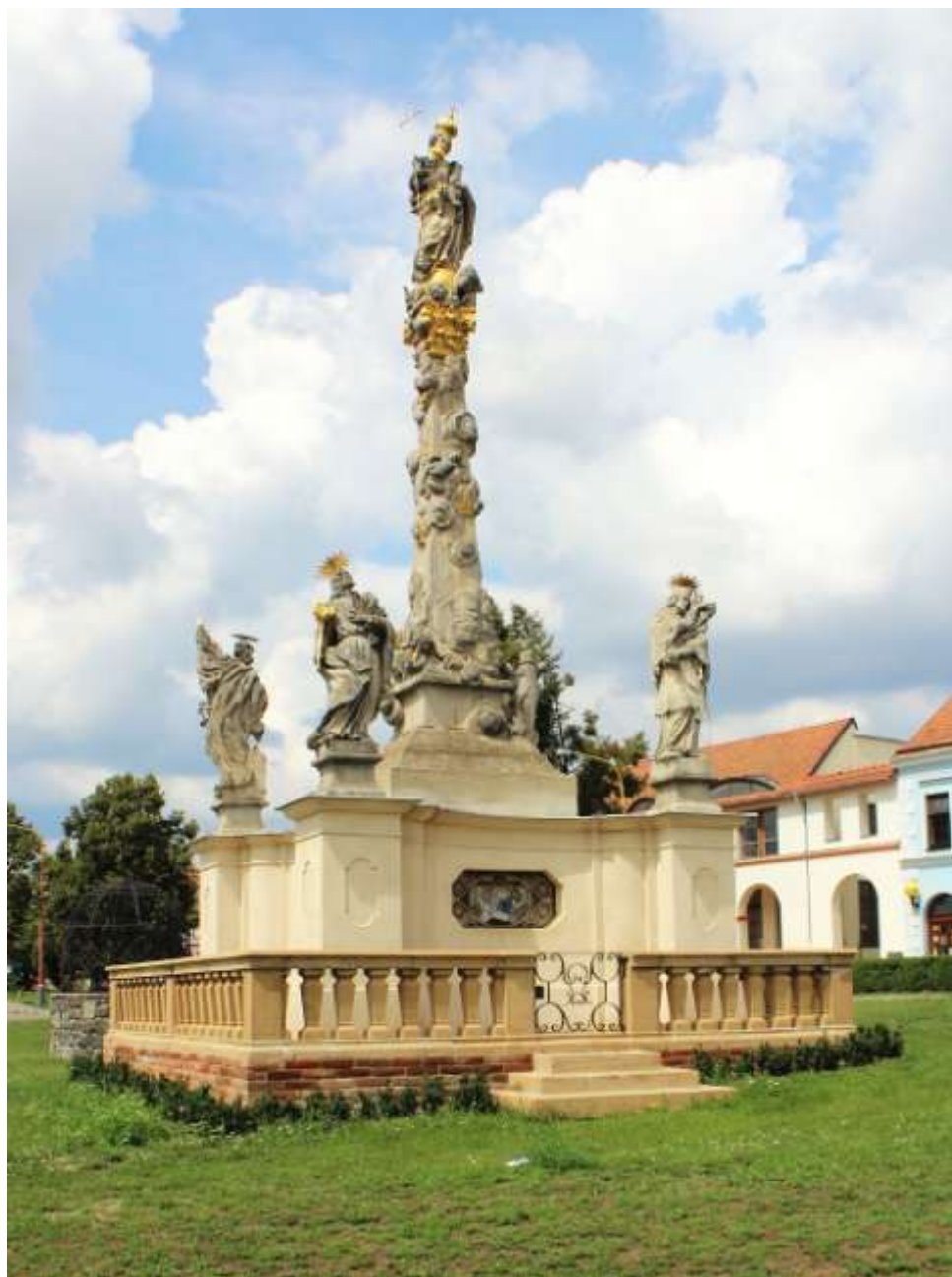
Drnholec – mariánský sloup