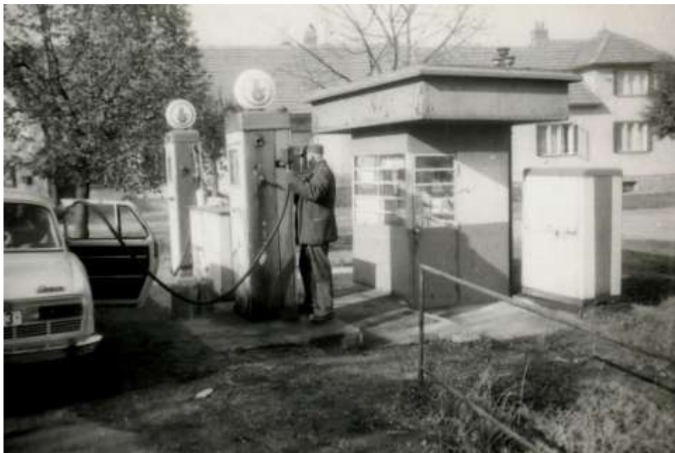
Pan Štromajer u benzínové pumpy před Pavlasovými kolem roku 1970