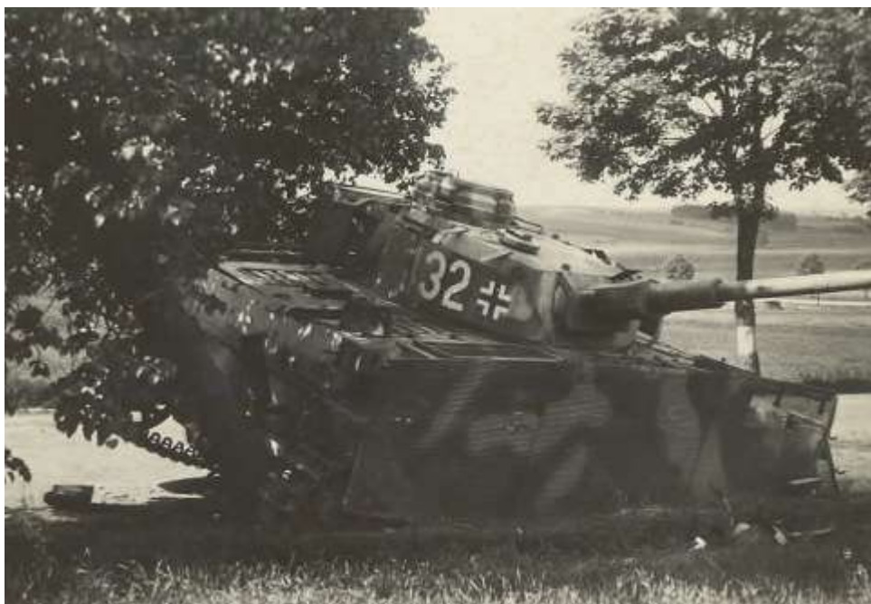
Opuštěný německý tank