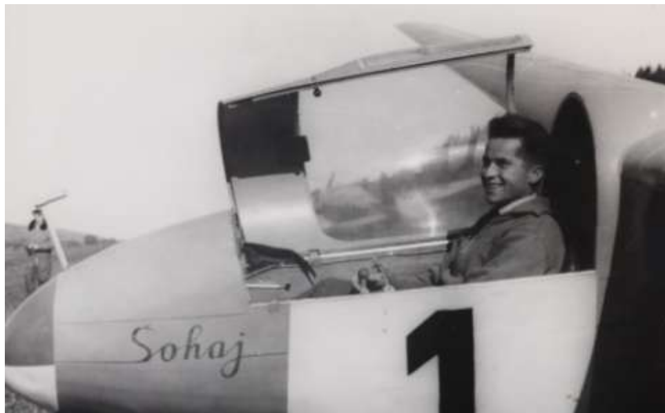
První úspěch – 3. místo na Mistrovství republiky roku 1955 na kluzáku Šohaj

nízký nálet na domy a přilehlé pole u nádraží. Zatažil se mi dech. Moje odhodlání stát se vojenským letcem bylo definitivně rozhodnuto. Ale jak jsem uvedl předtím, vše bylo osudové, jak již to bývá u lidí s projeveným velkým zájmem k výsledkům a poctivé práci, v krvi shromážděné dědictvím a výchovou rodičů. To je ale již jiná kapitola života.