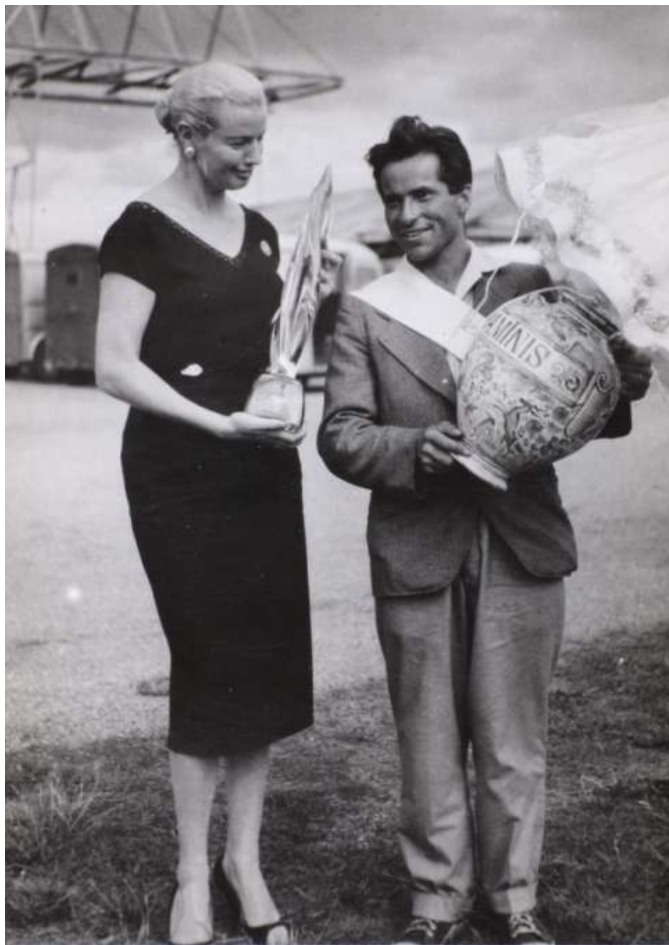
Vítězství ve Francii roku 1957