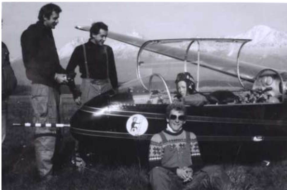
Ve větroni před startem k překonání bájně tisícovky v Austrálii