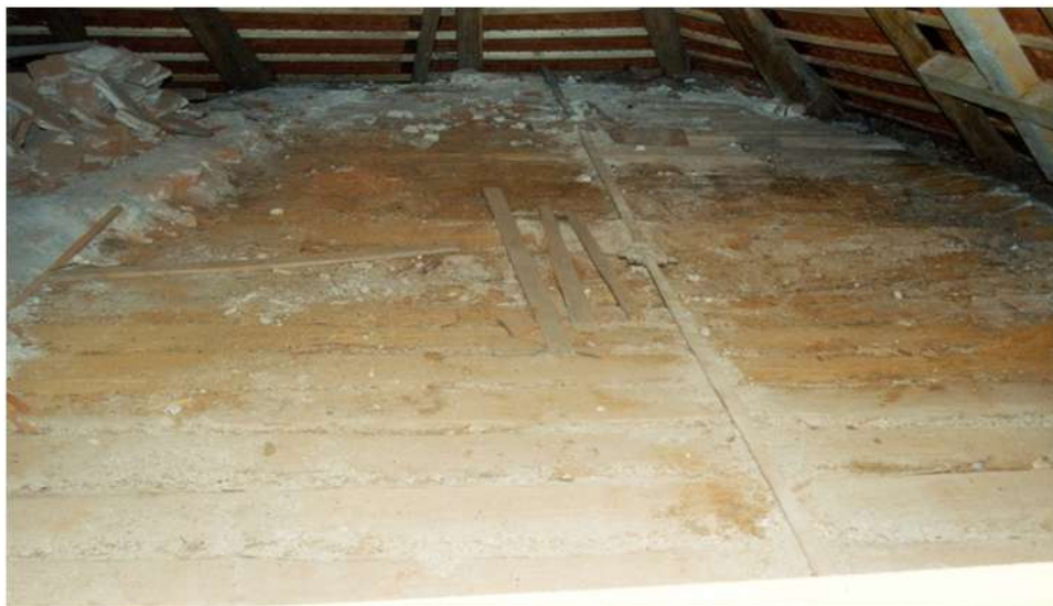
Odhalený povalový strop nad kaplí