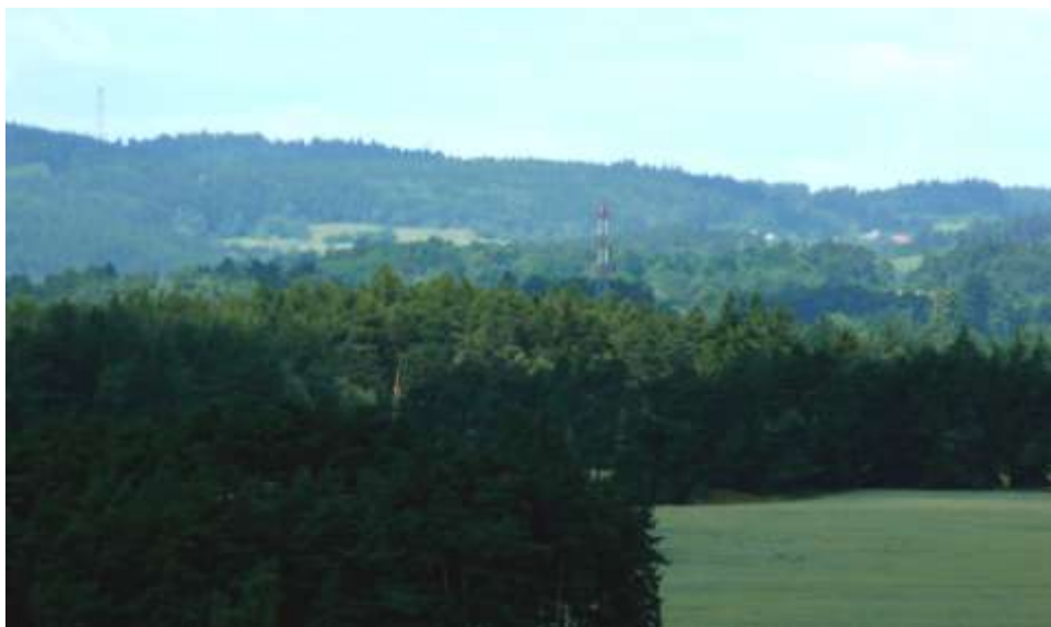
Vpředu vysílač u Březiny, vlevo na obzoru vysílač u Čechtína, vpravo v lesích Věstoňovice