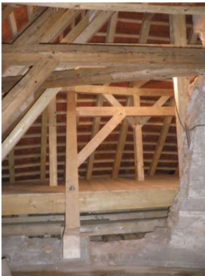
Nový krov a podlaha nad kaplí

Tato akce byla finančně náročná, ale pro městys, z pohledu zachování kulturního dědictví, velmi důležitá. Přesto, že pro občany je tato investice z pohledu běžného života nepodstatná, pro další využití a zachování budoucím generacím je klíčová. Toto velmi kladně hodnotili i pracovníci Národního památkového ústavu v Telči.