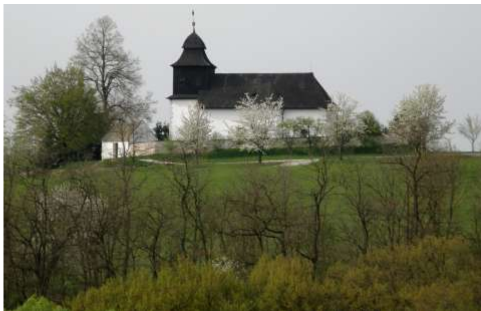
kostel sv. Klimenta v Jasenicí

Při občasně cestě z Tasova do Náměště nad Oslavou neopomeneme se alespoň na chvíli zastavit u půvabného románského kostelíku nad Jasenicí. Ale není to jenom tento kostelík. Kaplička sv. Maří Magdaleny v Číkově se šindelovou střechou, novodobá zvonička v Pucově a kaplička sv. Maří Magdalény v Jasenicí se řadí mezi dominanty a skvosty těchto obcí, které přimějí ne-li k zastavení, tak alespoň k přibrzdění.