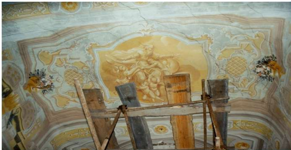
Zámecká kaple – nástrovní malba

V kapli jsou zachovány cenné barokní nástěnné a nástrovní malby z 1. poloviny 18. století.