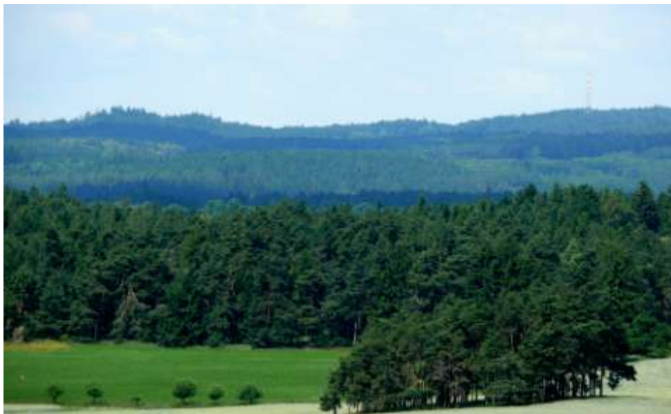
Na obzoru vlevo Hora, vpravo vysílač Vartemberk