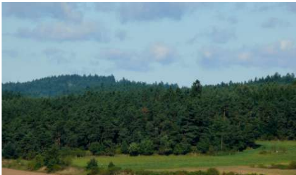
Železniční trať pod Brdci, vlevo na obzoru Babí hora