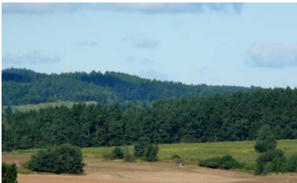
Vpředu železniční trať do Rudíkova, vpravo na obzoru vysílač Rudíkov