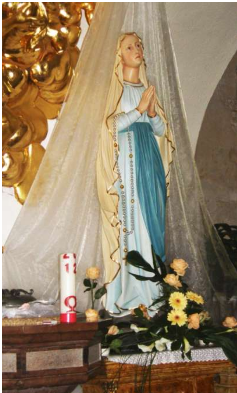
P. Marie Lúrdská v Budišově