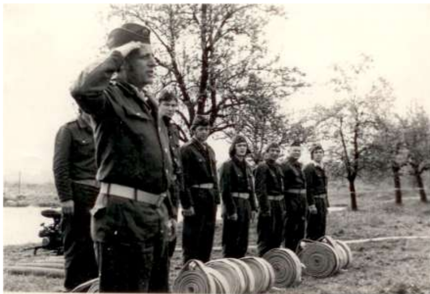
Hasičské cvičení Hodov 1977