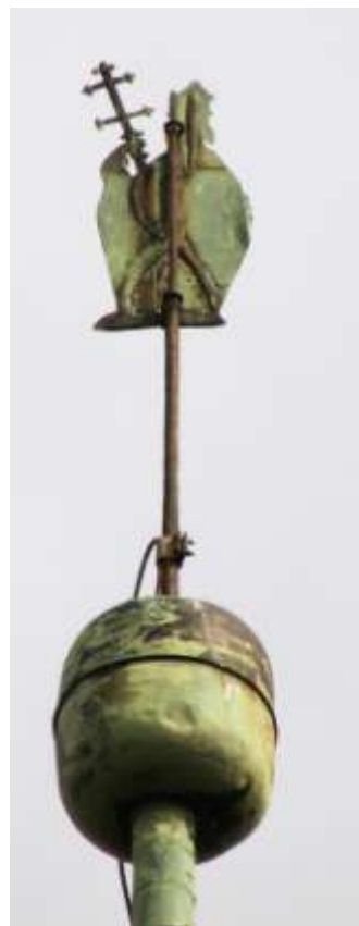
korouhev na kostele sv. Klimenta