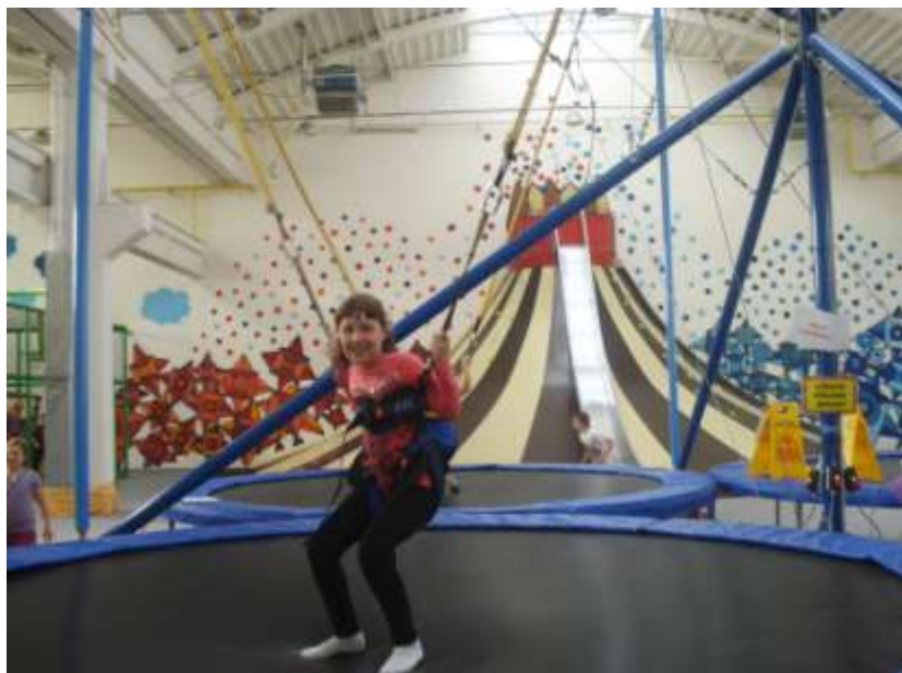
Výlet do Bonga