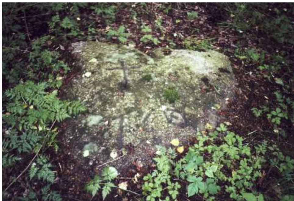
Kámen zrození, Hodov – trať Vítoslav

Lze si myslet, že tento starožitný obraz znázorňuje skutečnou událost, která se zde opravdu stala, ale pro nedostatek písemných zpráv není možné s určitostí říci, o jaké osobnosti se jedná. A tak se musíme spokojit se skromnou domněnkou, že je tu snad zobrazeno narození knížete Vladislava (zemřel mladý r. 1115), syna Oldřicha Brněnského, zakladatele kláštera třebičského. Kníže Oldřich se svou chotí jistě často zajížděl do Třebíče, aby se přesvědčil o postupu stavby klášterské a na jedné takové vyjíždě se to překvapení mohlo stát.