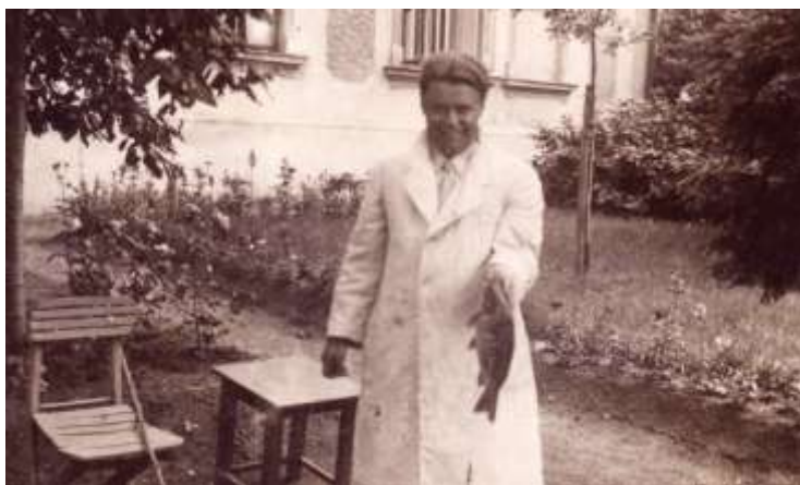
úlovek na zahradě v bazénu