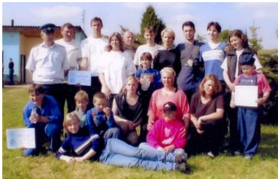
Mladí hasiči – 90. léta