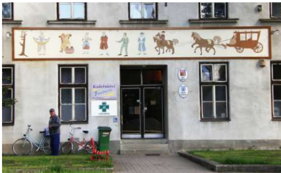
Kopie původní fresky na radnici