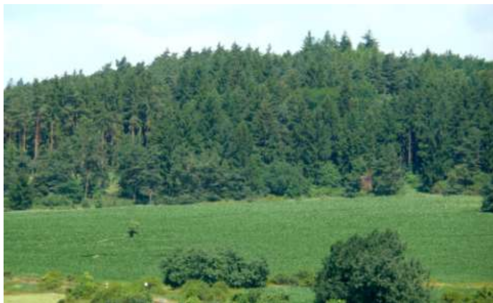
Nejvyšší vrchol Brdců