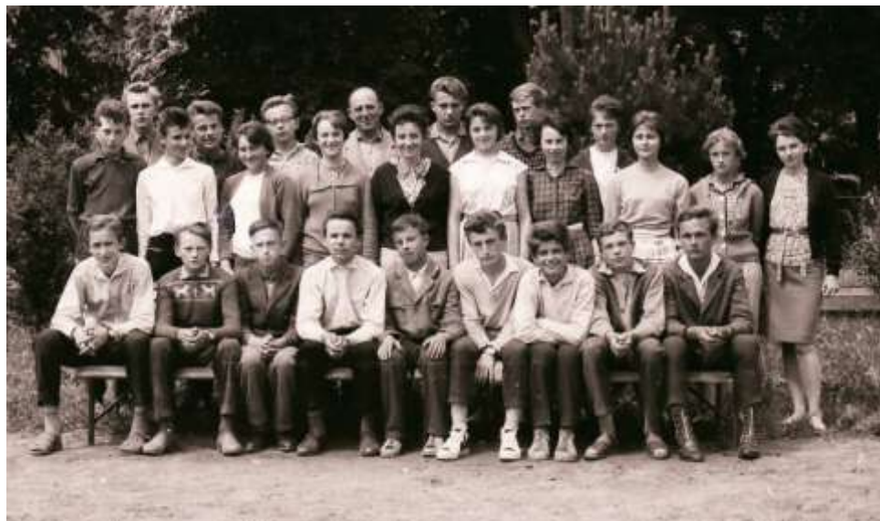
Třída: 9. A, ročník 1948