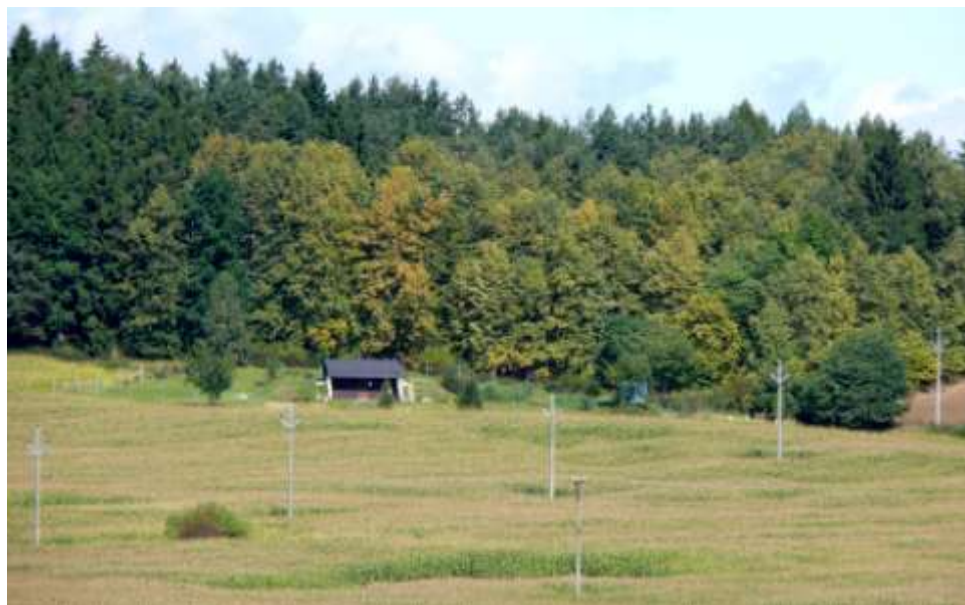
Vodojem pod Brdci