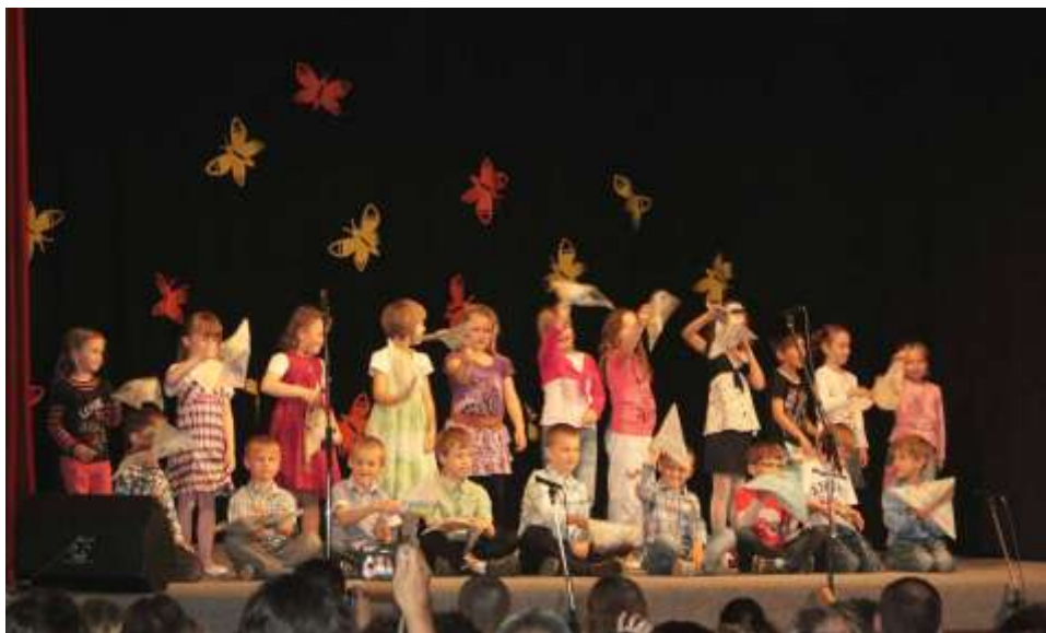
Besídka ke Dni matek