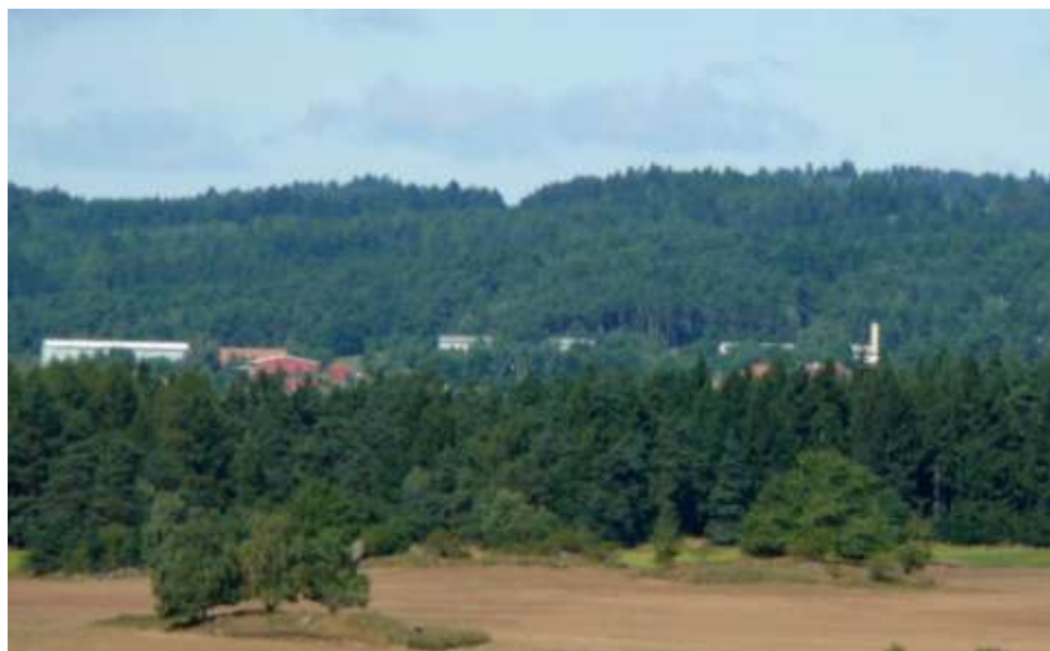
Zemědělské družstvo Rudíkov