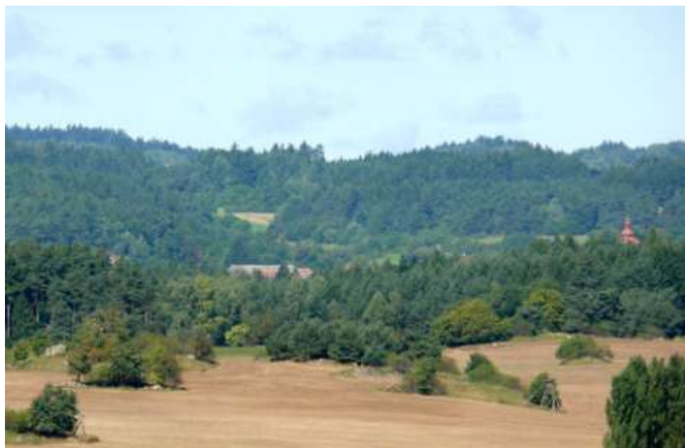
Rudíkov s kostelem, na obzoru kopce u Hroznačina