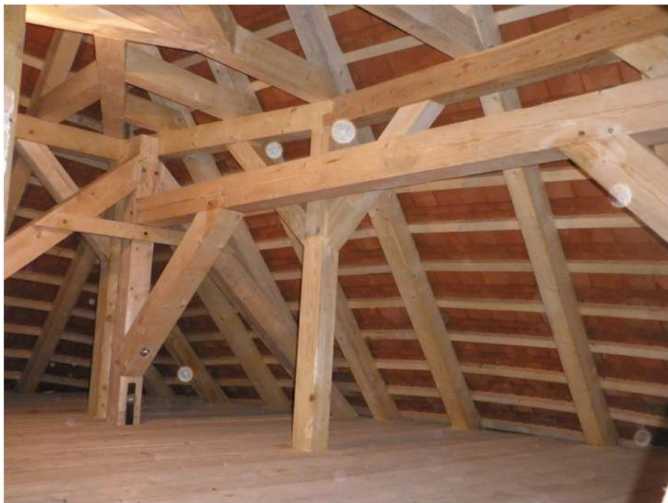
Nový krov a podlaha nad kaplí

Koncem roku 2011 byla v rámci předprojektové přípravy provedena restaurátorská fixace maleb stropu a fabionů dvojnásobným přelepem, celý strop montážně podepřen a hlavní oltář obedněn, aby nedošlo k jeho poškození. Strop kaple byl připraven k provedení konservace a technického zajištění. Pokud by nebyly práce urychleně provedeny, hrozilo by šíření biotických zdrojů poškození do původních, ale i nových, opravených konstrukcí krovu. Za daných okolností by pokračovala i devastace povalového stropu v návaznosti na devastaci výzdoby stropu zámecké kaple, a tedy nenávratné ztráty značných kulturních hodnot.