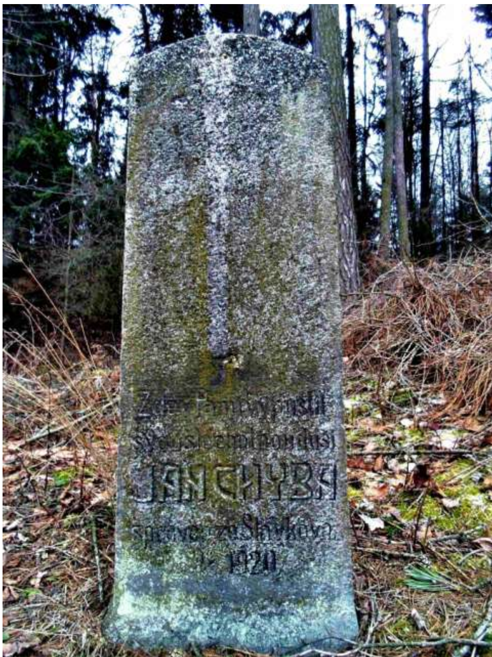
Žulový pomníček na Brdcích