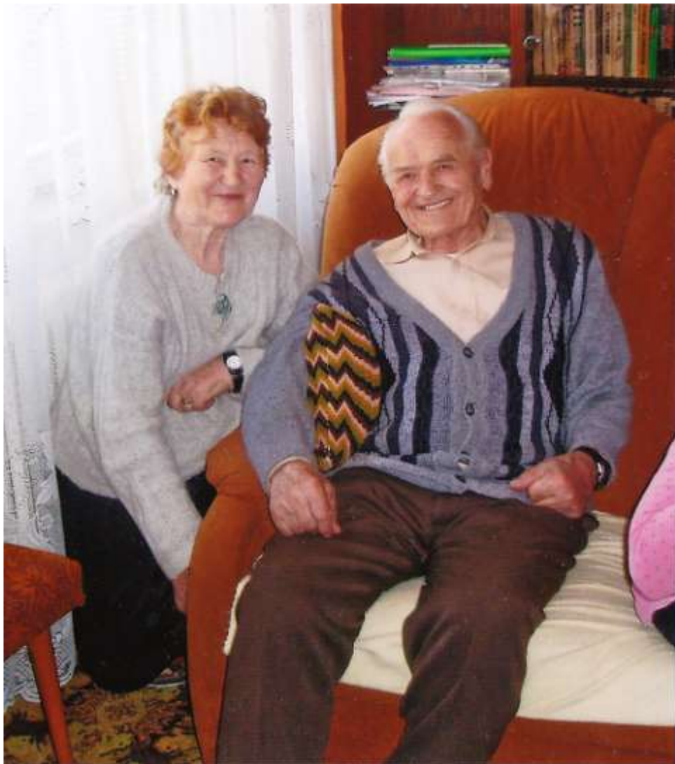
Jedna z posledních společných fotografií 25. 3. 2012