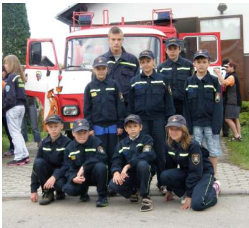
Družstvo mladých hasičů