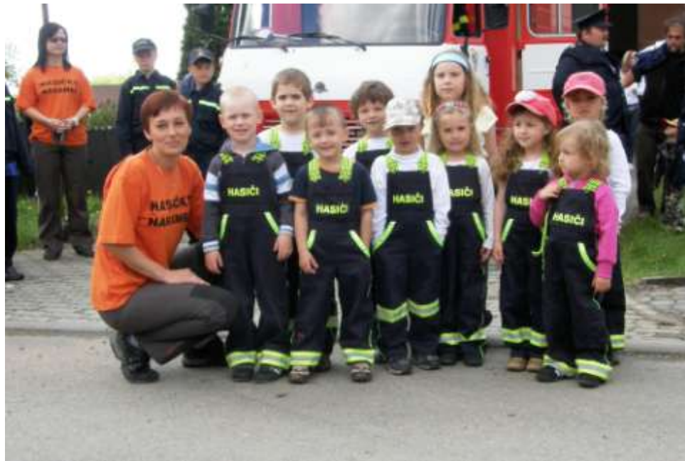
Děti z mateřské školy

Od roku 2005 se sbor zaměřil na nejmladší generaci. Kromě dvou družstev mladých hasičů se na okresních soutěžích pravidelně objevují děti z Mateřské školy v Nárámči, které pod vedením ředitelky Lenky Šmidové sklízí zasloužený obdiv diváků.