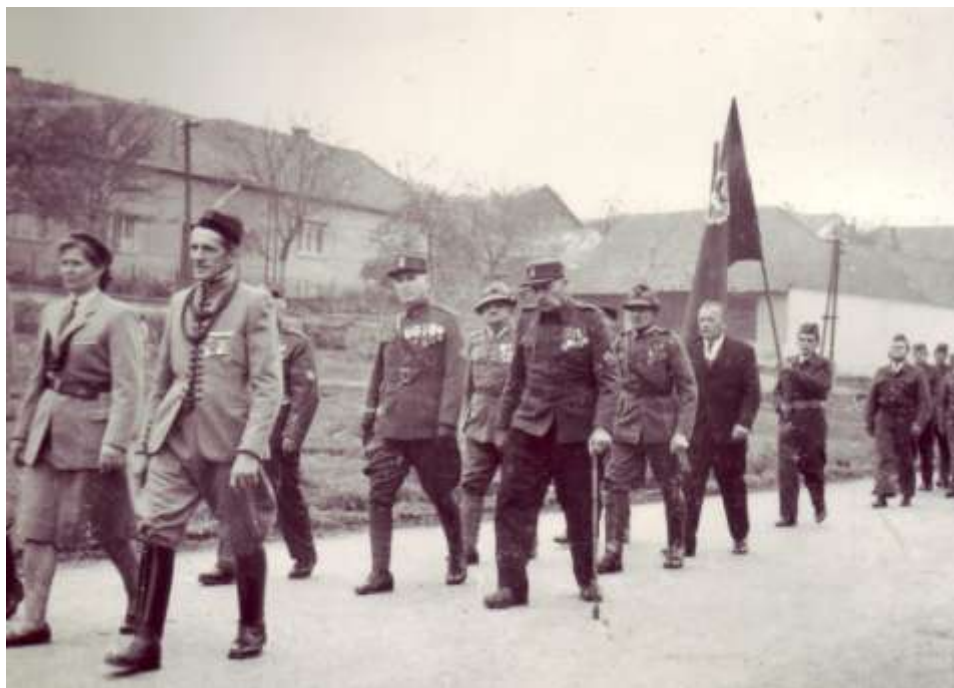
Legionáři ve slavnostním průvodu v Pyšelu