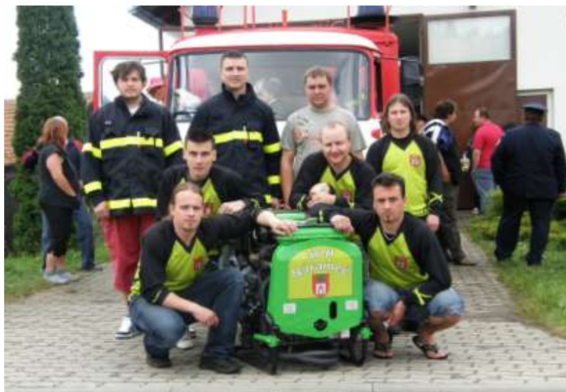
Sportovní mužstvo mužů