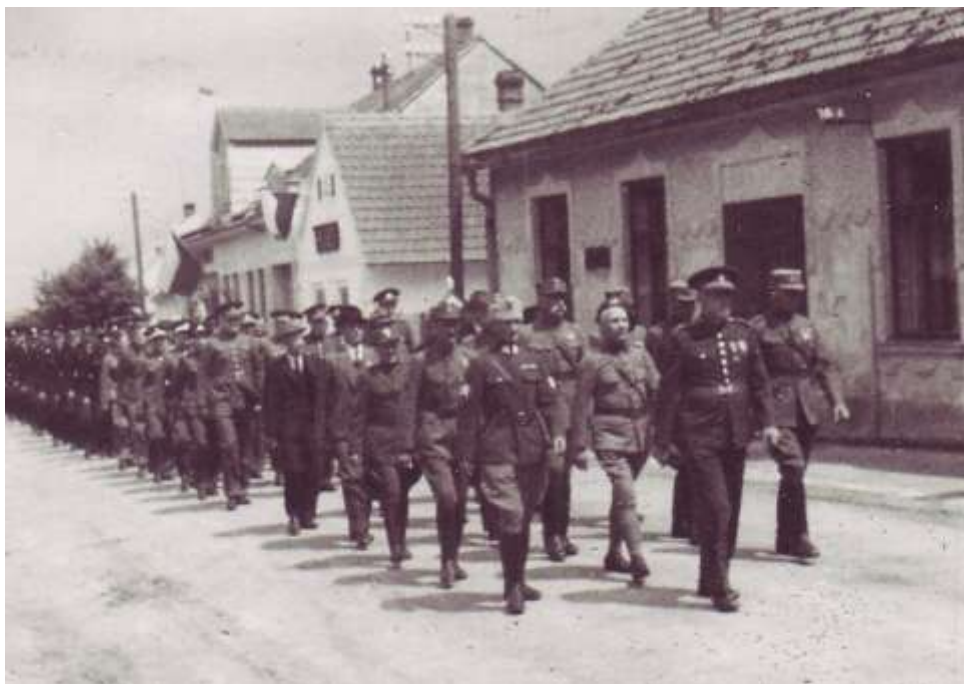
Legionáři při slavnostním pochodu v Budišově