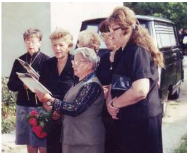
Fotografie z roku 1995