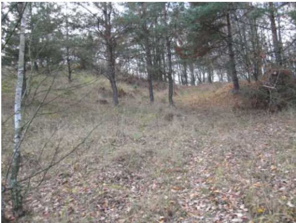
Hrádek u Kramolína

V publikaci Vlastivěda moravská náměšťského okresu v kapitole o obci Kramolín si můžeme na str. 228 přečíst následující: Proti Slavětickému mlýnu nad „Francouzským žlebem“, na strmé stráni nad řekou Jihlavou, stávala tvrz malých rozměrů, kde se říká Na Hrádku. Nyní zde v lese najdeme kus příkopu a kulatou prohlubeň, což prý bývala studna asi 90 sáhů hluboká.