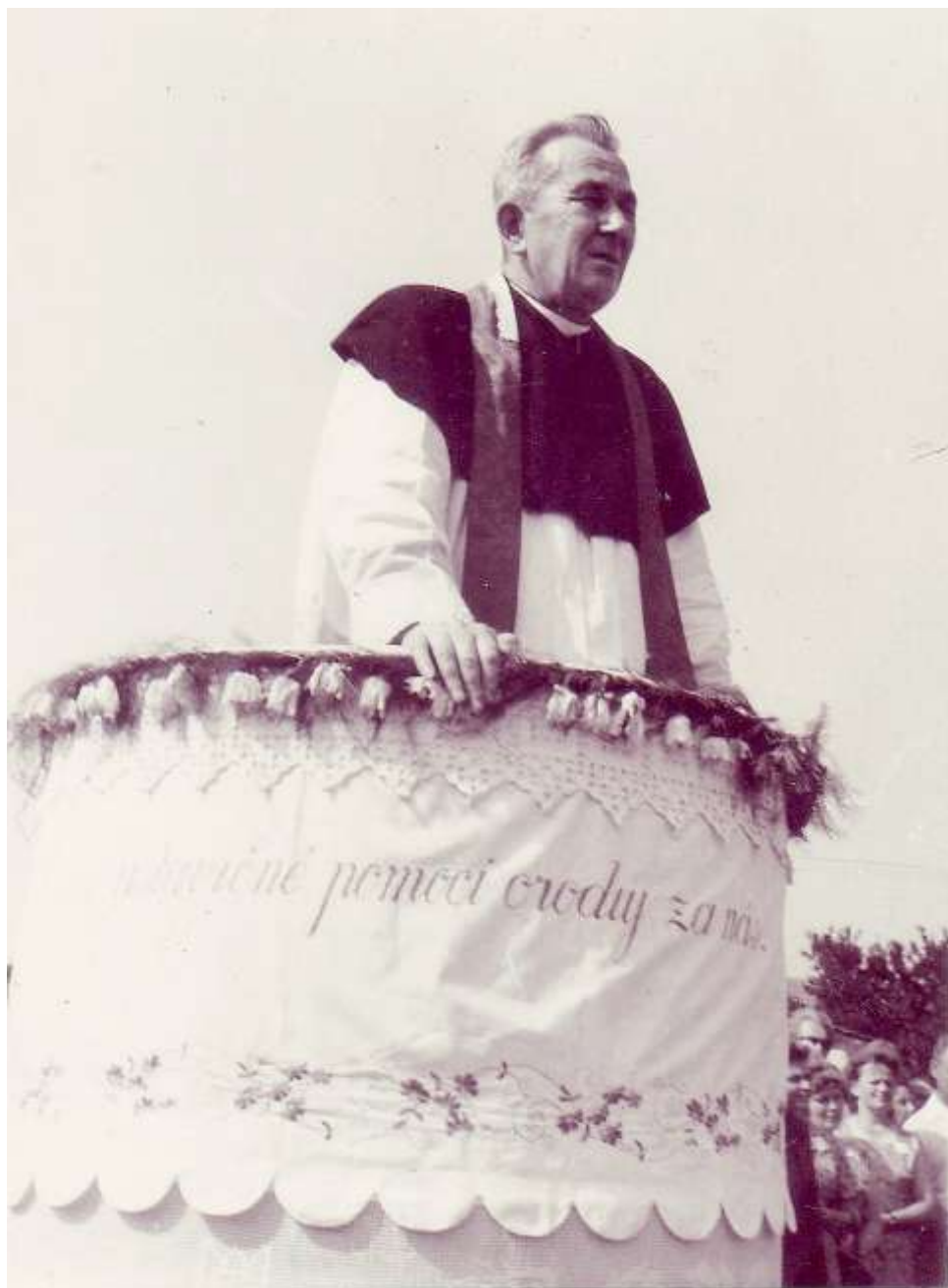
Svěcení křížů v Kojatině v r. 1969