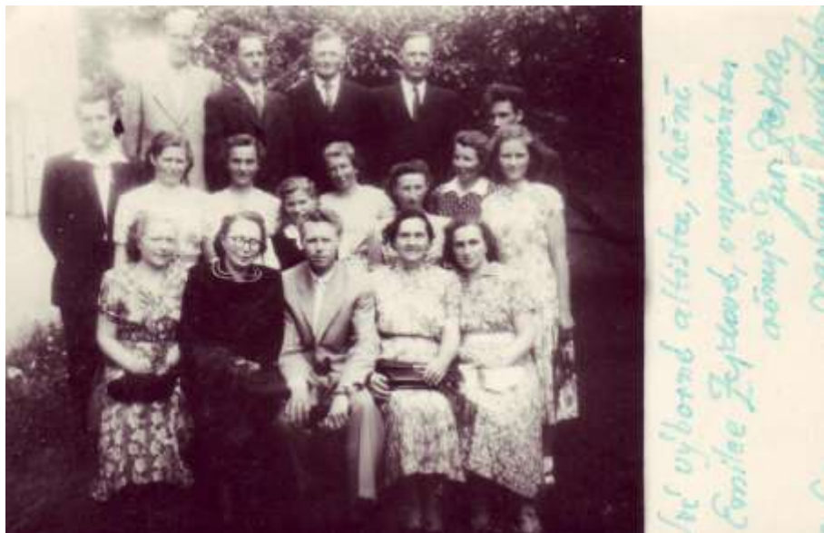
Na fotografii z roku 1954