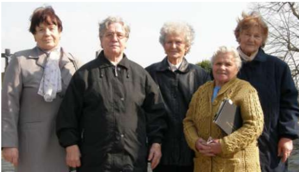
Fotografie z roku 2009