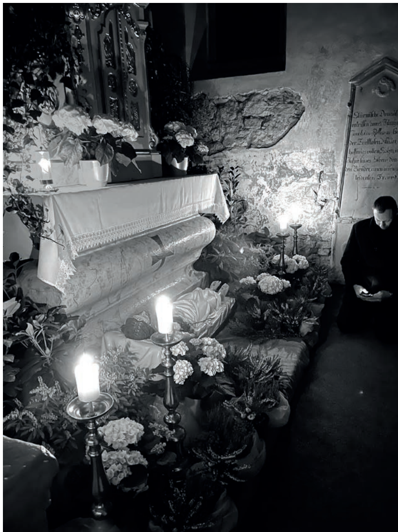
Celonoční adorace u Božího hrobu. Jsme tu Pane s Tebou a čekáme na Tvoje oslavení! Adorace, březen 2024

Pláč 3,26: „Dobré je v tichosti čekat na Hospodinovu spásu.“