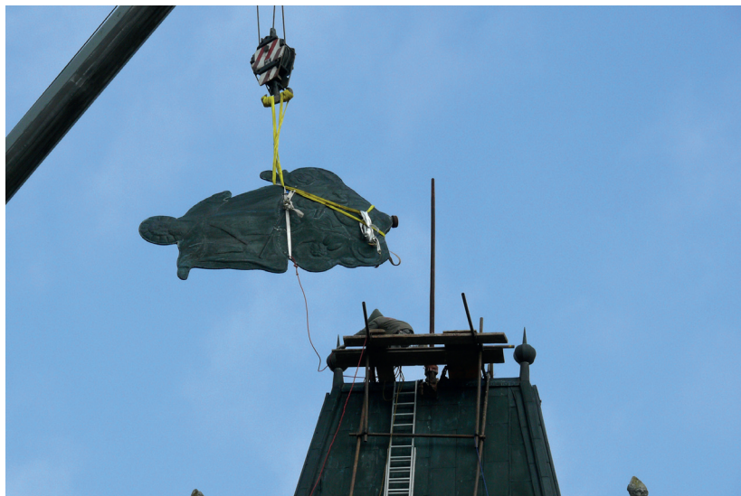
Snášení korouhve, rok 2008