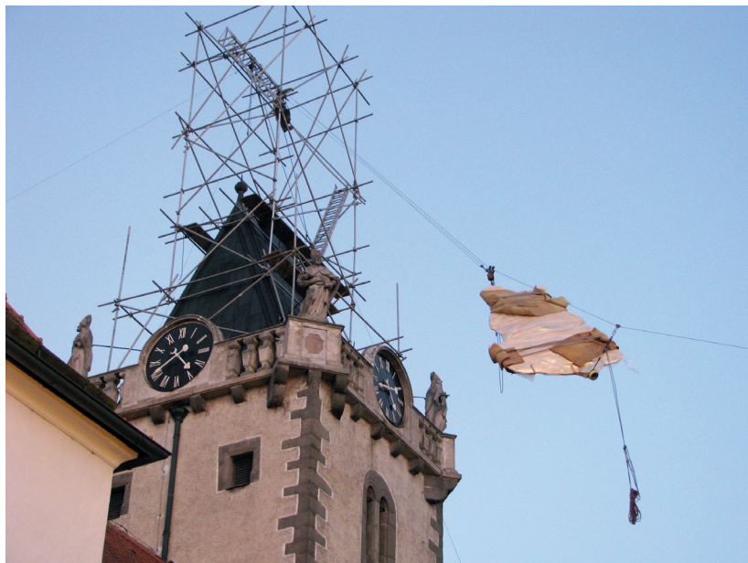
Výtažení pozlacené korouhve, 31. 5. 2011