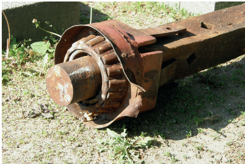
Zrezivělé ložisko korouhve, rok 2008

Dne 23. února firma Tesařství Břetislav Kocián z Kojatic započala přípravné práce směřující k sundání korouhve na zem. Plošina z trubek a prknem kolem korouhve měla sloužit k přípravě na sundání jeřábem s dlouhým ramenem.