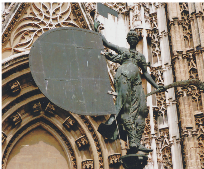
Detail věže Giralda v Seville