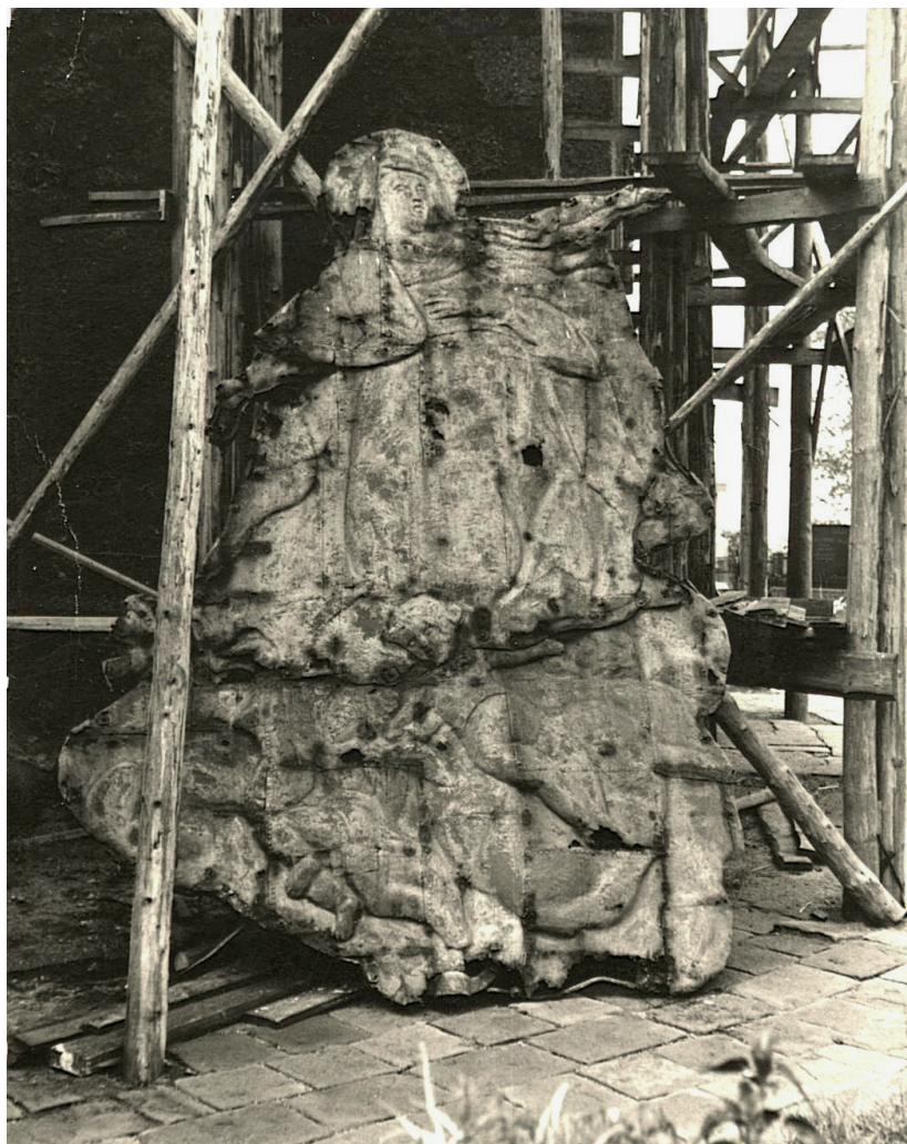
Stav korouhve, rok 1981