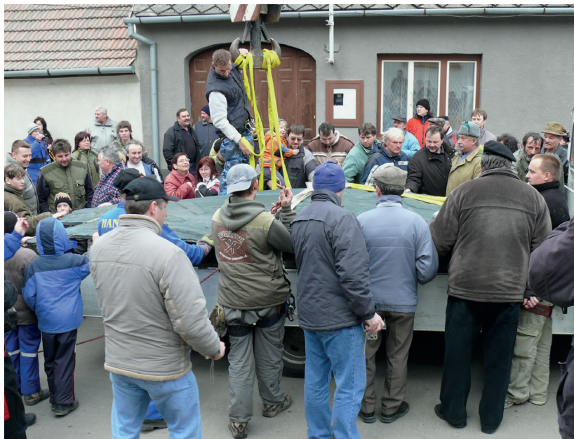
Na zemi, rok 2008

Firma Břetislava Kociána mezi tím začala opravovat částečně narušenou vazbu a připravovat ukotvení korouhve uvnitř věže. Firma Petra Chmela z Třebíče začala od balustrády nad vrchol věže stavět trubkové lešení, které mělo sloužit k ukotvení lana od vrátku, pomocí něhož měla být korouhev po opravě vytažena na vrchol věže. Nejprve však byla touto cestou vytažena nová kovová žerď.