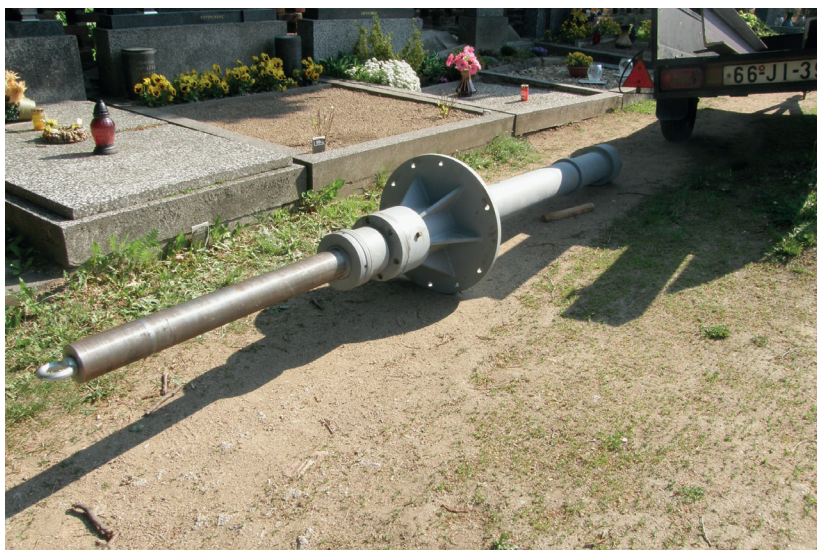
Nová kovová žerd' korouhve, rok 2011