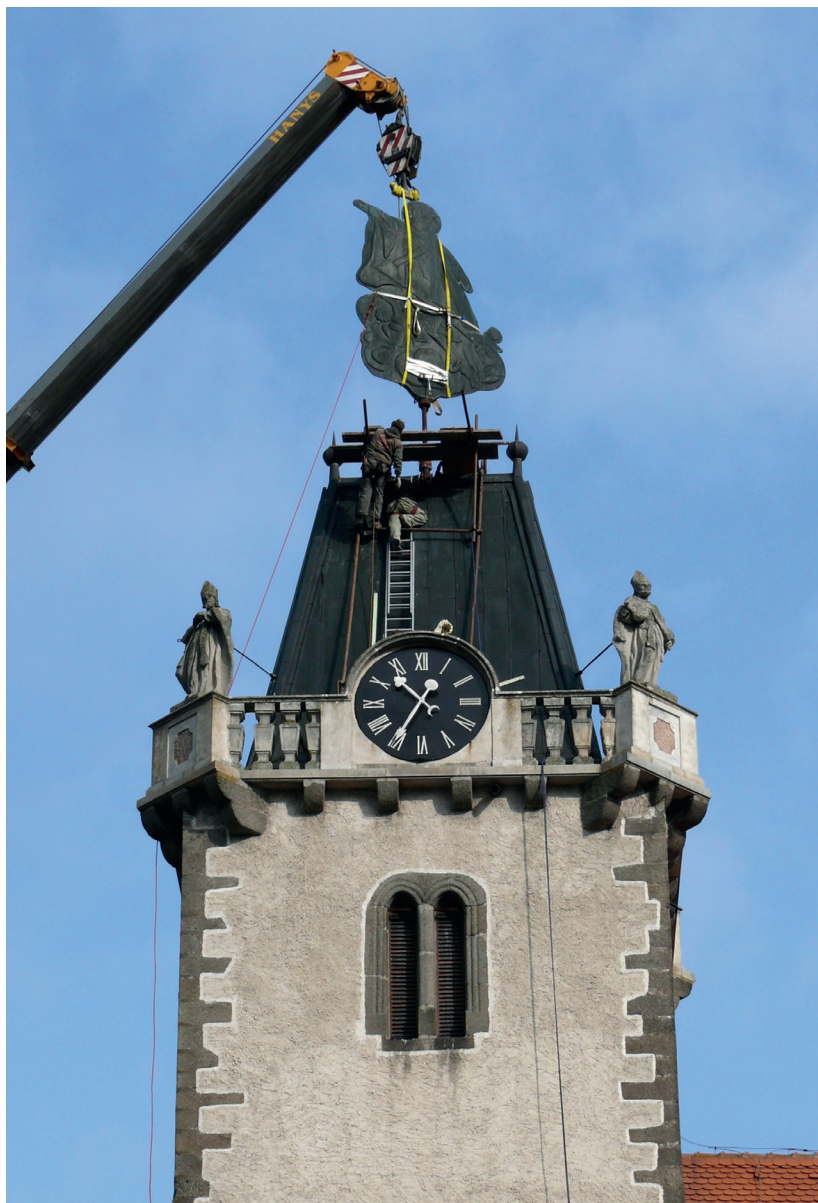
Sundávání korouhve pomocí jeřábu, rok 2008