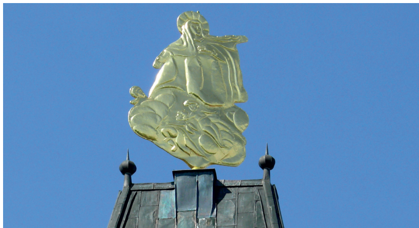
Nanebevzetí P. Marie