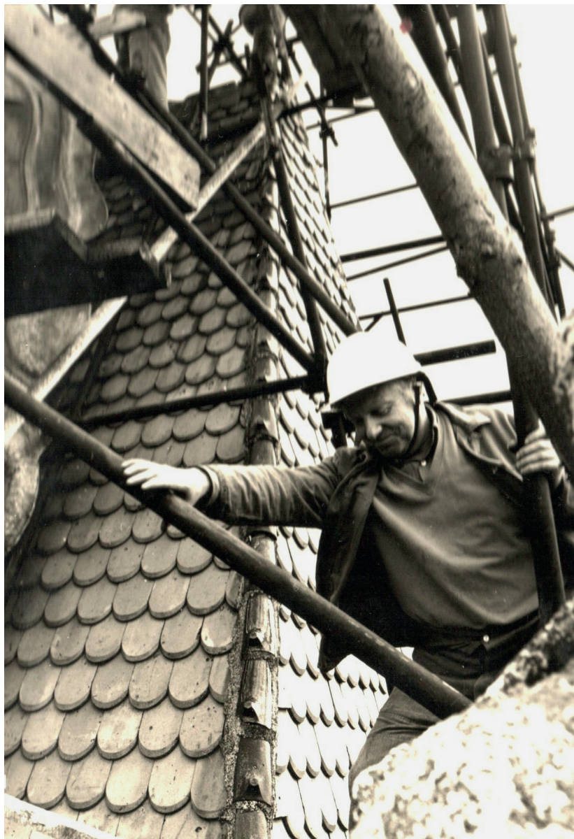
Snesení korouhve, rok 1981