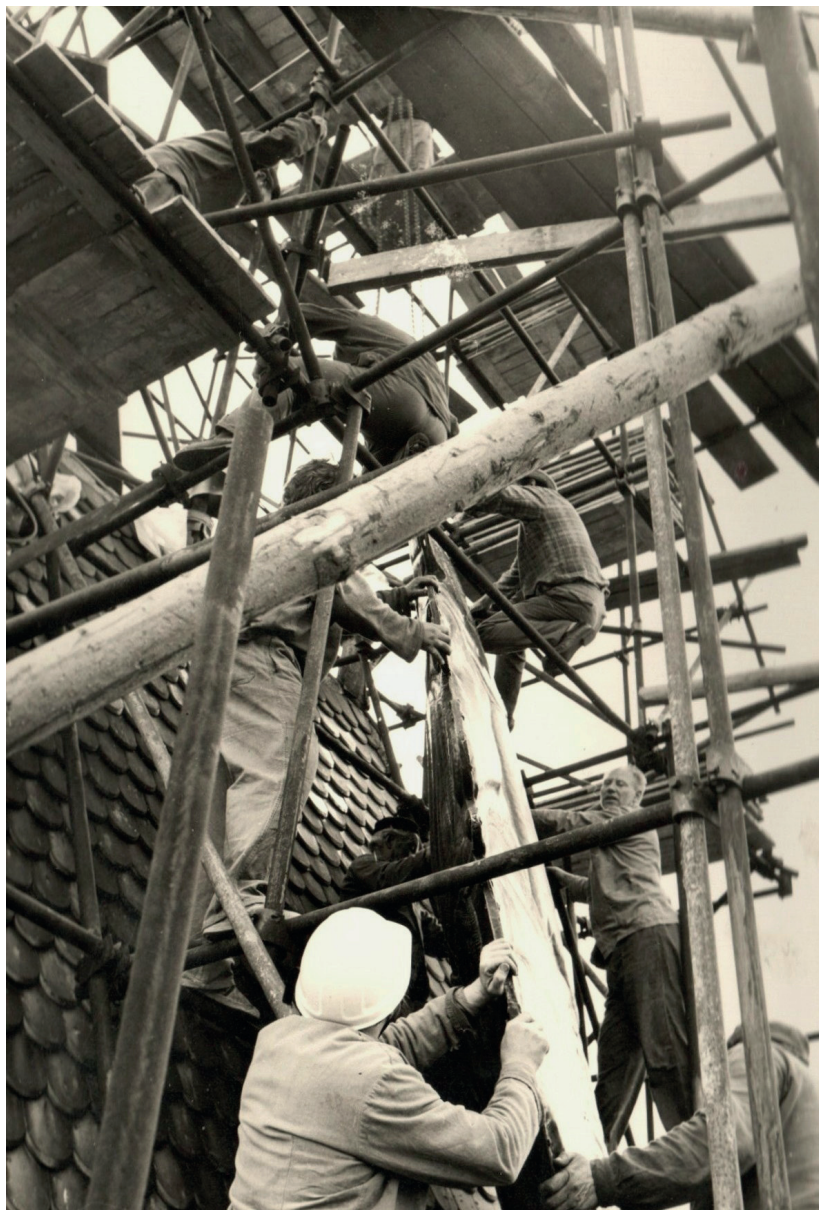
Sundávání korouhve, rok 1981