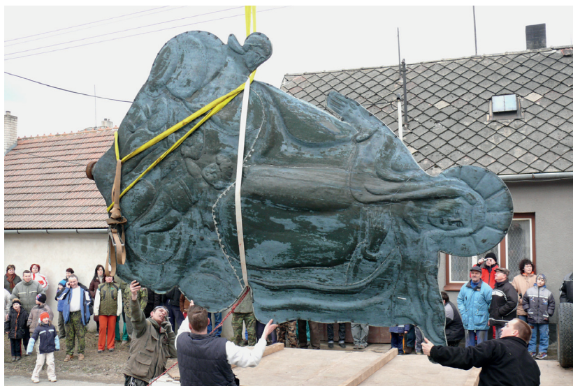
Na zemi, rok 2008