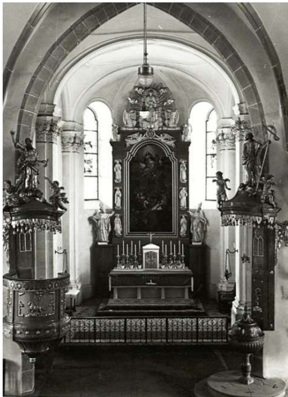
Interiér kostela Nanebevzetí P. Marie v Ivančicích rok 1958