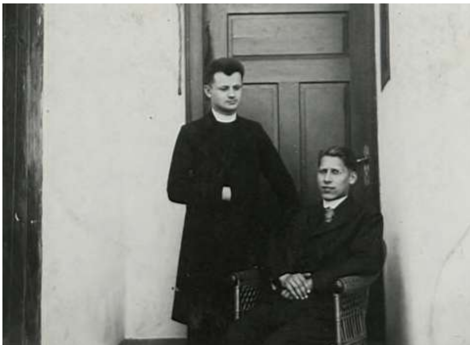
Kolem roku 1939